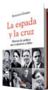
La espada y la cruz Francesco Comina San Pablo, 2025 206 páginas, 15 €

de disentería antes de llegar a Dachau. Él es uno de los protagonistas de este libro que recoge historias de católicos que no se doblegaron al nazismo, algunas de ellas bastante desconocidas para el gran público. ●