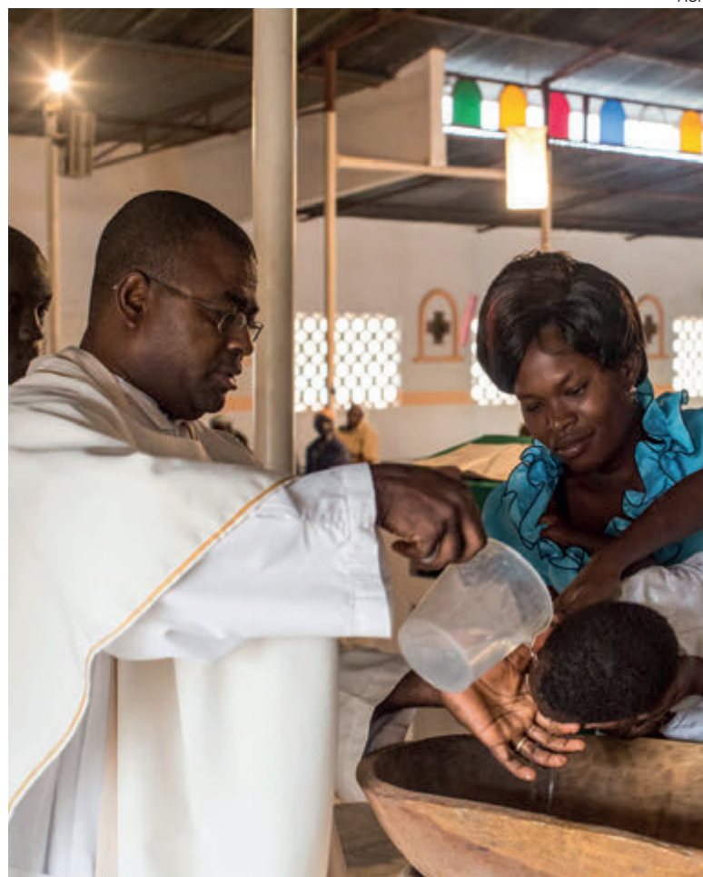
↑ Un sacerdote nigeriano celebra un bautizo en el norte del país.

Los obispos han elaborado un informe para evitar «informaciones distorsionadas»