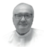
GRAZIANO BORGONOVO Subsecretario del Dicasterio para la Evangelización

Más de 33 millones de peregrinos han cruzado la Puerta Santa de San Pedro. Desde mi ventana he recibido este fuerte testimonio: tras la cruz, el pueblo expresaba con alegría su fe