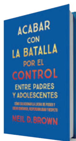
Acabar con la batalla por el control entre padres y adolescentes Neil D. Brown Alba, 2025 240 páginas, 22,50 €