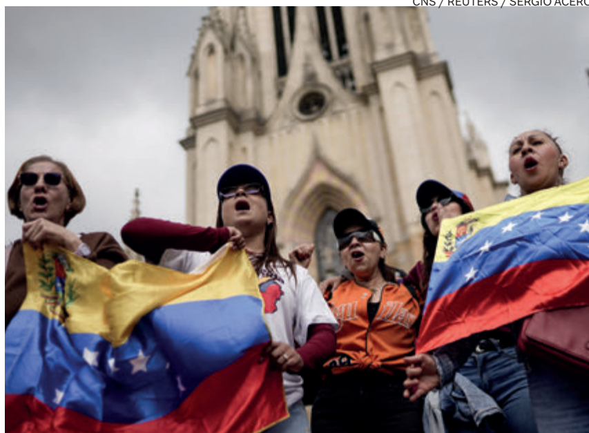
↑ Manifestación por una transición democrática en Bogotá (Colombia) el día 4.

pidiendo a Dios «serenidad, sabiduría y fortaleza» y reclamando que «las decisiones que se tomen se hagan siempre por el bien de nuestro pueblo». Acordaron no pronunciarse oficialmente hasta reunirse virtualmente el 7 de enero, «una vez se pueda tener un panorama más claro».