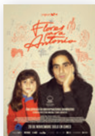
Flores para Antonio Dirección: Isaki Lacuesta País: España Año: 2025 Género: Documental Público: +12 años

Flores para Antonio se adentra en la figura de Antonio Flores huyendo del biopic convencional. El documental, impulsado por su hija Alba Flores y dirigido por Isaki Lacuesta, evita el trazo grandilocuente para apoyarse en la memoria íntima y familiar. A través de