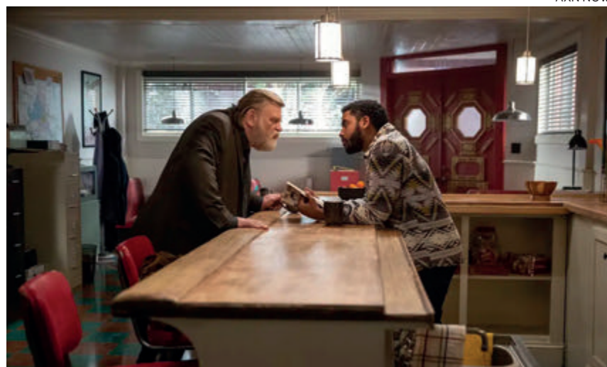
↑ Brendan Gleeson (izquierda) interpreta al policía jubilado Bill Hodges.

Mr. Mercedes , disponible en Netflix, comienza cuando todo debería haber terminado: con una jubilación. Bill Hodges, policía retirado encarnado por Brendan Gleeson, ha sido apartado del mundo útil y sobrevive en una rutina mínima, casi a la defensiva. Con un cuerpo cansado y una mirada que no busca futuro, este personaje nos ofrece algo reconocible: el desconcierto de quien ha cumplido y, aun así, no