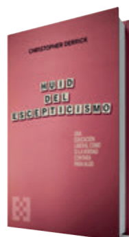
Huid del escepticismo Christopher Derrick Encuentro, 2025 146 páginas, 16,50 €