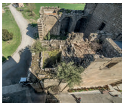
➔ Muro renacentista colapsado.

vidades del año litúrgico: Navidad, Epifanía, varias escenas de la Pasión, Pascua, la Ascensión, Pentecostés y la Asunción», detalla Poch. Su autor es el portugués Pedro Nuñez, aunque fue «pintado en Cataluña». El benedictino de Montserrat señala además que «este es un retablo muy visual y pedagógico porque las pinturas son muy fáciles de reconocer».