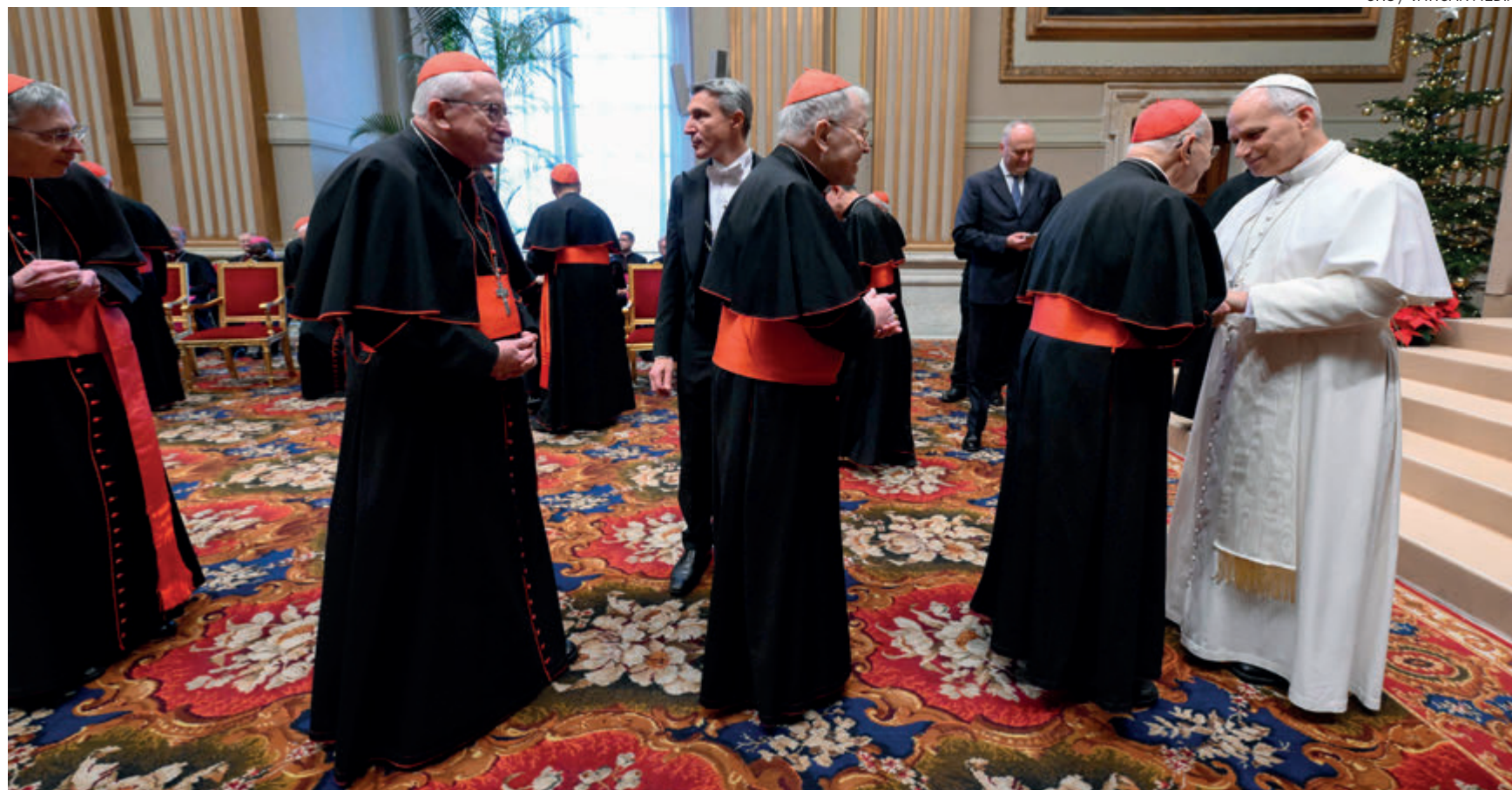
↑ El Pontífice con algunos cardenales de la Curia durante su tradicional encuentro prenavideño, el 22 de diciembre.

18 de noviembre: la actual basílica de San Pedro cumple 400 años.