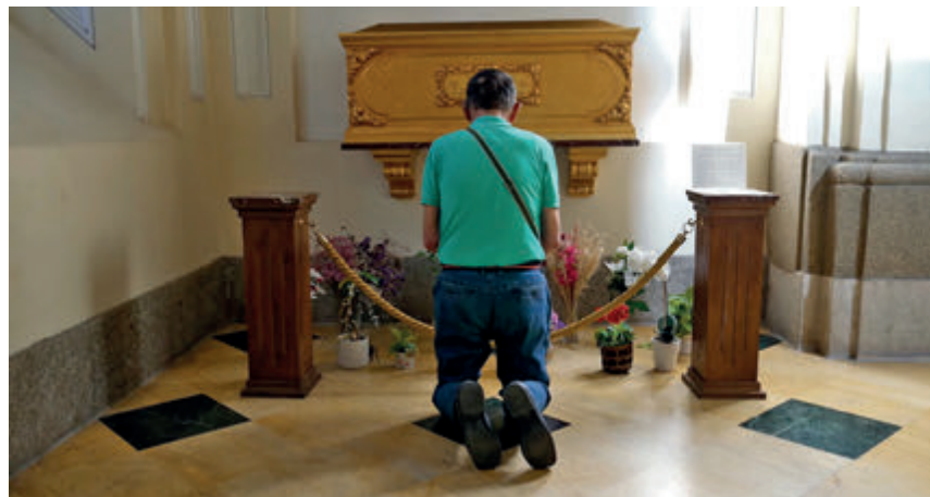
↑ Un devoto reza ante la tumba de Alexia en San Martín de Tours, en Madrid.