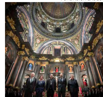
↑ Nueva iluminación de San Andrés.