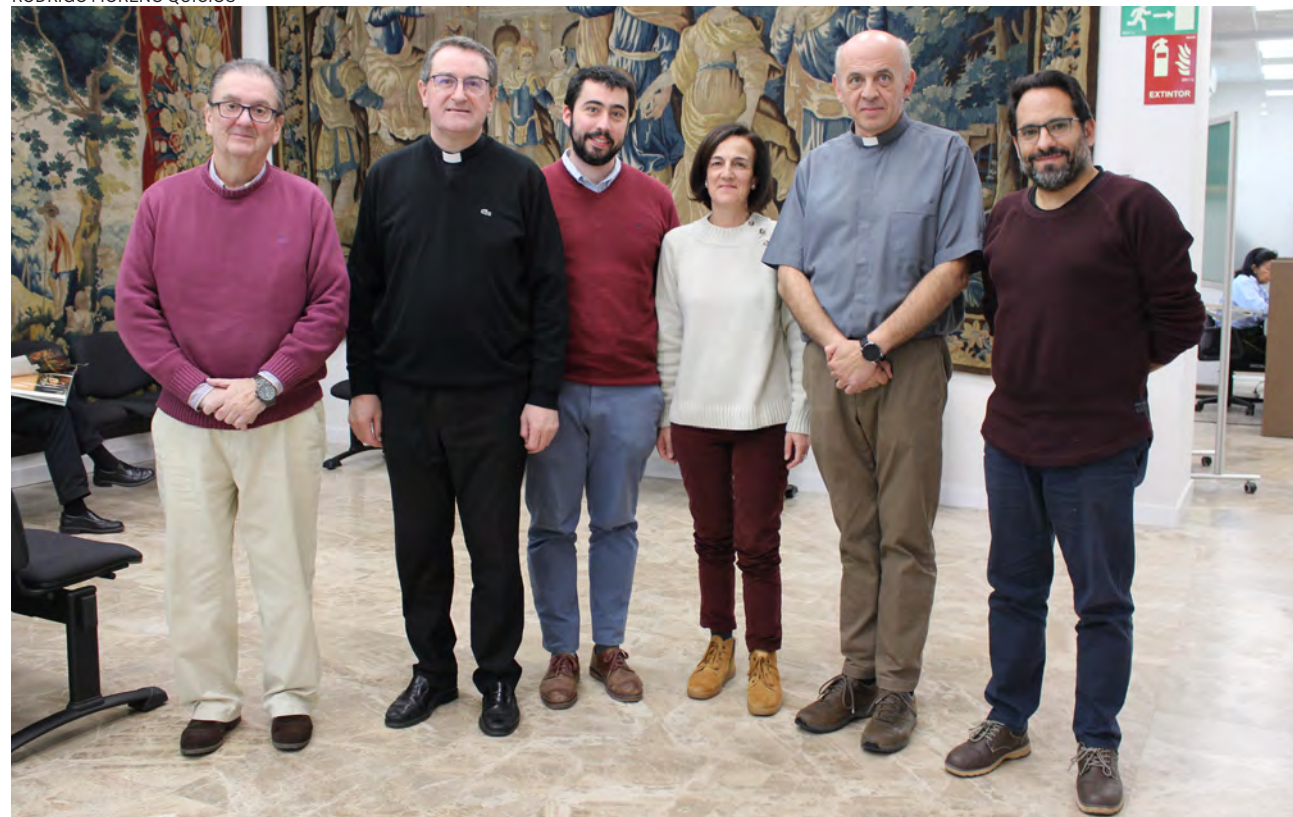
↑ Laicos y sacerdotes trabajan juntos en el Tribunal Eclesiástico de Madrid. Son 42 en total.

La Vicaría Judicial de la archidiócesis de Madrid pone en marcha protocolos junto a la Delegación de Laicos, Familia y Vida para sostener a los que solicitan este trámite Págs. 6-7