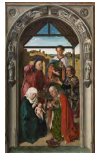
→ Triptico con escenas de la vida de la Virgen (detalle). Dirk Bouts.