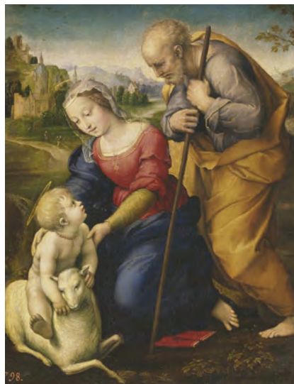
↑ Sagrada Familia del cordero. Rafael.

En la pintura de la Edad Media, su figura pasó a un segundo plano. A veces