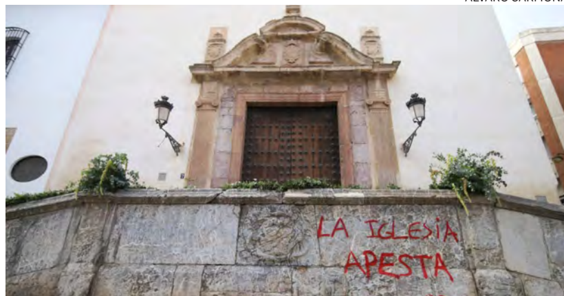
↑ Pintada ofensiva en una iglesia de Córdoba.