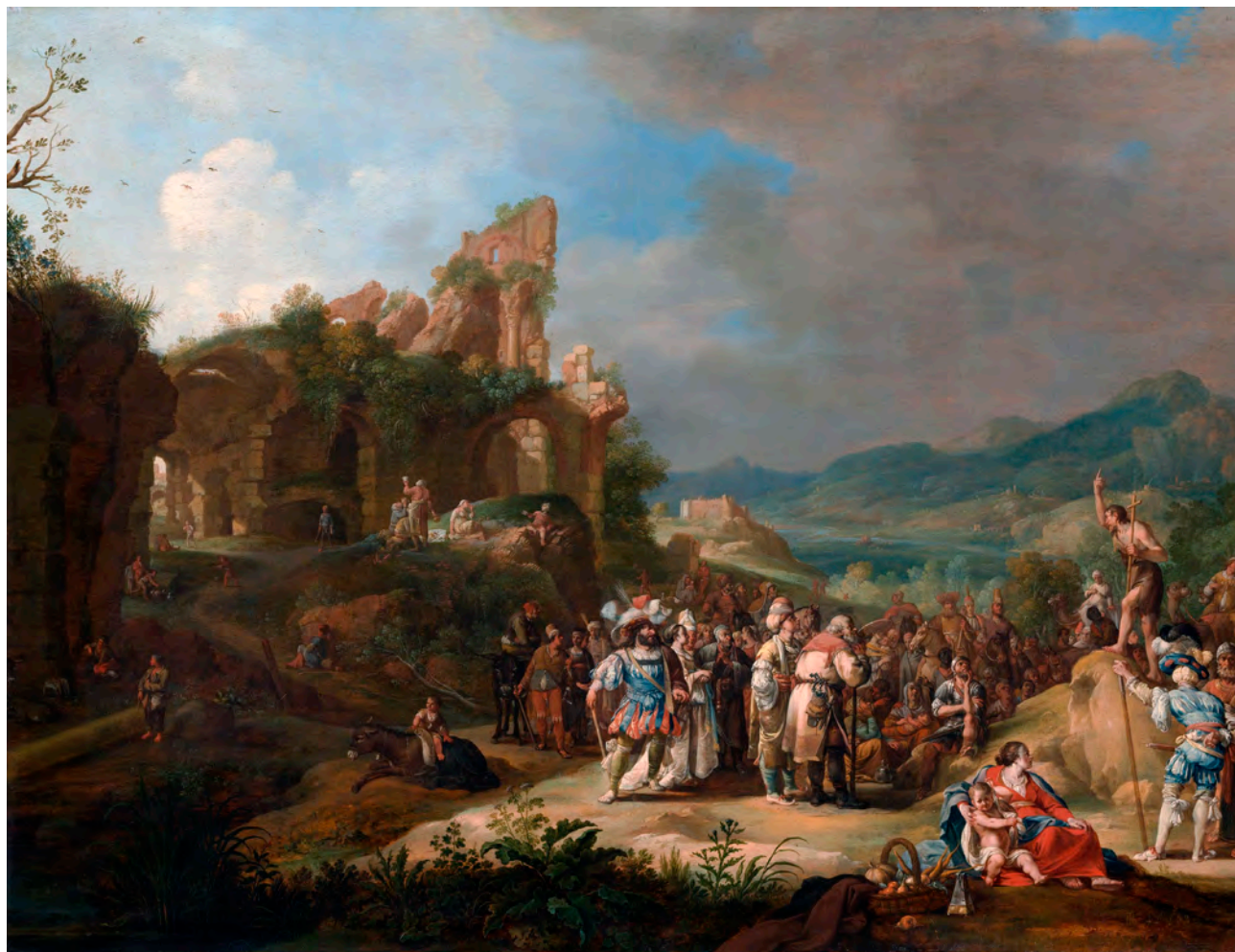
◀ Predicación de san Juan Bautista.

Como el pueblo estaba expectante, y todos se preguntaban en su interior sobre Juan si no sería el Mesías, Juan les respondió dirigiéndose a todos: «Yo os bautizo con agua; pero viene el que es más fuerte que yo, a quien no merezco desatarle la correa de sus sandalias. Él os bautizará con Espíritu Santo y fuego; en su mano tiene el bieldo para aventar su parva, reunir su trigo en el granero y quemar la paja en una hoguera que no se apaga». Con estas y otras muchas exhortaciones, anunciaba al pueblo el Evangelio.