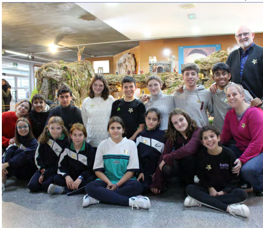
↑ Alumnos del Colegio Sagrada Familia frente al belén de su centro antes de celebrar la jornada Sembradores de Estrellas.