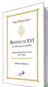
Benedicto XVI: el Papa de la razón Pablo Blanco San Pablo, 2024 616 páginas, 39,90 €

época del Concilio Vaticano II. Con una cuarta parte de su contenido dedicado al contexto alemán de Joseph Ratzinger, es una primera etapa —se esperan otras dos— para preparar el centenario de su nacimiento, en 2027. ●