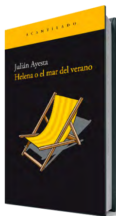
Helena o el mar del verano Julián Ayesta Acantilado, 2002 (reimpresión 2024) 88 páginas, 12 €