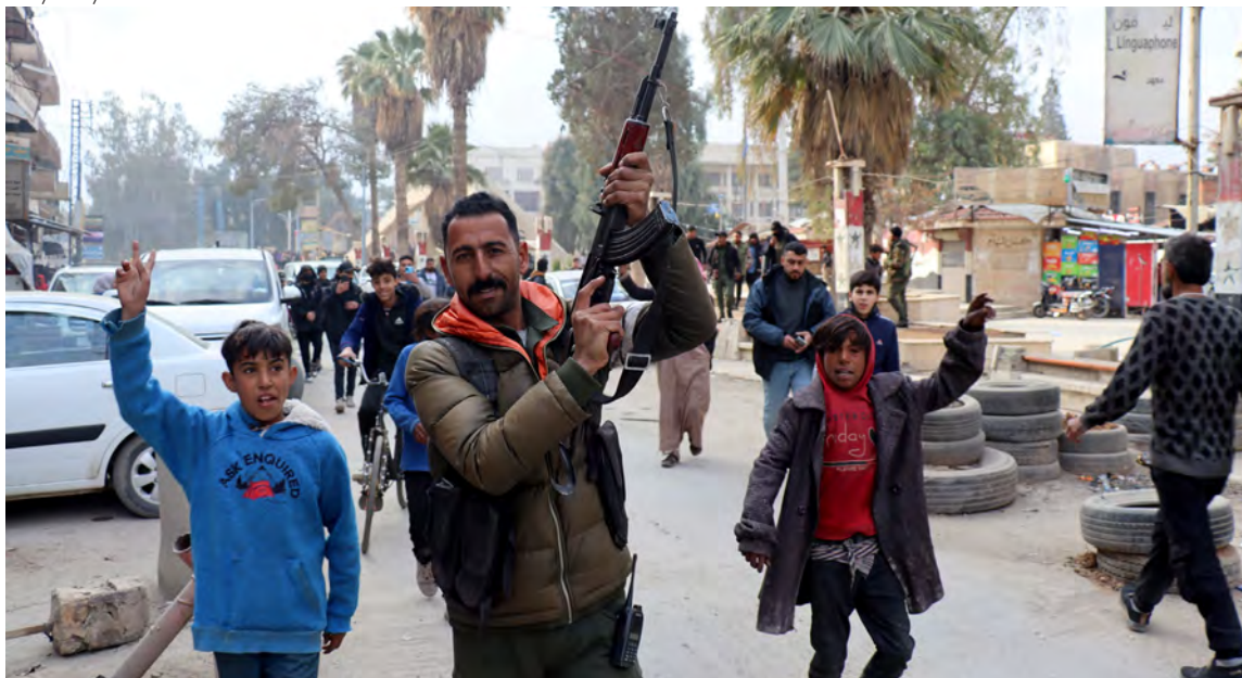
↑ Un combatiente de las SDF celebra la toma de control de la ciudad de Al Hasakah, en el noreste de Siria.