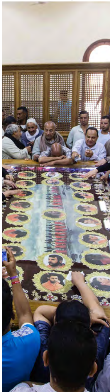
↑ Funeral por los coptos asesinados, celebrado en Egipto en 2018.

testimonio de otros». Pronostica que el reconocimiento de estos 21 cristianos «supondrá un proceso de canonización histórico» y que incluirlos en los registros de los católicos «nos habla de una universalidad del martirio que las Iglesias hacen brillar en un mundo oscuro». «Cuando un cristiano muere, se reencuentra con una comunión más grande».