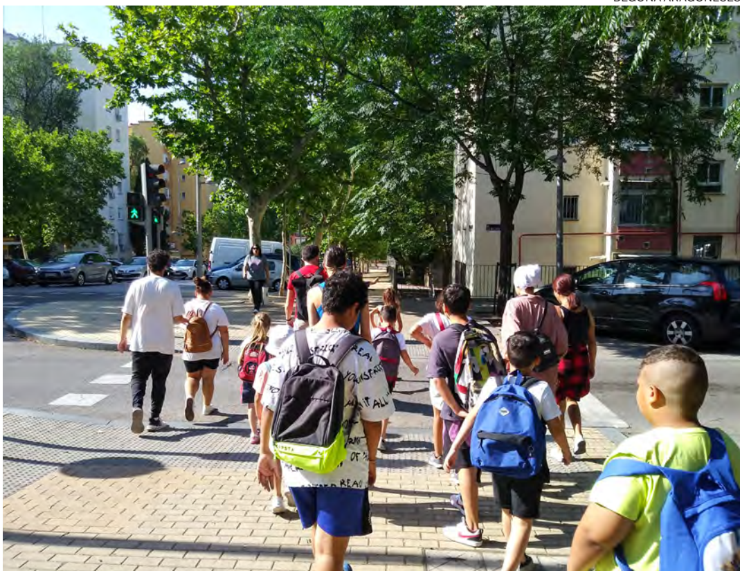
↑ De camino al taller de robótica en el primer día de colonias en Villaverde.