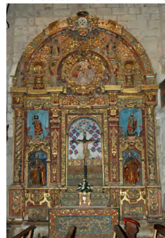
↑ Retablo, regalo de De la Cueva.