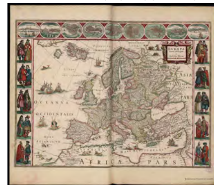
↑ Theatrum orbis terrarum , 1640.

← El rey recibe a Sánchez y a la Comisión Europea en el Palacio Real el 3 de julio.