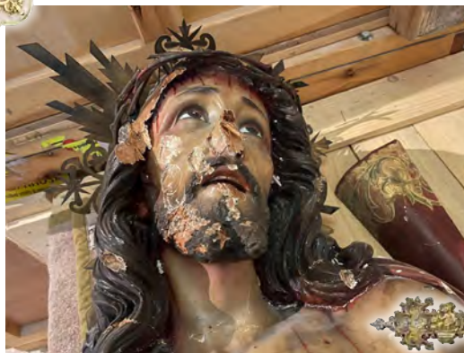
◀ Cristo de la capilla de la Flagelación, de factura española, atacado en febrero.