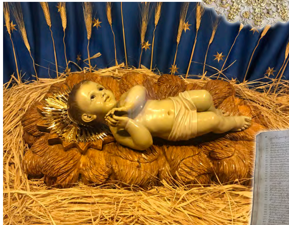
↑ El Niño que procesiona en Navidad en Belén fue realizado en Barcelona.