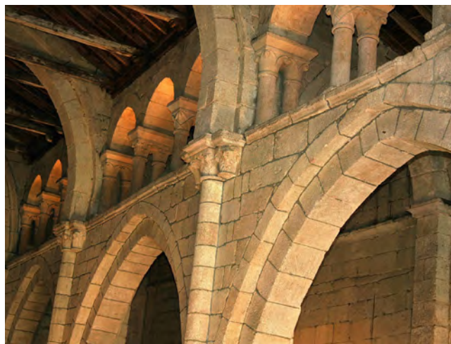
↑ Falso triforio que sustenta la techumbre de madera.