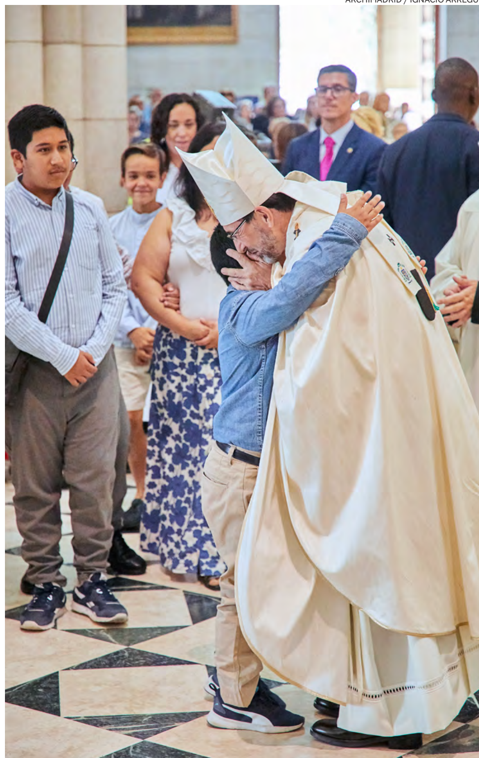
↑ Un grupo de fieles muestra su adhesión al nuevo arzobispo en nombre de la diócesis.

Y de la catedral, a la iglesia parroquial más pequeña de Madrid. En concordancia con su inicial declaración de intenciones, Cobo quiso que su primera celebración como arzobispo fuera en Aoslos. Allí le sorprendió la noticia de que el Papa lo había elegido para asistirle, a partir del 30 de septiembre, en el gobierno de la Iglesia y para elegir a su sucesor. Editorial y págs. 6-7