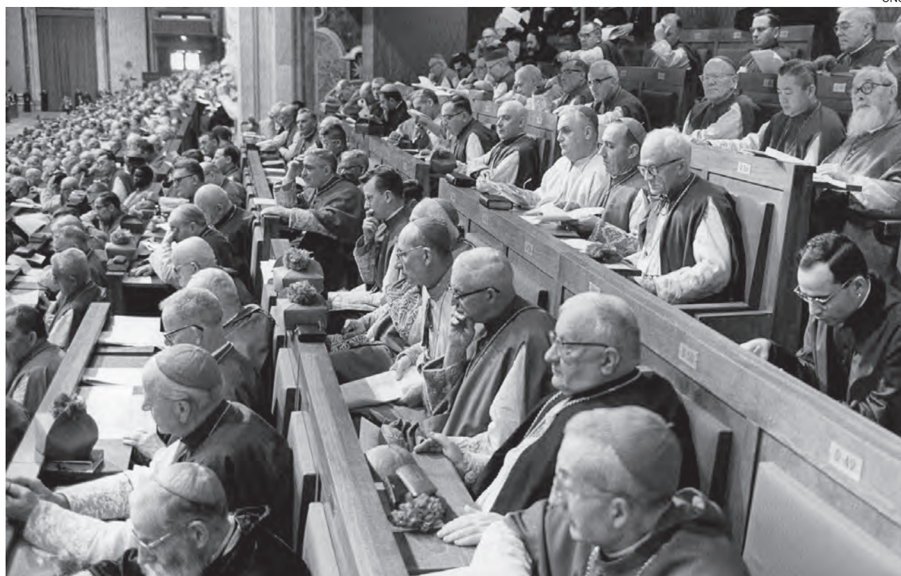
↑ Entre 2.000 y 2.500 obispos asistieron a cada sesión del Vaticano II en la basílica de San Pedro.

En la construcción de puentes entre moral y espiritualidad, la categoría virtud es particularmente importante. Es anterior al cristianismo, pero el desarrollo que de ella hizo la tradición cristiana hizo confluir, como acaso no sucede con ninguna otra categoría, la perspectiva moral (la virtud como hábito operativo hacia el bien) y la perspectiva espiritual (la virtud como don). A mí me parecen especialmente reseñables de la virtud tanto su carácter