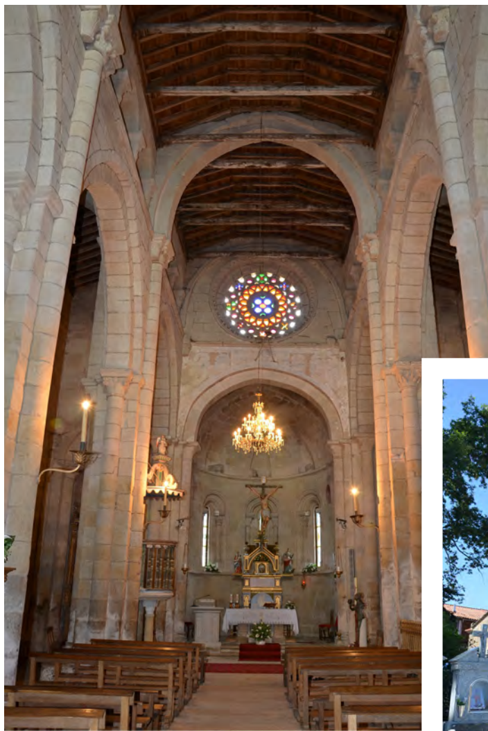
↑ Nave central del templo.