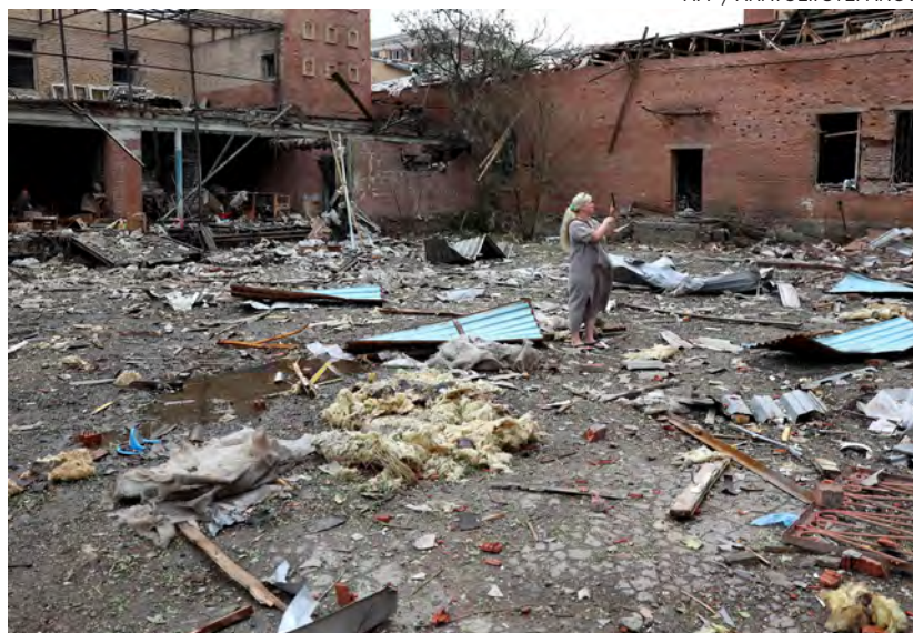
↑ Edificio destruido por un bombardeo ruso en Kramatorsk el 9 de julio.

9.000 civiles muertos, entre ellos 500 niños. Es, según la ONU, el balance de la guerra en Ucrania al cumplirse el 8 de julio 500 días de la invasión rusa. Las dos últimas semanas han sido las más mortíferas, con ataques como los que causaron la muerte a 13 civiles en Kramatorsk o a diez en Leópolis, muy lejos del frente. Los 500 días de guerra coincidieron con la preocupante decisión de Estados Unidos de enviar a Ucrania bombas de racimo, prohibidas en cien países. Por el contrario, es esperanzadora la valoración positiva de la visita del cardenal Zuppi a Moscú que ha hecho el secretario de Estado del Vaticano.