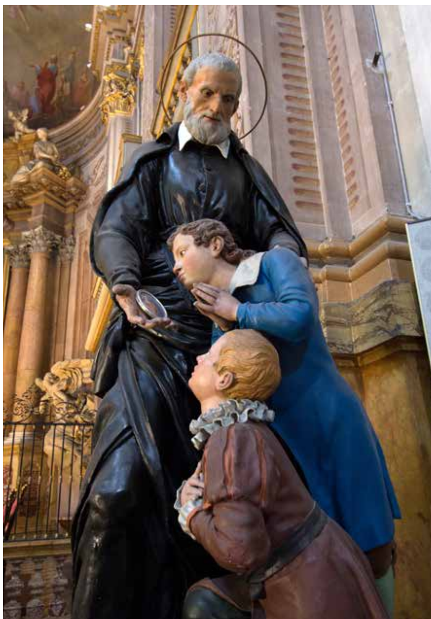
→ San Felipe Neri con unos niños venerando una imagen de Cristo. Oratorio de san Felipe Neri en Bolognia (Italia).

San Felipe Neri unió a hombres y mujeres de toda clase social en su habitación para rezar y hablar de fe. Así nacieron los oratorios