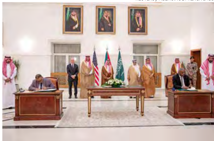
↑ Firma del acuerdo el 20 de mayo en Yeda (Arabia Saudí).

El alto el fuego más largo acordado en Sudán desde el estallido del conflicto en abril no empezó con buen pie. Al cierre de esta edición llegaban testimonios de tiroteos entre el Ejército de Sudán y el grupo paramilitar Fuerzas de Apoyo Rápido y de bombardeos en Jartum después de que la tregua comenzara el lunes por la noche. El cese de hostilidades, previsto para siete días, es el primero que cuenta con el respaldo de un «mecanismo de seguimiento apoyado por Estados Unidos y Arabia Saudí», países que mediaron para que se firmara. El pasado domingo, el Papa Francisco pidió que el acuerdo se respetara e hizo un nuevo «llamamiento urgente para que se depongan las armas».