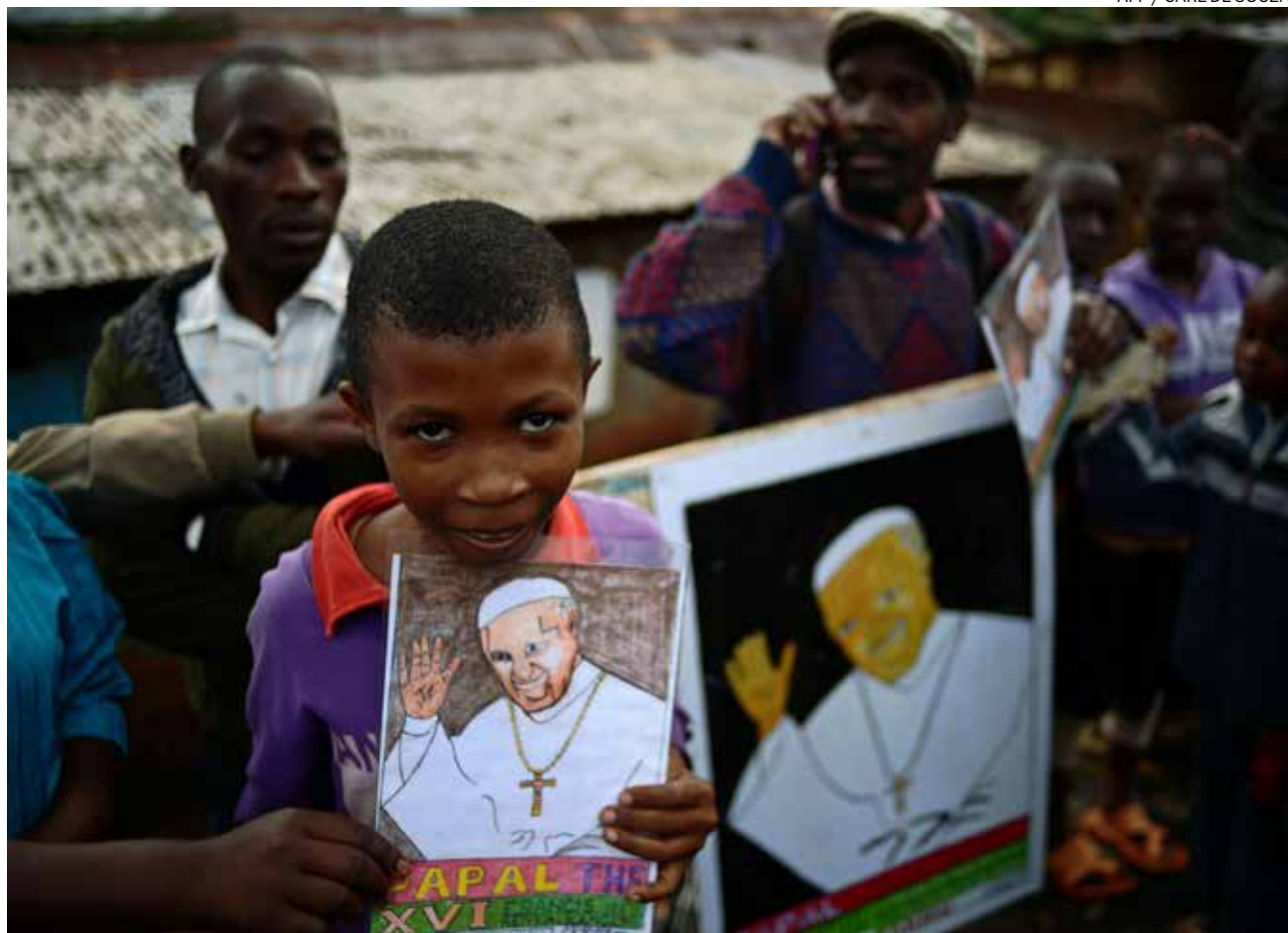
↑ Un niño con un dibujo del Papa espera la llegada de Francisco al barrio de Kangemi en Nairobi (Kenia) en 2015.

El continente africano y sus gentes han animado e inspirado, en buena medida, algunos de los mensajes de calado social que ha pronunciado o rubricado Francisco en esta década como Sucesor de Pedro. Han sido 450 las ocasiones en las que se ha referido a esta tierra