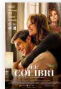
El colibrí Directora: Francesca Archibugi País: Italia Año: 2022 Género: Drama Público: +12 años

A pesar de todo, El colibrí es una película recomendable por las muchas reflexiones que nos obliga a hacer, y por lo desinhibido de su crítica —querida o involuntaria por parte de novelista y directora—. Quizás es mejor esto que mirar hacia otro lado. ●