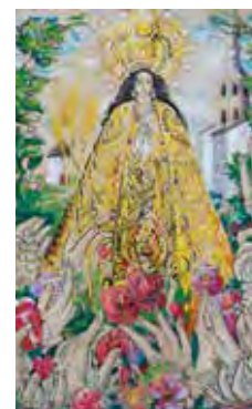
FUNDACIÓN G. PRIETO

FEYVIDA Este movimiento triunfa entre los jóvenes con una estética moderna, buena música y adoración al Santísimo. Se dirige a los alejados, a los que invita a pasarlo bien en la vida. «Dios quiere que seamos felices», dice su fundador. Pág. 20