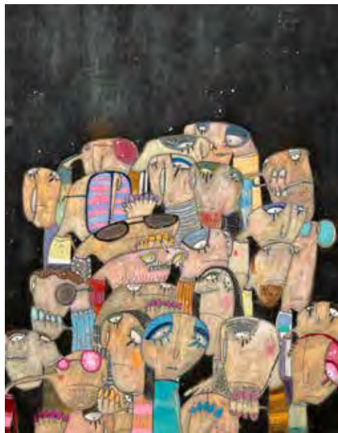
↑ Sin título de Rafa Macarrón.