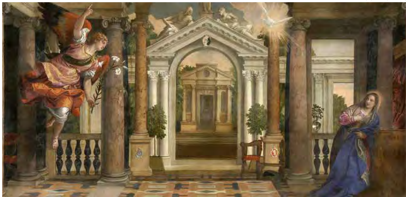
↑ Anunciación de Paolo Veronese. Galería de la Academia de Venecia.