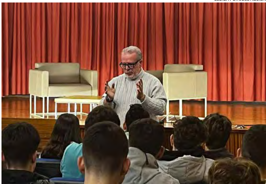
← El ex guardia civil durante una charla en un colegio de Pamplona.