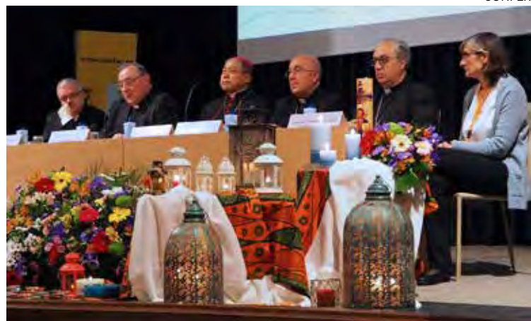
↑ Apertura de la Asamblea General el pasado martes en Madrid.