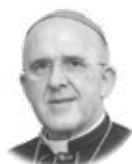
CARLOS CARD. OSORO Arzobispo de Madrid

C uando en este mes de mayo la Iglesia se sitúa de una manera singular ante nuestra Madre la Virgen María para contemplar su sí, os invito a contemplar y a ver con más claridad y más fuerza que el sí