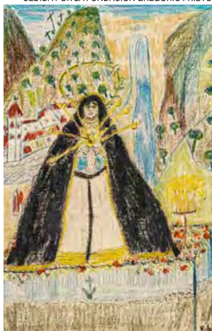
← La Virgen del Rosario o de Monte Sión de Joaquín Sorolla. Museo Sorolla. Madrid.