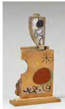
→ Personnage double face de Joan Miró.