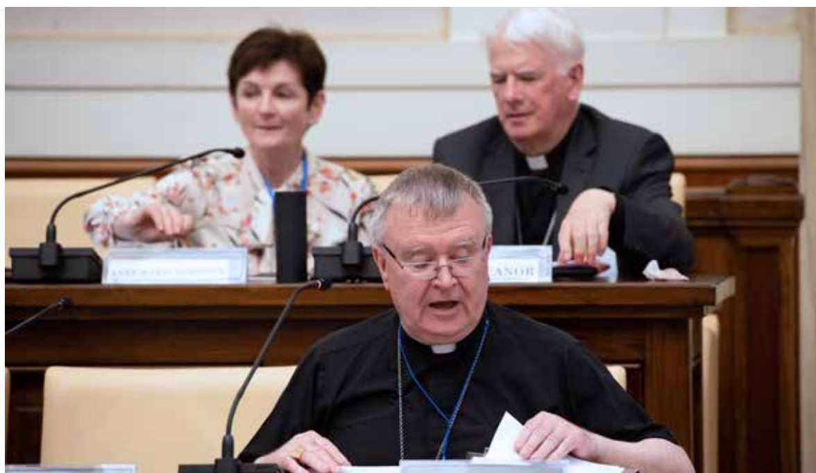
SANTAMARTAGROUP.ORG / MAZUR

La batería de propuestas es más amplia. Tipificar como delito europeo la explotación sexual de mujeres u obligar a los prestadores de servicios de la sociedad de la información a detectar la captación de menores con fines de explotación sexual. Pero el éxito de toda medida legislativa dependerá, en parte, de la conciencia de la sociedad y su rechazo a la explotación laboral y sexual y al resto de formas de trata como el matrimonio forzado o la mal llamada «maternidad subrogada», para acabar con la que el Papa ha denominado «esclavitud moderna». ●