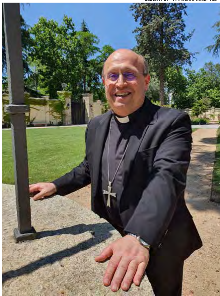
↑ El arzobispo electo de Santiago el pasado jueves en Madrid.

—En las generaciones más jóvenes predomina la indiferencia y el distanciamiento. No veo una actitud contraria. No les dice nada lo que proponemos.