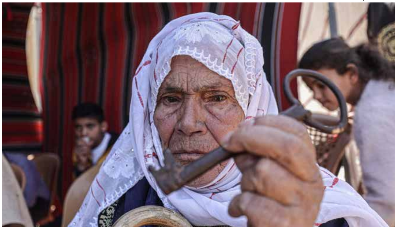
↑ Una anciana muestra la llave de su casa en Gaza durante una manifestación en recuerdo de la Nakba el 1 de mayo.

En su apresurada huida, cogieron los documentos importantes y, después de cerrar la puerta seguramente con manos temblorosas, guardaron la llave a buen recaudo. Dentro «dejaban posesiones muy preciadas. Esperaban volver en un par de semanas», relata Shomali. Pero al acabar la guerra en 1949 se lo impidieron. «Había orden de disparar a quien lo intentara», añade Qumsiyeh.