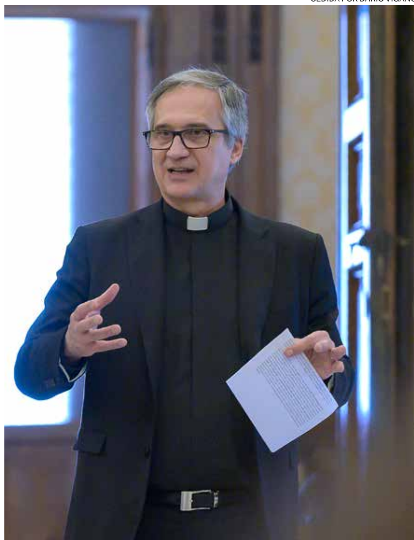
↑ El brasileño fue prefecto del Dicasterio para la Comunicación de la Santa Sede.