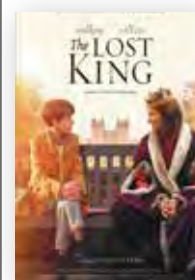
The lost king Director: Stephen Frears País: Reino Unido Año: 2022 Género: Drama Todos los públicos

Una película, en fin, tan instructiva e interesante como recomendable. ●