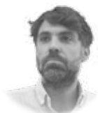
FRAN OTERO @franoterof

La educación afectivo-sexual es una necesidad y una tarea ineludible para familias y educadores. Más en una sociedad marcada por la emoción y el deseo. Hablamos de ello con el director del Departamento de Teología Moral y Praxis de la Vida Cristiana de la Universidad Pontificia Comillas, que acaba de publicar Educación afectivo-sexual. Lo que nos une en el fondo (Dykinson) y es profesor del curso para formadores de Escuelas Católicas.