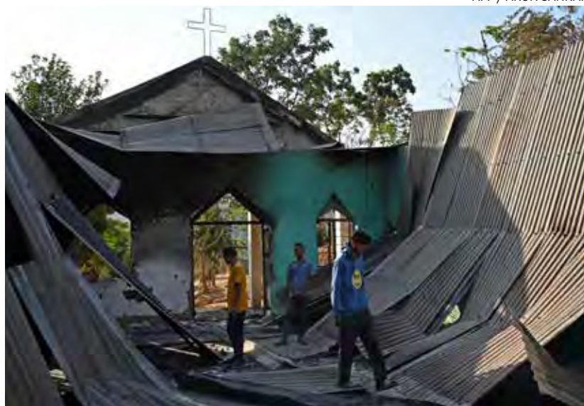
↑ Iglesia quemada en el distrito de Senapati.