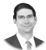
ISIDRO CATEÑA @isidrocateña

Realeza obliga: el espectáculo de pompa y circunstancia que hemos vivido con la coronación de Carlos III de Inglaterra nos invita a echar la vista atrás a una serie, ya convertida en clásico, que ha ido desgranando las joyas de la corona británica. The