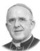
CARLOS CARD. OSORO Arzobispo de Madrid

D entro de muy pocos días vamos a celebrar la fiesta de san Isidro Labrador. Aunque os hablaré de este santo singular, hoy quiero afirmar de una manera muy clara, para este momento que vive nuestro mundo, que es necesaria una revolución de fondo, pero, al mismo tiempo, deciros que la verdadera revolución, esa que puede promover una auténtica reforma de la sociedad, es la santidad.