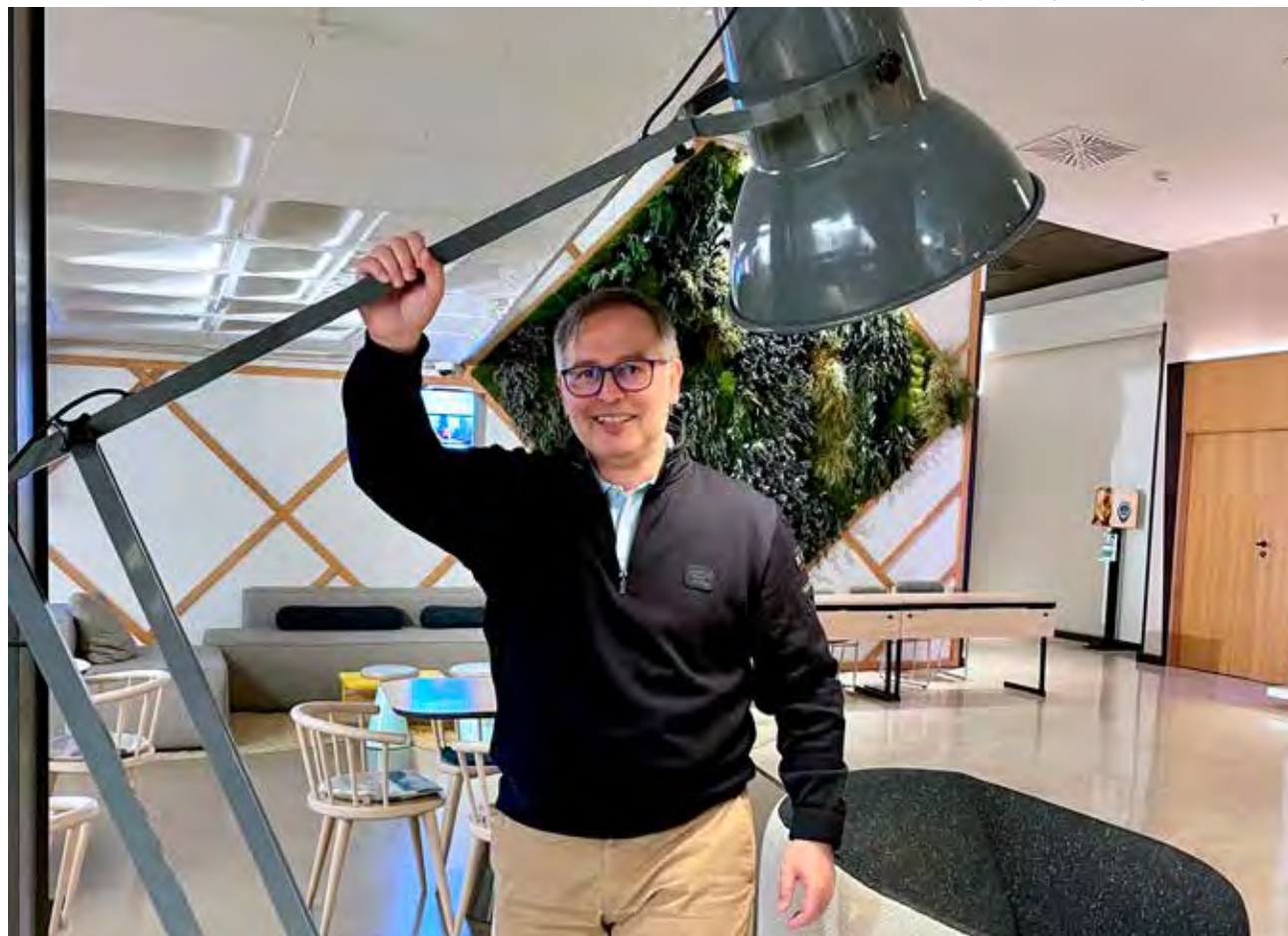
↑ Este ingeniero ha ocupado cargos de responsabilidad en gestión dentro de la Comisión Europea desde 2010.