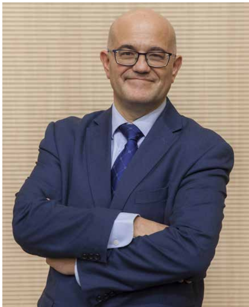
UNIVERSIDAD PONTIFICIA COMILLAS

La educación afectivo-sexual es una necesidad y una tarea ineludible para familias y educadores. Más en una sociedad marcada por la emoción y el deseo. Hablamos de ello con el director del Departamento de Teología Moral y Praxis de la Vida Cristiana de la Universidad Pontificia Comillas, que acaba de publicar Educación afectivo-sexual. Lo que nos une en el fondo (Dykinson) y es profesor del curso para formadores de Escuelas Católicas.