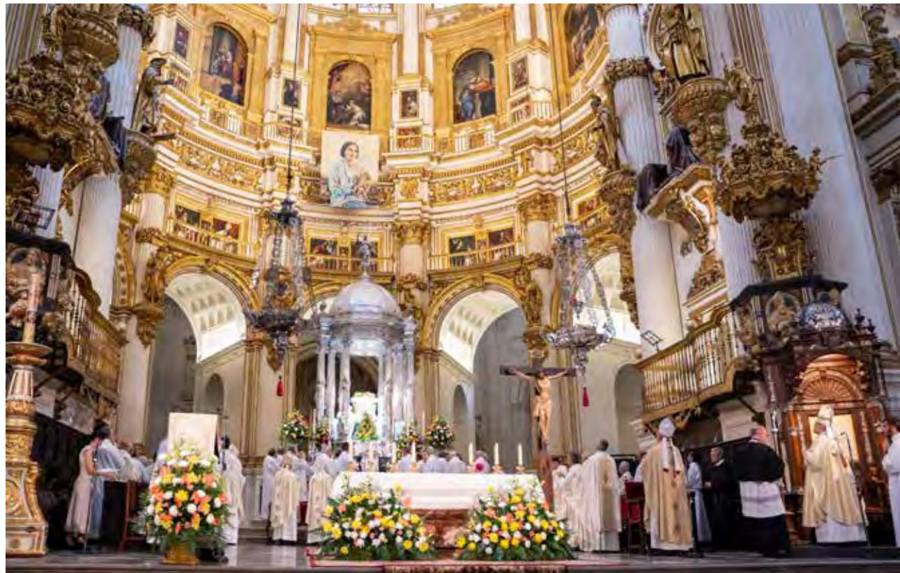
↑ Ceremonia de beatificación en la catedral de Granada con la imagen de la santa.