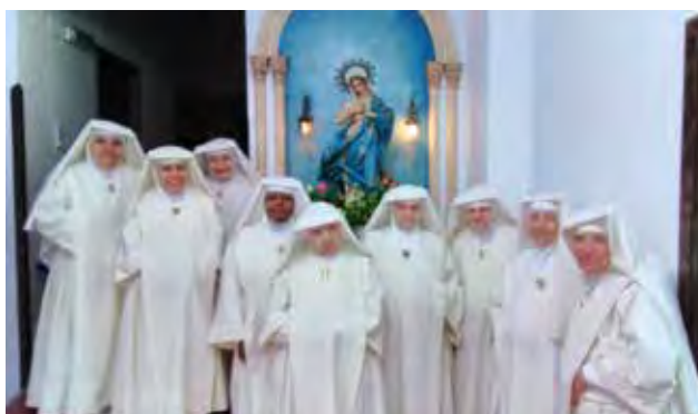
ESCLAVAS DEL SANTÍSIMO SACRAMENTO

→ Aquí solo hay nueve, pero son doce religiosas las que forman la comunidad.