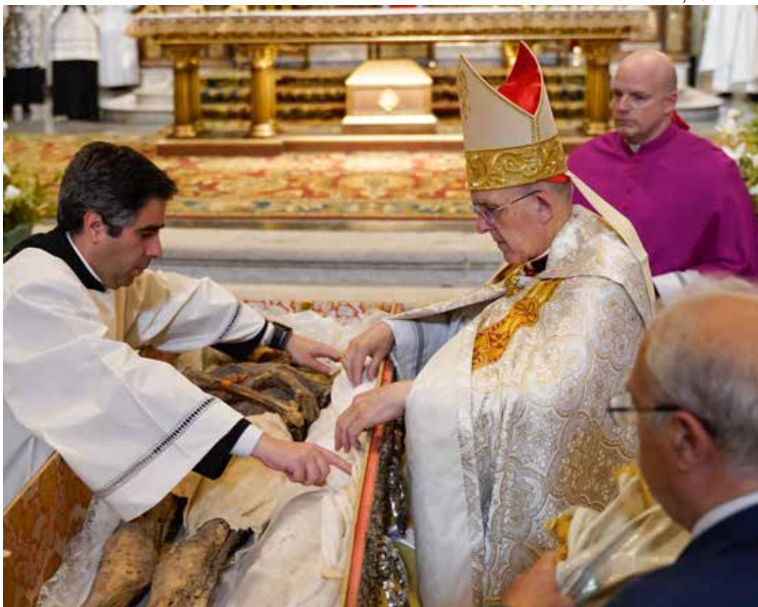
↑ El cardenal Osoro y Alberto Fernández durante el cierre de la urna de san Isidro el 29 de mayo.