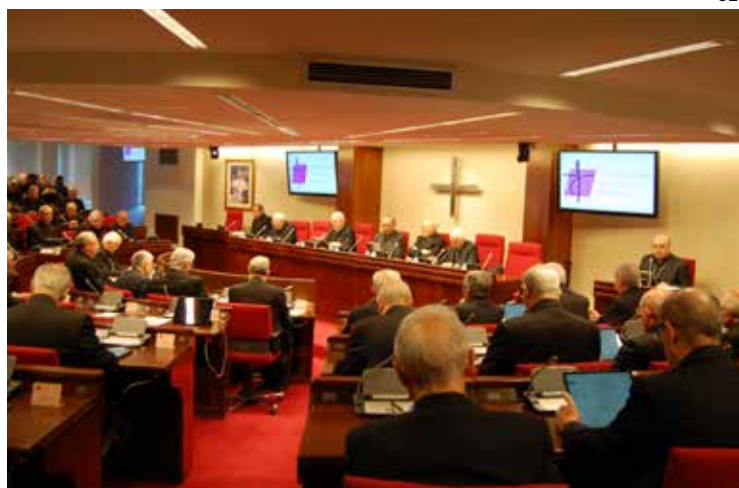
↑ Reunión de la Plenaria de la CEE, en la que se aprobó el documento.

La Conferencia Episcopal Española (CEE) publicó el martes la instrucción sobre abusos sexuales aprobada en la última reunión de la Asamblea Plenaria, hace tres semanas. El texto recoge toda la normativa que se ha promovido desde la Santa Sede en los últimos años, incluida la última actualización del motu proprio Vos estis lux mundi . «La Iglesia debe asumir el compromiso de hacer cuanto sea menester para prevenir y paliar el mal terrible que se deriva de las faltas que hayan cometido o puedan cometer contra los más pequeños algunos sacerdotes consagrados o laicos con funciones concretas», reconocen los obispos en el preámbulo.