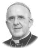
CARLOS CARD. OSORO Arzobispo de Madrid

H emos celebrado la fiesta del trabajo en la que se nos ha recordado la dignidad y el valor permanente del trabajo. Y somos conscientes de la urgencia que, como testigos del Evangelio y constructores de vínculos fraternos, hemos de vivir los discípulos de Jesucristo en el mundo del trabajo, haciéndonos presentes en este mundo con valentía en ámbitos tan cruciales para la vida social. Como cristianos asumamos el compromiso de vivir y testimoniar el «Evangelio del trabajo», pues el Señor nos llama y nos invita a testimoniar el «Evangelio del trabajo». Es el Señor quien nos llama y nos invita a la santidad en nuestras ocupaciones diarias, en las que se encuentra el trabajo.