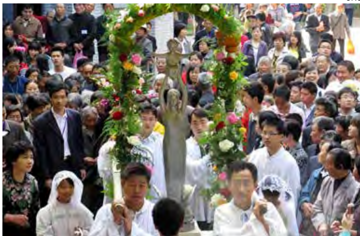
↑ Sheshan volverá a acoger las multitudes de antes de la COVID-19.

Una relativa normalidad vuelve este mayo a los santuarios marianos de China, que después de tres años de cierre forzoso por la pandemia se prevé que reciban a una multitud de peregrinos. Es el caso del de Nuestra Señora de Sheshan, en Shanghái, cuya fiesta además se celebra el 24 de mayo —Jornada Mundial de Oración por la Iglesia en China—. La diócesis, bajo el obispo Shen Bin, nombrado sin contar con la Santa Sede, ha publicado una guía para las peregrinaciones, que incluye la necesidad de inscribirse de forma digital. En el santuario de Housangyu, de Pekín, cada domingo del mes coordinará la celebración una de las principales parroquias de la ciudad.