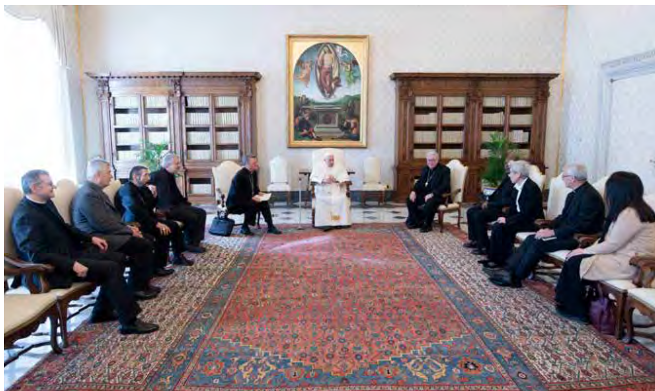
← Francisco con miembros de la comisión preparatoria para la Asamblea General del Sínodo.