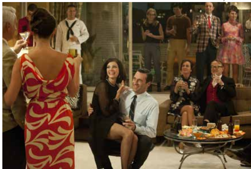
↑ Fotograma del episodio 1 de la quinta temporada de Mad Men .

Mad Men es mucho más que esa elegante historia por fascículos que parece. Ha de ser vista como la epopeya moderna de un grupo de hombres y mujeres tratando ya no de vivir, sino de sobrevivir a aquellos intensísimos años 60. Es un drama escenificado sobre el Nueva York y los Estados Unidos