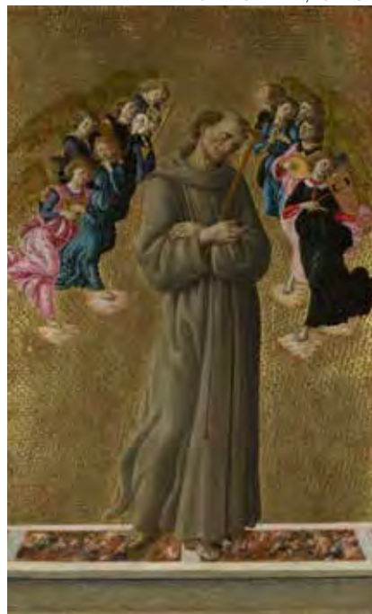
◀ San Francisco recibiendo los estigmas , El Greco. ▶ San Francisco de Asís con ángeles , Sandro Botticelli.