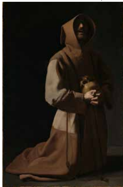
◀ Sin título (para Francisco) de Antony Gormley. ▶ San Francisco en meditación de Francisco de Zurbarán.