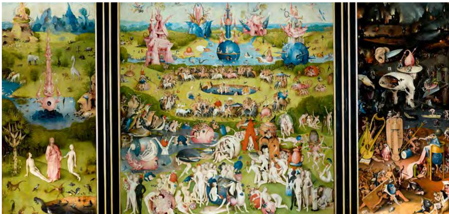
↑ El jardín de las delicias de El Bosco. Museo Nacional del Prado, Madrid.