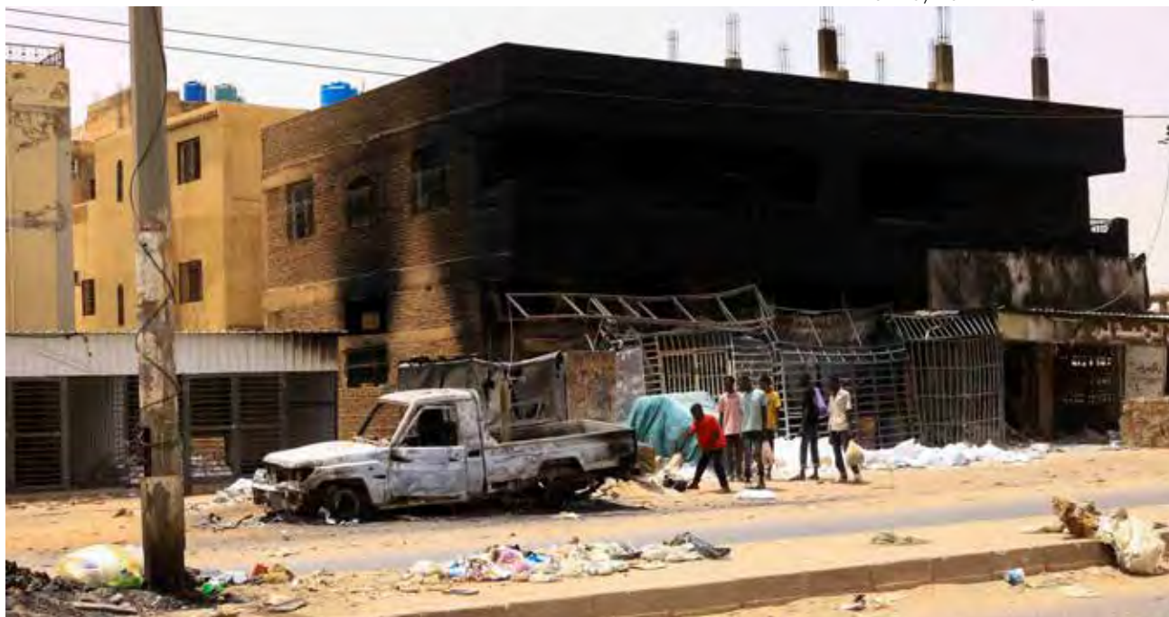
↑ El conflicto ha dejado coches y edificios quemados en la zona del mercado de Jartum.