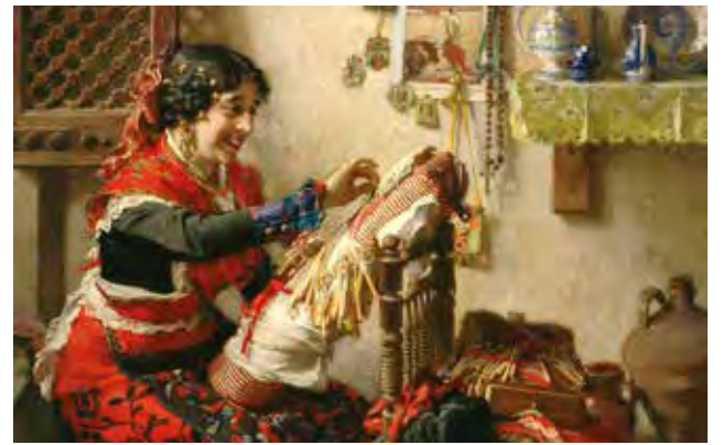
↑ ¡Para mi boda...! Encajera de bolillos. Óleo sobre lienzo.