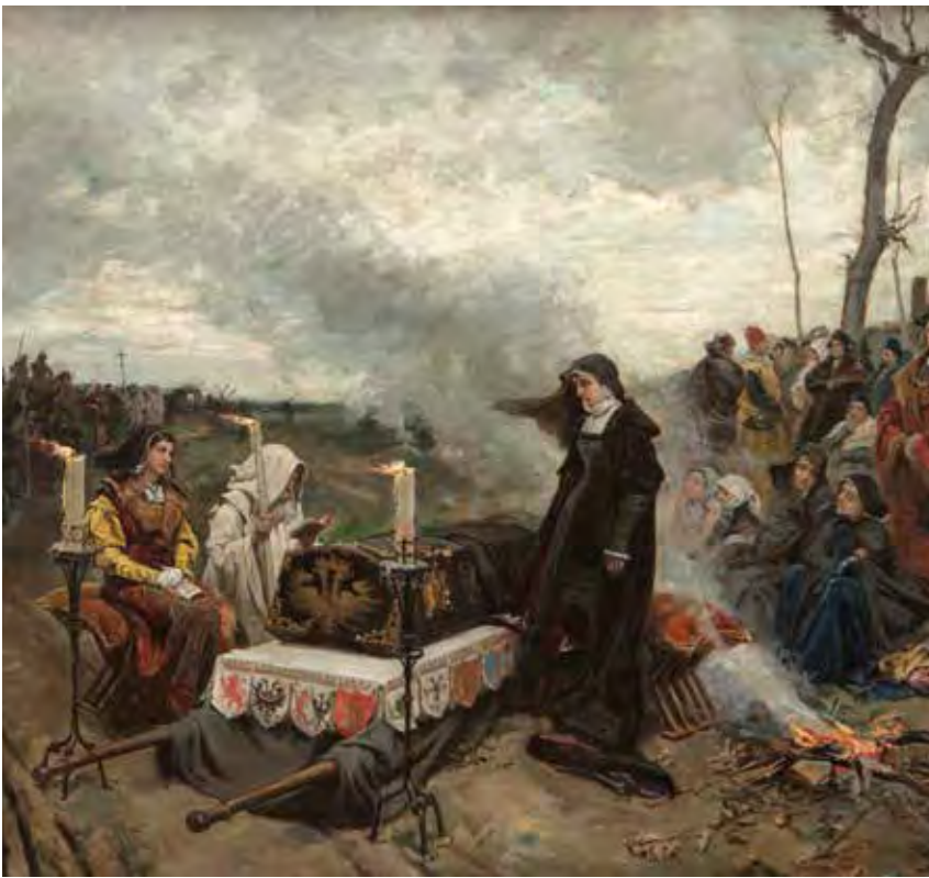
↑ Por la obra recibió la Medalla de Honor de la Exposición General de Bellas Artes.