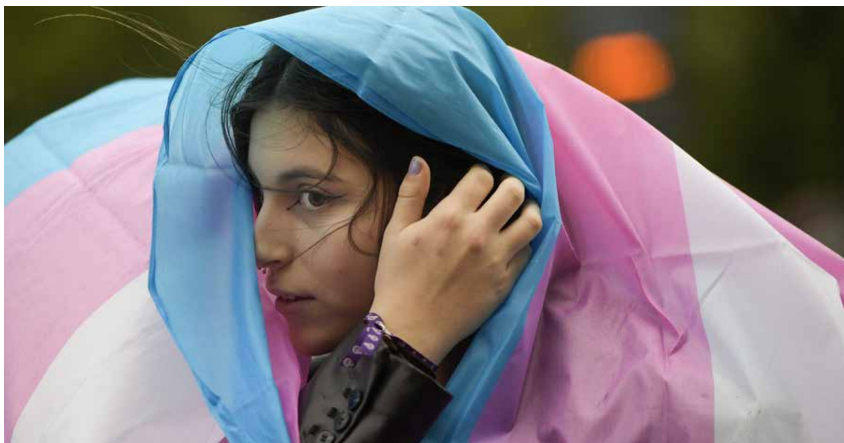
↑ Una joven envuelta en una bandera trans en Oviedo durante la manifestación del Día de la Mujer, el 8 de marzo de 2023.