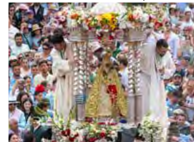
↑ Procesión en el cerro del Cabezo.