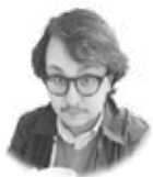
IÑAKO ROZAS @inakorozas

Escribía Italo Calvino en una de esas muchas definiciones que contiene el prólogo de su Por qué leer los clásicos algo así como que «los clásicos son aquellos libros de los cuales suele oírse decir: “Estoy releendo” y nunca: “Estoy leyendo”». Y las series, como muchas otras cosas en la vida, padecen, cuando buenas, de esa misma mal-