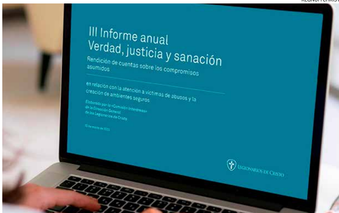
↑ Portada del tercer informe Verdad, justicia y sanación publicado por los Legionarios de Cristo.

Podríamos hablar de muchos aprobados (algunos por los pelos), significativos suspensos (muy dolorosos) y algunos notables. Estamos en camino, hay muchas más luces que sombras. Cada vez son más los que se unen al compromiso y, a nivel institucional, pese a los posibles errores, la Iglesia está aportando mucho a la sociedad. Si buscamos el sobreliviente, este compromiso no puede quedar solo en una acción, debe convertirse en un aspecto intrínseco a la misión. ●