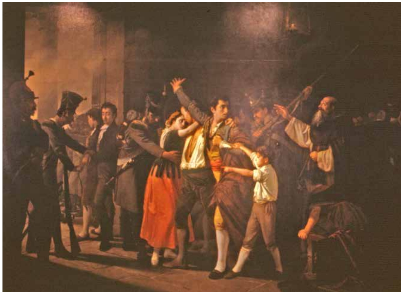
↑ Fusilamiento de Patriotas en el Buen Suceso: la madrugada del 3 de mayo de 1808 de José Marcelo Contreras y Muñoz.

AYUNTAMIENTO DE MADRID. MUSEO DE HISTORIA