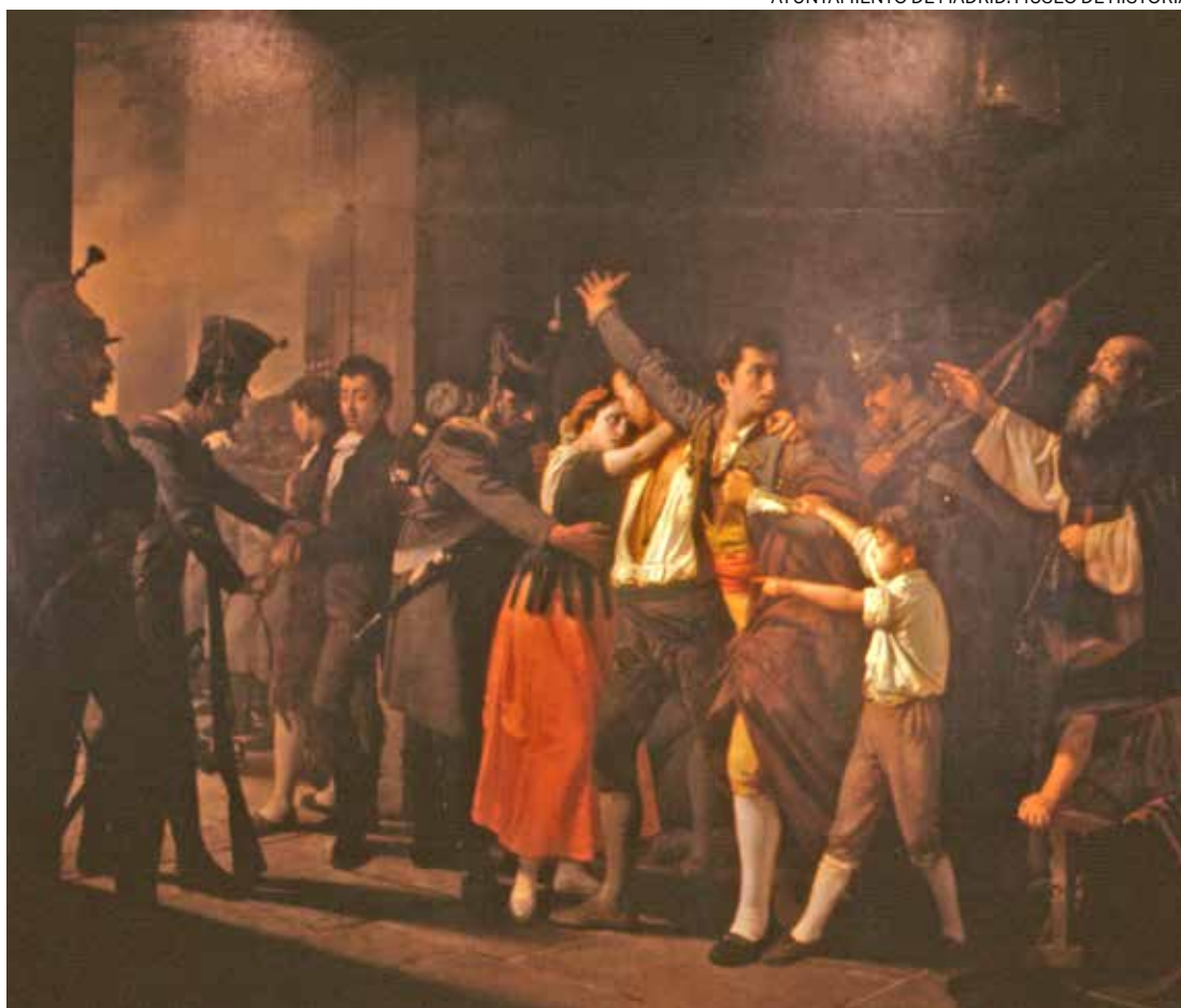
↑ Fusilamiento de patriotas en el Buen Suceso: la madrugada del 3 de mayo de 1808 de J. M. Contreras.