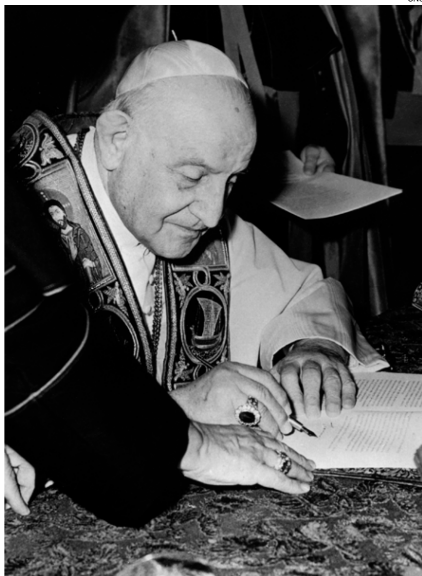
↑ El Papa Juan XXIII durante la firma de la encíclica en 1963.

La encíclica de san Juan XXIII supuso tres avances en su contexto histórico, cuando el Concilio estaba en su andadura inicial. Promovió la reconciliación de la Iglesia con la tradición del pensamiento moderno respecto a los derechos humanos, el reconocimiento de la comunidad mundial de los pueblos y el diálogo con otras corrientes en una sociedad plural