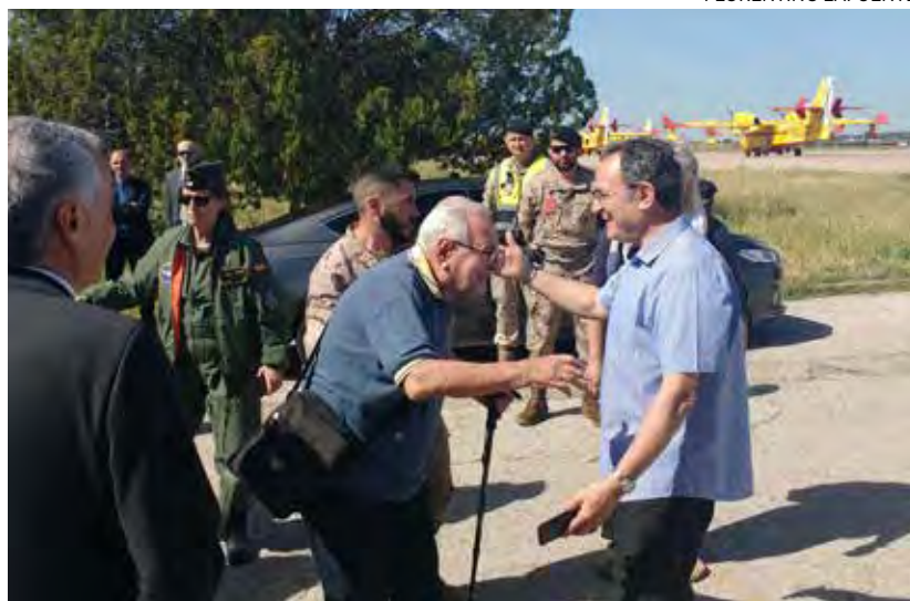
↑ El superior de los combonianos en España recibe a Parladé en Torrejón.