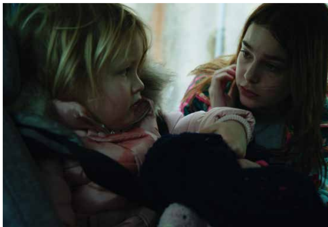
HAUT ET COURT

Camille, de cara a los demás, deja claro que ella no se quiere quedar con el bebé. Pero en realidad está llena de dudas, pues a sus compañeras les parece inconcebible que una madre quiera desprenderse de su hijo. Pero Camille tiene en el rabillo del ojo su propia historia: ¿habría ido mejor su vida si su madre le hubiera dado en acogida al nacer? Aunque madre e hija se quieren, Clo no ha madurado, es promiscua —no