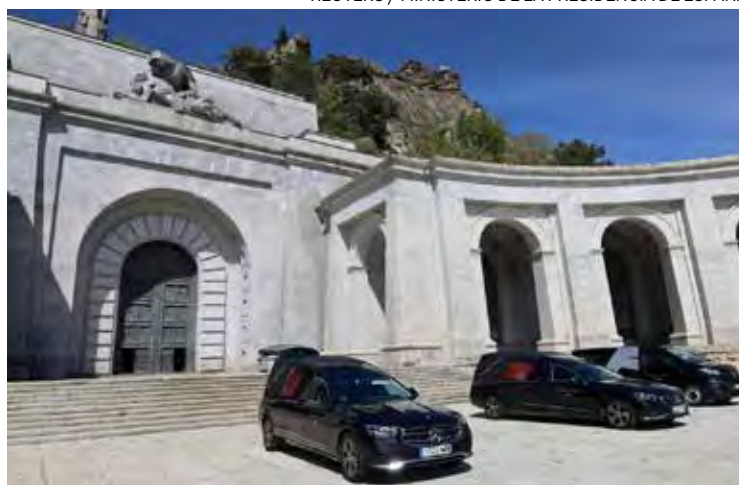
↑ El coche fúnebre abandonó el valle sobre las 12:50 horas.

Los restos de José Antonio Primo de Rivera salieron el pasado lunes del Valle de los Caídos, rumbo al cementerio de San Isidro, en Madrid, después de un acuerdo entre los familiares y el Gobierno. La exhumación del fundador de la Falange se produjo, sin embargo, en cumplimiento de la Ley de Memoria Democrática. A su llegada al camposanto madrileño, donde reposan varios familiares del político, como su hermano Miguel Primo de Rivera y Sáenz de Heredia, que fue ministro con Francisco Franco, se produjeron enfrentamientos entre algunos de sus seguidores y las fuerzas de seguridad. De hecho, la Policía Nacional tuvo que detener a tres personas.