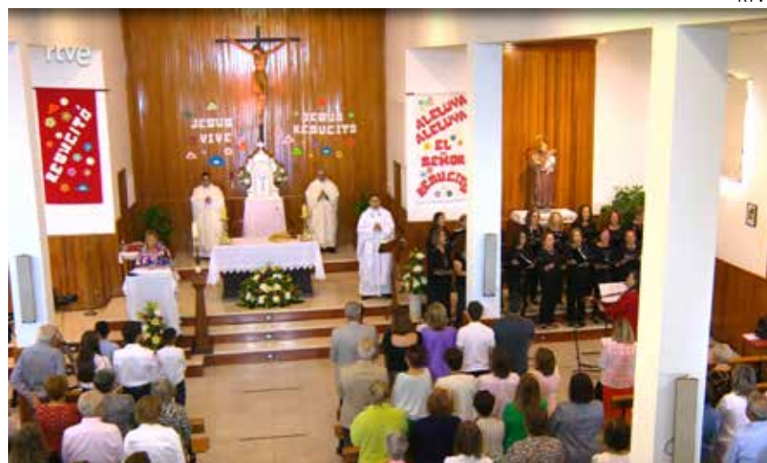
↑ Eucaristía retransmitida desde la iglesia de San Antonio en Lanzarote.

El 28 de octubre de 1956, a las 20:30 horas, comenzó a emitir Televisión Española. La efeméride circula por las wikipedias de turno y es relativamente conocida; lo que ya no conoce tanta gente es que, tras la intervención oficial del ministro de Información y Turismo, Arias Salgado, y del entonces