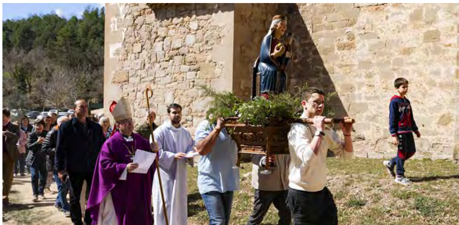
← El obispo de Solsona presidió una procesión rogativa en L'Espunyola (Barcelona).