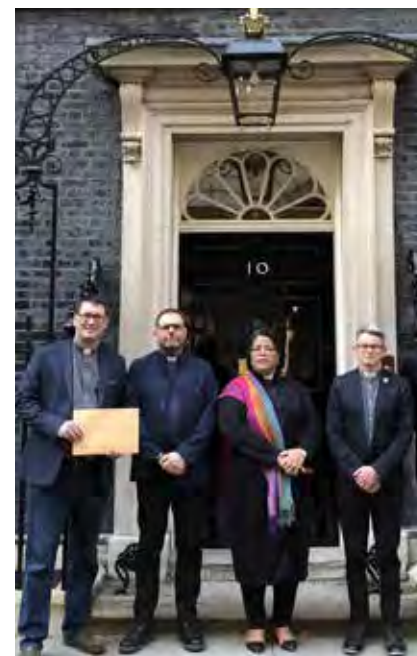
THE JOIN PUBLIC ISSUES TEAM

↓ Líderes cristianos entregan una declaración contra el proyecto de ley en la residencia del primer ministro.