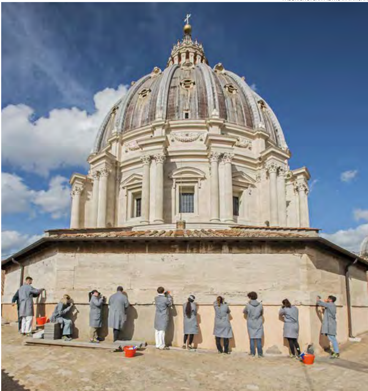
↑ Varios jóvenes del curso reparan grietas y agujeros en el marmol de la cúpula de San Pedro.