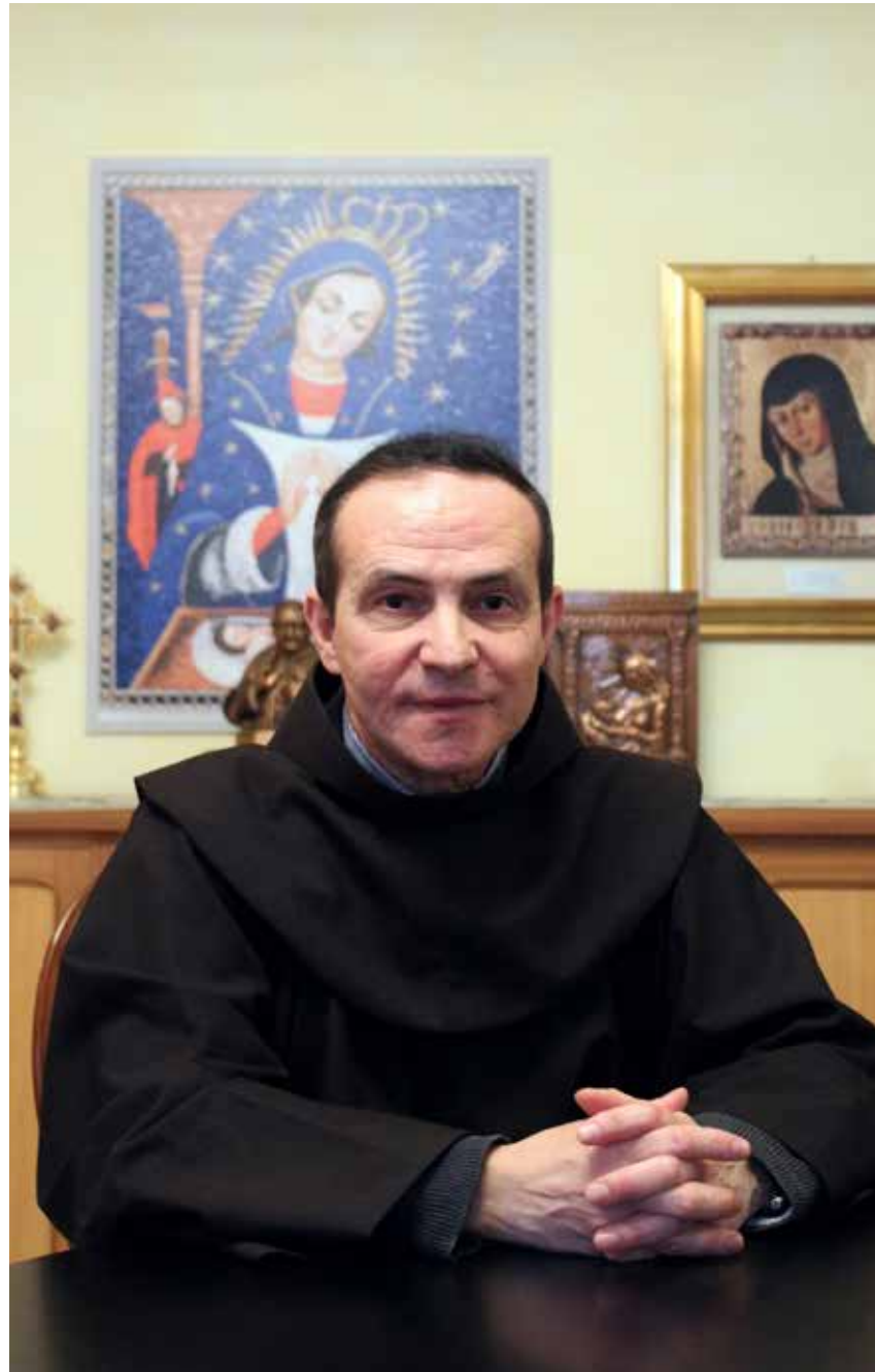
↑ El franciscano forma parte del comité directivo del observatorio.

—Tenemos un ejemplo claro en los estudios sobre madre Ágreda. Fue conde-