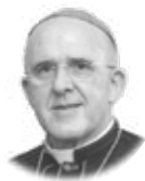
CARLOS CARD. OSORO Arzobispo de Madrid

¡Qué belleza tan grande adquieren las páginas de la Biblia en las que se nos muestra cómo el trabajo pertenece a la condición originaria del hombre! Leámoslas con detención, entrando y llegando a la hondura con las que se describe lo que supone que el Creador plasmase al hombre a su imagen y semejanza y le invitase a trabajar esta tierra (cfr. Gn 2, 5-6). Tal como nos dice la Sagrada Escritura, es verdad que, a causa del pecado, el trabajo se transformó en fatiga y sudor (cfr. Gn 3, 6-8), pero el proyecto de Dios sobre este mantiene su valor inalterado. Basta contemplar a Jesucristo, semejante a nosotros, cómo dedicó años al trabajo. Necesitamos el trabajo para realizarnos, para hacer posible el desarrollo de nuestra sociedad, al verdadero bien de la humanidad, pero siempre sabiendo que el «trabajo está en función del hombre y no el hombre en función del trabajo» (cfr. Laborem exercens , 6). ●