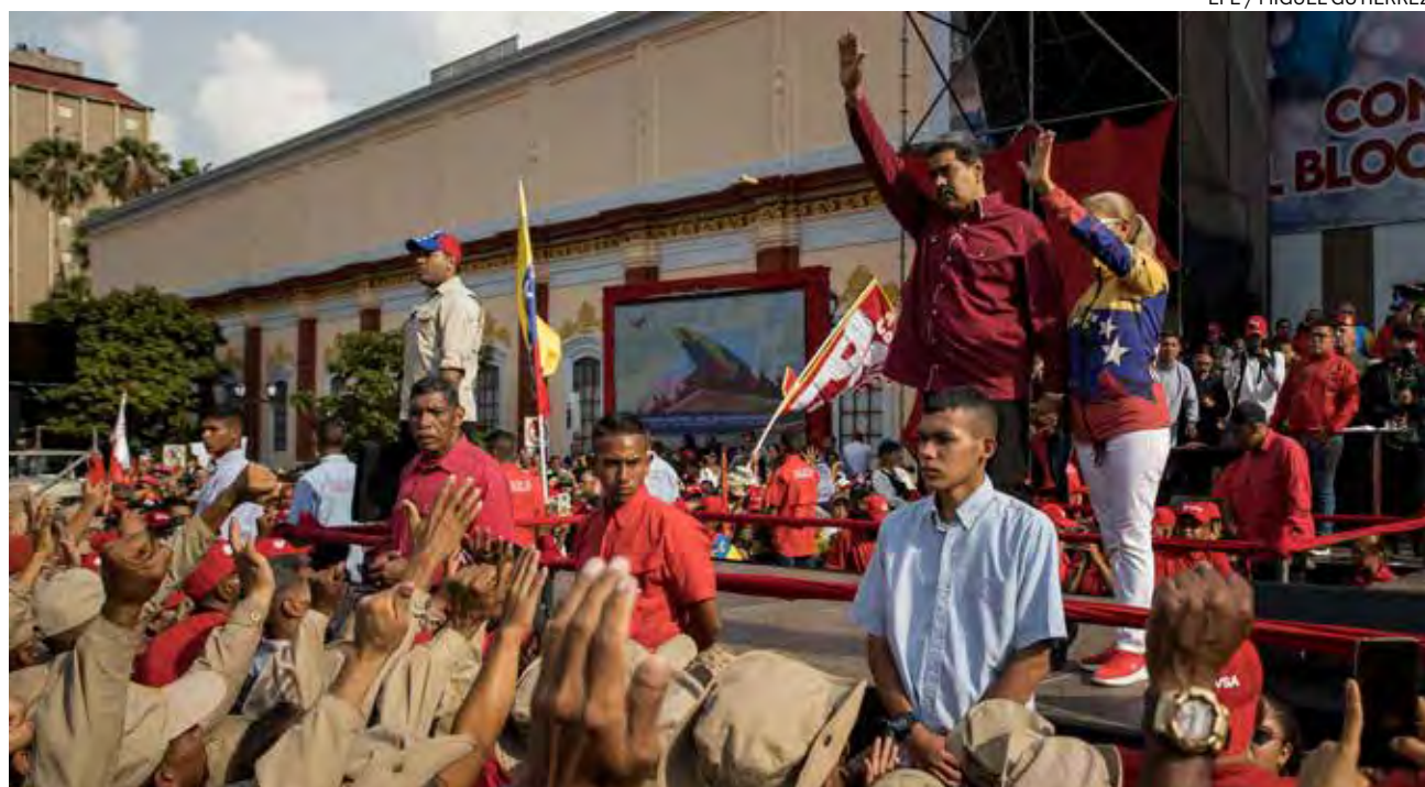
↑ Maduro en un acto homenaje a Chávez el pasado 13 de abril.

Al cumplirse diez años de la llegada de Nicolás Maduro al poder, la Iglesia es consciente del hartazgo de la población, atrapada entre un Gobierno totalitario y una oposición desunida y que no se ocupa de sus problemas reales, afirma el vicepresidente de los obispos