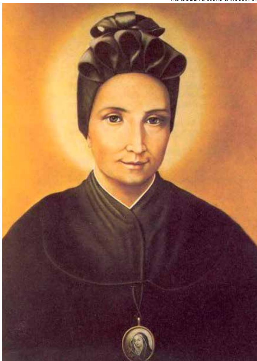
↑ Retrato de santa Magdalena, fundadora de las canossianas.