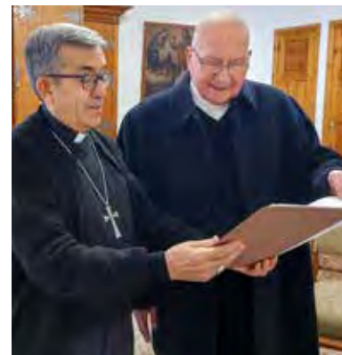
↑ Mozo recibiendo el título.