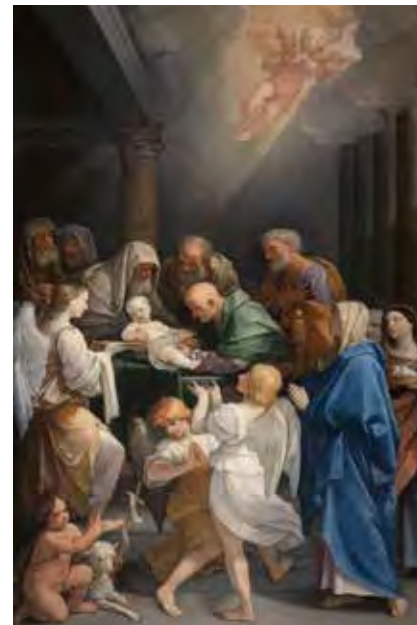
↑ La circuncisión. Iglesia de San Martino, Archidiócesis de Siena, Italia.

frente a la imagen retratística y aislada. En esta sección se encuentra una de las piezas más destacadas del proyecto: El triunfo de Job , que lucía en la catedral de Notre-Dame, sobrevivió al incendio y es la primera vez que sale de París tras su restauración. En esta obra contemplamos a Job entronizado, recibiendo regalos en recompensa de su perseverante fidelidad ante la dura prueba de Dios en la tierra. Este capítulo también instruye en la idea de Reni sobre la belleza de la vejez. El autor pinta las arrugas, la flacidez, las manchas y las canas en recuer-