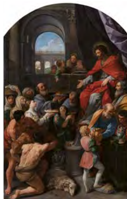
↑ La Inmaculada Concepción. The Metropolitan Museum of Art, Nueva York, Victor Wilbour Memorial Fund.