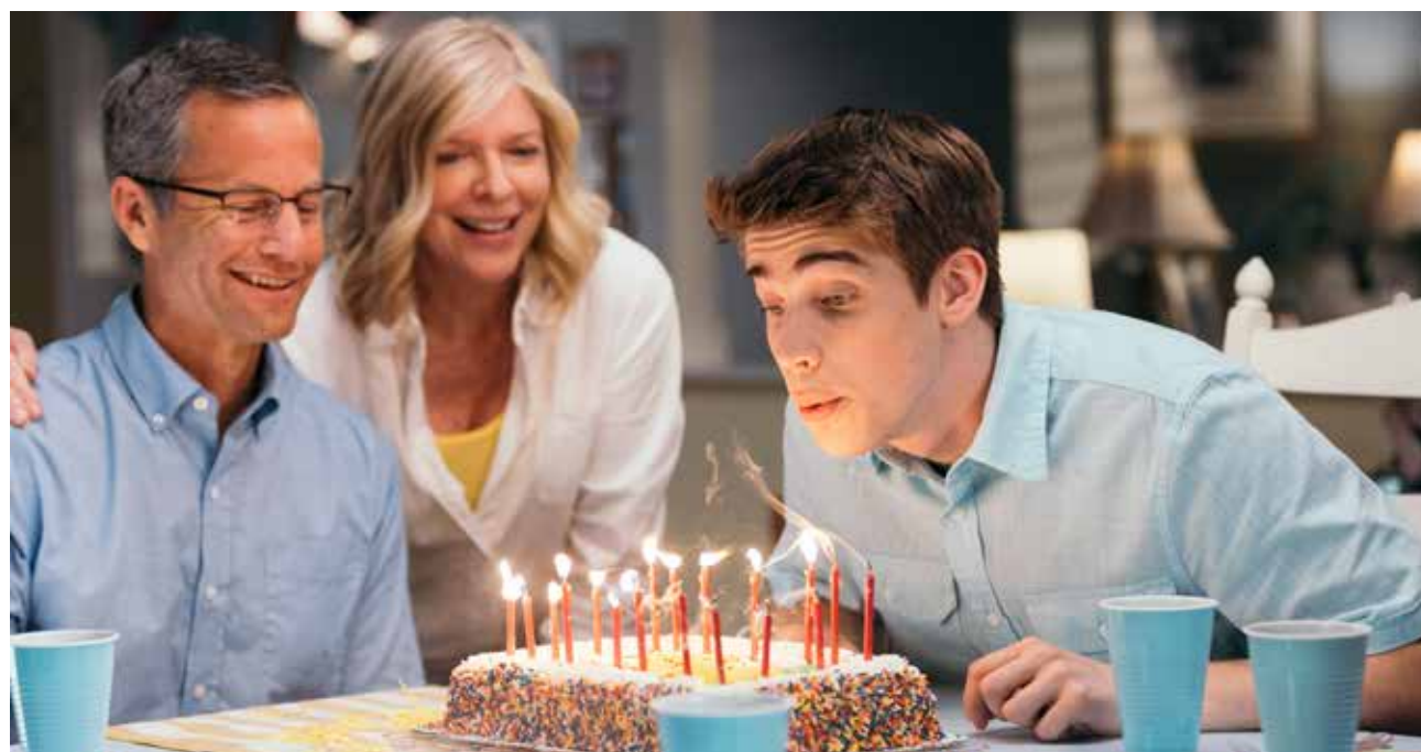
EUROPEAN DREAMS FACTORY