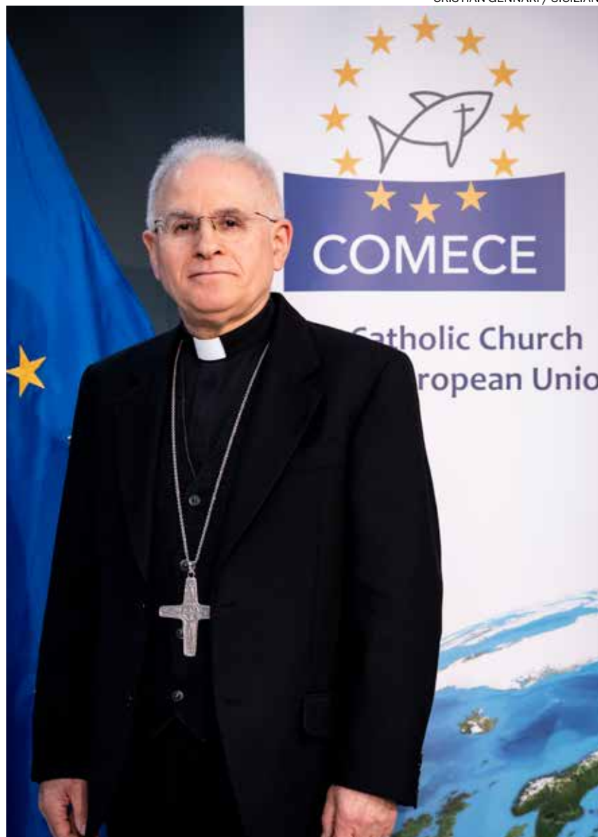
CRISTIAN GENNARI / SICILIANI

—Desgraciadamente son todavía pocos. Debería haber más. Para nosotros, más allá de la fórmula técnica, que parece ser una de las más significativas, cualquier iniciativa humanitaria encaminada a reducir los riesgos que encaran