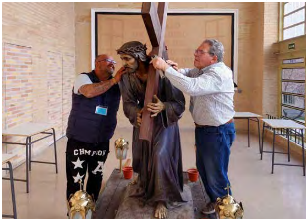
↑ El Nazareno , dentro de la prisión, a la espera de visitar a quienes también cargan con sus cruces.