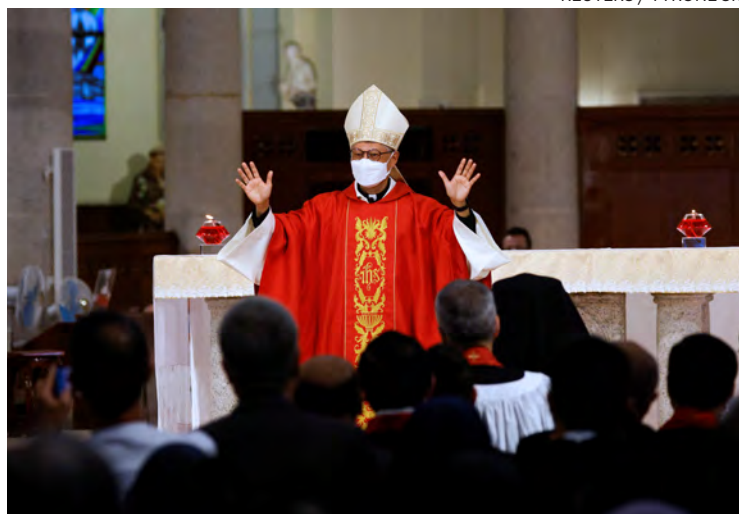
↑ Stephen Chow en una celebración en Hong Kong.

La diócesis de Hong Kong ha anunciado en un comunicado que su obispo, Stephen Chow Sau-yan, viajará a Pekín el próximo 17 de abril, un evento único pues hace 15 años que un obispo de Hong Kong no visitaba la capital en la China continental. El obispo jesuita estará cinco días en el país, donde podrá compartir celebraciones con las comunidades locales. Entre otros actos, visitará el seminario mayor de Pekín y la tumba de Matteo Ricci, misionero jesuita del siglo XVII. También conocerá el trabajo de organizaciones que promueven intercambios culturales y amistad entre ambos territorios. El último prelado que viajó fue otro auxiliar, John Tong, por los Juegos Olímpicos de 2008.