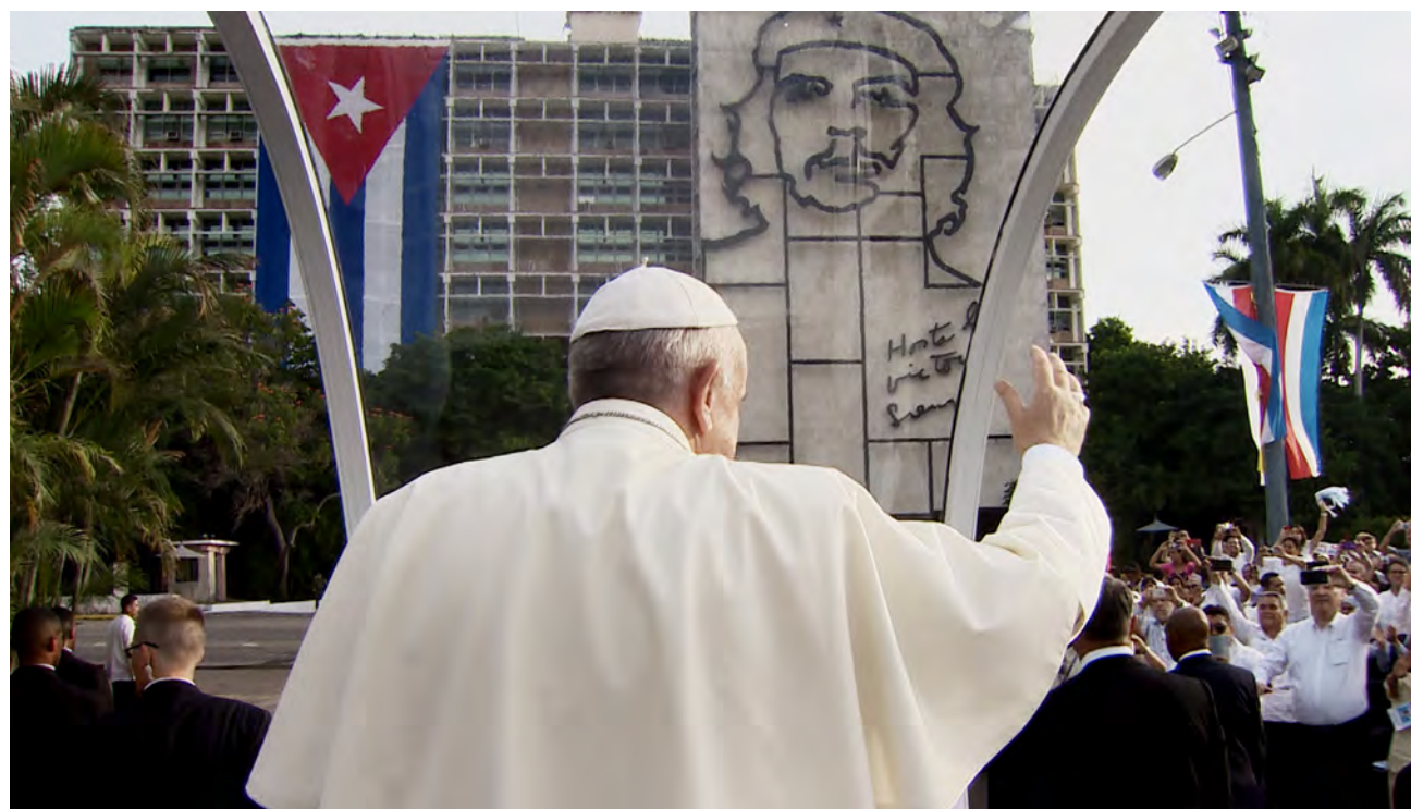
↑ Francisco a su llegada a la plaza de la Revolución de La Habana en 2015.

In viaggio Director: Gianfranco Rosi País: Italia Año: 2022 Género: Documental Público: +7