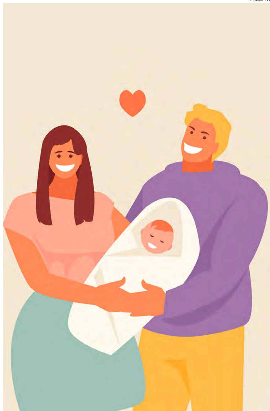
↑ «El matrimonio y la familia son patrimonio común de la humanidad».

Pensemos en la importancia que tiene la familia cristiana en estos momentos de la historia. No es una cuestión secundaria hablar de esta realidad en la que todos hemos venido a este mundo. Sabemos que el ser humano fue creado a imagen y semejanza de Dios para amar. De tal manera que solamente se realiza plenamente a sí mismo cuando hace entrega sincera de sí a los demás. Además, como ya he escrito en otras ocasiones, la familia es un ámbito privilegiado donde cada persona aprende a dar y recibir amor. ¿Qué es lo que necesita más este mundo? ¿Qué belleza tiene la familia! ¿Cuántas experiencias fundamentales hemos vivido en la familia! Ciertamente es un bien para los