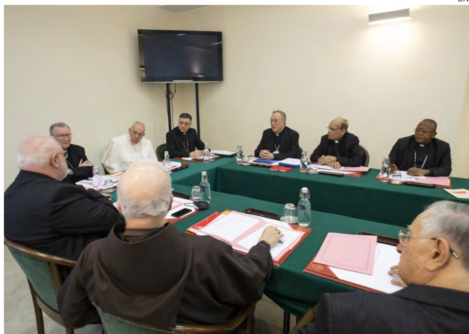
↑ El Papa preside reunión del Consejo de Cardenales en febrero de 2022.