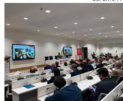
↑ La jornada tuvo lugar en Pamplona.

Conocidos o no, fueron muchos los deportistas y profesionales relacionados con el mundo del deporte que hablaron abiertamente de su fe. «Hay que dar testimonio», dijo Tebas.