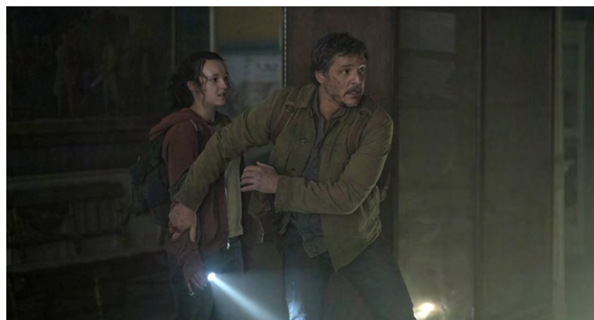
↑ La distopía pone el acento en una relación entre padre e hija.

Este enésimo apocalipsis distópico es, sin duda, uno de los estrenos más esperados del año. He de confesar que, al no ser yo muy gamer y estar basada la serie en el famoso videojuego, la cogí con cierto recelo. Me equivoqué. The last of us (HBO Max) merece la pena. Entiendo su pereza si les digo que además la cosa va de virus, de epidemias,