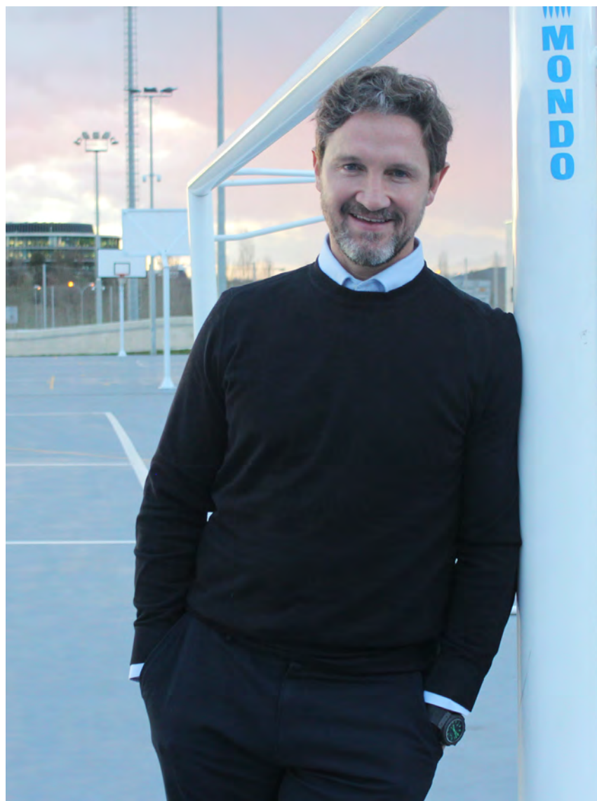
↑ El exfutbolista posa en las instalaciones deportivas de Salesianos Pamplona.

—Tengo un amigo que trabajaba en el sur de Tenerife y los días de descanso nos íbamos allí. Al verme enfadado, me dijo que conocía a un sacerdote muy bueno y cercano. Le contesté que no me apetecía hablar con él, pero insistió. En una cena, este sacerdote, al ver que tenía una inquietud por la fe, se interesó por lo que me pasaba. Se lo conté y su respuesta fue contundente: «Pero, tonto, no te das cuenta de que Dios te quiere mucho más de lo que tú te imaginas». Entonces, me preguntó qué había querido ser desde pequeño y dónde estaba ahora. Es cierto, siempre quise ser futbolista y estaba en Primera División. Tenía toda la razón. Aquel día empezó nuestra amistad. Recuperé la fe e iba a Misa al Hospi-