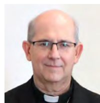
Milton Tróccoli Obispo de Maldonado-Punta del Este-Minas Responsable de Clero y Seminarios de los obispos uruguayos.

Los encuentros que antes se celebraban extramuros y también a sacar a los seminaristas a la calle para que vayan conociendo la realidad de la diócesis. «Se trata de salir a los caminos y estar con la gente». Ahora, por ejemplo, de cara al Día del Seminario, que se celebra el 19 de marzo con el lema Levántate y ponte en camino , «hemos decidido trasladar la celebración a las parroquias». En vez de convocar a la gente en el seminario, es el seminario el que acude a la gente. «Queremos visitar todos los templos de la diócesis», detalla Rubio.