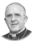
CARLOS CARD. OSORO Arzobispo de Madrid

La ciencia y los avances científicos están brindando unas posibilidades inéditas hasta ahora para mejorar la existencia de todos los hombres, pero, al mismo tiempo, la vida está amenazada en numerosos lugares del mundo