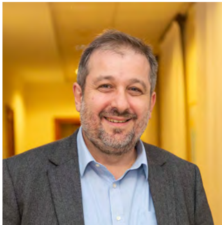
COMPAÑÍA DE JESÚS