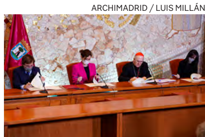
↑ Firma del acuerdo en abril.

alcalde, José Luis Martínez-Almeida. La audiencia se enmarca en las celebraciones del Año Santo de san Isidro, concedido por la Santa Sede con motivo del IV centenario de la canonización del patrón de Madrid. Las tres administraciones firmaron un protocolo general de actuación con el Arzobispado y, a lo largo del jubileo, han colaborado en diversas celebraciones y actividades. ●