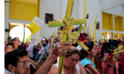
↑ Domingo de Ramos en Managua.

de donaciones del exterior. Ortega, que recientemente calificó a la Iglesia de «mafia», ha ordenado a la Policía que prohíba que las procesiones de Semana Santa se realicen en la vía pública. La ONU ha solicitado un informe sobre la situación del país a un grupo de expertos y ha asegurado que en Nicaragua se cometen crímenes de lesa humanidad. C. S. A.