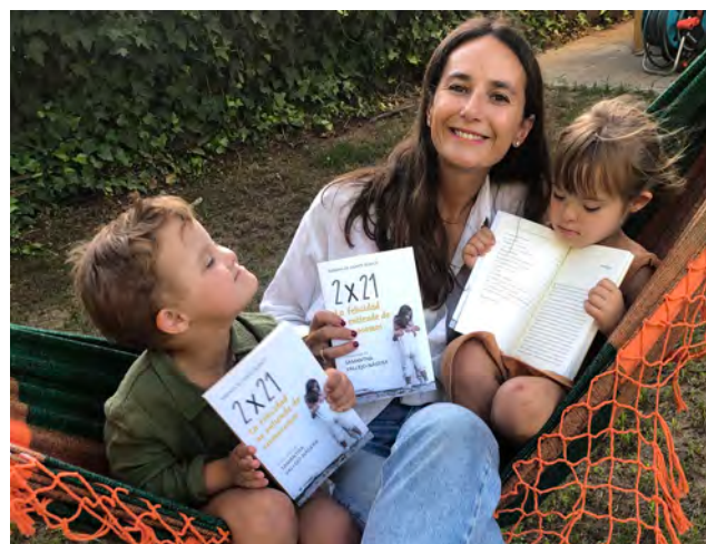
CEDIDAS POR MARIANA DE UGARTE