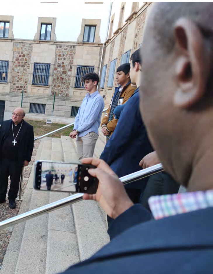
días antes de dejar España.