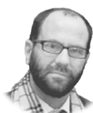
JUAN ORELLANA @joregut

De la mano de la RAI y tras su paso por el Festival de Venecia nos llega el último documental del prestigioso director italoamericano —nacido en Etiopía— Gianfranco Rosi. Rosi tiene en su haber el mérito de ser el documentalista más galardonado en los festivales de Venecia, Berlín y Cannes. Sus películas siempre han puesto el foco en los más desfavorecidos: Fuocoammare (2016) se centró en los refugiados de Lampedusa y Notturmo (2020) en las víctimas de la guerra de Siria, por citar sus últimas producciones. Vistas sus prioridades, no resulta extraño que el tema del nuevo documental sean los viajes del Papa Francisco, desde la perspectiva de su compromiso con los más necesitados. El Papa ha visitado ya casi 60 países y en sus discursos siempre ha tocado algunos de los asuntos que más interesan a Rosi: la pobreza, la solidaridad, el respeto a la dignidad humana,