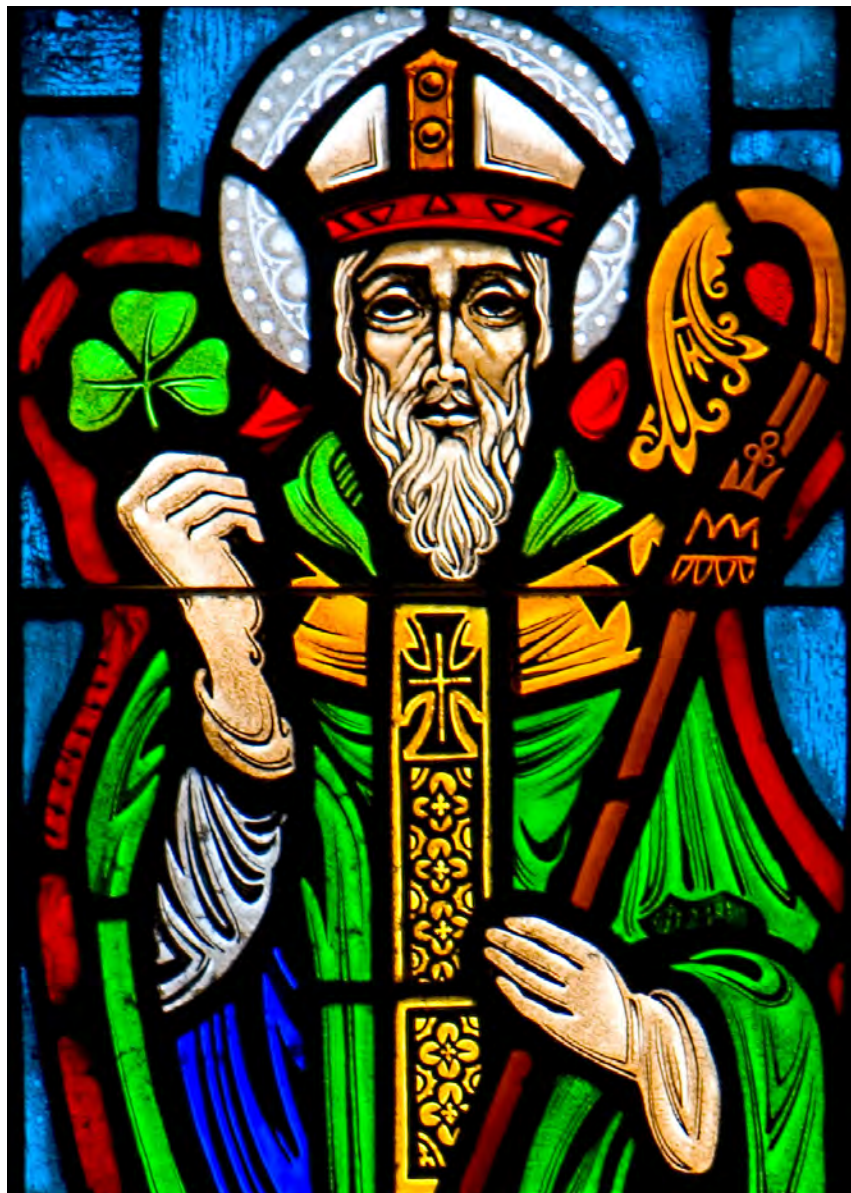
◀ San Patricio. Vidriera de la iglesia de San José en Pinole (California).

Su padre era senador y recaudador de impuestos, además de diácono, y su abuelo era sacerdote. Sin embargo, él era un joven descreído de todo lo referente a la fe. Cuando tenía 16 años, una banda de piratas llegó a su tierra e hizo prisioneros a multitud de sus habitantes. Así fue llevado a la fuerza a Irlanda hacia el año 432, donde sus nuevos amos lo mandaron al campo a cuidar ganado.