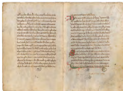
↑ Páginas de la reedición.

«El martirio es el culmen de una vida», expresa mientras paseamos por la casa, un edificio neomudéjar bien de interés cultural, inaugurado en 1909 como hospital para convalecientes pobres y en el que actualmente residen 150 hermanas. En su mano lleva el segundo volumen de Martirologio matritense del siglo XX , que será presentado el lunes 7 de noviembre, a las 19:00 horas, en la iglesia de las Calatravas. En el acto, presidido por el arzobispo de Madrid, cardenal Carlos Osoro, estará también sor Ángeles. Si el primer libro, publicado en 2019, recogía las vidas de los 408 sacerdotes y 17 seminaristas víctimas de la persecución religiosa en Madrid, este perfila una panorámica semejante de los 661 religiosas y religiosos asesinados. Muchos de ellos ya han sido reconocidos oficialmente por la Iglesia como mártires.