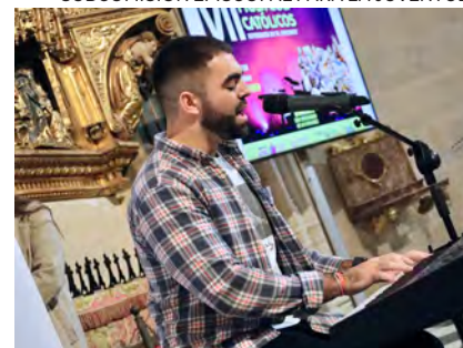
↑ Momento del encuentro de 2021.