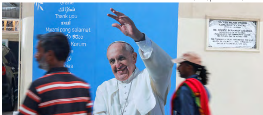
↑ Cartel de bienvenida al Papa en la iglesia del Sagrado Corazón, en Manama.