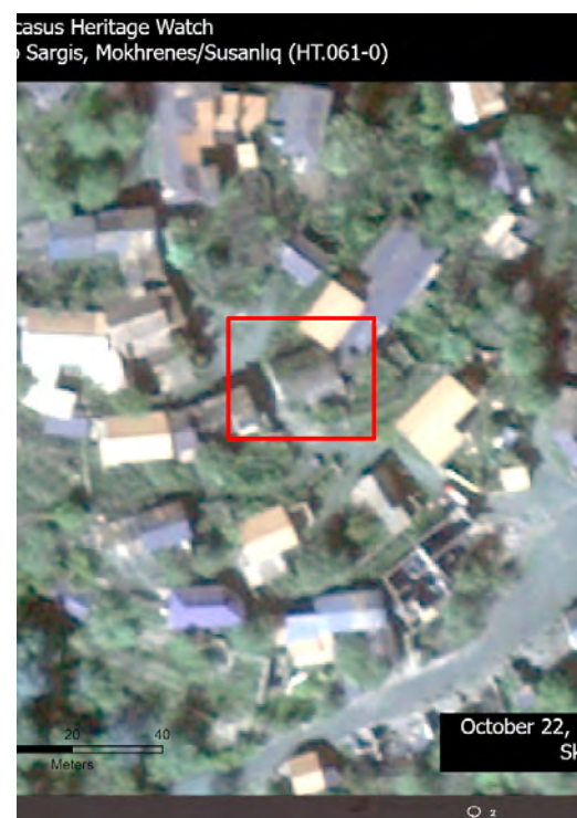
→ Destrucción de la iglesia armenia de San Sargis, en la región de Hadrut.

colación para referirse a los armenios en los ecosistemas ultranacionalistas de repúblicas postsoviéticas de población mayoritariamente musulmana como Azerbaiyán. El genocidio armenio de 1915 sigue proyectando sombras sobre la identidad colectiva de los descendientes turcos de los asesinos. De un lado, los panturrianistas niegan que ocurriera y, del otro, celebran abiertamente el genocidio.