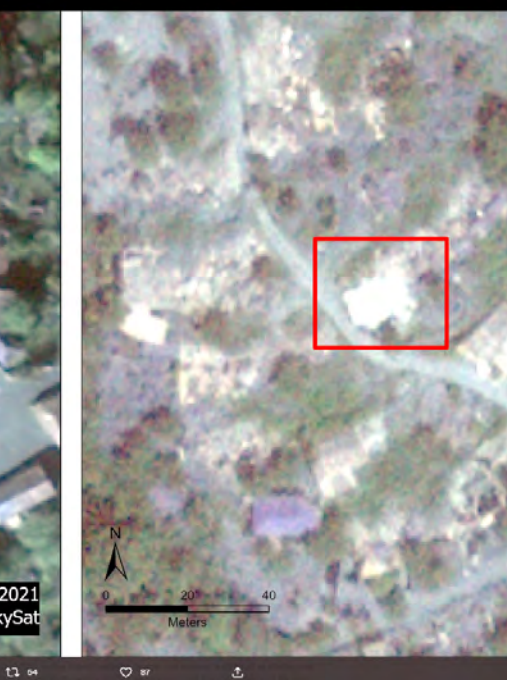
CAUCASUS HERITAGE WATCH (CHW)

por las bombas azeríes en el transcurso del conflicto, el día 8 de octubre de 2020. En aquel tiempo, los propios azeríes divulgaron en las redes vídeos donde se exhibían destruyendo una cruz en el pueblo de Arakel o disparando contra un jachkar o cruz de piedra, también en la región de Hadrut. Fueron asimismo comunes las fotografías y los vídeos que documentaban las profanaciones de tumbas y de cementerios de cristianos armenios.