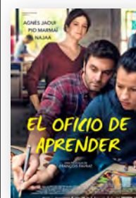
El oficio de aprender Director: François Favrat País: Francia Año: 2022 Género: Drama Pendiente de calificación

El oficio de aprender es, por tanto, una historia de superación y redención, en un marco de crítica social, y con una mirada positiva sobre el ser humano y las relaciones personales. Favrat nos la cuenta a través de una puesta en escena fresca, realista, que pivota sobre unas interpretaciones naturalistas y un cierto tono documental. Una película que arroja luz en un horizonte bastante oscuro. ●