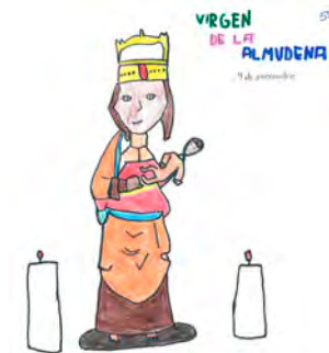
↑ Dibujo de la patrona.

En 2020, dada la imposibilidad de organizar la ofrenda floral solidaria por la pandemia, Actos Institucionales y Medios del Arzobispado pusieron en marcha una ofrenda virtual. Tras el gran éxito, se mantuvo el 2021 y se retoma este año. Los más pequeños pueden mandar dibujos, poesías, fotografías, etc. a ofrendavirtualalmudena@archimadrid.es . El material recibido se irá subiendo a la cuenta de Flickr del Arzobispado ( flickr.com/archimadrid ) y a redes sociales.