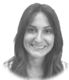
VICTORIA ISABEL CARDIEL

Su currículum es abrumador. Esta mexicana es médico cirujano con especialidad en psiquiatría, psicoanálisis y psicoterapia; tiene la especialidad en psicología criminal; un máster en perfilación de la personalidad y otro en prevención en ambientes eclesiales. Además, es licenciada en Teología. El Papa ha sumado su formación, que la coloca en la excelencia del conocimiento sobre el comportamiento de los abusadores, a la Comisión Pontificia para la Protección de Menores.