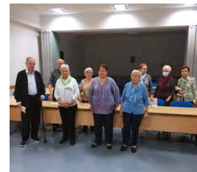
↑ Primera reunión del grupo.