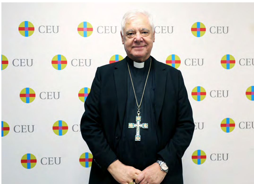
UNIVERSIDAD CEU SAN PABLO