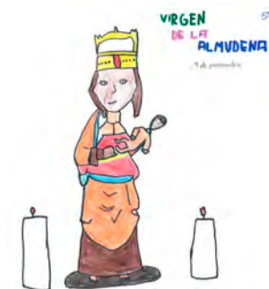
↑ Dibujo de la patrona.

En 2020, dada la imposibilidad de organizar la ofrenda floral solidaria por la pandemia, Actos Institucionales y Medios del Arzobispado pusieron en marcha una ofrenda virtual. Tras el gran éxito, se mantuvo el 2021 y se retoma este año. Los más pequeños pueden mandar dibujos, poesías, fotografías, etc. a ofrendavirtualalmudena@archimadrid.es . El material recibido se irá subiendo a la cuenta de Flickr del Arzobispado ( flickr.com/archimadrid ) y a redes sociales.