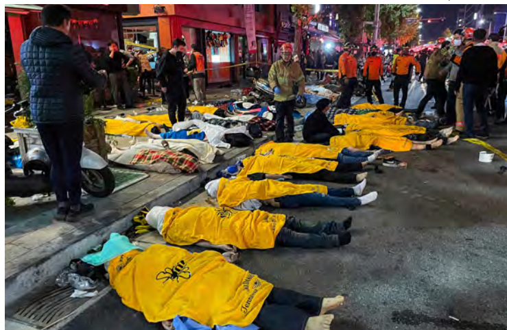
↑ Algunas de las víctimas fallecidas por aplastamiento o asfixia.

Los obispos de Corea del Sur afirmaron que «las autoridades competentes deben investigar a fondo la causa» de la estampida que se produjo en la noche del pasado sábado en Seúl y que costó la vida a más de 150 personas, mientras 350 están desaparecidas. Hasta 100.000 jóvenes se habían congregado con motivo de Halloween en algunas calles del distrito de Itaewon, donde se concentra la vida nocturna. «Debemos esforzarnos por romper el ciclo de injusticia e irresponsabilidad que se ha convertido en una práctica común en esta sociedad», subrayaron los prelados. El Papa compartió el pasado domingo un mensaje en Twitter pidiendo oraciones por las víctimas.