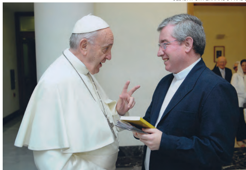
↑ El claretiano conversa con el Papa en uno de sus encuentros.