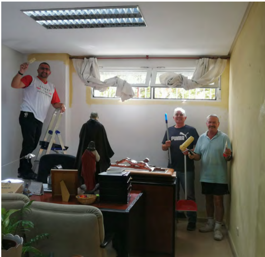
PARROQUIA INMACULADA CONCEPCIÓN DE NUESTRA SEÑORA

← El párroco (izquierda) pinta su despacho con la ayuda de dos voluntarios.