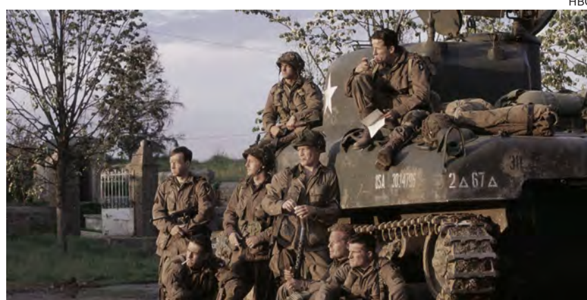
↑ Los soldados de la compañía Easy en un fotograma de la serie.

Desde finales de octubre y hasta el día 11 de noviembre todos los habitantes de reinos de la Commonwealth visten sus prendas con la amapola escarlata, la llamada Poppy , festejando el Remembrance Day, día de recuerdo a los sacrificios hechos en los tiempos de guerra por civiles y soldados. Hoy les animo a unirse a mí —ya— tradición de