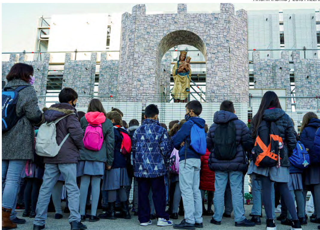
↑ El año pasado, todavía con mascarilla, muchos niños se acercaron a llevar flores a la Virgen.