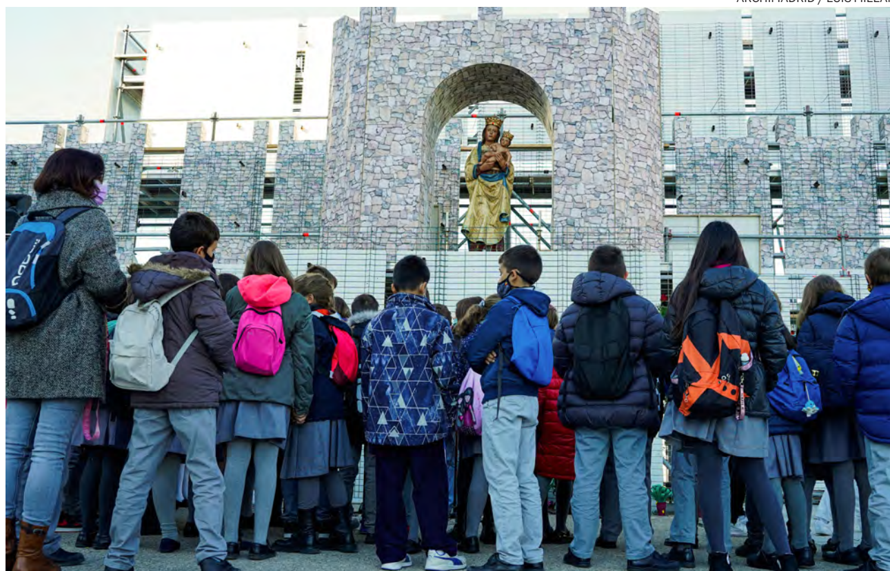
↑ El año pasado, todavía con mascarilla, muchos niños se acercaron a llevar flores a la Virgen.