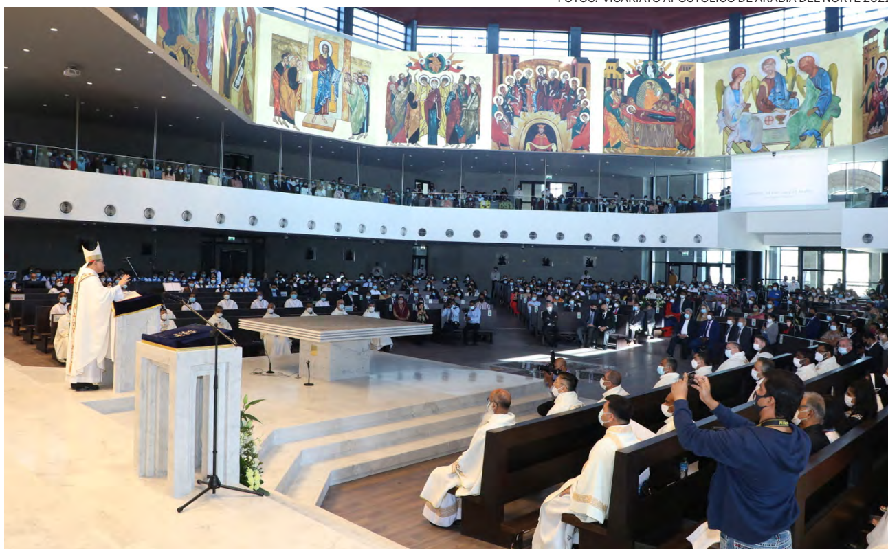
↑ Dedicación de la catedral de Nuestra Señora de Arabia, en Awali, presidida por el cardenal Tagle, en diciembre de 2021.