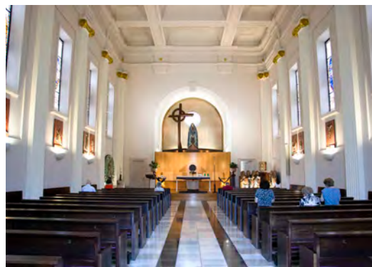
← El interior fue remodelado en 2014 con un moderno retablo.