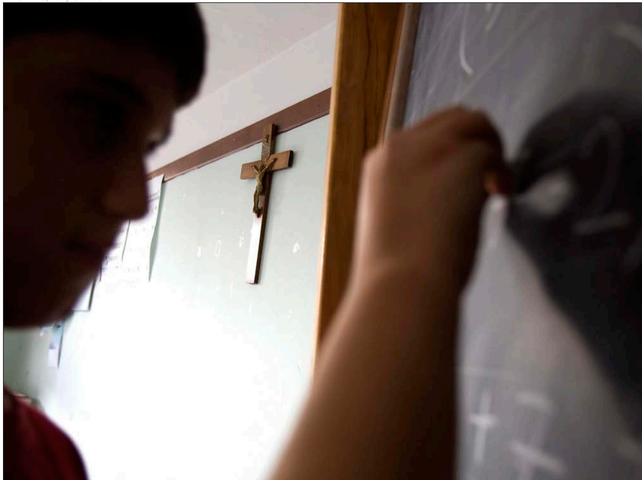
La asignatura de Religión no es obligatoria, aunque los centros escolares tienen que ofertarla

▼ Obispos y sindicatos de profesores han tenido que interponer recursos para que los gobiernos autonómicos respeten el estatus de la asignatura. Aragón, Andalucía, Asturias, Baleares o Extremadura son algunas de las regiones donde hay contenciosos abiertos