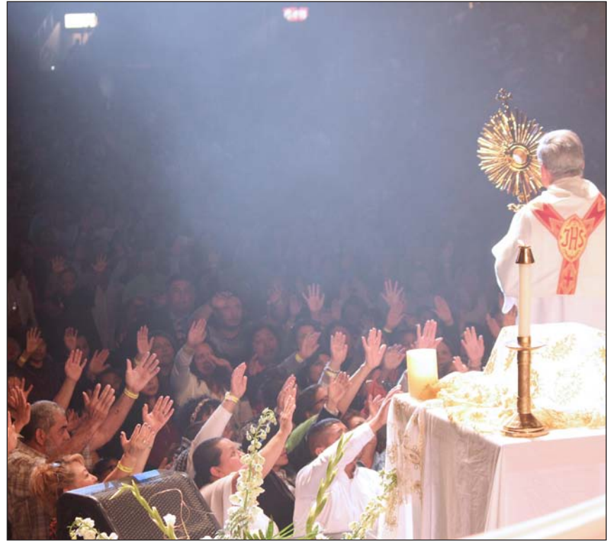
El sacramento del Perdón y la adoración al Santísimo, piezas centrales del Sábado de Milagros