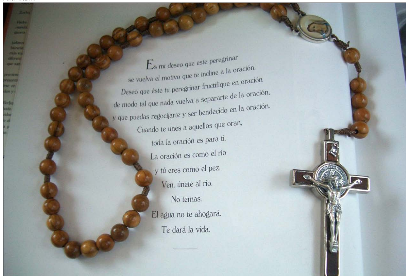
Foto hecha por Rafa tras su primer viaje a Medjugorje: una oración y el rosario. Abajo, durante una manifestación provida