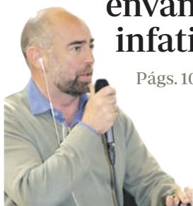
Alfa y Omega