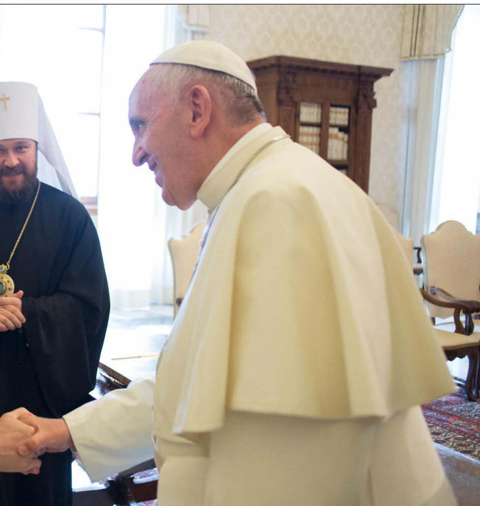
metropolitano Hilarión, responsable de Relaciones Exteriores del Patriarcado de Moscú

do que en Chieti se revise la cuestión de las Iglesias católicas de rito oriental, en particular la ucraniana. ¿Puede ser un obstáculo para la reunión?