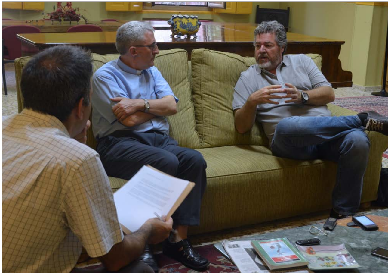
Un momento del encuentro

bate sobre el cambio climático estaba en la sociedad, no tenía sentido que estuviera ausente del debate político. Las decisiones se toman en los ayuntamientos y en los parlamentos, así que vimos que había que estar ahí, sobre todo después de una experiencia compartida con otros movimientos que, en España, dieron lugar al 15M.