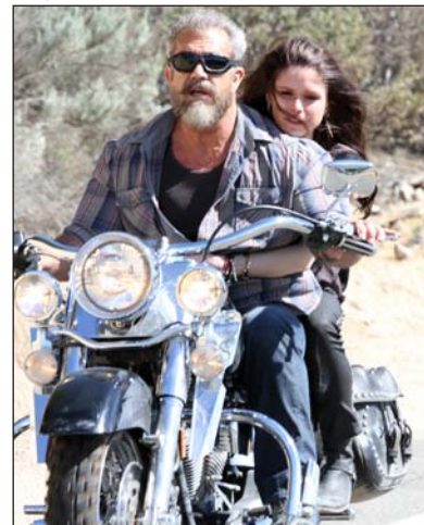
Mel Gibson y Erin Moriarty