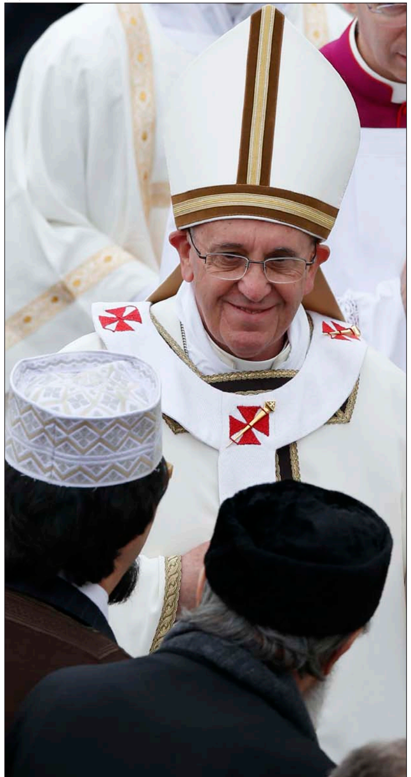
El Papa Francisco en Asís en octubre de 2013