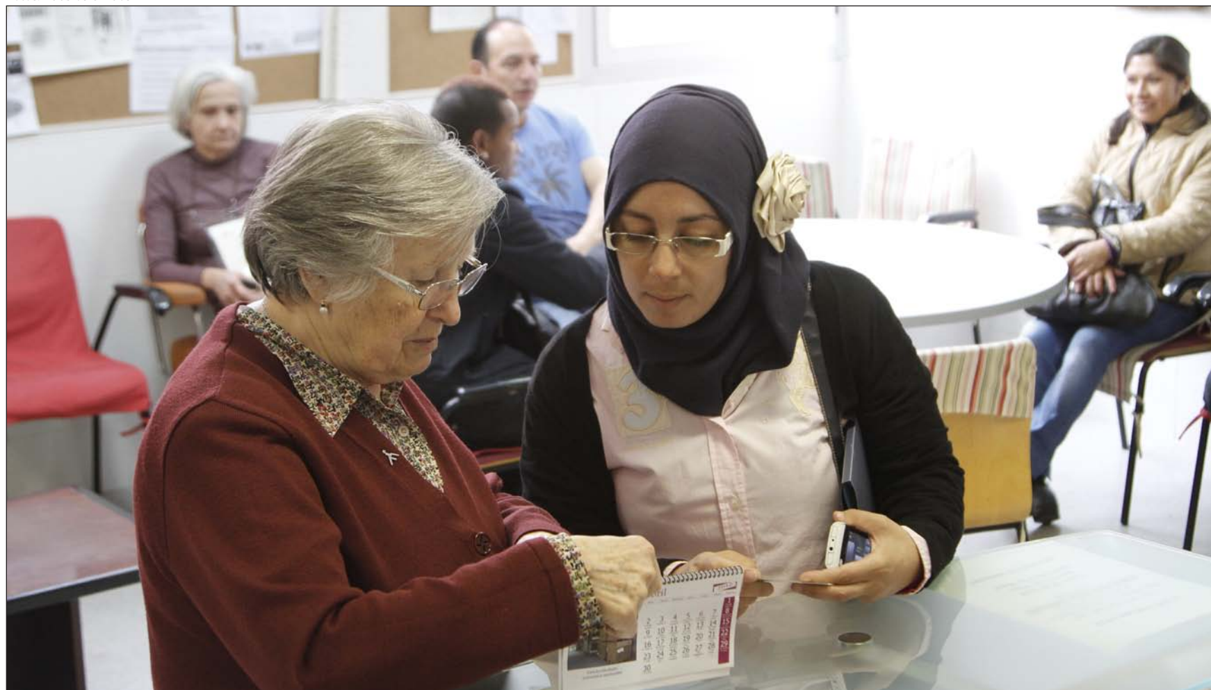
La ONG jesuita Pueblos Unidos tiene entre sus beneficiarios a numerosos creyentes de otras religiones, fundamentalmente musulmanes