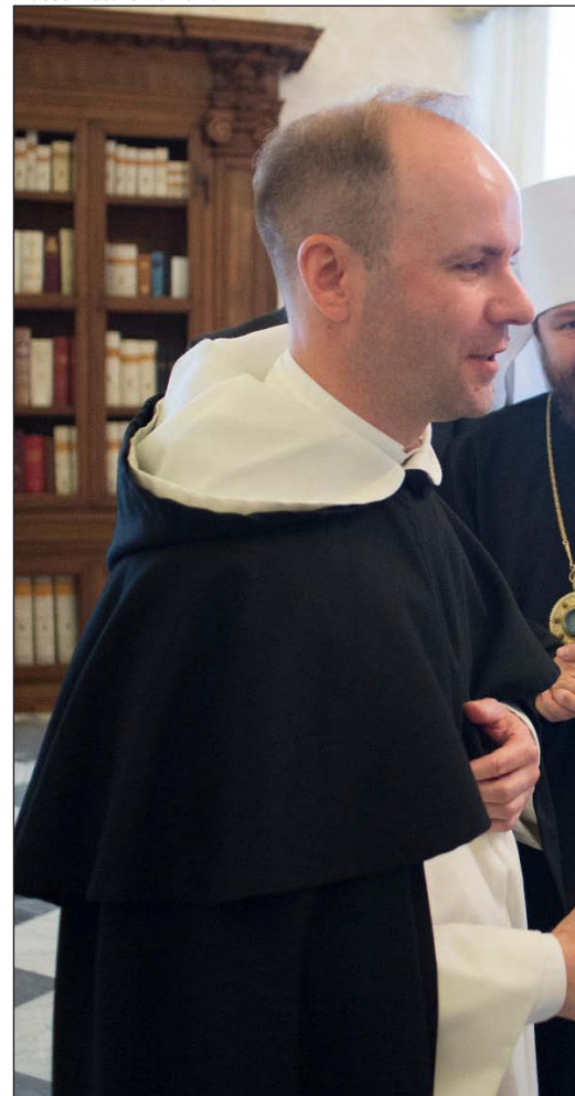
El padre Destivelle con el Papa Francisco y el metropolitano de Chieti

un lado, está su insistencia en la sinodalidad interna de la Iglesia católica: el Sínodo de Obispos, las conferencias episcopales, los sínodos diocesanos. Por otra parte, el Santo Padre presenta a menudo el diálogo ecuménico como un camino que hacemos juntos con los otros cristianos –un syn-ode , un camino común –. Podemos decir que hay una especie de sinodalidad externa vinculada a la interna.