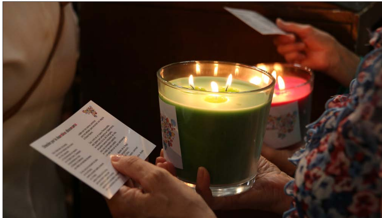
La Catedral Nueva de Salamanca acogió la Eucaristía de apertura de las sesiones finales de la asamblea diocesana

▼ Algunas como Salamanca o Valencia abordan las últimas etapas de sus asambleas; mientras, en Santiago de Compostela se preparan para un Sínodo, el primero en más de un siglo. Otras continuarán con los planes iniciados en años anteriores. El objetivo: renovación y revitalización de la vida diocesana y de la misión