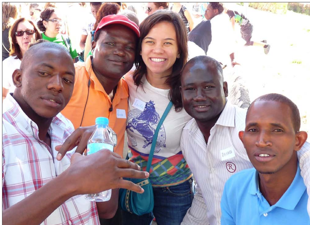
En el programa Baobab se comparte la celebración de fiestas cristianas y musulmanas