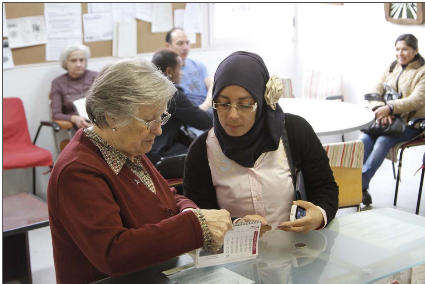
Pueblos Unidos atiende en el barrio de Ventilla a una importante comunidad musulmana