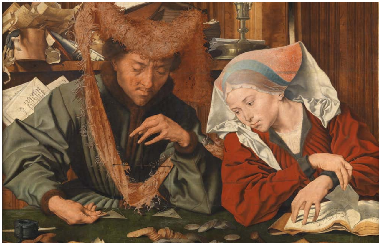
El cambista y su mujer, de Marinus van Reymerswaele

Este texto es considerado uno de los más difíciles y enigmáticos del Evangelio de Lucas. Está enmarcado entre la parábola del hijo pródigo y la parábola del rico epulón, que tienen como común denominador el tema del dinero. Mientras que en las dos parábolas mencionadas Jesús se dirige a los escribas y fariseos, en esta Palabra sin embargo se dirige a sus discípulos. ¿Qué les quiere enseñar?