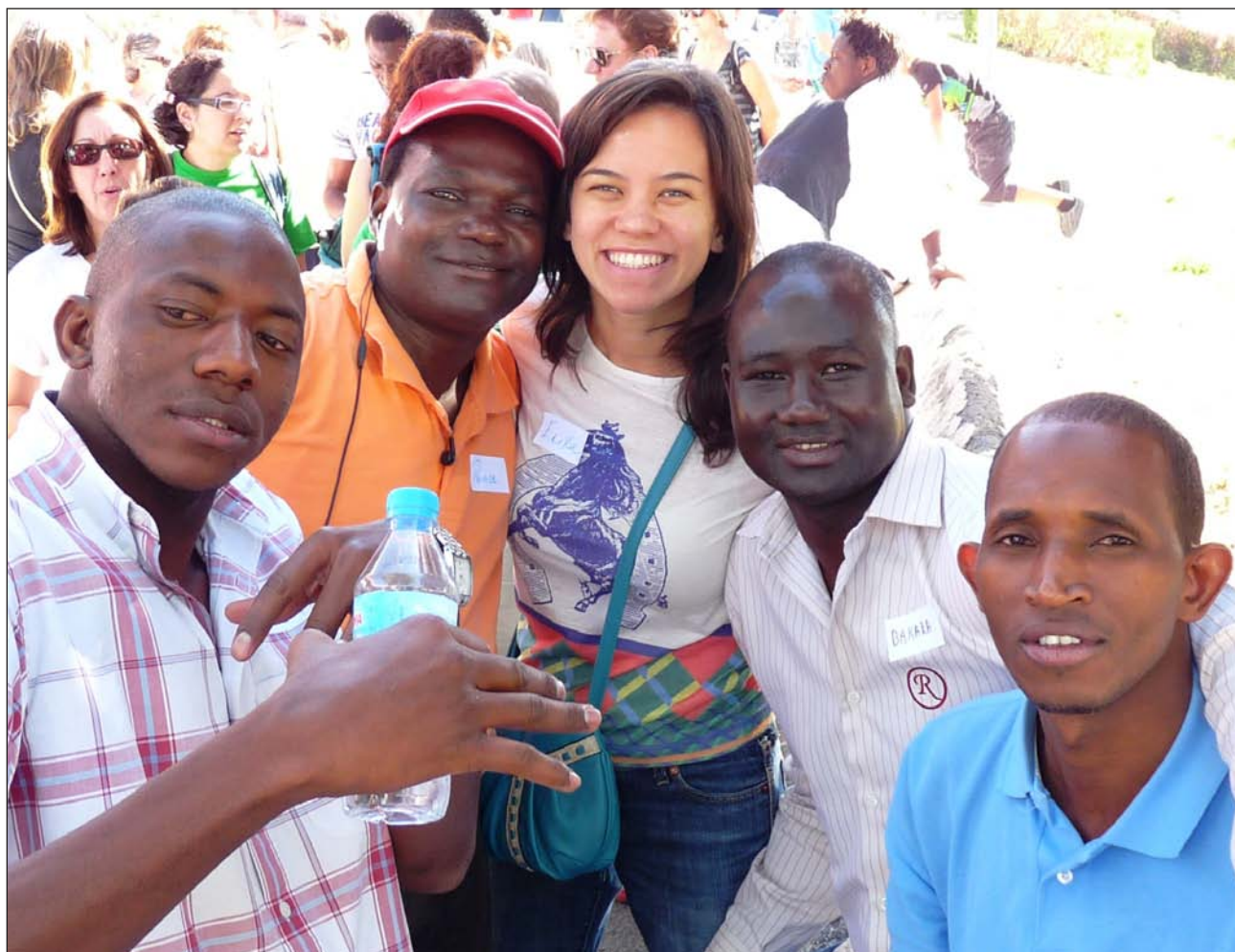
El programa Baobab trabaja el diálogo interreligioso a través de encuentros mensuales

sa, se le ocurrió que sería interesante encontrarse con todos los líderes religiosos de la zona. Con ayuda de los servicios sociales del Ayuntamiento lo logró y no solo eso, sino que durante la reunión abordaron la cuestión de la caridad de modo que pudieran coordinarse para atender mejor y evitar duplicidades. «Ese encuentro sirvió para conocernos e iniciar una relación y para evitar la profesionalización de la caridad en el barrio. Luego el Ayuntamiento quiso organizar una especie de oraciones comunes que al final se convierten en un rebozo de todo, pero no era lo más adecuado. Al final, lo que pretendemos es, siguiendo el modelo de Asís, recalcar los puntos comunes en la defensa de la paz y la no violencia. Así, nadie tiene que renunciar a nada propio», explica.