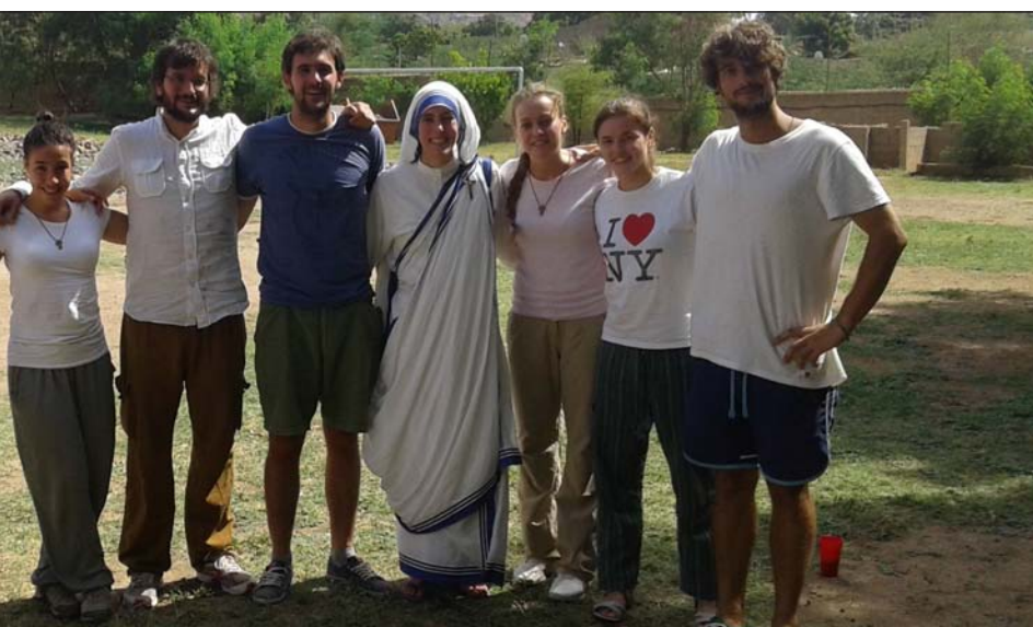
por la derecha, el año pasado en Etiopía