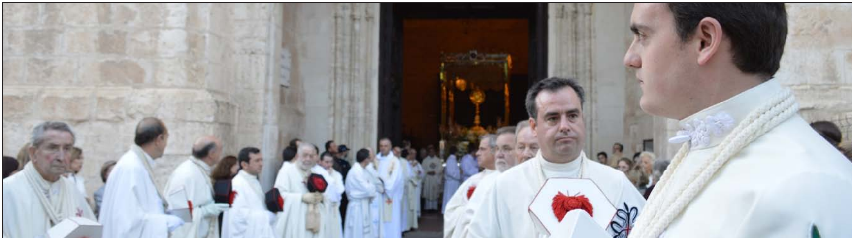
Órdenes militares en la procesión del Corpus de Ciudad Real en 2015

Hace unas semanas monseñor Gerardo Melgar Viciosa tomaba posesión como obispo de Ciudad Real y prior de las órdenes militares españolas, cuyos emblemas figuran ya en el escudón central del escudo episcopal. Para el hombre de hoy las órdenes de Santiago, Calatrava, Alcántara y Montesa son algo completamente desconocido y, en el mejor de los casos, un tema arcaico de novela de ficción.