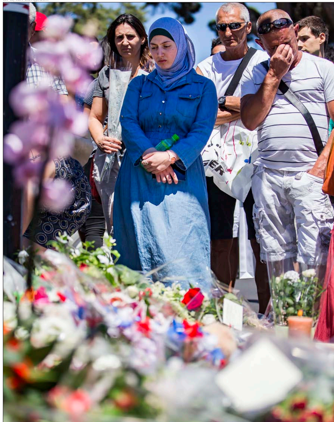
Desde el viernes las oraciones se suceden en el paseo de los Ingleses de Niza