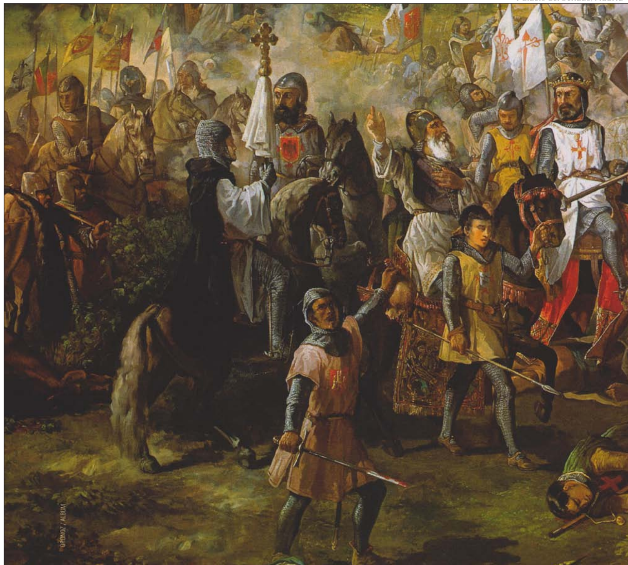
Detalle del cuadro Las Navas de Tolosa , de Francisco de Paula van Halen y Gil (Palacio del Senado), en el que se aprecian los estandartes de las órdenes de Santiago y Calatrava