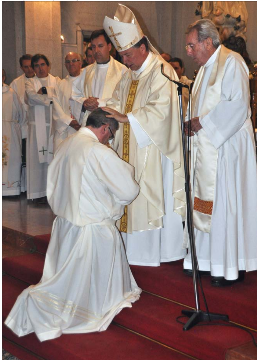
Momento de la ordenación diaconal, el 21 de mayo

des explicar. Estar consagrado significa ser imagen en el mundo de Cristo servidor, configurar tu vida para la caridad y el servicio, ayudar al sacerdote para que pueda celebrar los sacramentos con la mayor dignidad, también predicar –que no es simplemente decir lo que piensas–...». Y todo