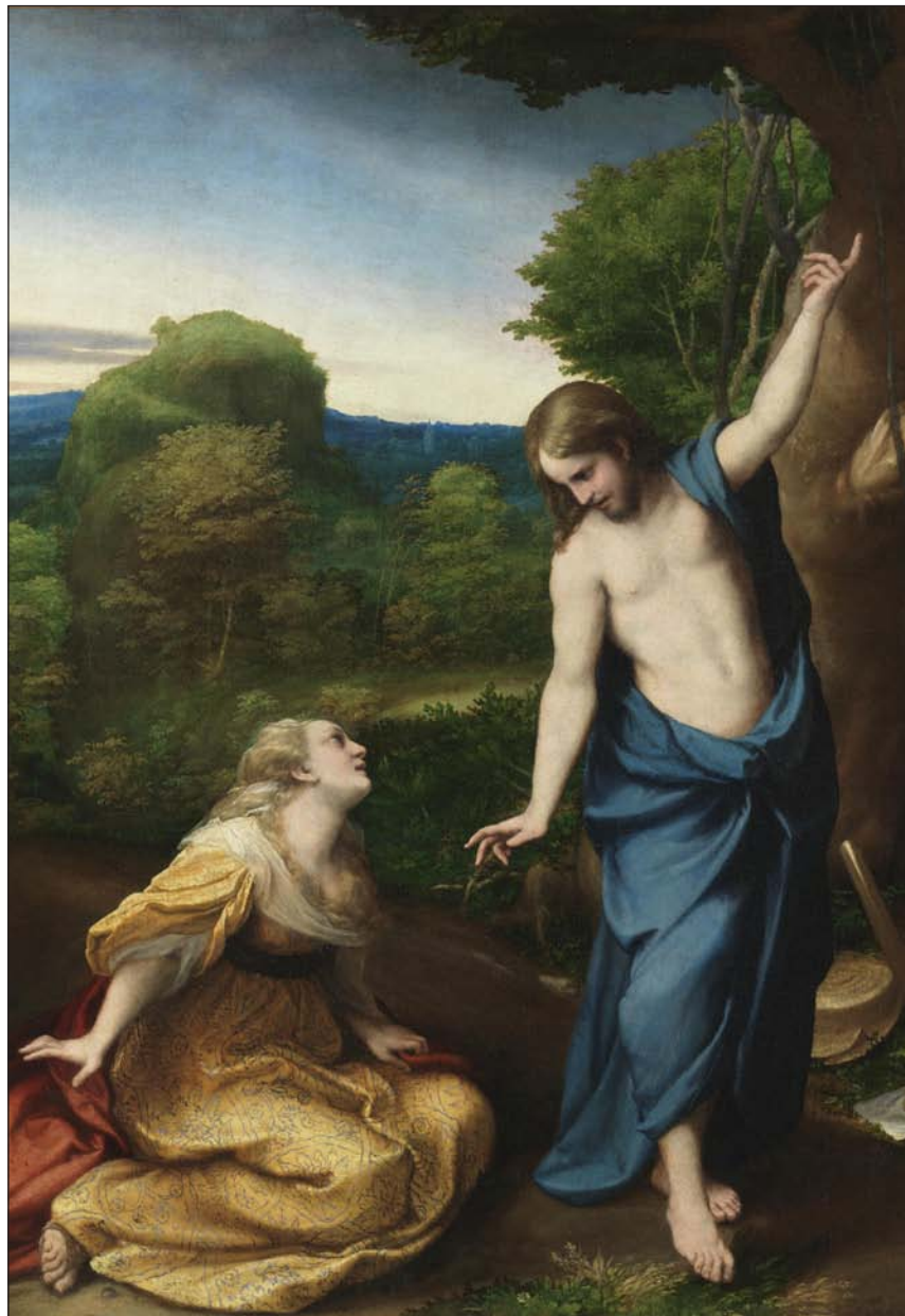
Noli me tangere, de Correggio