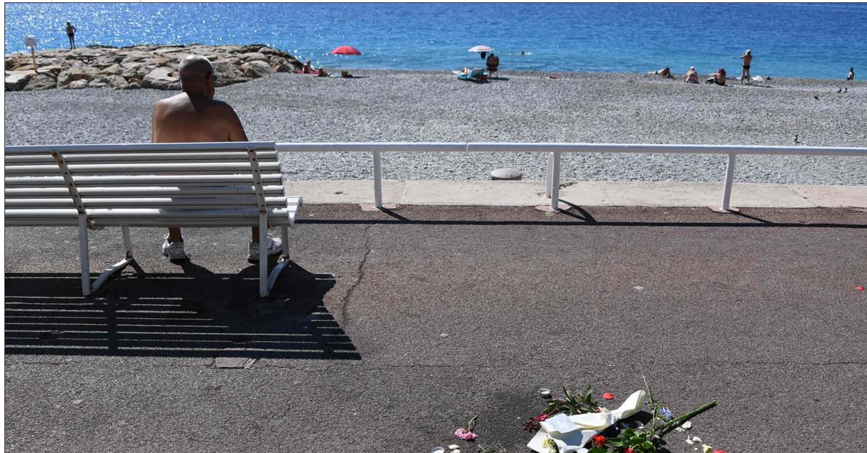
Unos disfrutan de la playa y otros viven el luto durante el fin de semana en una de las ciudades más turísticas de Francia