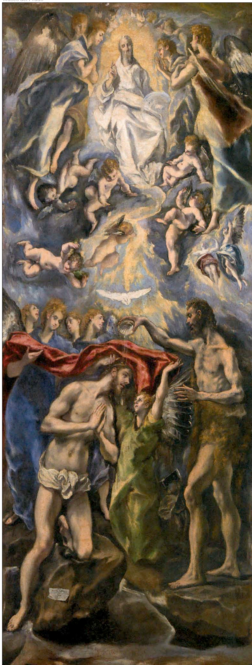
El Bautismo de Jesús , de El Greco