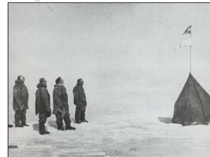
Norwegian Polar Institute

Muchos aventureros «aceptan que tiene que haber algo que nos gobierna y nos dirige. En el fondo es reconocer que Dios está por encima de nosotros»