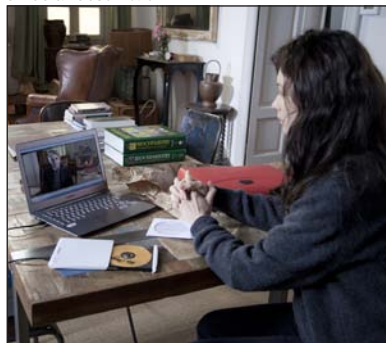
Olga Kurylenko y Jeremy Irons