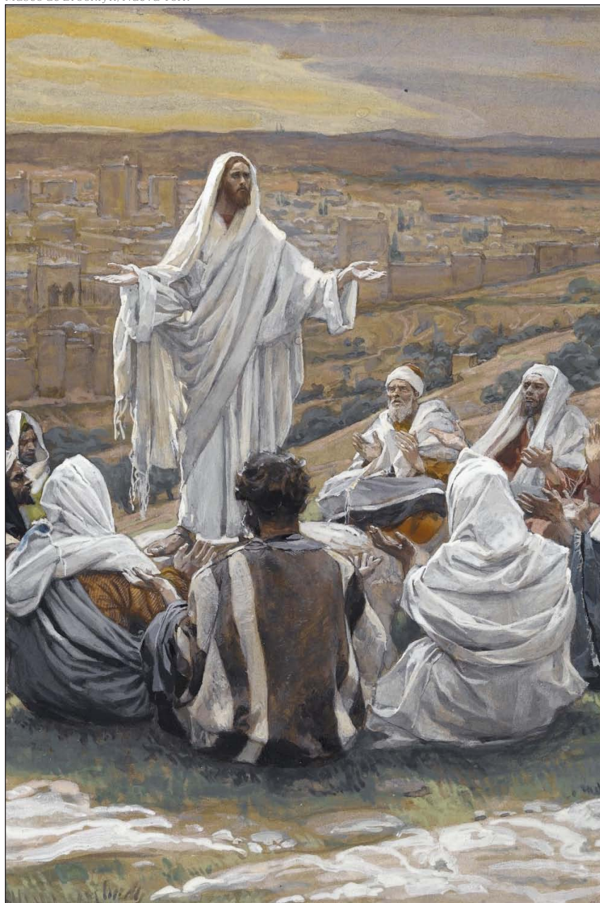
El padrenuestro, de James Tissot