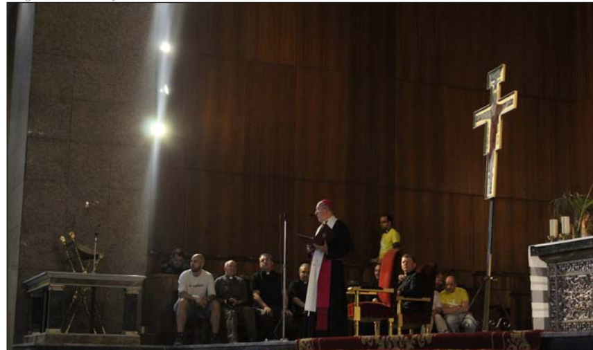
Monseñor Osoro envía a los peregrinos madrileños, el sábado 16 de julio