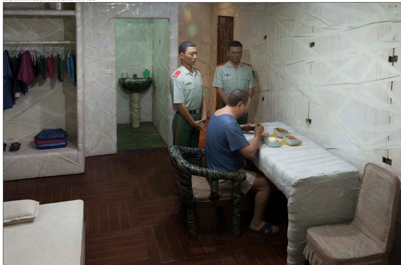
Imagen del interior de la celda titulada Cena , parte de la instalación del artista chino Ai Weiwei en la catedral de Cuenca