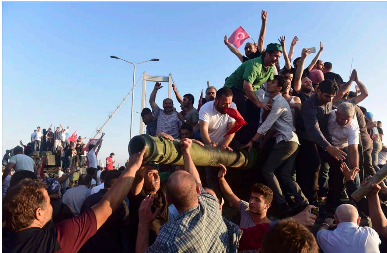
Partidarios del presidente de Erdogan celebran el fracaso del golpe de Estado el 16 de julio en Estambul