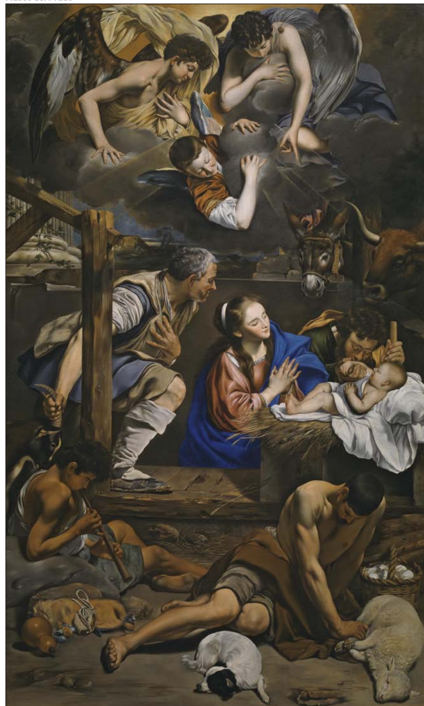
La adoración de los pastores , de Juan Bautista Maíno