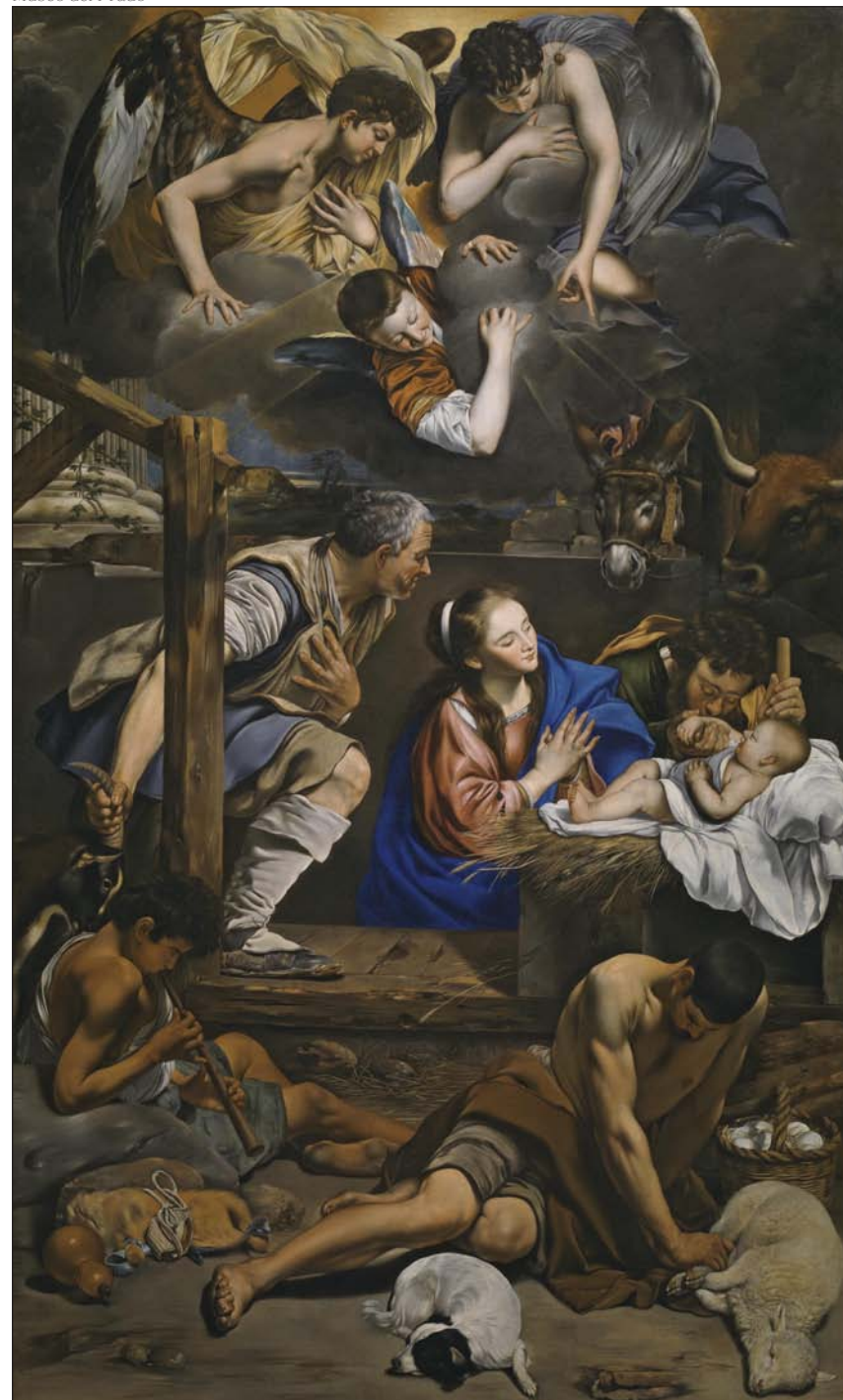
La adoración de los pastores , de Juan Bautista Maíno