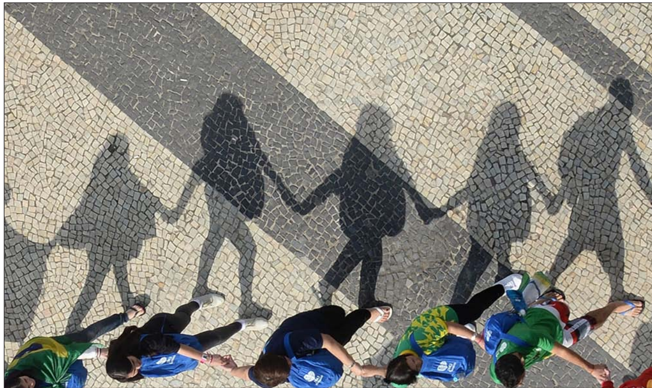
Cadena de jóvenes en la JMJ de Río 2013