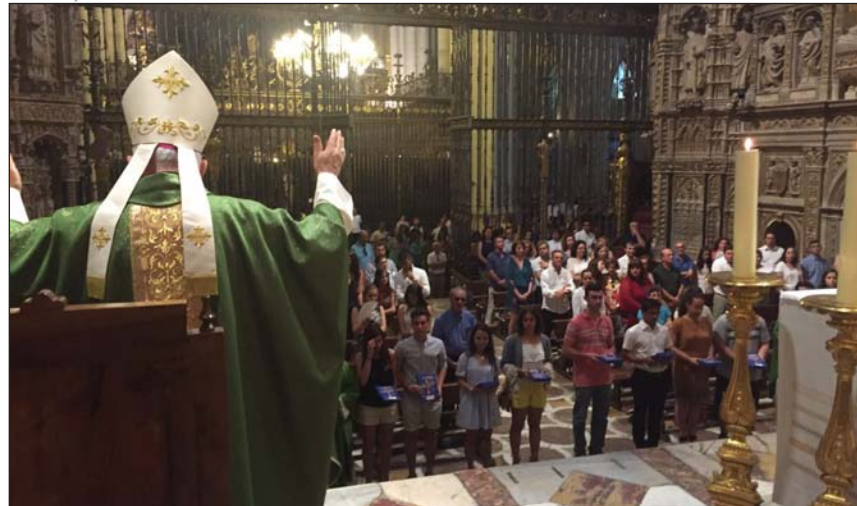
Los jóvenes de Toledo, que viajan con la CEE, son enviados por su arzobispo el día 10