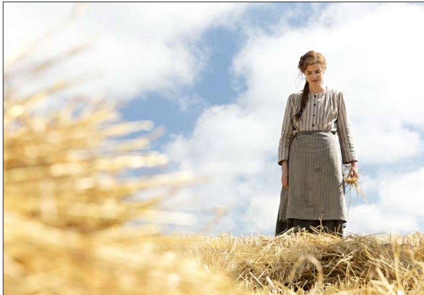
La actriz Agness Deyn es Chris Guthrie en Sunset Song

busca la felicidad en un mundo que tiene pensado para ella un destino diferente.