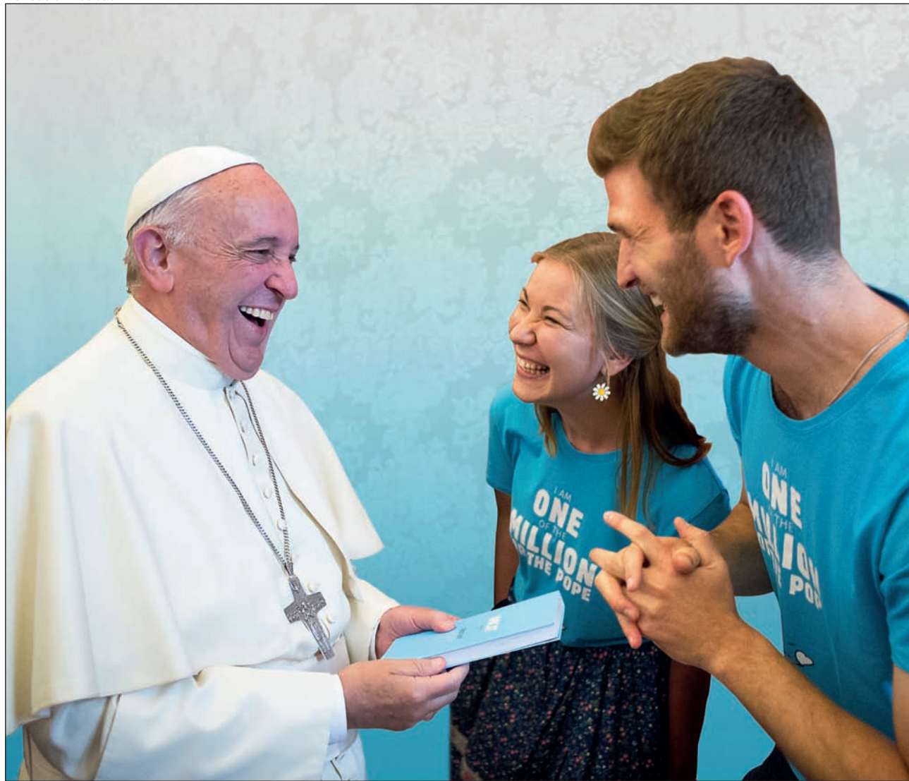
Dos jóvenes entregan al Papa un ejemplar del Docat el pasado 17 de junio