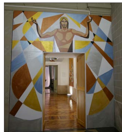
Puerta de entrada al Tránsito