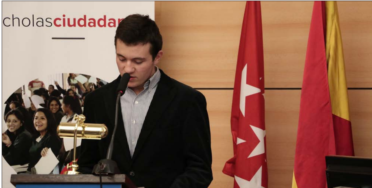
Uno de los alumnos que el viernes leyeron el documento final de Scholas Ciudadanía ante las autoridades políticas y educativas, y que el 3 de febrero presentarán al Papa en el Vaticano