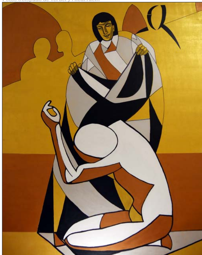
El buen samaritano