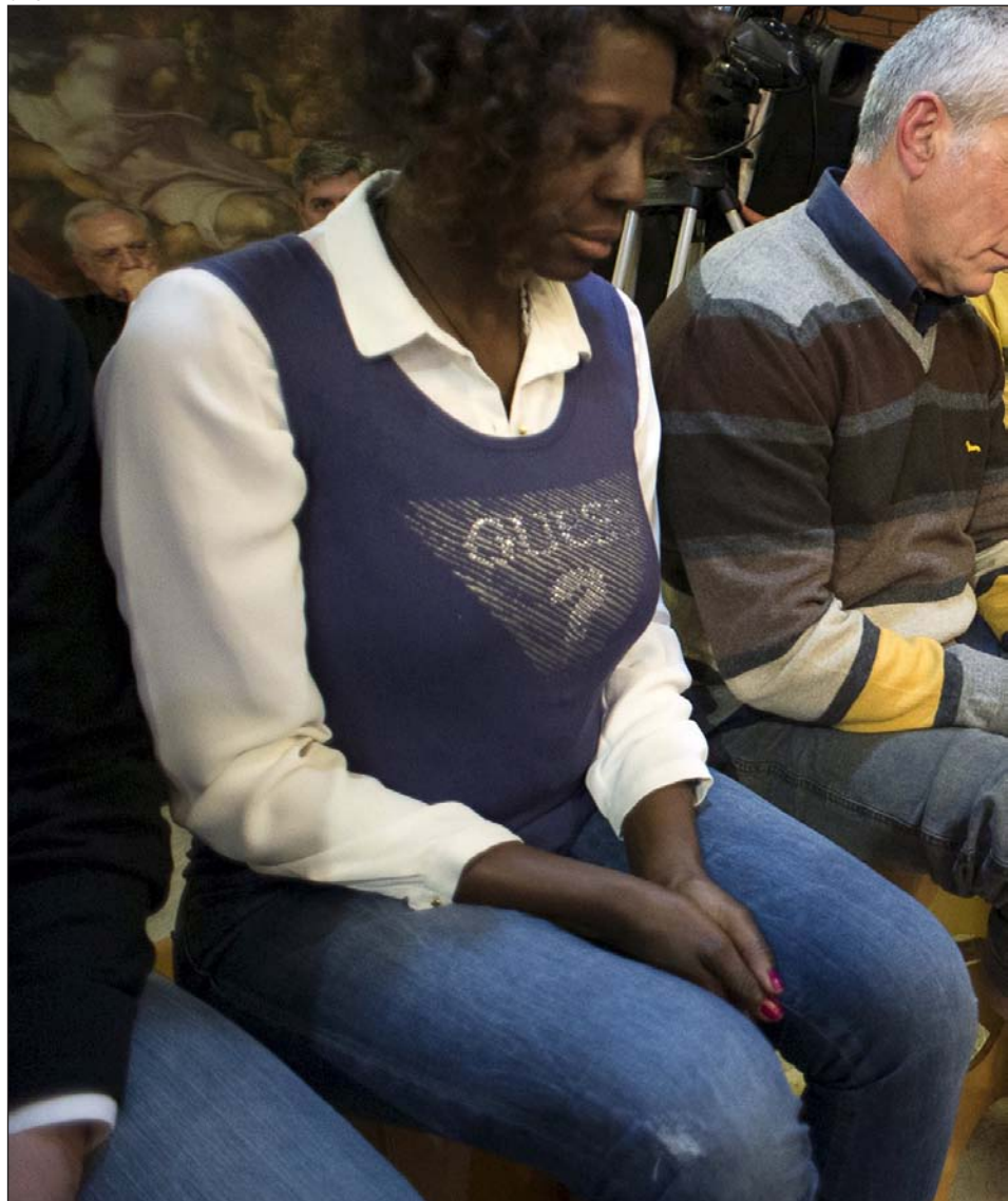
El Papa lava los pies a una mujer en la prisión de Rebibbia, el Jueves Santo de 2015

dificada la rúbrica según la cual las personas elegidas para recibir el lavatorio de los pies deben ser hombres o muchachos, en modo tal que de ahora en adelante los pastores de la Iglesia puedan elegir a los participantes en el rito entre todos los miembros del pueblo de Dios. Se recomienda además que a los elegidos sea ofrecida una adecuada explicación del significado del rito mismo», añade en la carta.