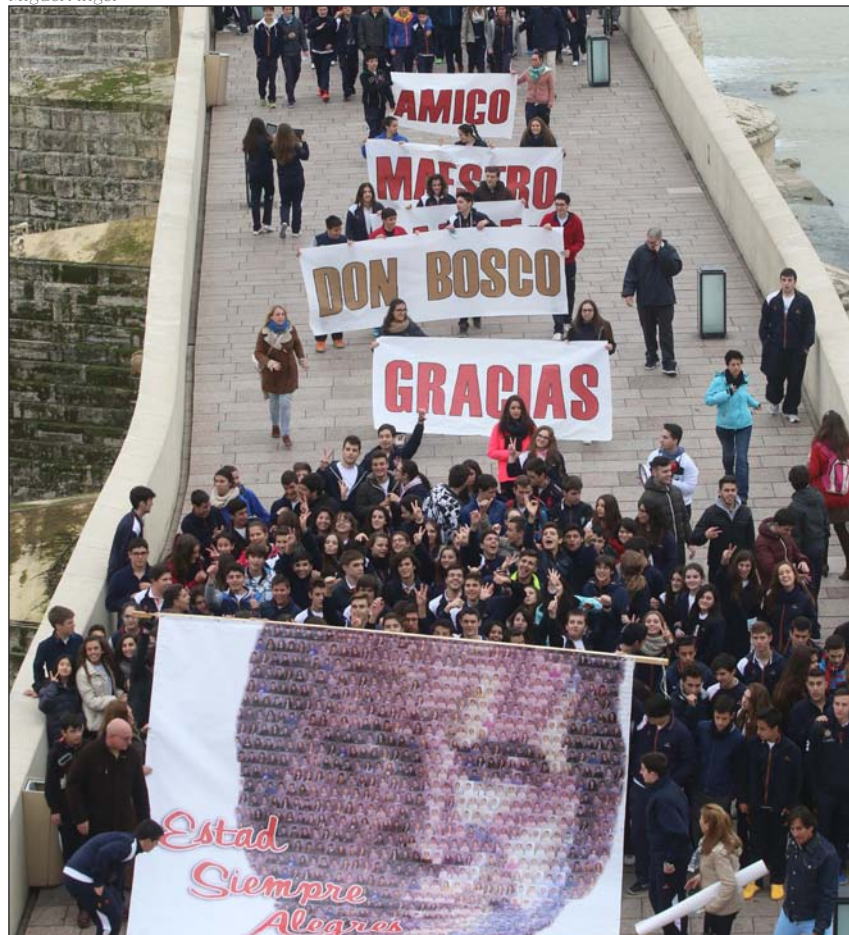
Alumnos del colegio salesiano de Córdoba celebrando el bicentenario

rante ella, las actividades de colegios y grupos de jóvenes de la congregación giran en torno a la idea de que «Dios tiene un proyecto para ellos», cuenta Valiente.