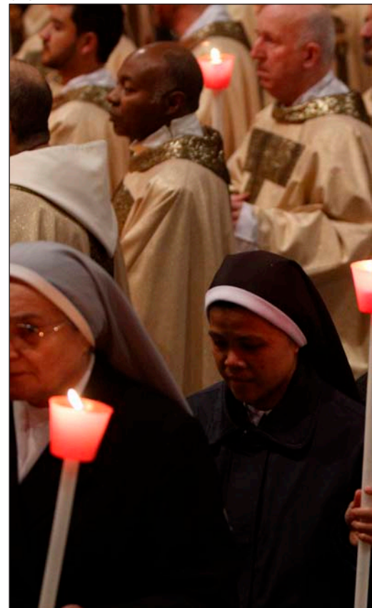
Jornada de la Vida Consagrada, febrero de 2015

Después de un complejo y nunca terminado proceso de renovación, este Año ha supuesto una forma de tomarse el pulso y de seguir caminando con renovada ilusión