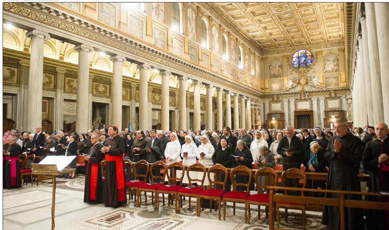
Apertura del Año de la Vida Consagrada, en Santa María la Mayor, el 29 de noviembre de 2014

▼ El 2 de febrero se clausura el Año de la Vida Consagrada, que ha supuesto un momento importante del pontificado de Francisco, aunque el evento no haya armado el lío que quizá algunos habrían esperado