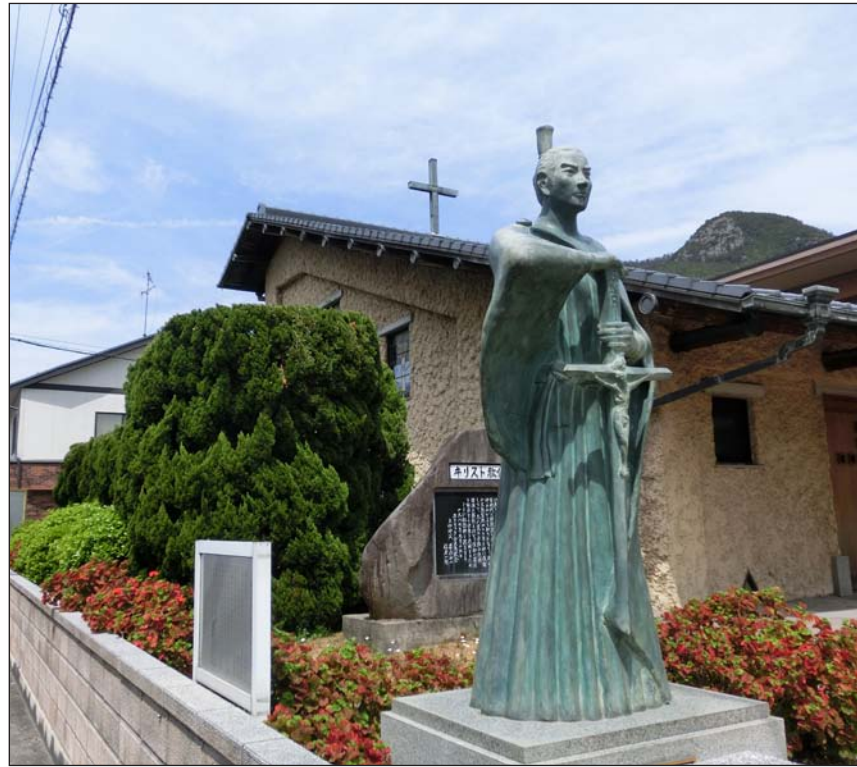
Escultura de Justo Takayama Ukon, en la diócesis de Osaka (Japón)