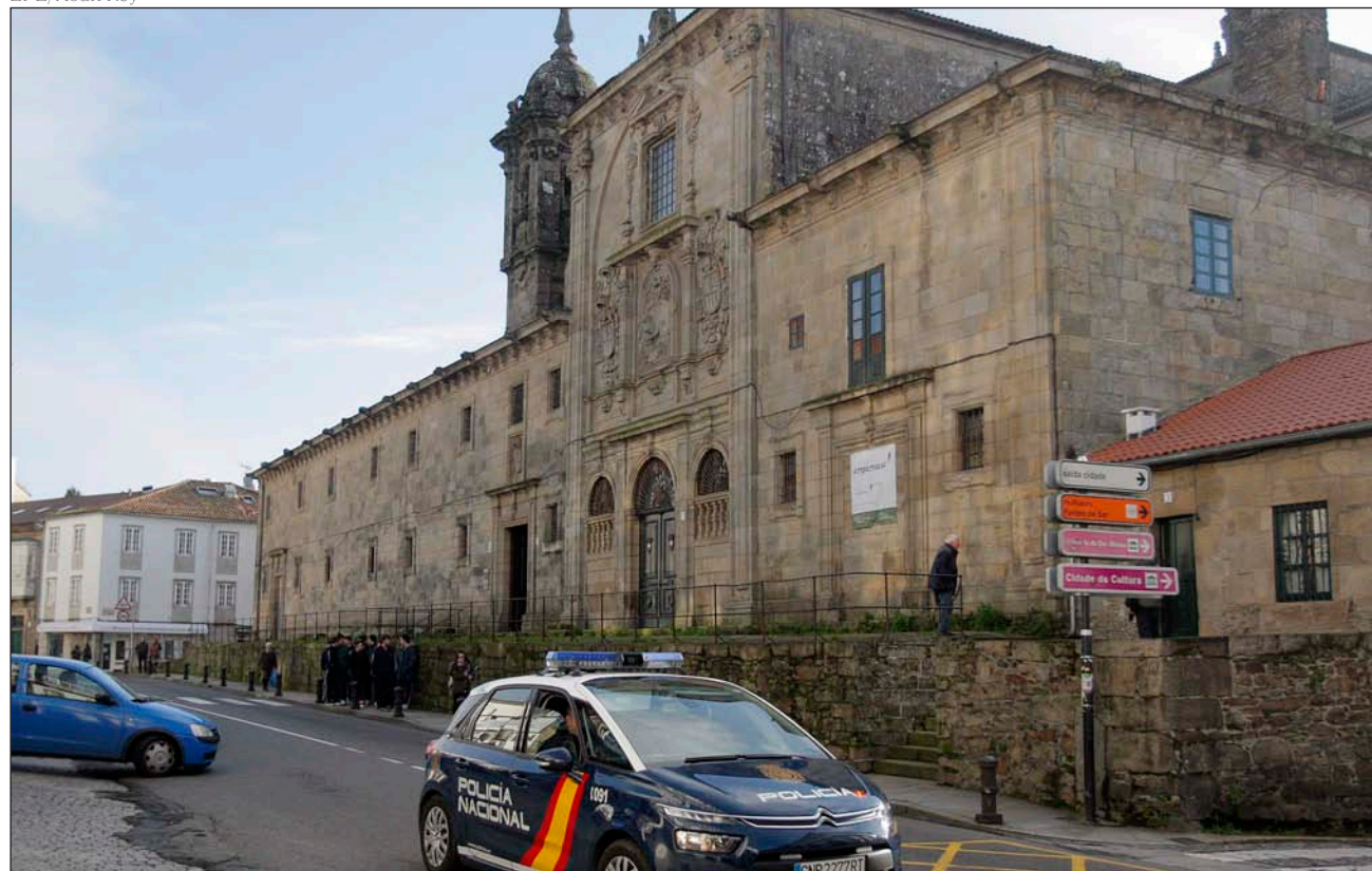
Un coche de Policía pasa junto al convento de las Madres Mercedarias de Santiago