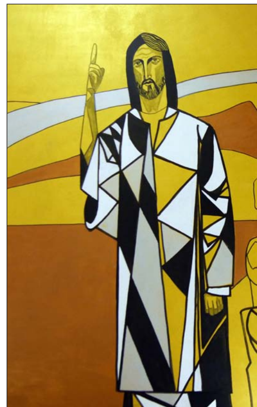
El Sermón de la montaña

La Puerta Santa de la catedral de Teruel acoge un tránsito sobre el amor de Dios