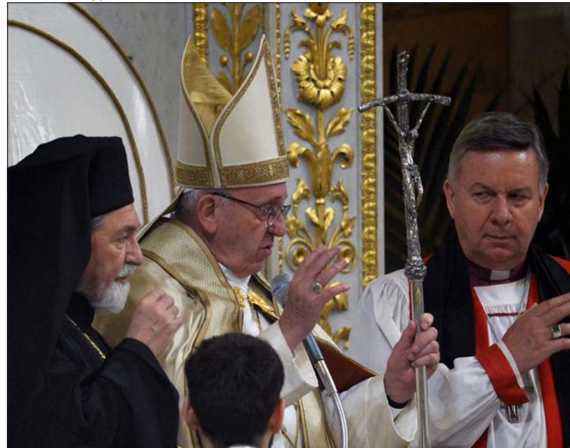
El Papa clausura la Semana de Oración por la Unidad de los Cristianos, el lunes