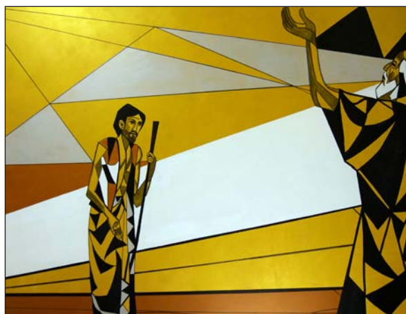
El hijo pródigo