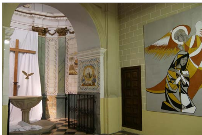
Montaje final, junto a María, Madre de la Misericordia

Un gran lienzo de Dios Padre, con el rostro de Jesús, observa desde la