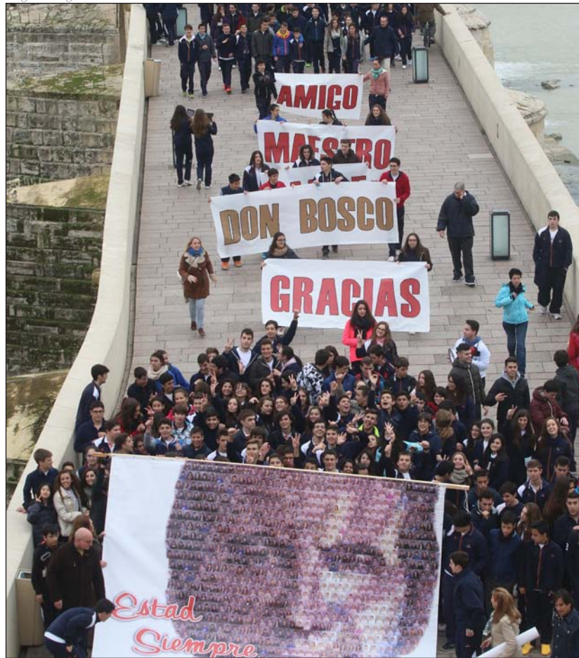
Alumnos del colegio salesiano de Córdoba celebrando el 200 aniversario del nacimiento del fundador

salesianos han dado vida al santo y a los distintos personajes que se cruzaron en su camino.