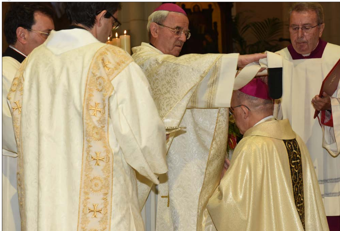
Monseñor Osoro recibe el palio de manos del Nuncio Renzo Fratini el 1 de noviembre de 2015 en la catedral de la Almudena