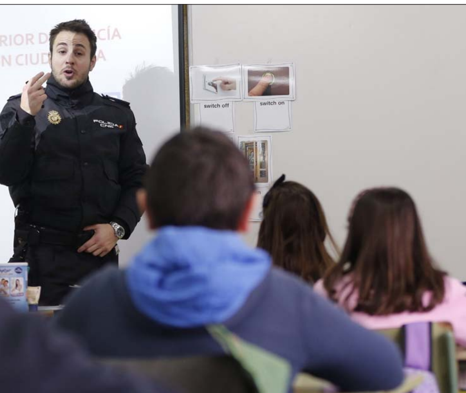
alumnos de un colegio público en Madrid

igual que yo y me hice su amigo. Tenía más amigos en el móvil que en la vida real». Después vinieron más cortes e intentos más serios. Cualquiera podía ser el definitivo. El suicidio de un amigo fue el primer golpe, pero más impactante fue la muerte de su mejor amiga: «Fui la última persona con la que habló. Me dijo: "Ya no puedo más. Es insostenible. Tú eres bueno; ayúdame a que otros no hagan lo que voy a hacer ahora". Y saltó por la ventana».