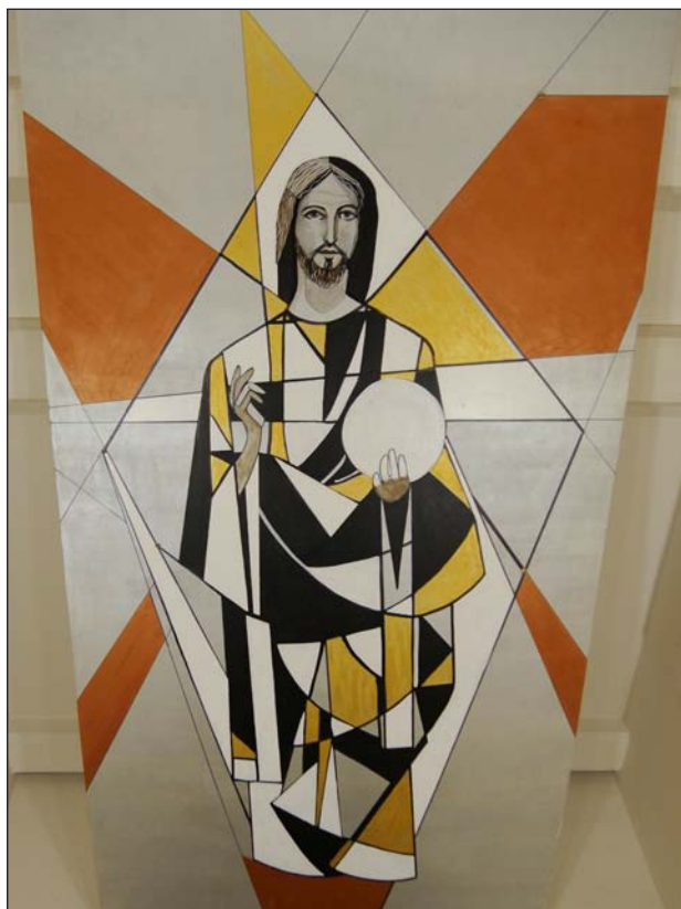
Misericordiosos como el Padre