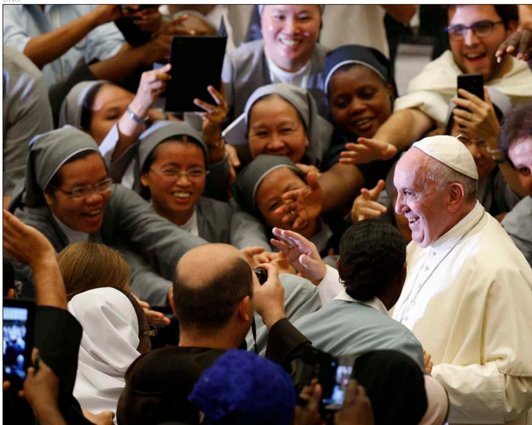
El Papa durante un Congreso internacional de jóvenes consagrados, en septiembre de 2015

nerse en camino con determinación. No cabe estar estancados.