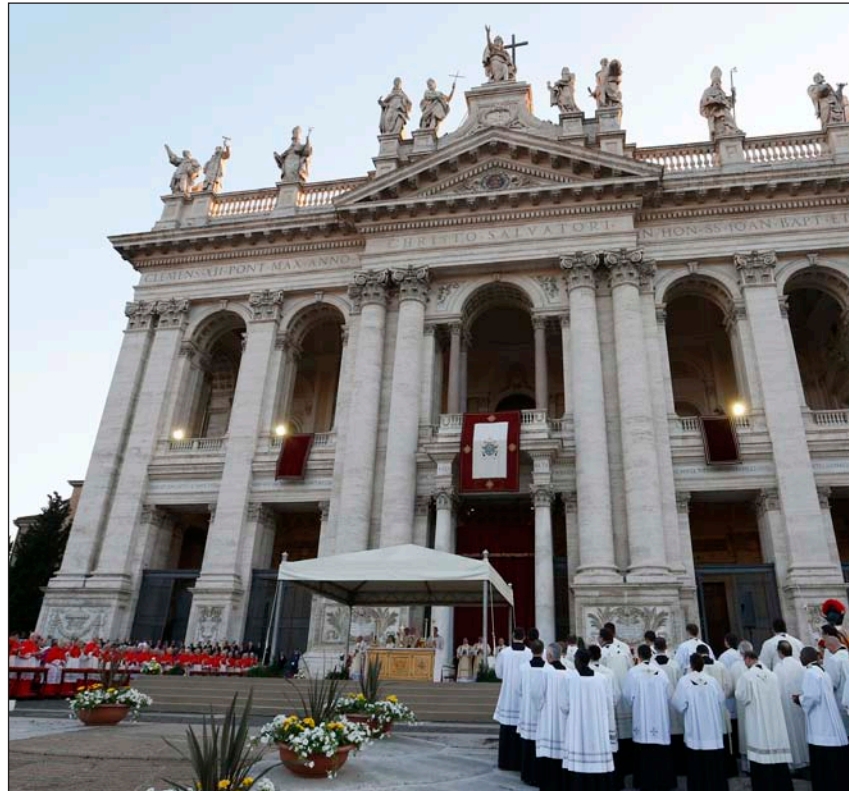
El Papa Francisco preside la Eucaristía de Corpus Christi en San Juan de Letrán

el obispo enseña la doctrina cristiana– y hacia la mesa del altar, donde se actualiza el misterio de la Cruz gloriosa del Señor. Por eso, las cinco naves ofrecen lugar diferenciado a los distintos miembros del pueblo santo: los presbíteros, los diáconos, los catecúmenos, las viudas, las vírgenes consagradas, etc.