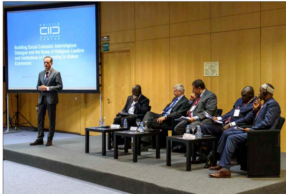
Intervención del embajador Álvaro Albacete en la reunión del Club de Madrid