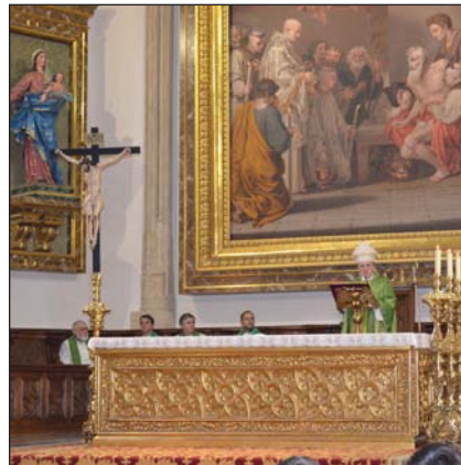
El arzobispo durante la Eucaristía