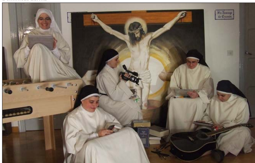
Las dominicas de Lerma que envían por whatsapp cada día El reto del amor

Todos ellos conforman «una familia espiritual con un estilo de predicación que nace de la familiaridad con Dios. De hecho, se dice de santo Domingo que “hablaba con Dios o de Dios”, señala el prior en España, testigo de una oración que mueve a la acción, ya que «la Iglesia no puede vivir cerrada, sino que está para la predicación. La Iglesia se hace como tal y realiza su identidad cuando predica». Lo que en el caso de los dominicos se hace «desde la comunidad fraterna en pobreza y estudio, en permanente aprendizaje y búsqueda de la verdad».