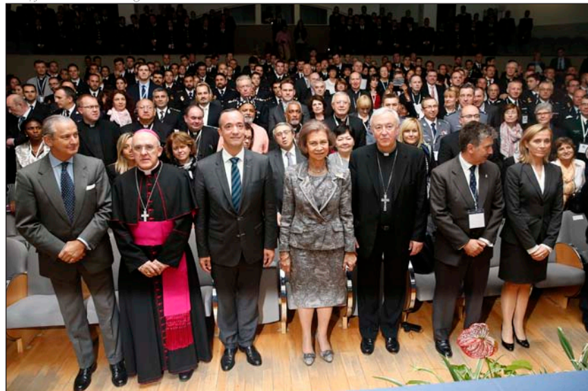
Varias personalidades durante la inauguración

rio, la detección de víctimas de trata». Finalmente, el arzobispo de Madrid se refirió a la importancia de fijarse en otros tipos de explotación, como la laboral, «todavía demasiado impune».