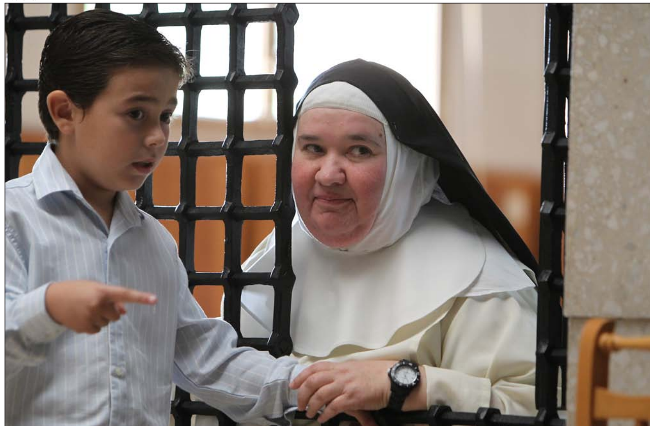
Dominica del convento de Nuestra Señora de Altagracia (Ciudad Real)