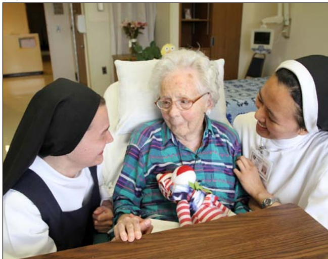
Dominicas en la residencia Rosario Hill (Nueva York). Y albergue San Martín de Porres para personas sin hogar, en Madrid