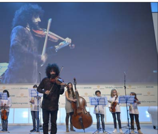
El violinista Ara Malikian