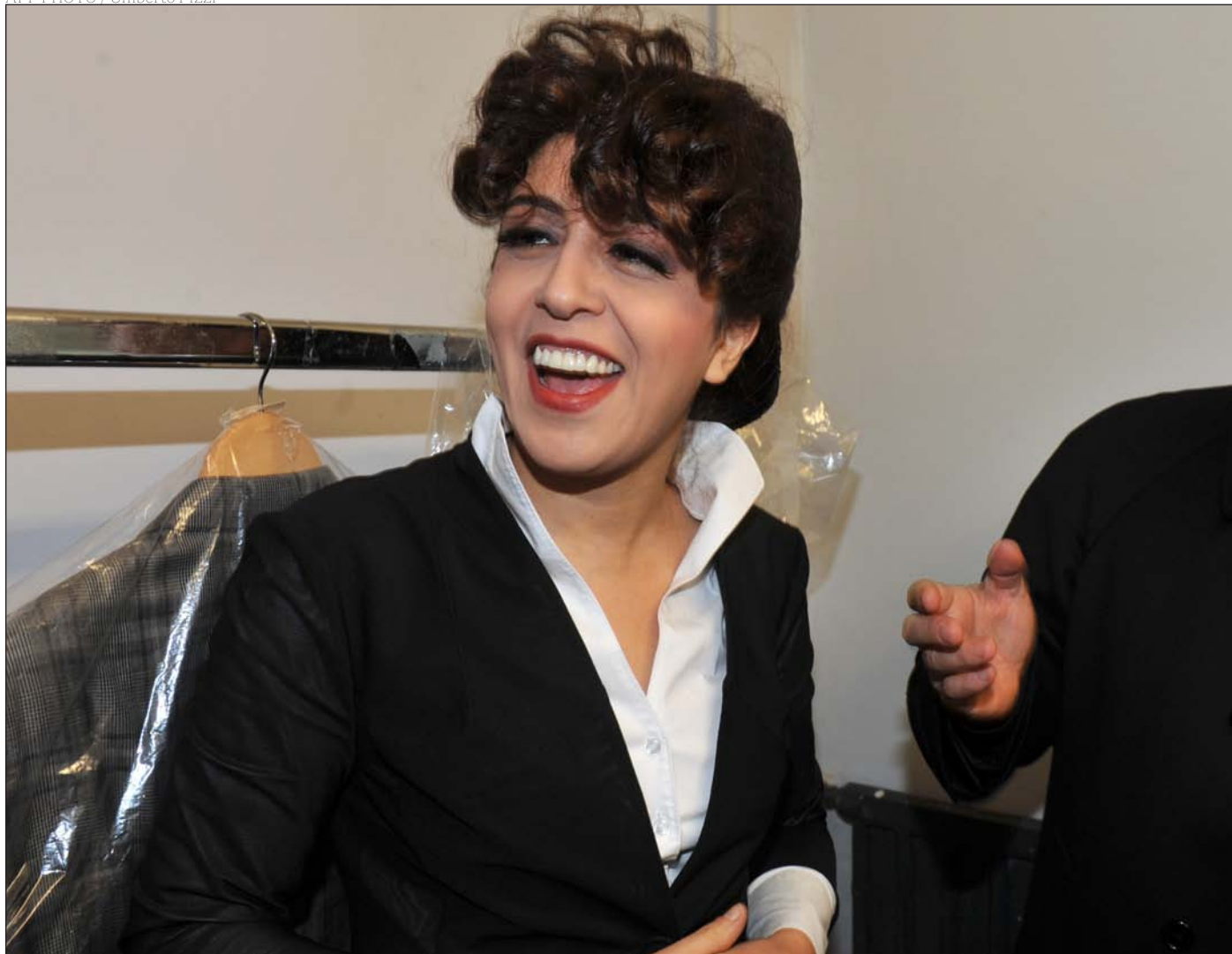
Monseñor Lucio Ángel Vallejo Balda y Francesca Immacolata Chaouqui el 15 de enero de 2014