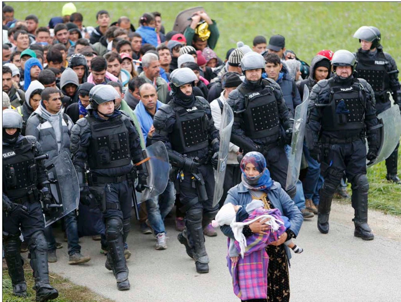
Refugiados escoltados por la Policía en la frontera entre Croacia y Eslovenia