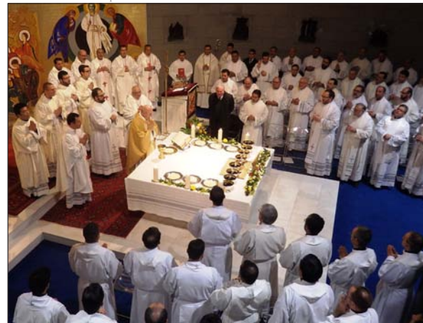
Un momento de la celebración

Monseñor Osoro presidió el domingo la Misa por el 25 aniversario del Seminario Redemptoris Mater de Madrid, acompañado de varios vicarios episcopales y sacerdotes de la diócesis, y 60 presbíteros del seminario misionero. Kiko Argüello, iniciador del Camino Neocatecumenal e impulsor de los 105 Redemptoris Mater que existen por todo el mundo, acudió junto al padre Mario Pezzi.