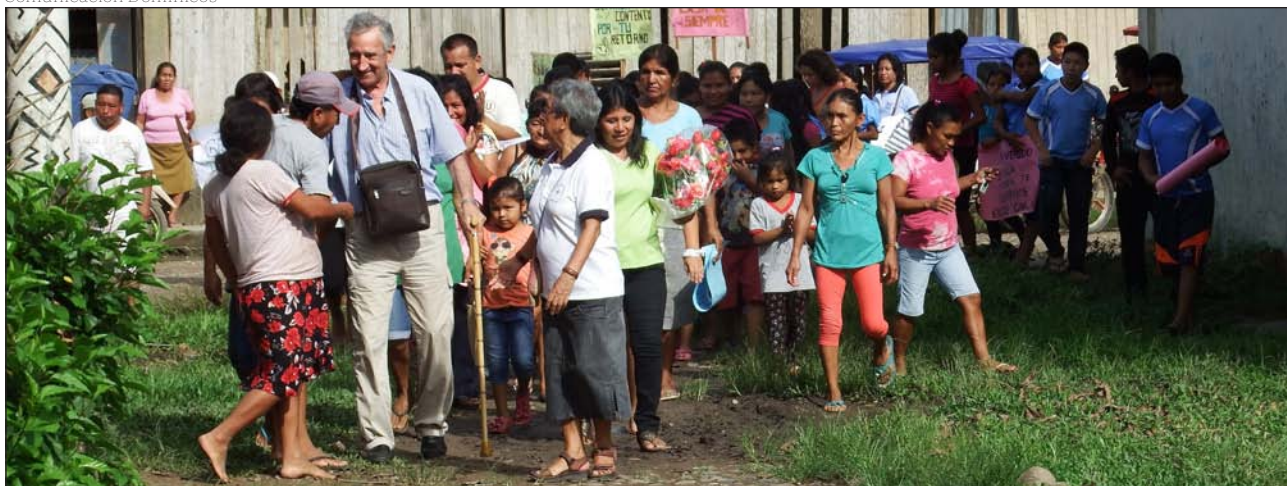
Acogida a un misionero dominico en Sepahua (Perú)