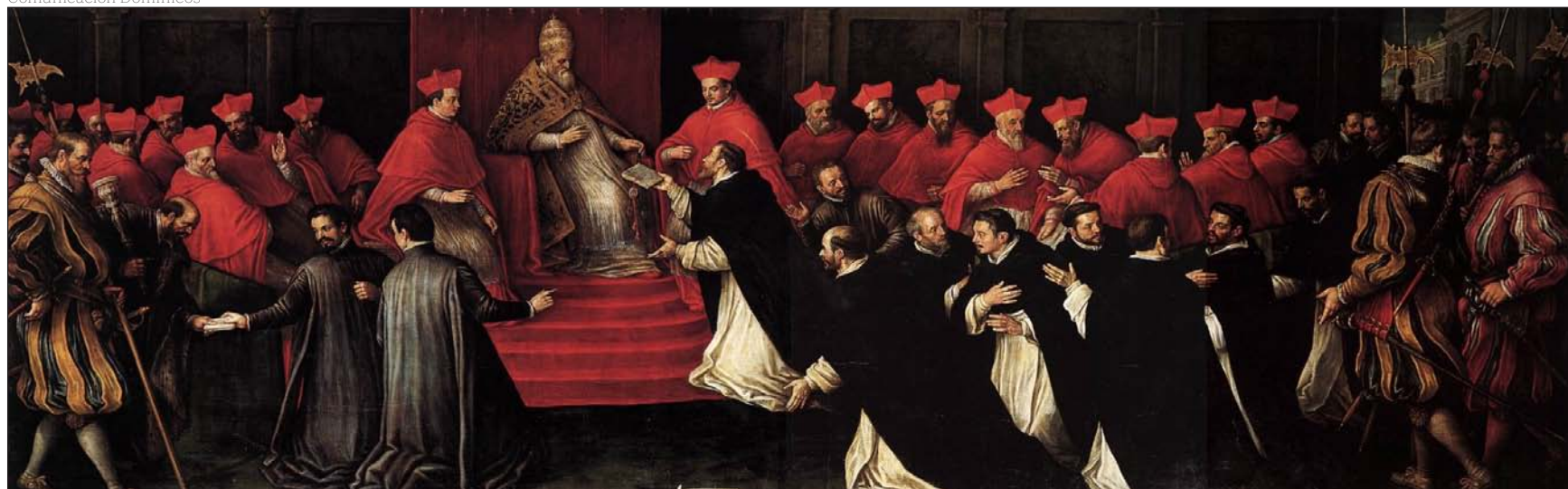
El 22 de Diciembre de 1216, Domingo recibe del Papa Honorio III la bula que confirma la Orden de los Predicadores, o dominicos