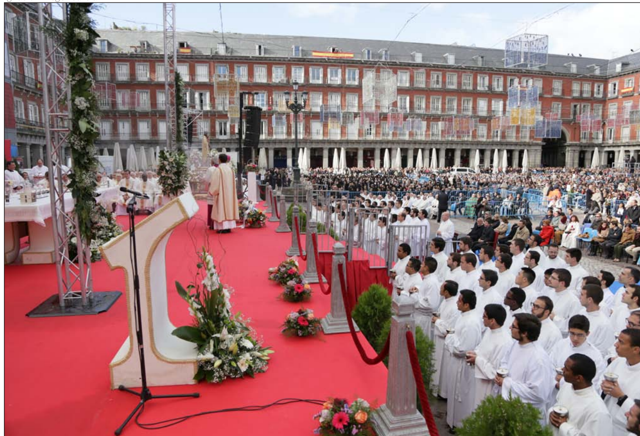
Misa de la Almudena, el 9 de noviembre de 2014 en la Plaza Mayor