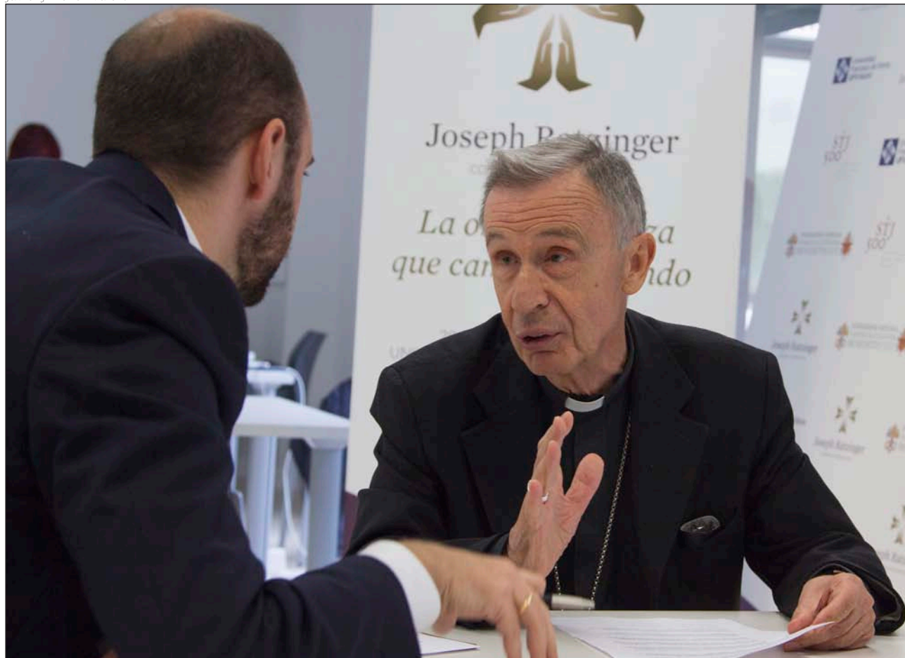
Un momento de su entrevista con Alfa y Omega

Monseñor Ladaria, secretario de la Congregación para la Doctrina de la Fe