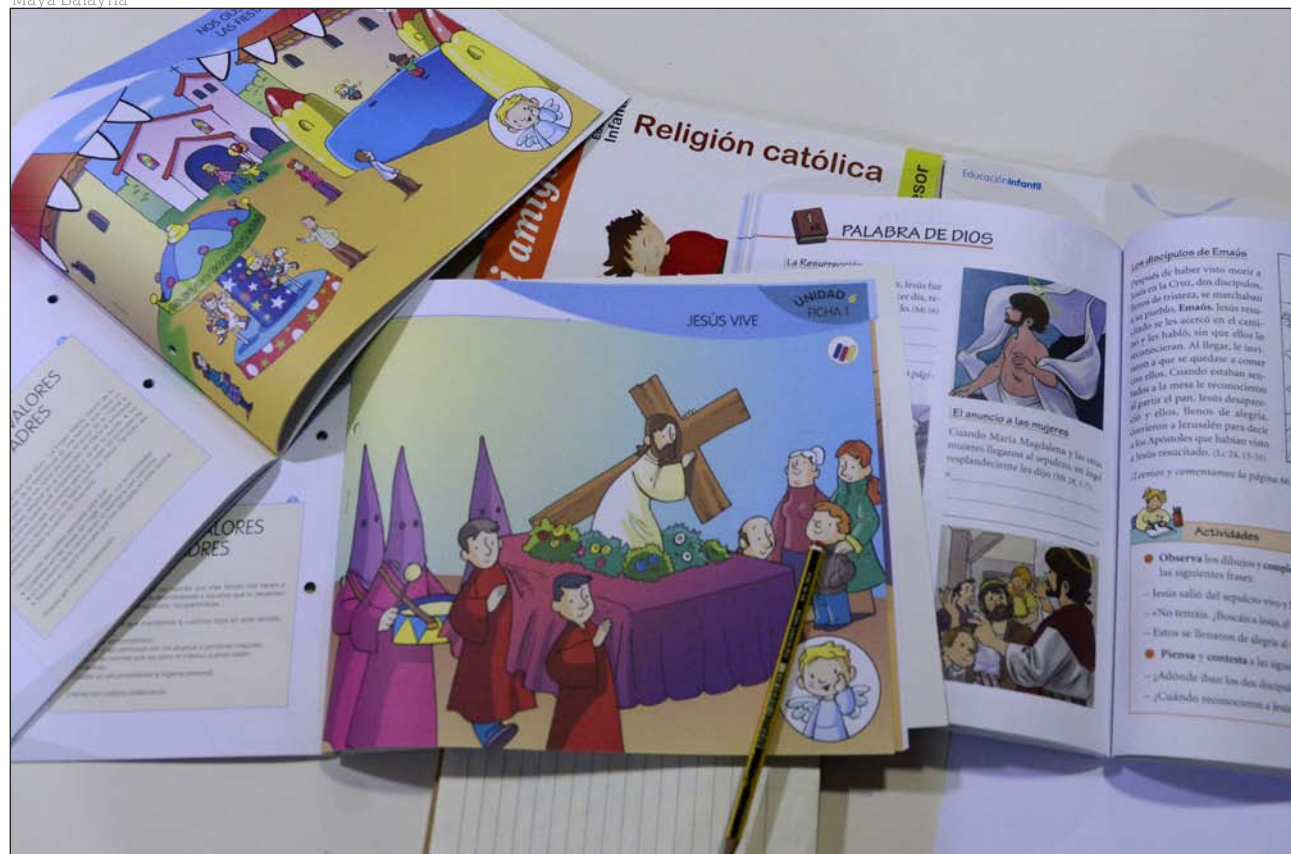
Varios libros de texto empleados en la asignatura de Religión católica