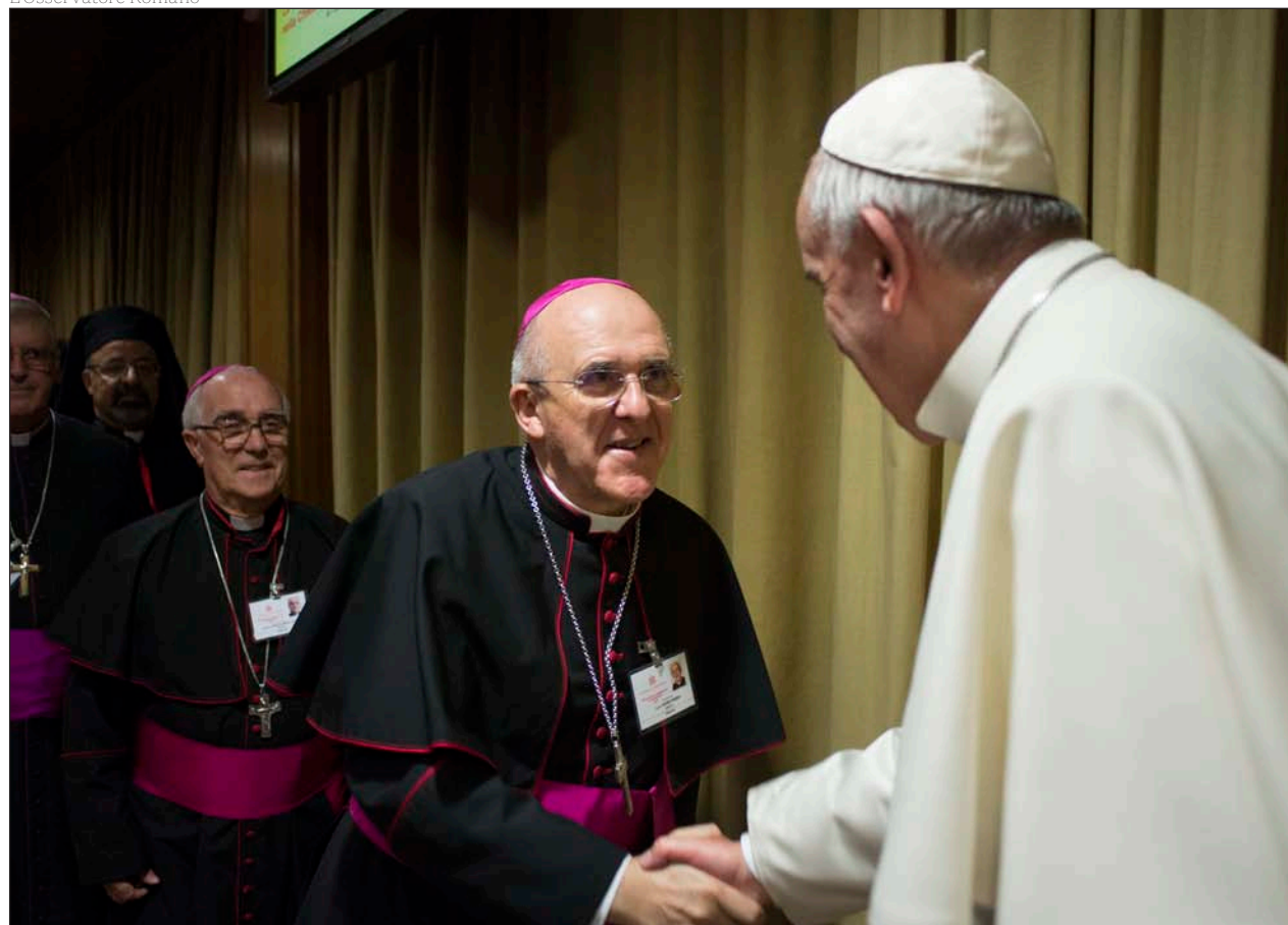
El arzobispo de Madrid saluda al Papa Francisco durante el Sínodo

Entrevista a monseñor Osoro, arzobispo de Madrid