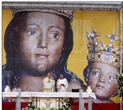
Misa de la Almudena en 2014

«María nos abre y nos regala la puerta de la misericordia, que es Jesucristo, y nos anima a acoger con entrañas fraternas a todos, especialmente a quienes en este momento están más necesitados». Con esta petición, el arzobispo de Madrid ha recordado a los madrileños la importancia de participar en la fiesta de Santa María la Real de la Almudena, el próximo lunes 9 de noviembre. Invitación que ya había hecho en un vídeo realizado desde el Sínodo de la Familia. El lema de este año es María, Madre de Misericordia ,