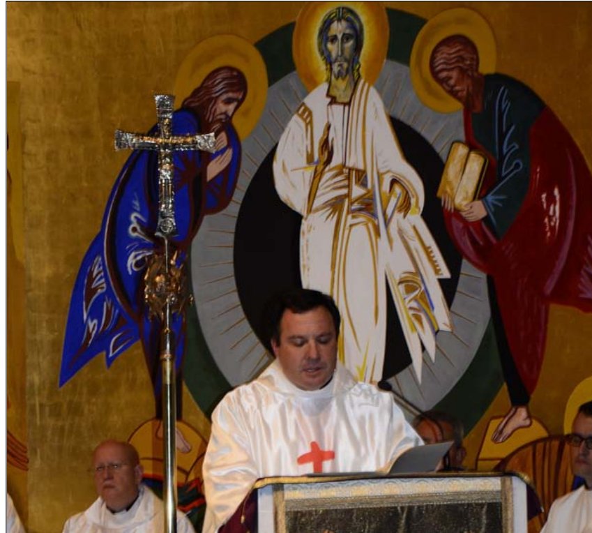
Un momento de la toma de posesión del nuevo rector, el día 30 de septiembre