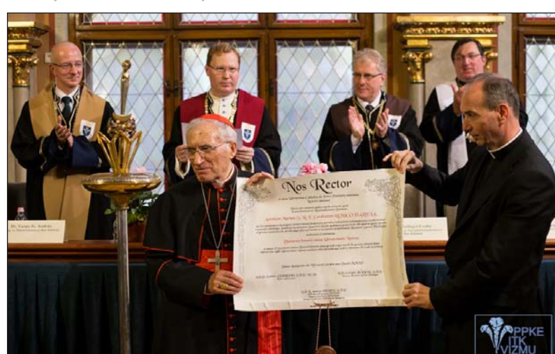
El cardenal Antonio María Rouco Varela, arzobispo emérito de Madrid y expresidente de la Conferencia Episcopal Española, ha sido investido doctor Honoris Causa por la Pázmány Péter Catholic University (PPKE) de Budapest, en Hungría.