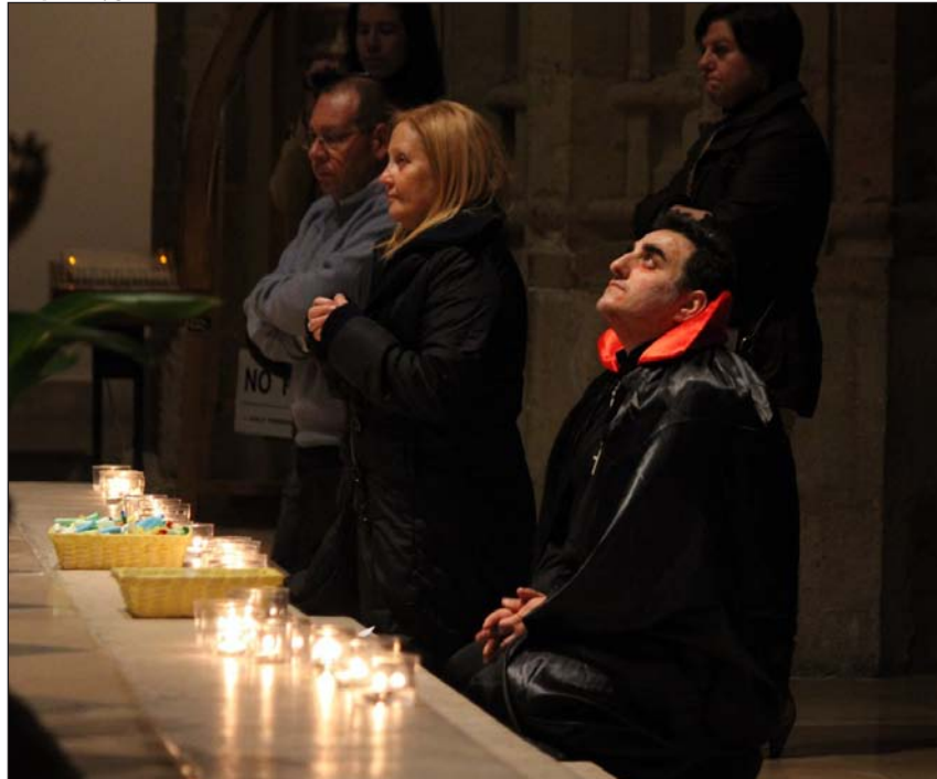
Drácula rezando delante del Santísimo en Holywins en la catedral de Alcalá