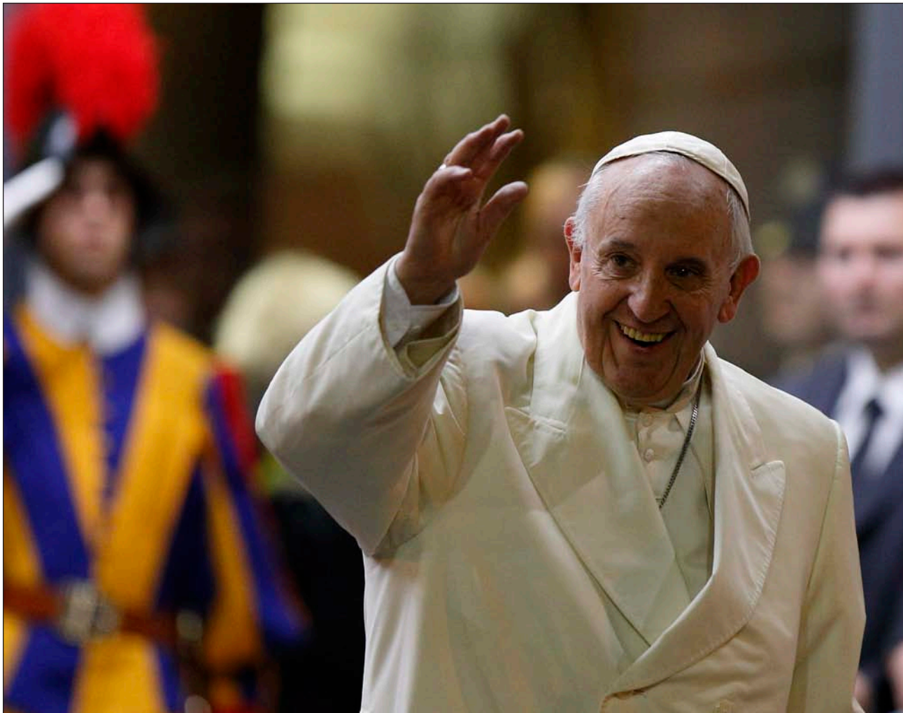
El Papa Francisco saluda tras la conclusión de la sesión final del Sínodo el 24 de octubre

Andrés Beltramo Álvarez Ciudad del Vaticano