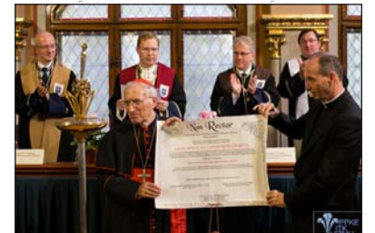
Pázmány Péter Catholic University