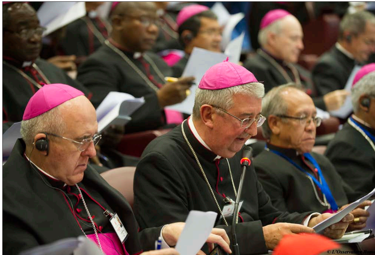
Monseñor Osoro, durante la sesión del 20 de octubre en el aula sinodal