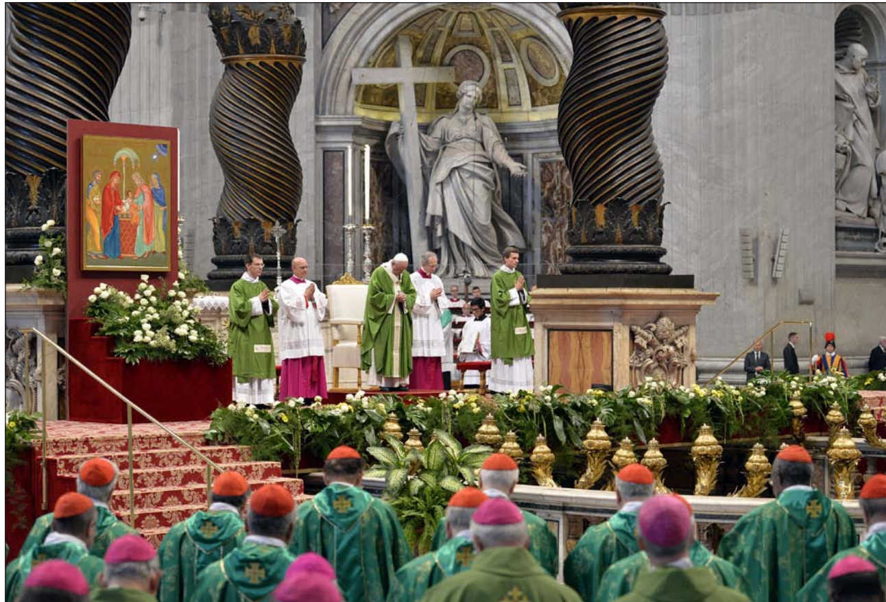
Misa de clausura del Sínodo, el domingo 25 de octubre

buenas intenciones para sentarse en la cátedra de Moisés y juzgar, a veces con superioridad y superficialidad, los casos difíciles y a las familias heridas». Pero la Iglesia es casa de «pecadores en busca de perdón, y no solo de los justos y de los santos».