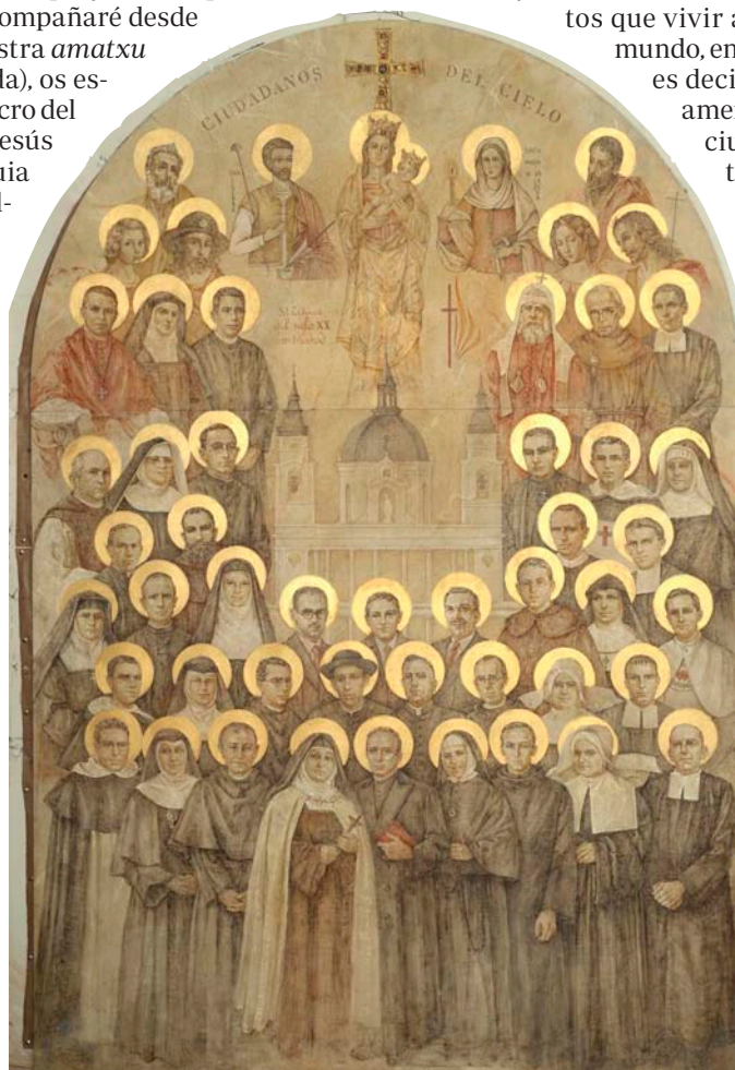
Icono de los mártires del siglo XX. Iglesia de las Calatravas (Madrid)