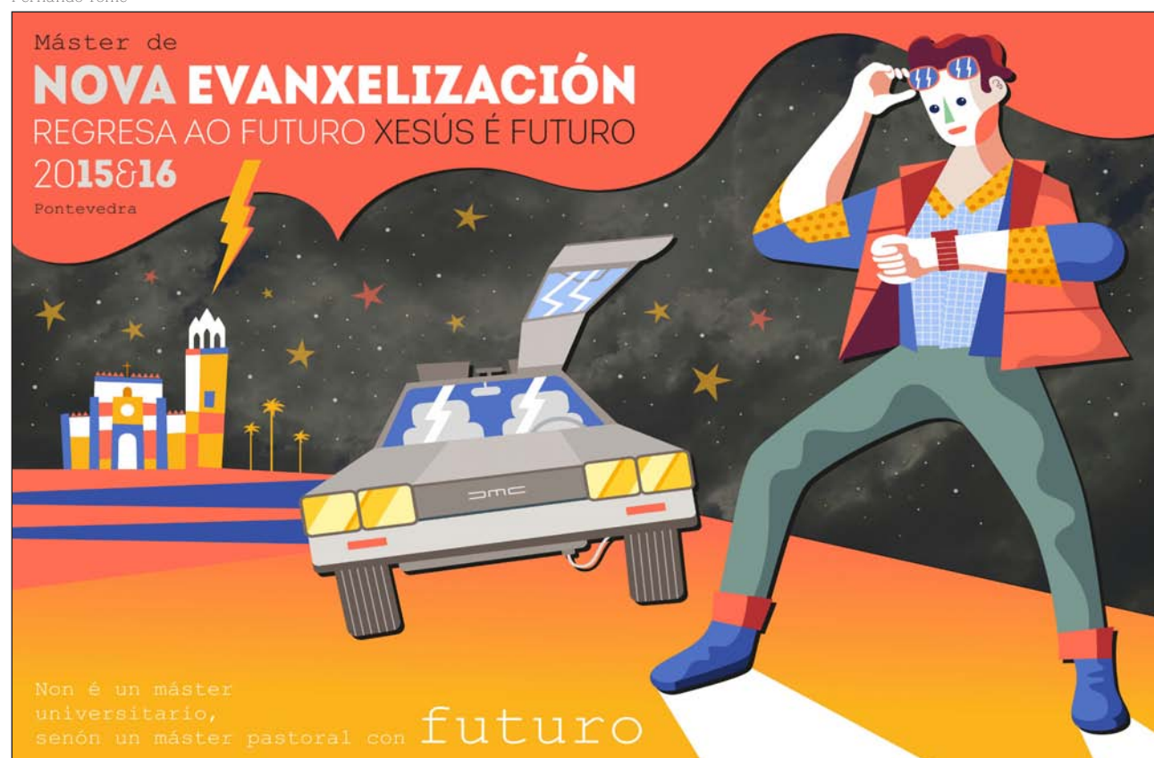
Cartel del Máster, con una alusión clara a la película Regreso al futuro

▼ Organizado por las delegaciones de Catequesis, Infancia y Juventud, Salud y Apostolado Seglar de la archidiócesis compostelana formarán en nueva evangelización