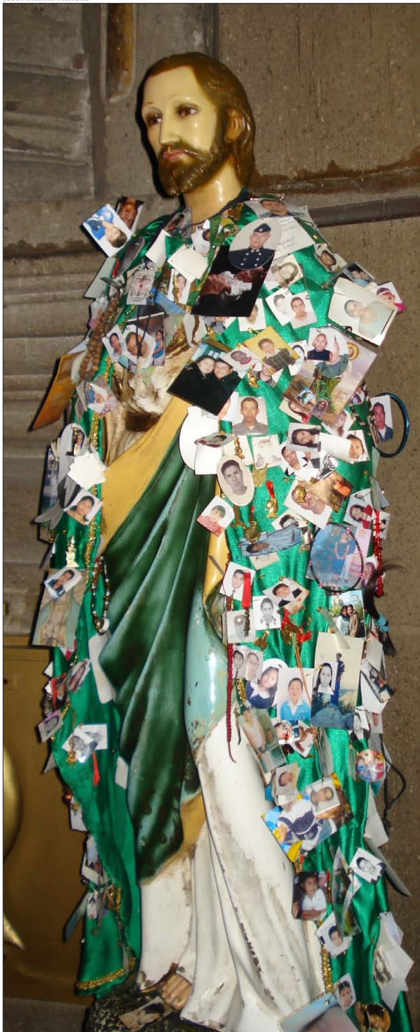
Imagen de san Judas, en la capilla de El Pocito, en Guadalupe (México)