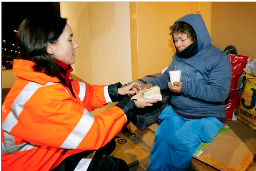
Una voluntaria de Cáritas atiende a una mujer sin hogar en Córdoba

que he estado en esta situación y no tener que callármelo» por miedo a la incompreensión. Ese silencio «te va hundiendo por dentro», y puede acabar ocurriéndote «lo que les pasa a muchos que están en la calle: que no quieren saber nada de nadie porque están hastiados».