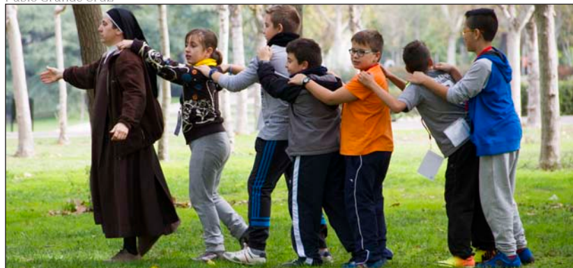
Los participantes en el EDN, durante el tiempo de juegos