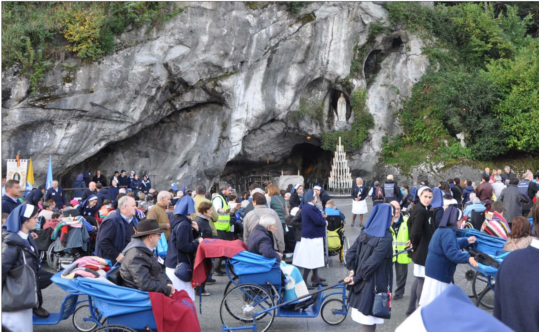
Participantes en la 88ª peregrinación con enfermos de la Hospitalidad Nuestra Señora de Lourdes de Madrid, ante la gruta de la Virgen