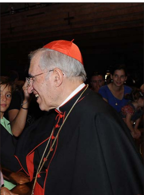
La peregrinación a Torreciudad sirva a todas las familias para que se abran al amor de Cristo.

A la izquierda, el cardenal Rouco saluda a una familia, el pasado sábado