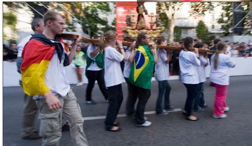
Un joven alemán participa en el Via Crucis de la JMJ de Madrid. A la derecha: a la espera del Papa, ante la Puerta de Brandeburgo

Hay materia de sobra para el debate. Los titulares de prensa, sin embargo, los han acaparado, hasta ahora, los en torno a 100 diputados (de un total de 620) que quieren boicotear el discurso del Papa. Son la mitad aproximadamente de los representantes del partido neocomunista La Izquierda , a los que se han sumado miembros del SPD (socialdemócratas) y de Los Verdes. Más de uno ha llegado a reconocer abiertamente que no tendría inconveniente en recibir al Dalai Lama o al líder de cualquier otra confesión, pero se niega a aplicar el mismo rasero con el Papa. Peter Seewald, biógrafo de Benedicto XVI, ha explicado el motivo de tanta agresividad entre quienes, curiosamente, presumen de tolerantes: pese a sus suaves y amables formas –dice a la agencia austriaca Kath.net–, «el Papa representa una provocación, porque hace que el hombre se cuestione su estilo de vida. Es como si nos pusiera un espejo delante, y eso no siempre es agradable».