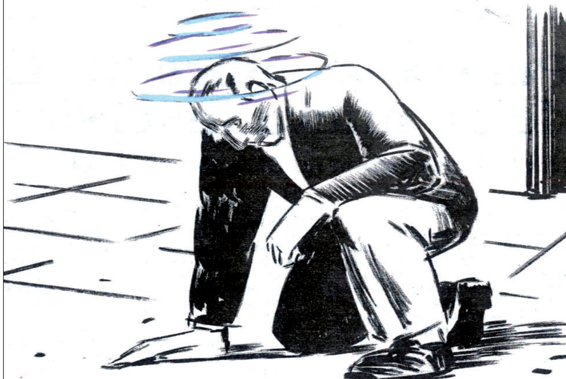
El Roto, en El País