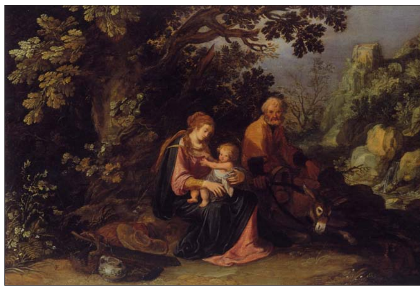
Paisaje con descanso en La huida a Egipto, de Pieter Lasman (1608)