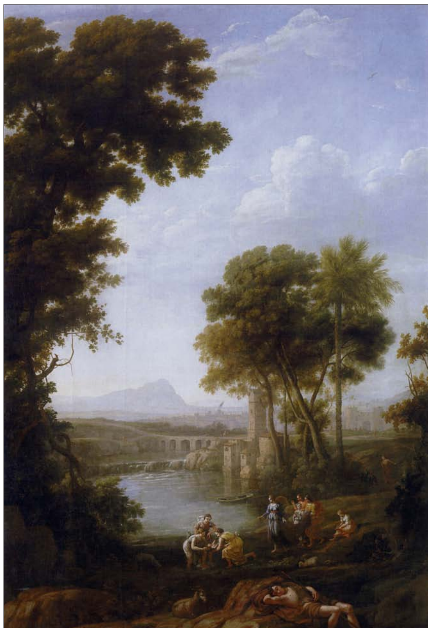
Moisés salvado de las aguas , de Claudio de Lorena (1639-40)

era también el punto de referencia de los artistas nórdicos que se establecieron en Roma desde 1616-17.