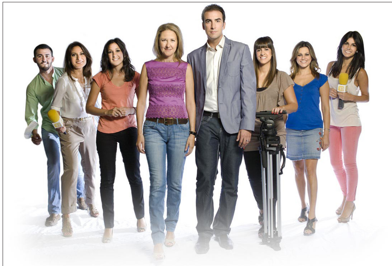
El equipo del programa Pulsando España

La primavera pasada, la Conferencia Episcopal Española apostó por entrar mayoritariamente en el accionariado de la televisión católica 13TV. Con este paso, pretendía reforzar su presencia en los medios de comunicación audiovisuales, en España y ofrecer, a nivel nacional, además de la radio, una televisión. El que ahora comienza será el primer curso con este nuevo planteamiento, que COPE y 13TV han presentado esta semana