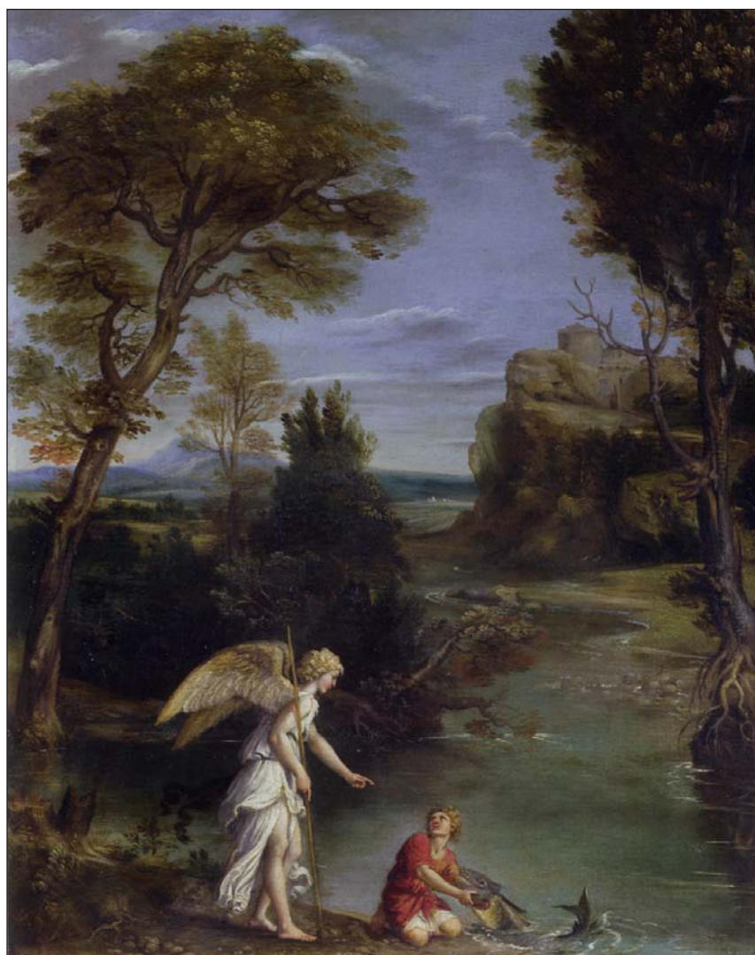
Paisaje con Tobías y el ángel, de Domenichino (1610-12)

Hasta el 25 de septiembre, el Museo del Prado es sede de Roma. Naturaleza e ideal. Paisajes 1600-1650, una exposición que recoge más de cien obras en torno al nacimiento de la pintura de paisaje en la primera mitad del siglo XVII