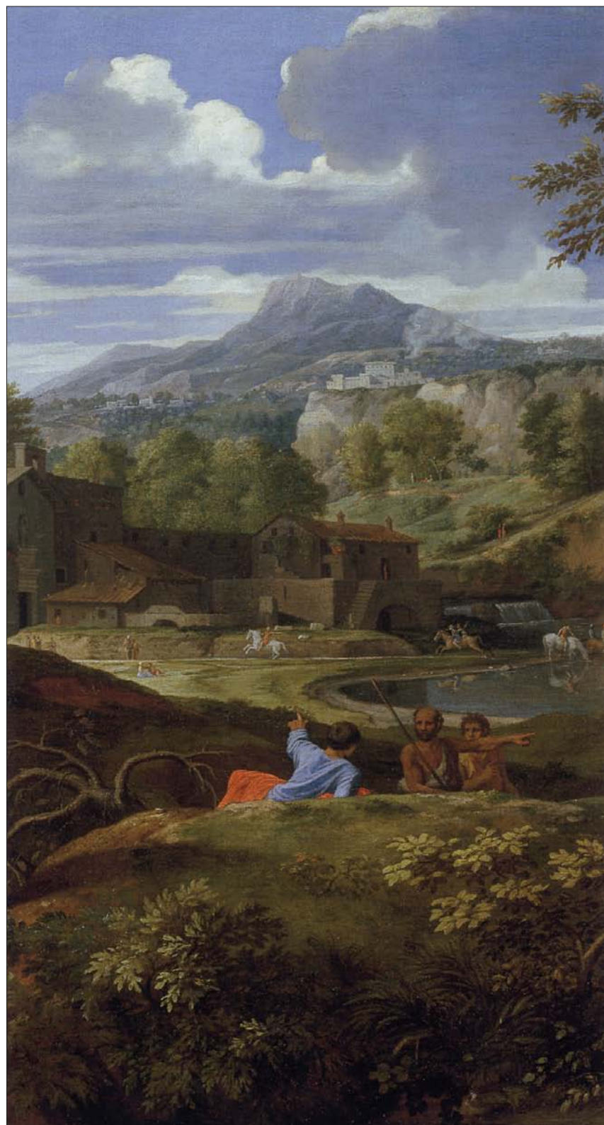
Paisaje con edificios , de Nicolás Poussin (1648-50)