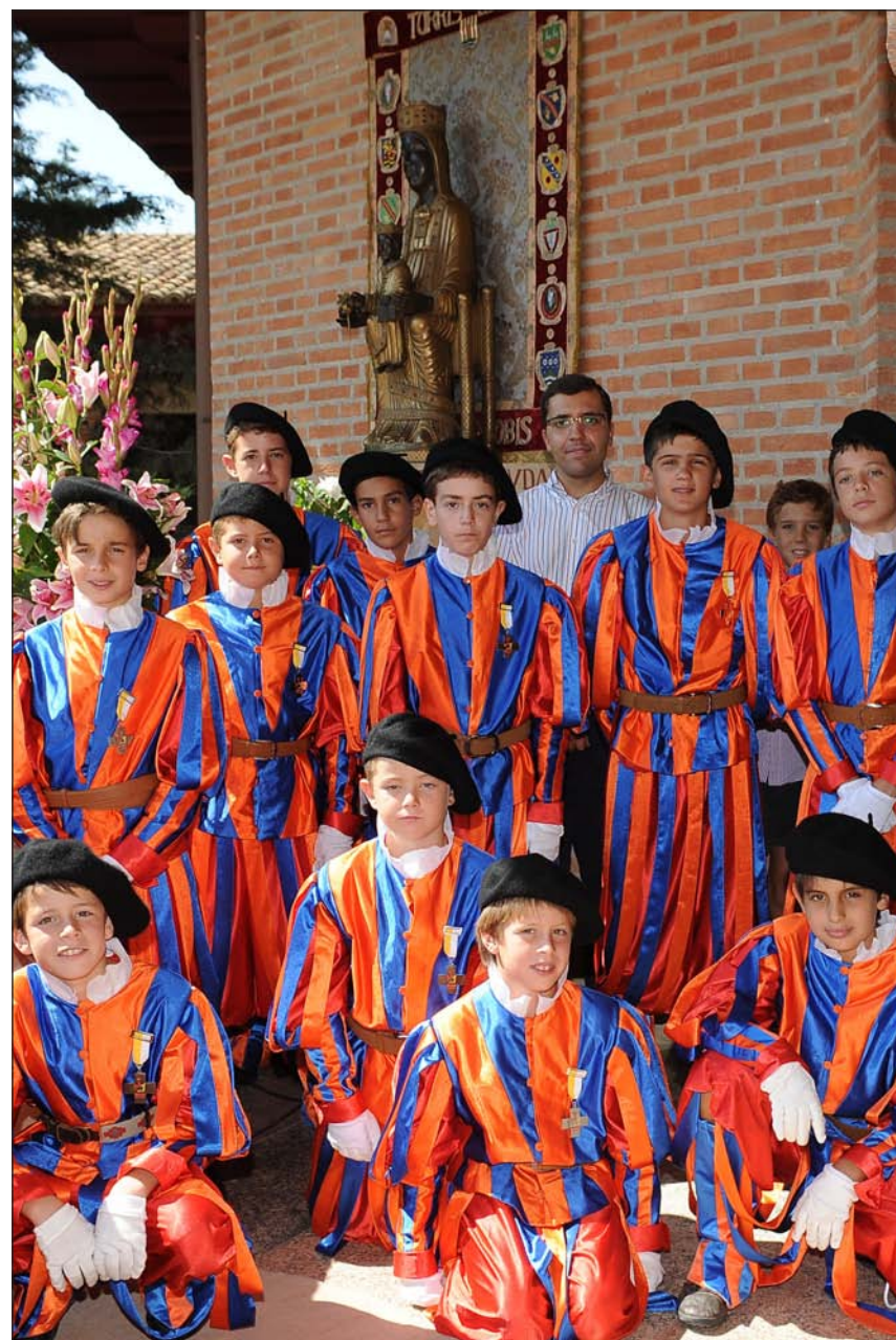
No hay que tener miedo al paso primero, el Sí de la fe, en esa vida nueva de Dios. Un grupo de pequeños guardias suizos venidos de Madrid

Para ello, no hay que tener miedo al paso primero, el Sí de la fe, en esa vida nueva de Dios a través de Cristo y con la mediación maternal de su Madre, María. Así se entra y se conoce que el hombre ha recibido a Dios, que Dios está con él de una forma íntimamente cercana, plena, sobrenatural, para que haga de su vida un camino de gloria y de santidad. Eso se descubre con un primer paso: creer en Él, creer en Jesucristo. Firmes en la fe , decía el Papa a los jóvenes y les enseñaba a hacerlo en la Jornada Mundial de la Juventud.