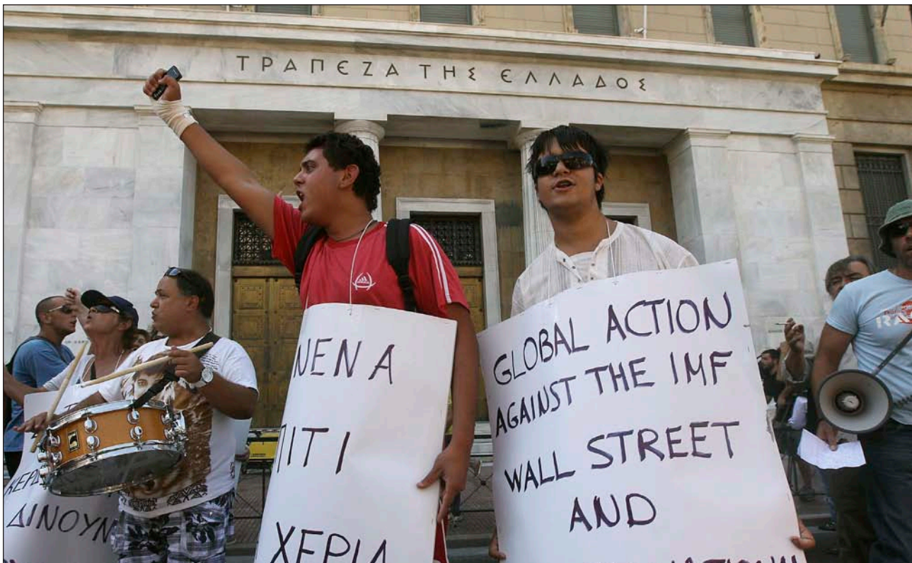
Protestas en Atenas, frente al Banco Central Griego, por la gestión de la crisis

E ttore Gotti Tedeschi no esconde ni minimiza la gravedad de la crisis. Por eso, asegura que, si se quiere encontrar el remedio, hay que comprender las causas. El banquero del Papa explica que, desde que terminó los estudios universitarios, en 1971, «al final de una crisis económica –y he vivido varias–, se propone como solución la imposición de nuevas reglas y controles. La crisis, así, se hace más compleja: en la dificultad, se establecen más controles y se hace más rígido el sistema. Pero queda una pregunta a la que nunca se responde: ¿Quién controla a los controladores? No es el instrumento lo que permite avanzar; es el hombre».