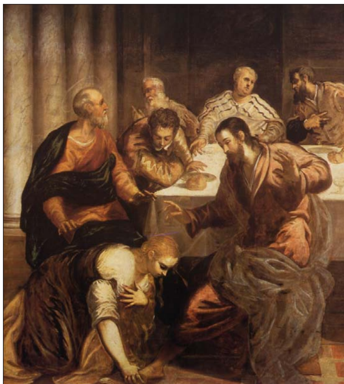
La pecadora, en casa de Simón, el fariseo, de Tintoretto. El Escorial