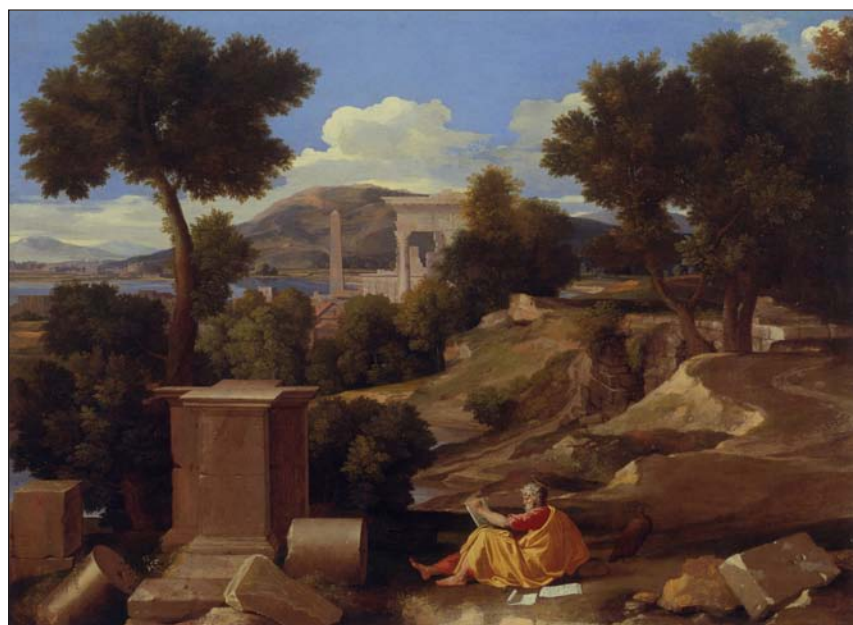
Paisaje con san Juan en Patmos , de Nicolás Poussin (1640)