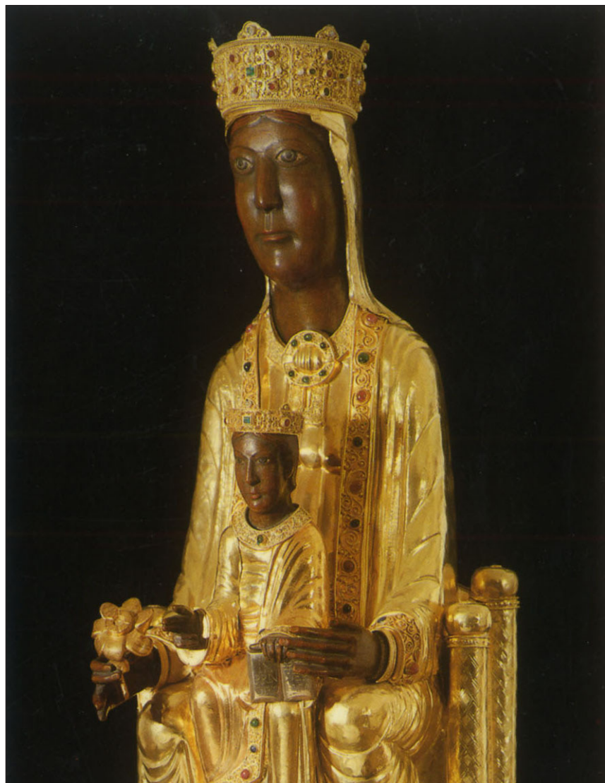
Aquí se viene a buscar en la Virgen a la Madre de la Gracia. Imagen de la Virgen de Torreciudad

En esta Jornada Mariana de la Familia, con el recuerdo vivo de la Jornada Mundial de la Juventud, con la presencia de tantas familias, tantos abuelos, matrimonios, niños y jóvenes, vamos a pedirle al Señor que los frutos de conversión vividos en la JMJ sean en nuestras vidas un impulso, una nueva forma de entusiasmarse de lo que somos, para entregárselo