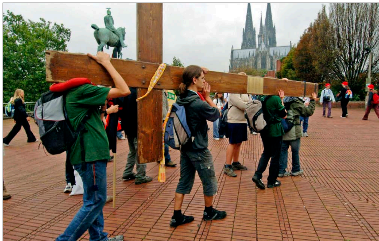
Los jóvenes peregrinos llevan la Cruz de las JMJ el día en que comenzó la de Colonia, el 16 de agosto de 2005

de los caballos de batalla de un grupo de 300 sacerdotes austríacos, que amenazan con provocar un cisma en la Iglesia en este país. El argumento suele ser que, con la incorporación de mujeres y hombres casados al ministerio sacerdotal, podría paliarse la escasez de vocaciones, pero la respuesta que invariablemente reciben es que la Iglesia no tiene autoridad para introducir determinados cambios (la Iglesia custodia el Evangelio, no es su dueña), y que, además, la experiencia demuestra que ese tipo de medidas no han fortalecido a las comunidades evangélicas que las han introducido, sino más bien al contrario.