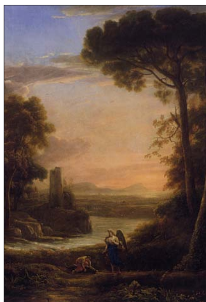
El arcángel Rafael y Tobías, de Claudio de la Lorena (1639-40)

D urante los primeros años del Seicento , confluyen en Roma, atraídos por la presencia de los vestigios de la antigüedad clásica y los sugerentes parajes que la circundan, un numeroso grupo de pintores de distintas nacionalidades. Por un lado, está Carracci, que, hacia 1600, elabora un nuevo tipo de pintura en el que la naturaleza se muestra armónicamente estructurada, lo que será germen del paisaje ideal . Sus discípulos boloñeses, entre los cuales destaca Domenichino, desarrollarán sus enseñanzas a principios de la década de 1620. Por otro lado, Paul Bril adapta el paisaje a la manera de pintar flamenca, a la vez que el alemán Adam Elsheimer fascina a sus contemporáneos con sus efectos de luz. Bril mantenía un intenso contacto con los pintores boloñeses, y su taller