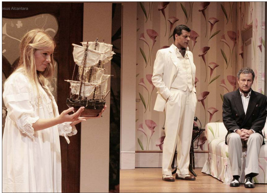
Un momento de la representación

¿Sabía usted que, además del Jardiel Poncela chispeante, irónico, cínico, malabarista del humor, hubo otro Jardiel Poncela indagador de las honduras de la condición humana, filósofo escéptico, un Jardiel –el último– muy serio? Si no lo sabía y quiere comprobarlo, no se pierda Las cinco advertencias de Satanás , que Gustavo Pérez Puig y Mara Recatero –¿quién, si no?– le brindan, desde las tablas del madrileño Teatro Marquina. Tiene usted garantizado un rato agradabilísimo, lo que, para empezar y con la que está cayendo, es muy, pero que muy de agradecer. ¿Qué hubiera escrito Jardiel hoy?