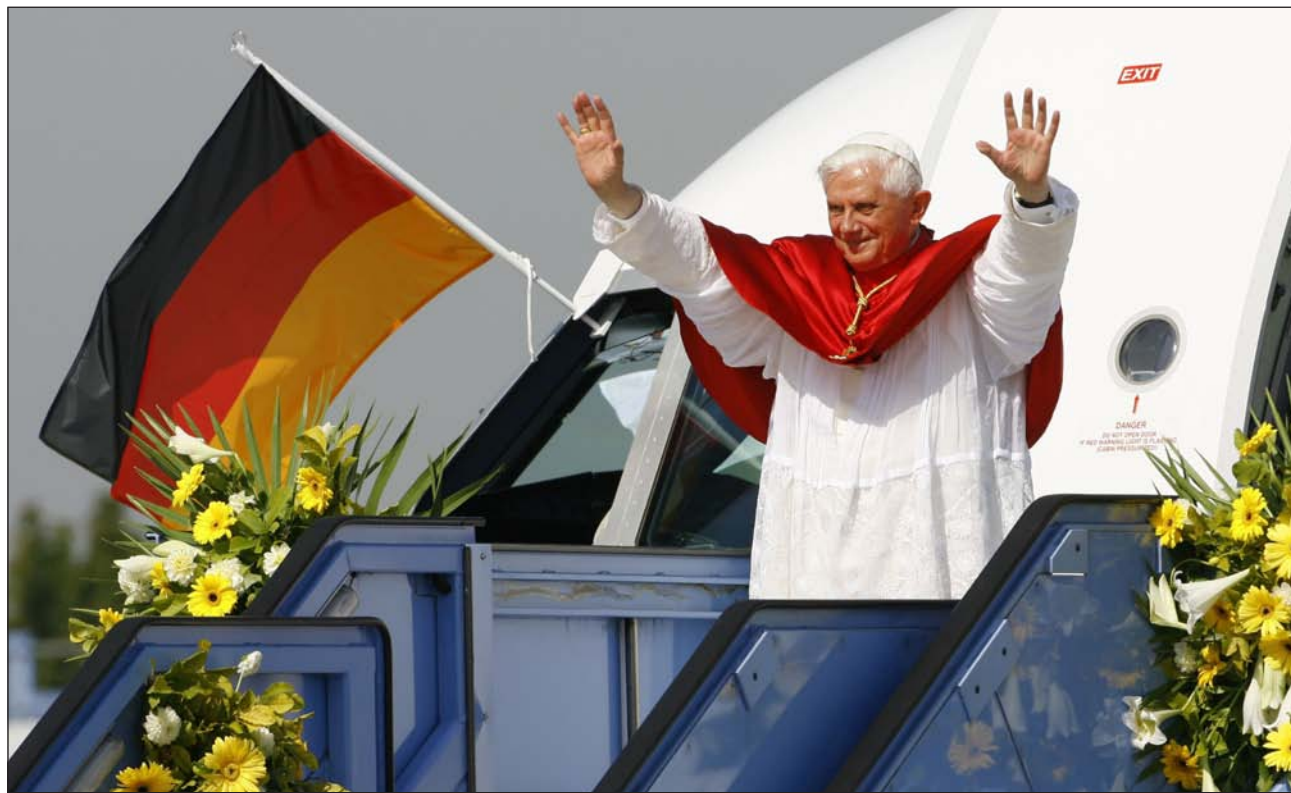
Benedicto XVI se despidió del pueblo alemán, en el aeropuerto de Múnich, al concluir el segundo Viaje a Alemania, en 2006

Benedicto XVI emprende hoy su primer Viaje de Estado a Alemania, que lejos de presentarse como una plácida visita a su Patria, se perfila como el más complicado de todos sus viajes hasta la fecha. En la primera parada, la capital, Berlín, el contexto está marcado por la secularización de la sociedad, mientras que la recta final, Friburgo, tiene como trasfondo la secularización dentro de la propia Iglesia. En el centro de su Viaje, el Papa celebrará Vísperas marianas junto a una probada comunidad católica en el Este, que, «a través de todas las peripecias de la Historia, ha permanecido católica», junto a la Virgen, en tierras de Lutero y de Carlos Marx