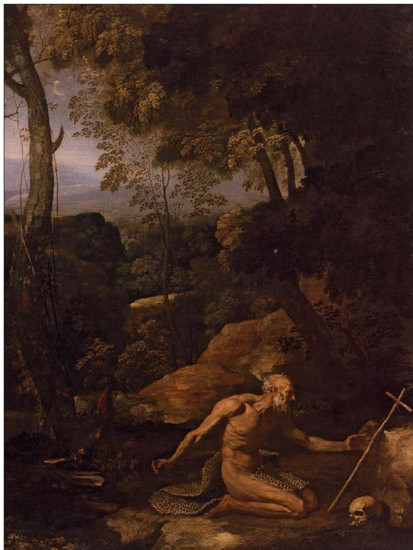
Paisaje con san Pablo ermitaño, de Nicolas Poussin (1637-38)