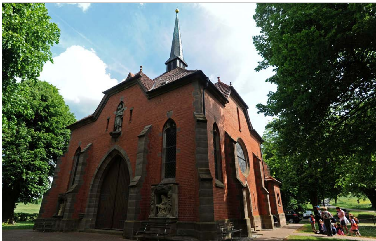
Santuario mariano de Etzelsbach, donde tendrá lugar el rezo de Vísperas

Pero Alemania no es sólo la tierra de Lutero. También es el país de Carlos Marx, y en el Este abundan las huellas del régimen socialista de