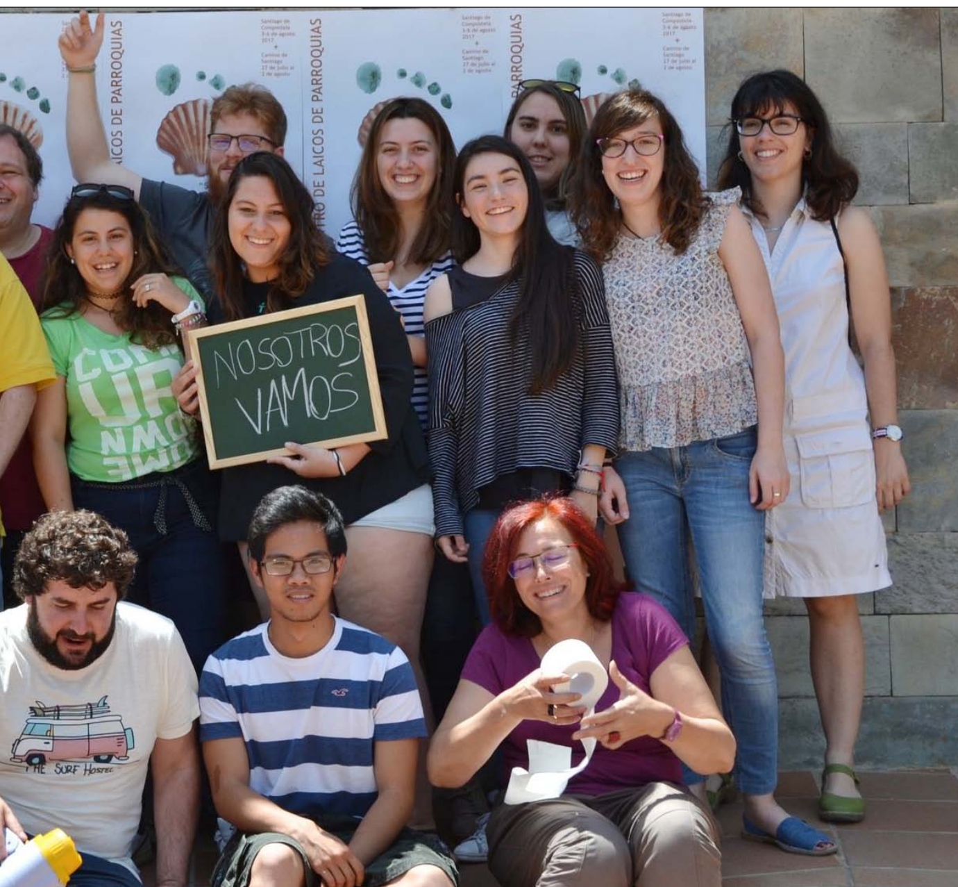
Parroquias que este mes de agosto se va a celebrar en Santiago de Compostela