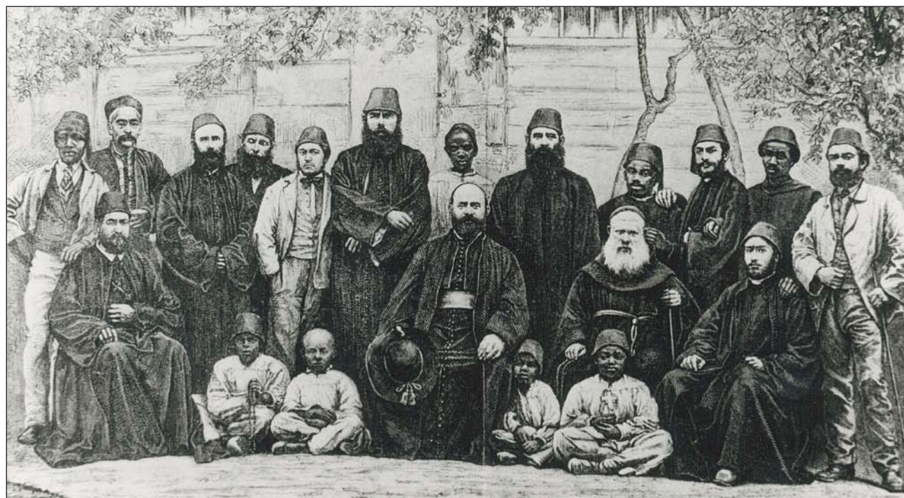
Daniel Comboni en El Cairo con algunos sacerdotes, laicos y alumnos de su instituto

Hace exactamente 150 años el intrépido misionero italiano Daniel Comboni fundó el Instituto Misionero para la Nigrizia. Lo hizo por imperativo eclesial y como requisito para poder seguir anunciando el Evangelio a los habitantes del vicariato de África Central. Tenía tan solo 36 años. Tres años antes de fundar el instituto escribió su plan para la regeneración de África, un ambicioso proyecto para hacer viable la evangelización en el continente negro con un planteamiento nuevo: «Salvar África