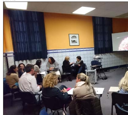
Una reunión de SEPAS en Valencia