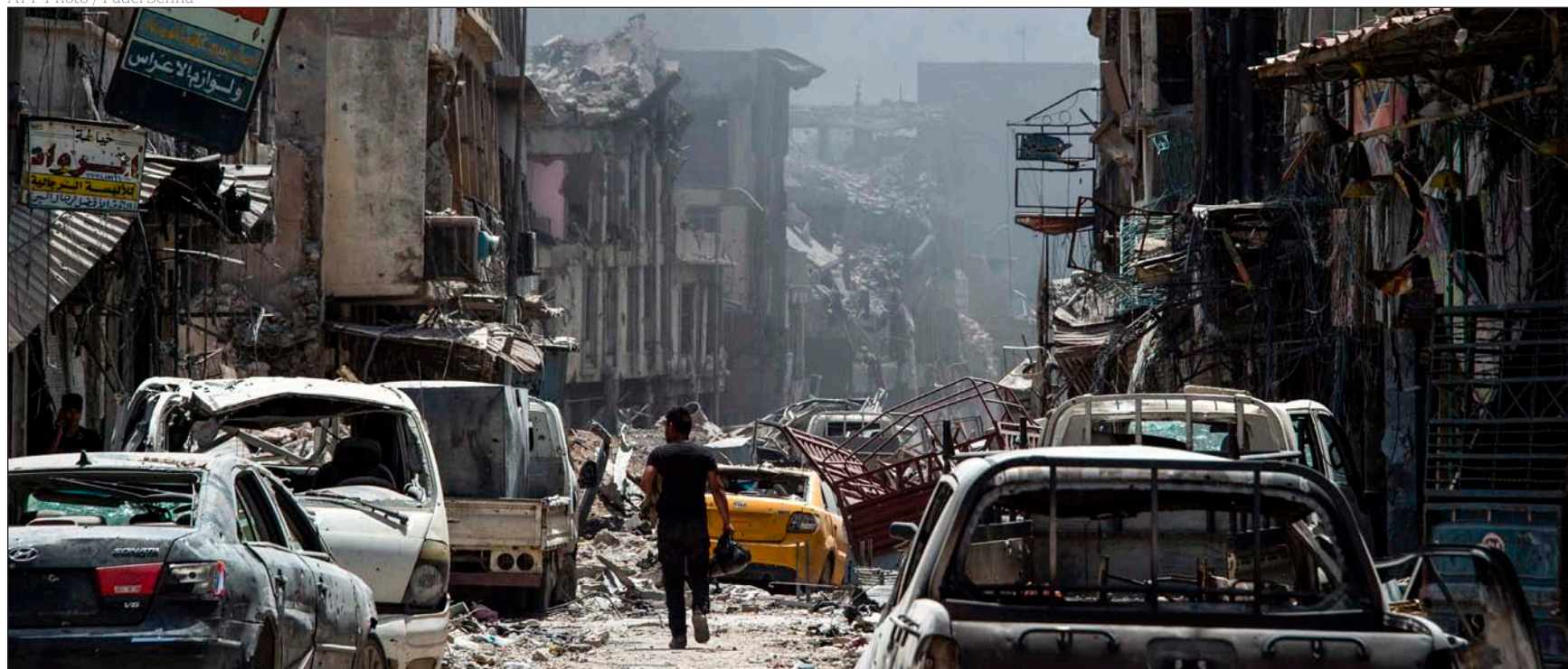
Un hombre camina entre las huellas de Mosul