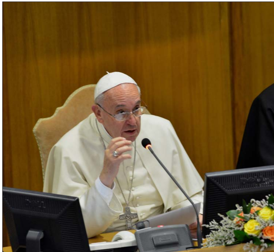
El cardenal Müller junto al Papa el 17 de noviembre de 2014