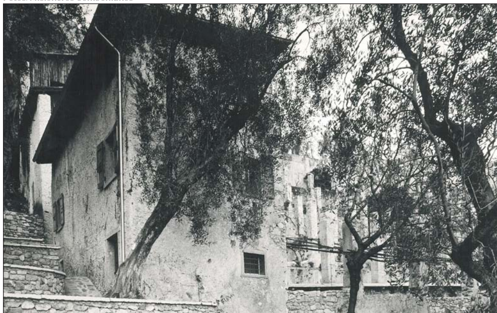
Casa natal de Daniel Comboni