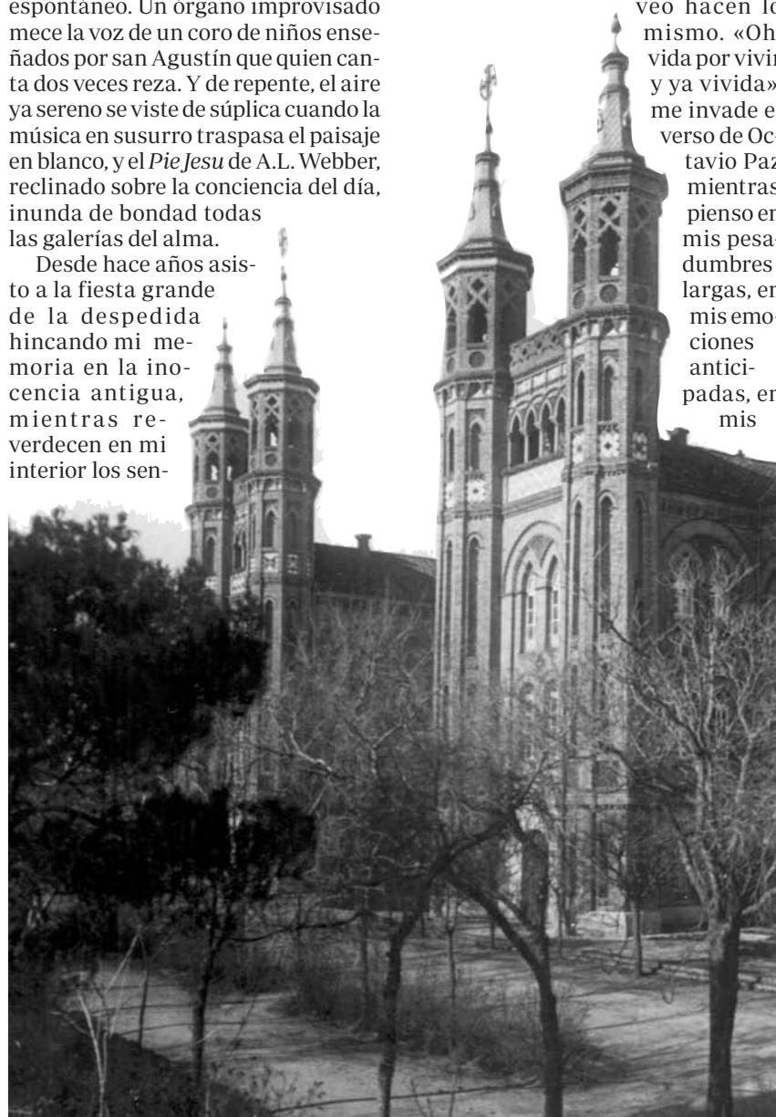
Vista parcial del antiguo colegio

veo hacen lo mismo. «Oh, vida por vivir y ya vivida», me invade el verso de Octavio Paz mientras pienso en mis pesadumbres largas, en mis emociones anticipadas, en mis