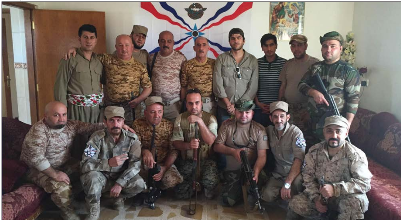
Miembros del Dwekh Nawsah, una milicia cristiana independiente

temente constituidas Fuerzas de los Halcones Siriacos (ver cuadro). Bajo bandera kurda han combatido en la ofensiva sobre Mosul otros grupos armados cristianos como el NPF. No solo no es descabellado sostener,