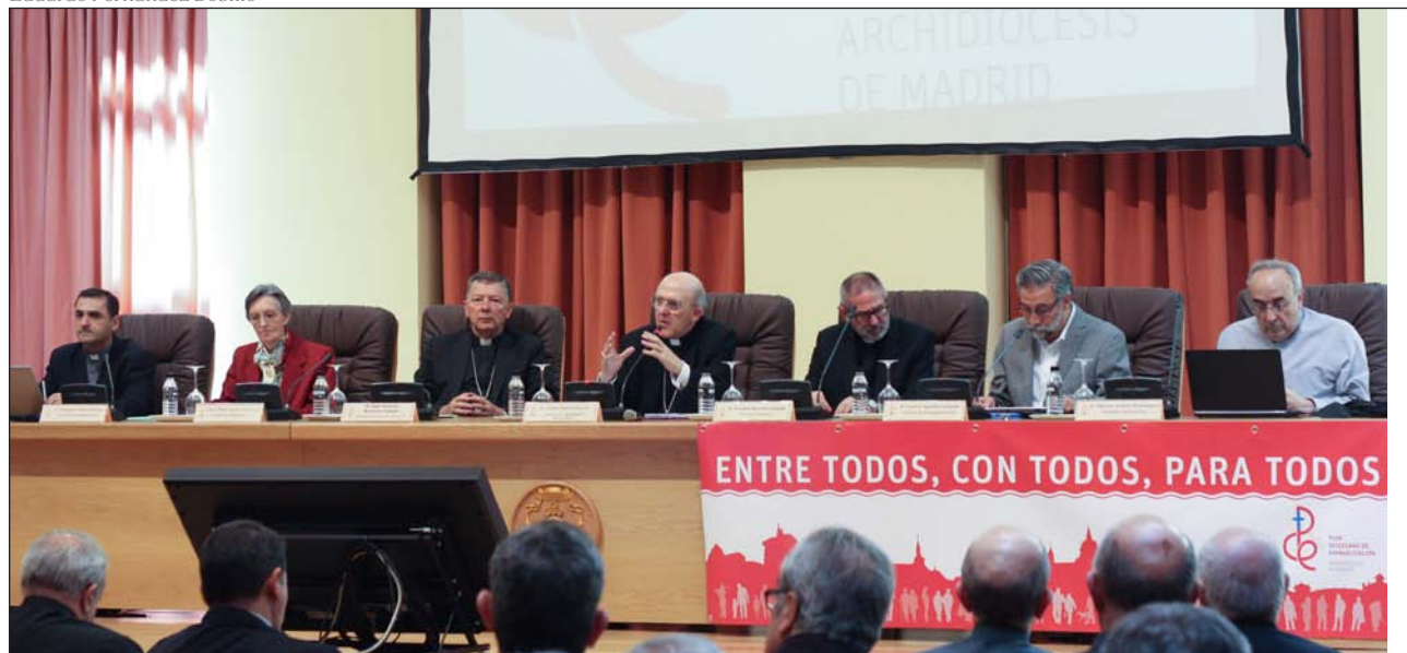
El cardenal Osoro, ante los miembros del Consejo Ampliado del PDE