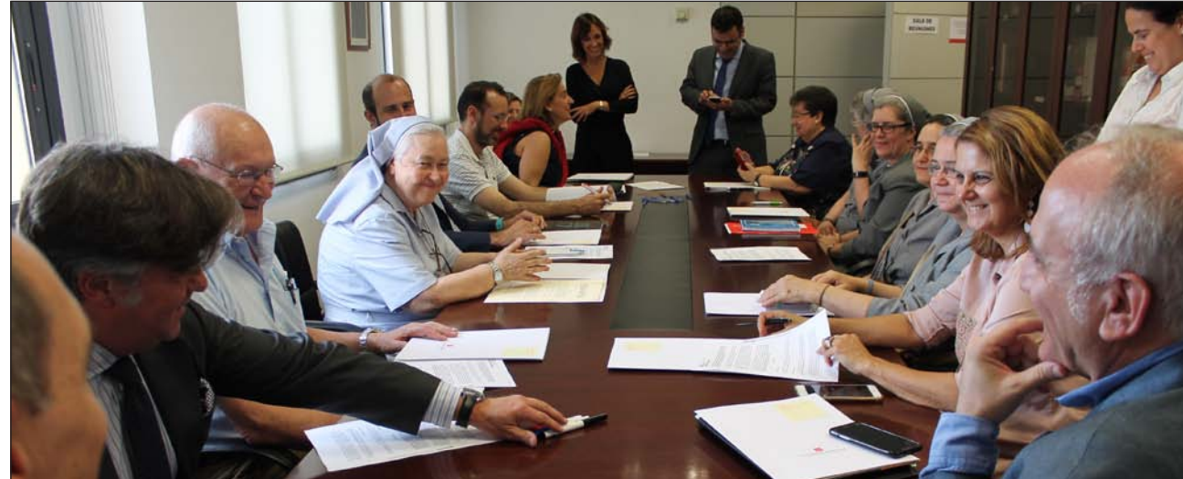
Representantes de los centros firman en la sede de la Comunidad de Madrid la recuperación de los conciertos