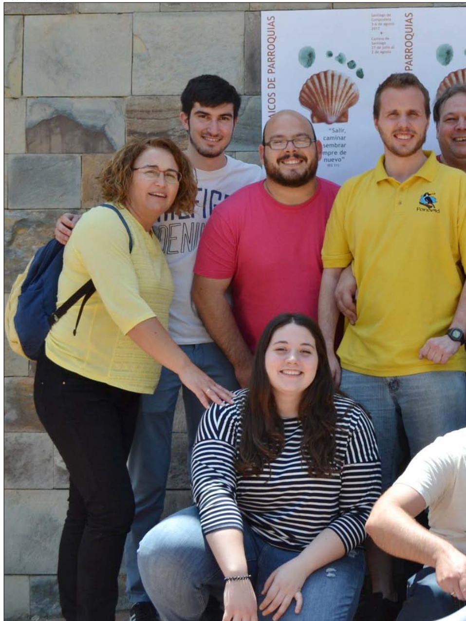
Un grupo de Acción Católica se prepara para participar en el Encuentro de Laicos de Parroquias

La de Nuestra Señora de la Asunción de Torrelavega (Cantabria) es una de las parroquias donde el modelo de Acción Católica –presente desde mucho tiempo atrás– articula toda la vida laical. Cuenta con grupos de niños, jóvenes y adultos, perfectamente integrados, al servicio de la parroquia y la diócesis. El último año se han lanzado a acompañar a los padres de los niños que acuden para iniciarse en la fe. También se implican en la realidad de su barrio, humilde en este caso. Aprovechando la existencia de un centro de acogida de inmigrantes muy cerca, la parroquia tiene un proyecto intercultural que busca que las distintas realidades culturales del barrio se encuentren.