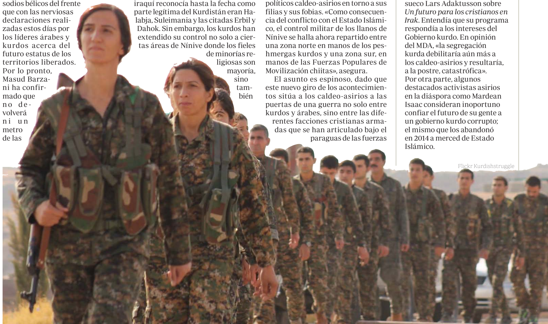
Milicianos kurdos en julio de 2016