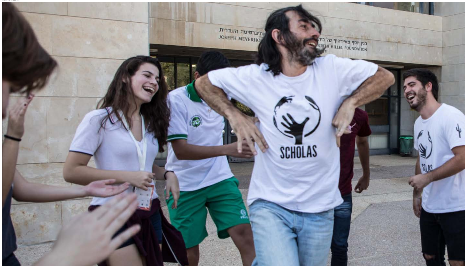
Participantes en el Congreso de Scholas en Jerusalén