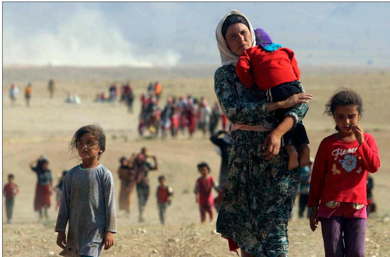
Yazidíes de Irak caminan junto a la frontera siria en su huida del Daesh en el verano de 2014