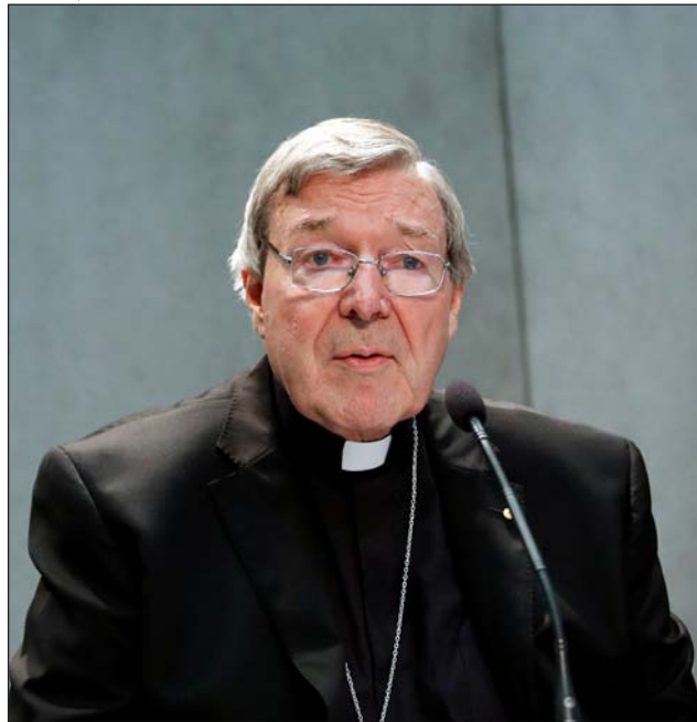
Rueda de prensa de Pell el 29 de junio. A su derecha, Luis Ladaria durante una visita en octubre de 2015 a Madrid, a la Universidad Francisco de Vitoria

en su calidad de secretario, ha intervenido en muchos de los procesos por delicta graviora (delitos graves de los sacerdotes) y ha sido parte integrante de las principales decisiones en la materia. Colabora en la congregación desde 1992 y es su secretario desde 2008. Su designación envía una clara señal de continuidad.