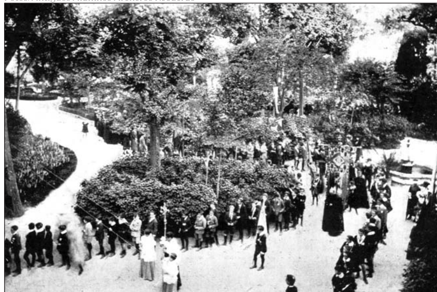
Procesión del 31 de mayo de 1918 por los jardines del colegio del Recuerdo