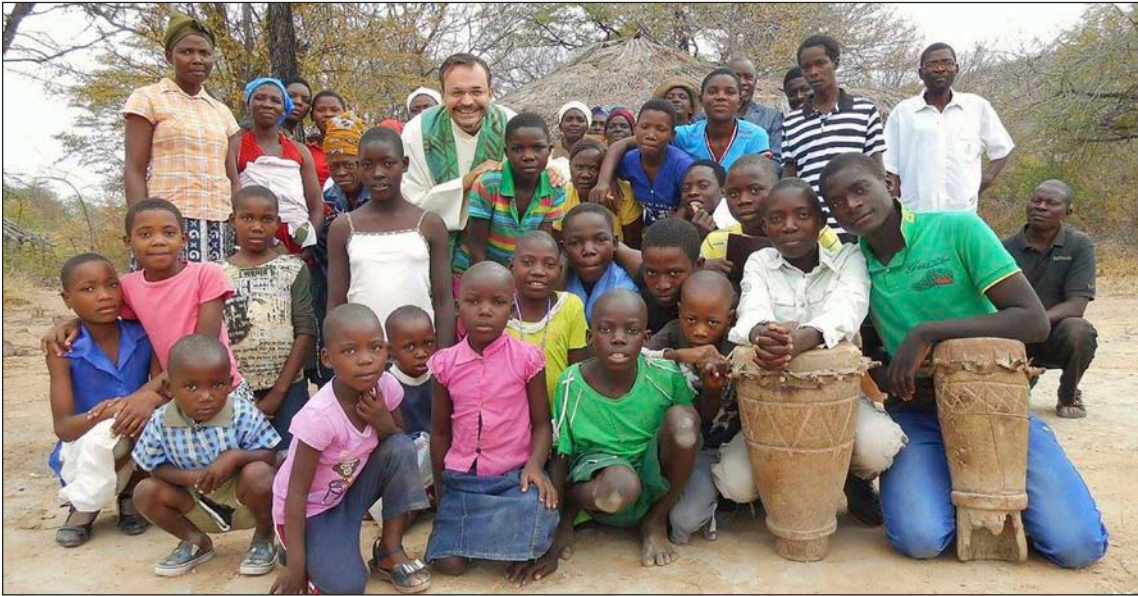
Leo con fieles de la etnia tonga en la diócesis de Hwange

P rimera pregunta obligada: ¿Quiénes son los tonga?