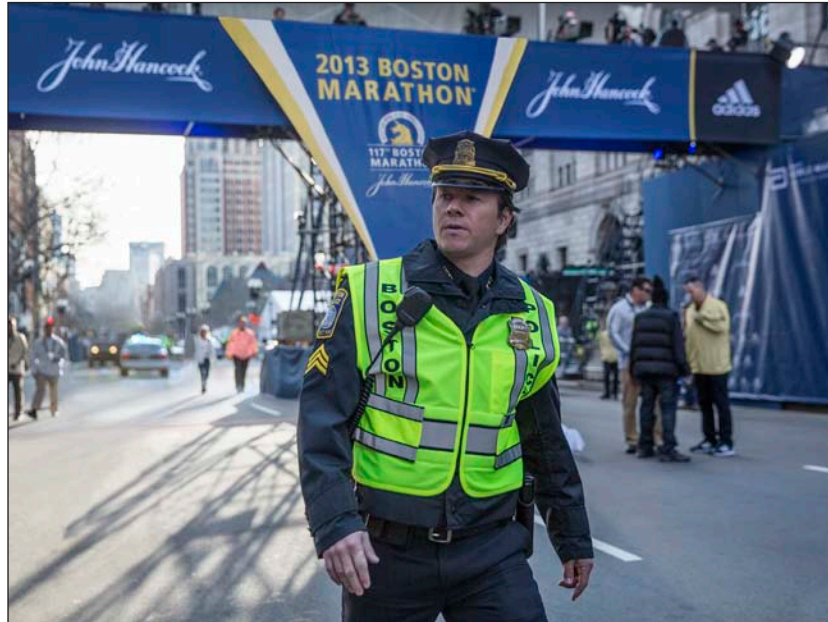
Peter Berg recrea, con el ficticio agente Tommy Saunders, el atentado de Boston

abril de 2013, mientras se celebraba el maratón de Boston dentro de las celebraciones del Patriot's Day, dos islamistas, los hermanos Tamerlán y Dzojar Tsarnaev, hicieron explotar sendas bombas cerca de la meta, matando a tres personas e hiriendo a casi 300. La película reconstruye los hechos, incluida la investigación, búsqueda y persecución de los terroristas por parte del FBI. Mark Wahlberg interpreta a un policía, Tommy Saunders, que estuvo presente en el