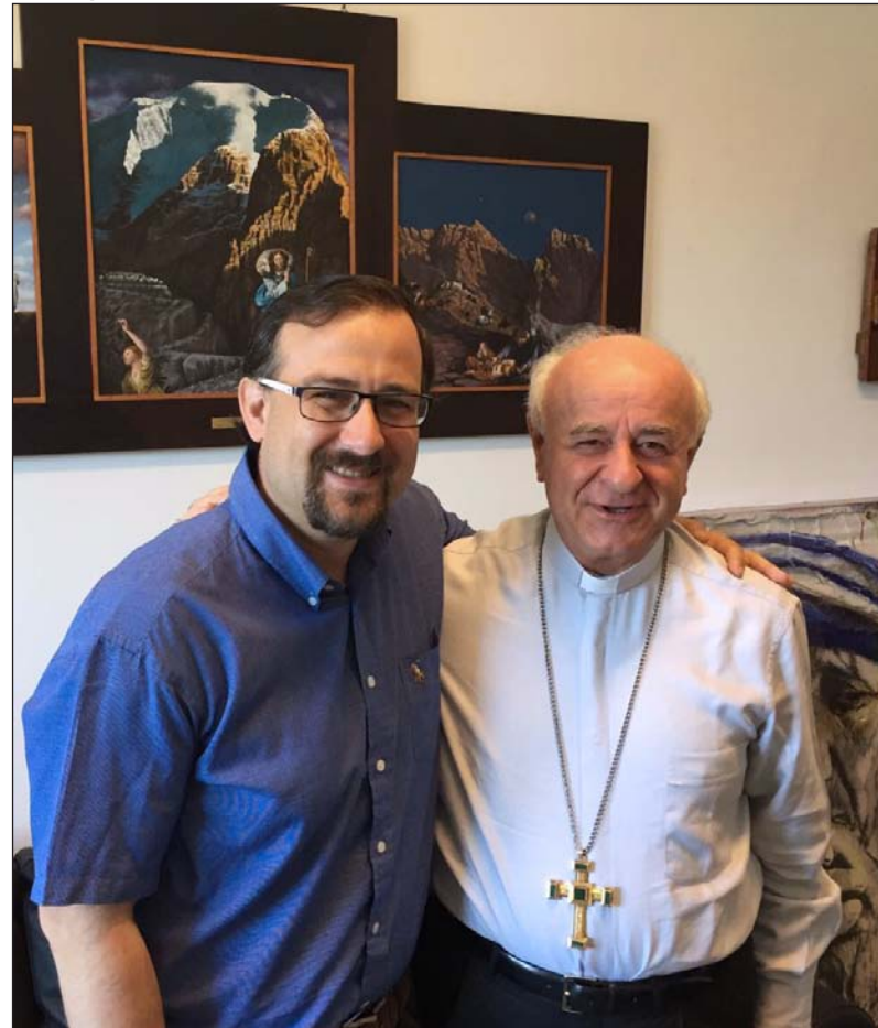
Un momento de la entrevista