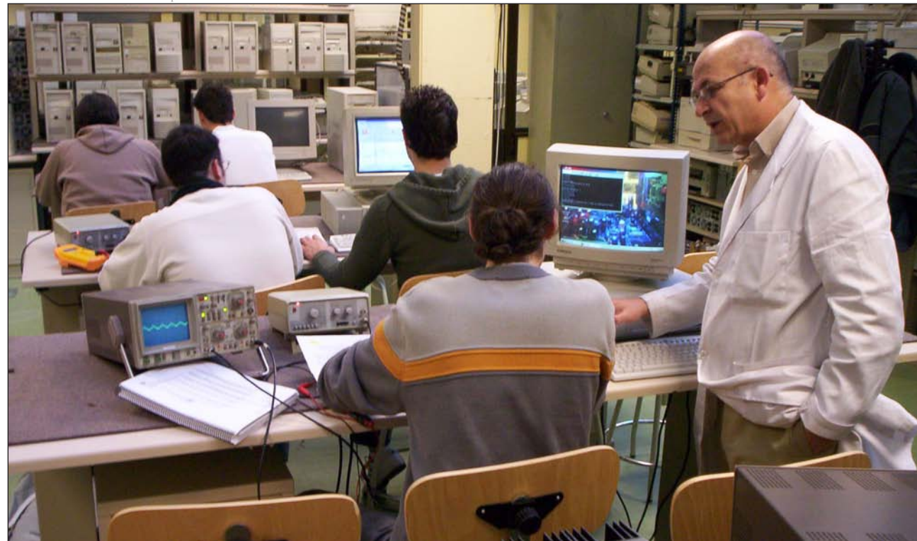
Una clase de Formación Profesional en el centro Padre Piquer