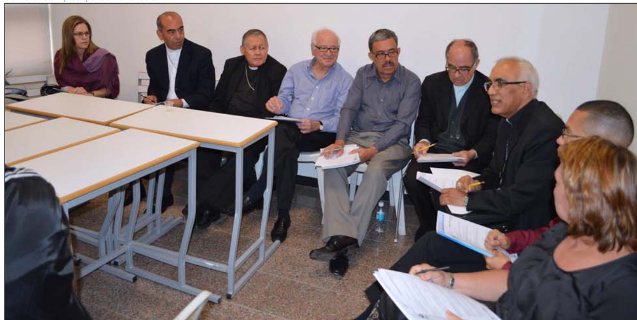
Una mesa de trabajo durante la I Asamblea Conjunta de Obispos y Laicos de Venezuela

oposición una parte del fracaso hasta ahora de las negociaciones para buscar una salida a la situación generada tras la negativa del presidente Nicolás Maduro a aceptar las firmas recogidas para un referéndum revocatorio. «2016 terminó muy mal, tan mal que en 50 años no habíamos atravesado una etapa tan dura como la que hemos sufrido con este Gobierno», dijo este lunes el presidente de