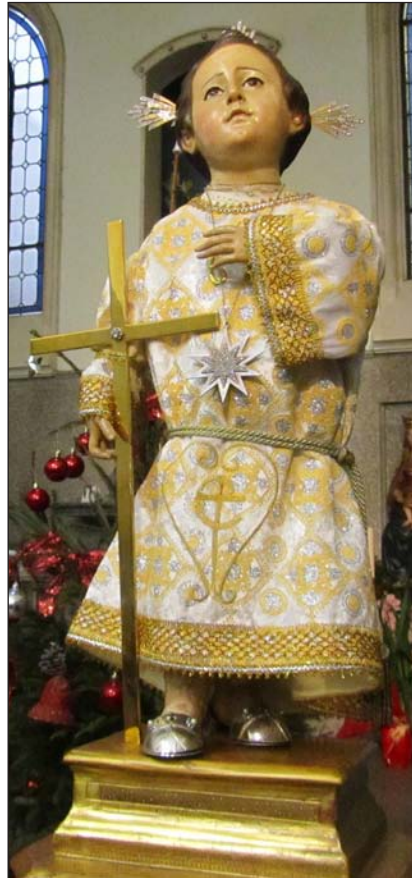
El Niño expuesto a la veneración de los fieles

Este viernes, 13 de enero, la imagen del Santo Niño del Remedio será bajada de su hornacina y colocada delante del altar para la veneración popular. El templo permanecerá abierto desde las 8 hasta las 20 horas, y la Eucaristía se celebrará a las 8:30, 11:30 y 19:00 horas.