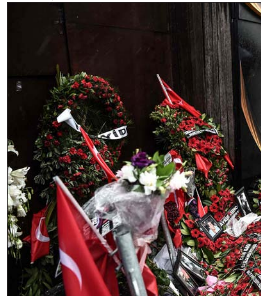
Memorial en el exterior del club Reina (Estambul),

nunciarse públicamente sobre la situación.