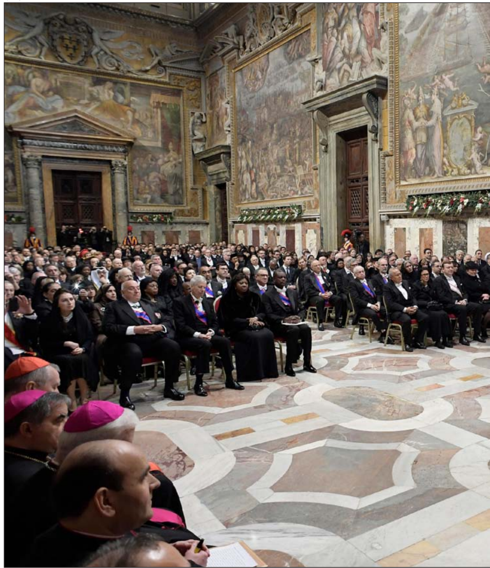
Discurso del Papa el lunes a los embajadores acreditados ante la Santa Sede

Francisco calificó el terrorismo fundamentalista como fruto de una «grave miseria espiritual», muchas veces producto de una «considerable pobreza social». Para derrotarlo –insistió– se requiere la acción común de los líderes religiosos y políticos. A los primeros les toca predicar valores alejados de la violencia; a los segundos, «garantizar en el espacio público el derecho a la libertad religiosa». Porque la responsabilidad de los gobernantes es evitar que se den las condiciones favorables para la propagación de los fundamentalismos con medidas sociales que combatan la pobreza, valoricen la familia, la educación y la cultura.