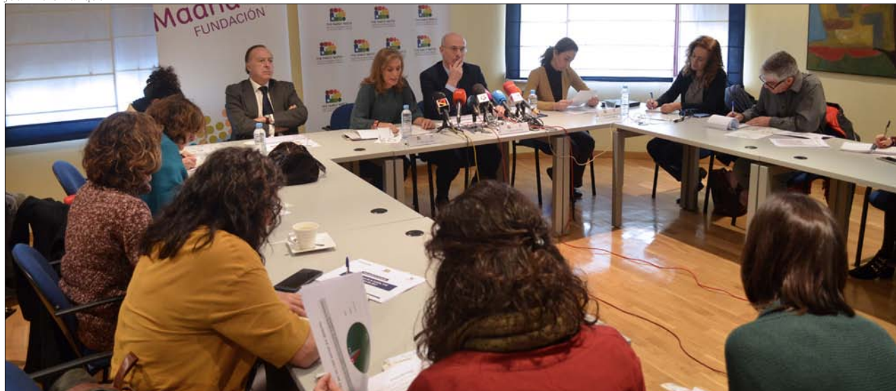
Presentación del Barómetro de la Familia