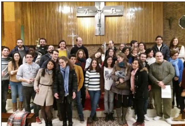
Algunos jóvenes que participaron en Una Luz en la Noche

la misma fe y las mismas inquietudes, y las mismas ganas por evangelizar en sus ambientes». La próxima edición de Una Luz en la Noche en la parroquia de San Ricardo será el sábado 4 de febrero.