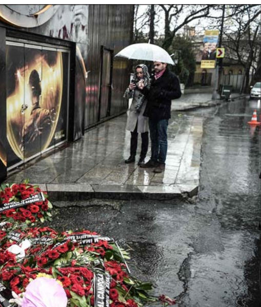
tras el atentado de Nochevieja

100.000 funcionarios suspendidos, y se han cerrado universidades, colegios privados, ONG, sindicatos y medios de comunicación. El lunes comenzó a debatirse en el Parlamento una reforma constitucional para -con el apoyo de los nacionalistas turcos- cambiar el sistema parlamentario por uno presidencialista que dé más poder al jefe de Estado.