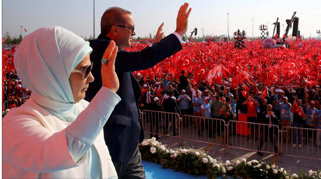
Erdogan y su mujer, el 7 de agosto, durante un acto de protesta en Estambul contra el intento de golpe de Estado

▼ Turquía debe elegir entre ser un puente entre el islam y Occidente y un ejemplo de democracia para otros países musulmanes, o convertirse en un Estado autoritario más de Oriente Medio