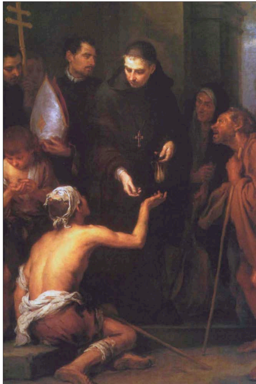
Santo Tomás de Villanueva repartiendo limosnas, de Murillo. The Wallace Collection, Londres