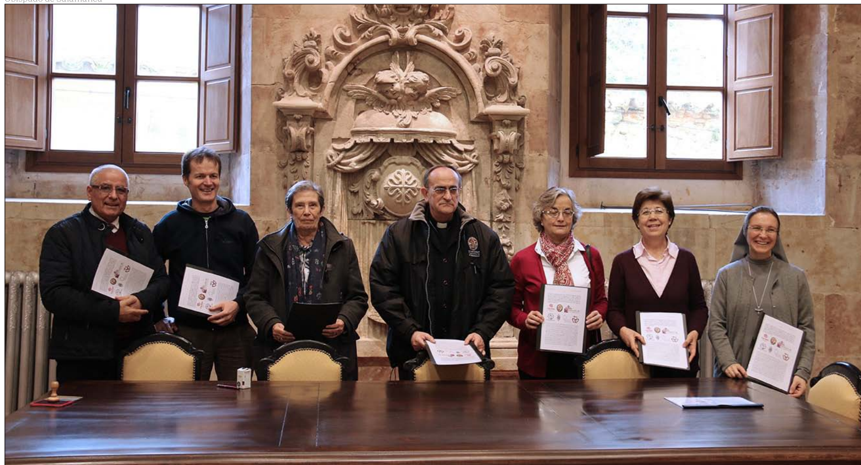
Los responsables de las entidades que lideran Ranquines posan tras firmar el convenio que da concreción legal, organizativa y económica al proyecto