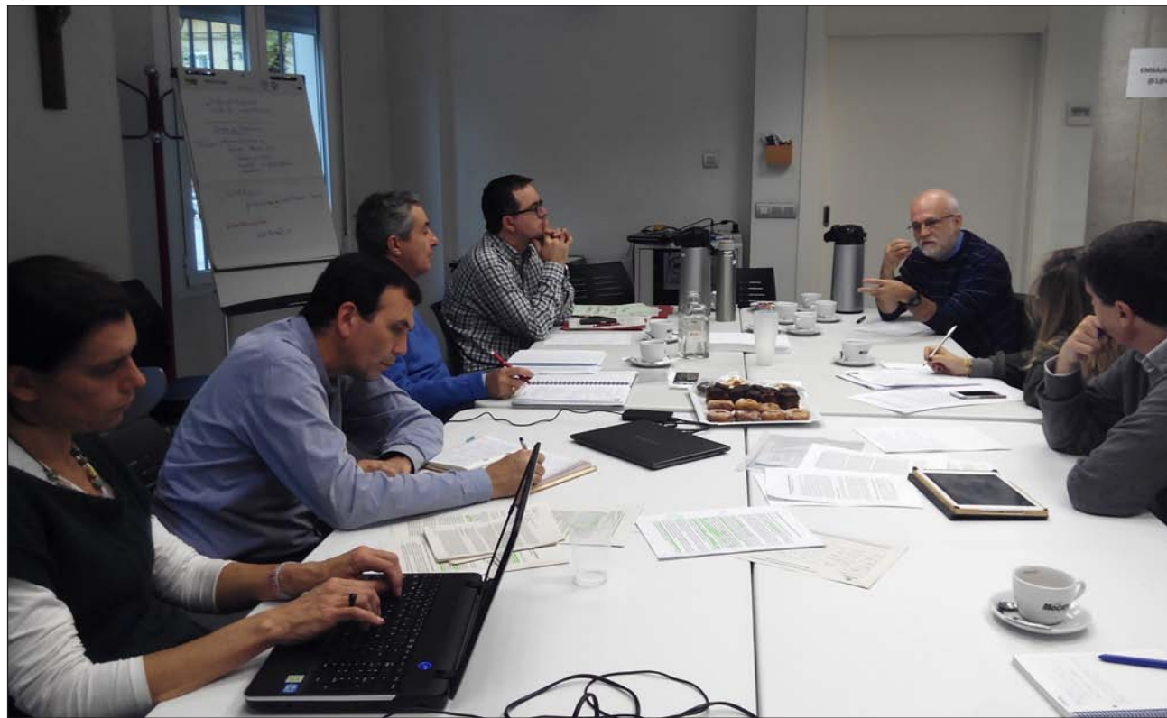
Reunión del Foro Creyente de Pensamiento Ético Económico a finales de noviembre en Madrid

El 29 de noviembre se reunía por segunda vez en Madrid el Foro Creyente de Pensamiento Ético Económico (FCPEE). El grupo de académicos que lo componemos tratamos el tema que nos va a tener ocupados este curso: debatir sobre si la economía está orientada en la dirección correcta o precisa de un cambio de dirección para que pueda cumplir su función de potenciar el bien común y estar al servicio de todas las personas. A la espera de que en nuestra reunión de primavera elaboremos unos documentos en los que nuestras reflexiones se presenten de una manera rigurosa, voy a adelantar algunas de las cuestiones que ya hemos tratado.