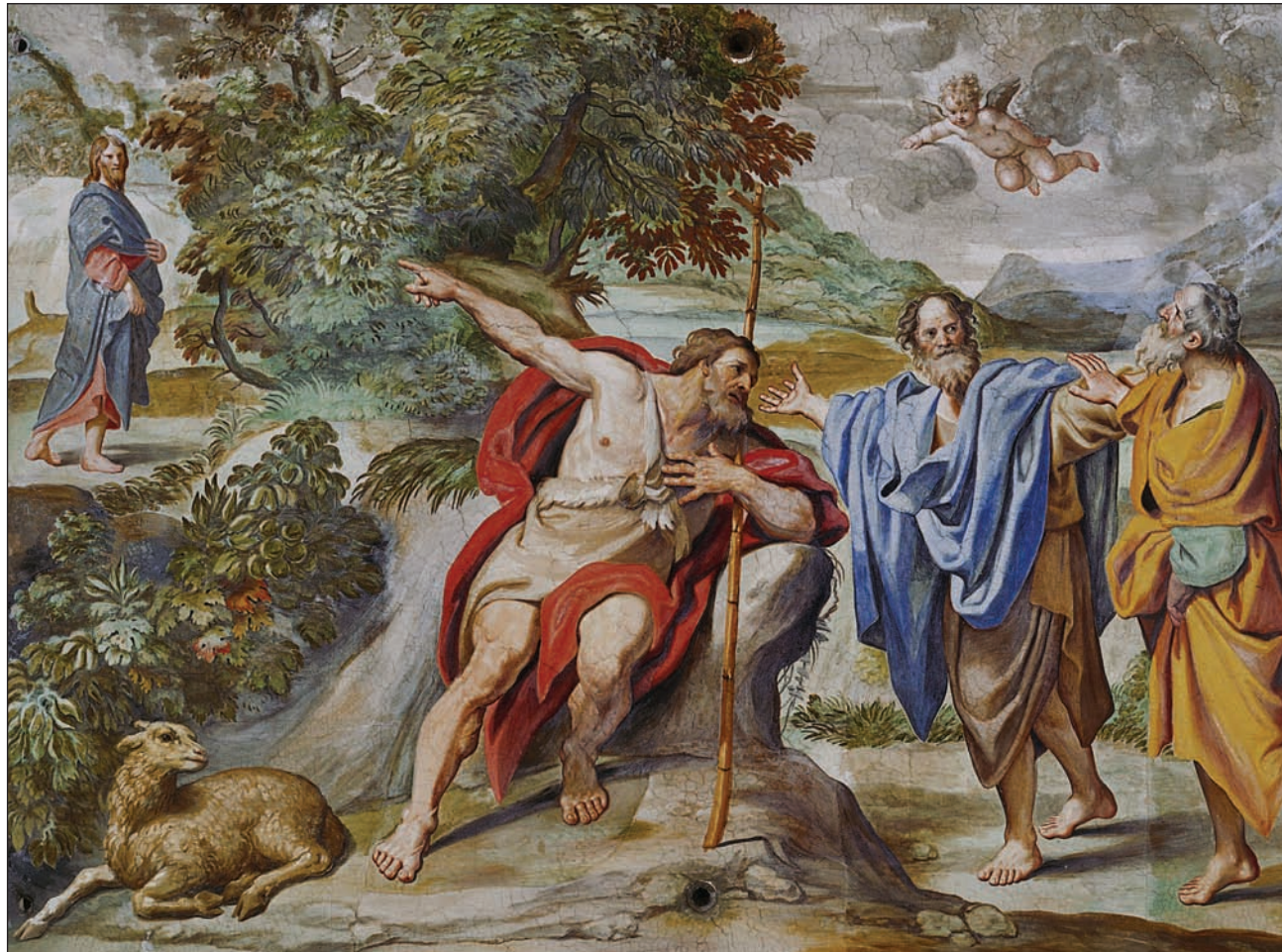
Juan Bautista señala a Jesús (ca. 1625), de Domenicino. Iglesia de San Andrés del Valle, Roma