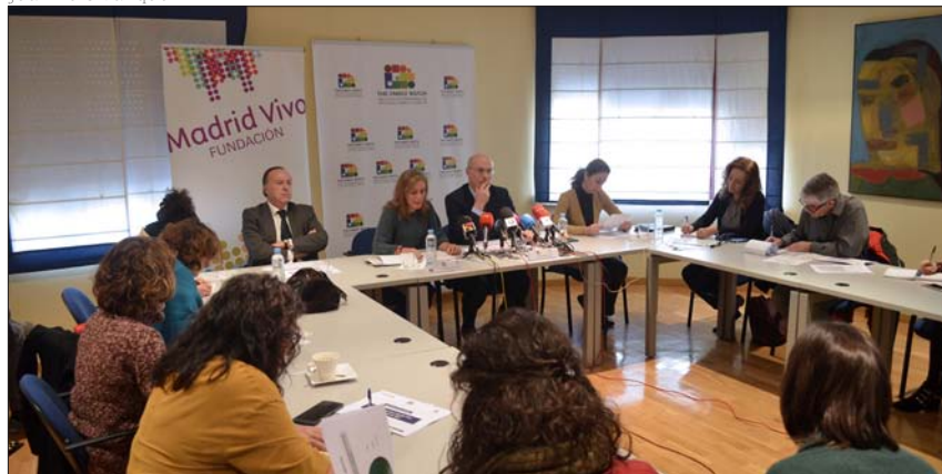
Presentación del Barómetro de la Familia