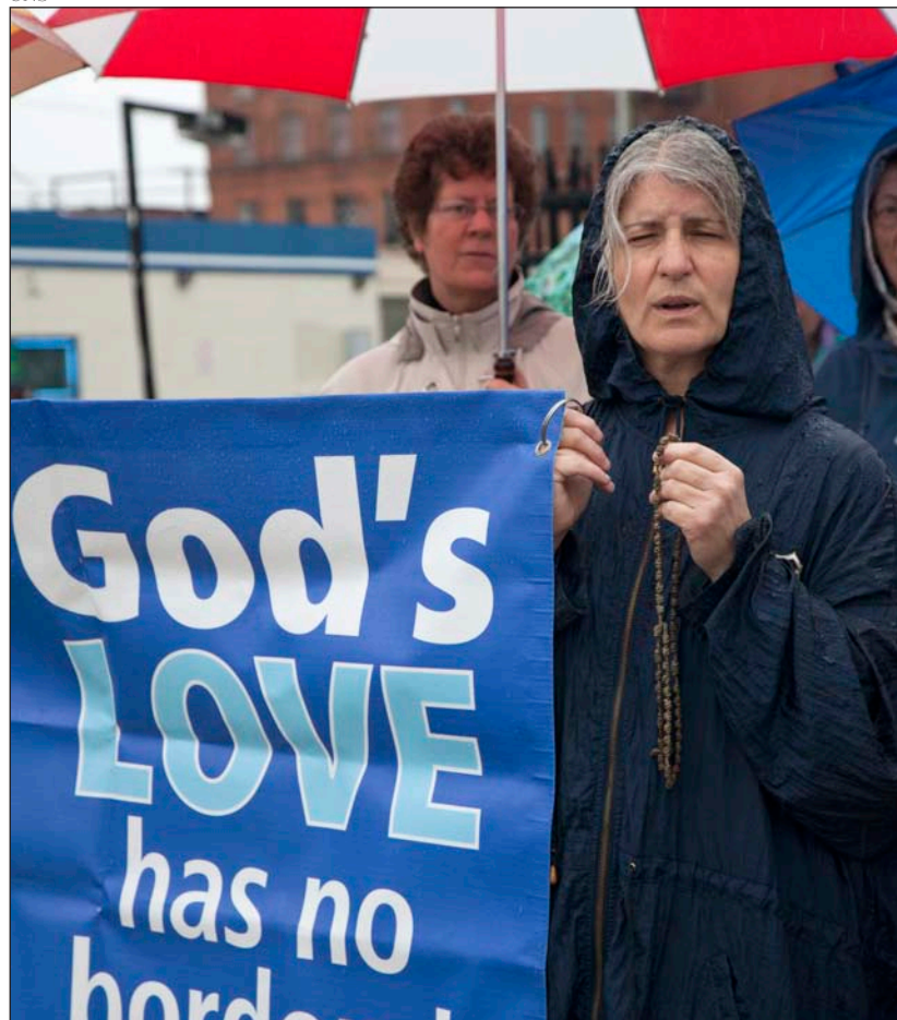
Vigilia de oración por la reforma migratoria, en Detroit