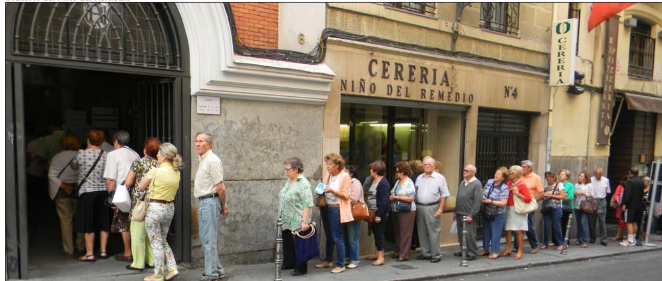
Largas colas ante el oratorio del Niño del Remedio, el día 13 de un mes cualquiera