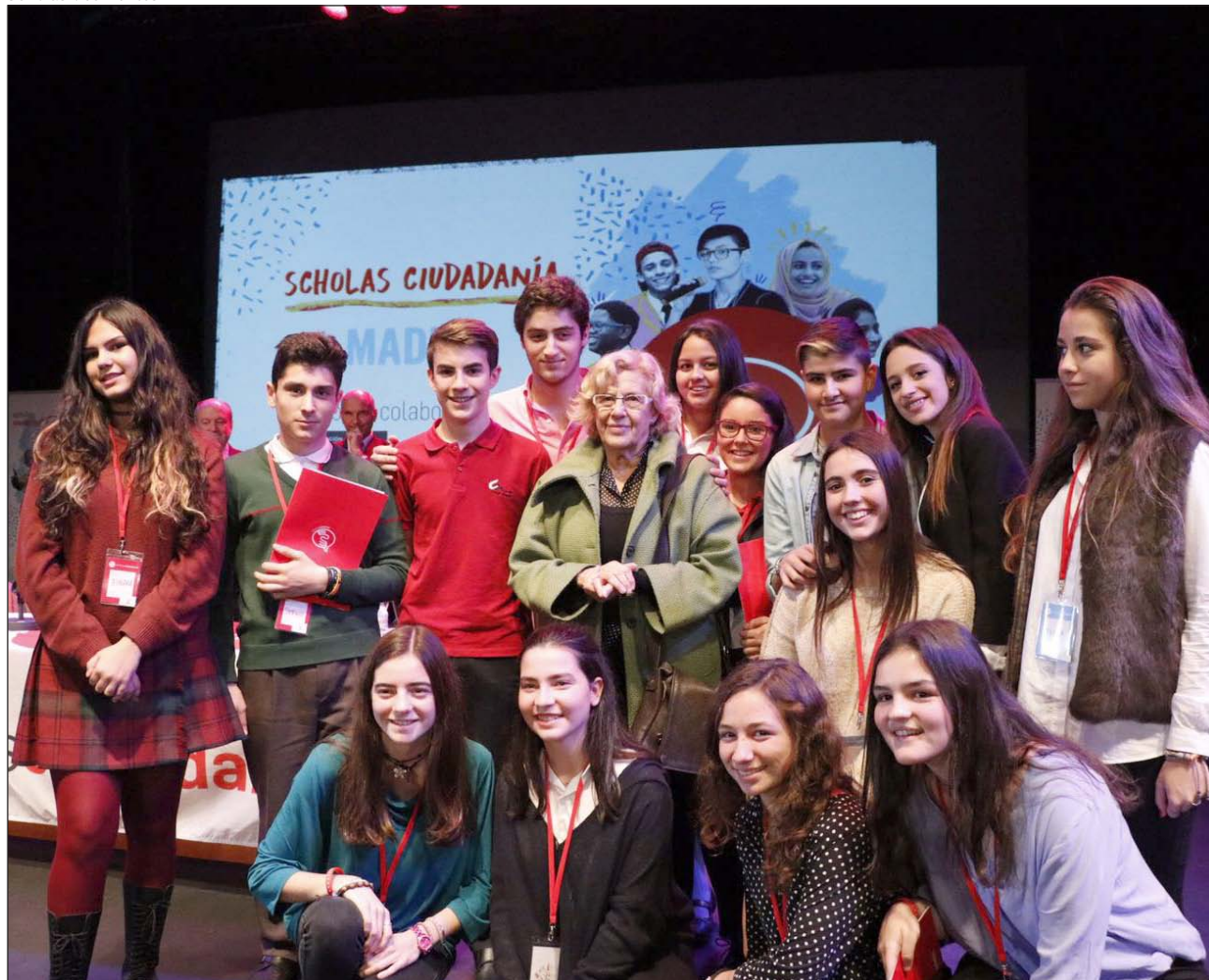
Manuela Carmena, alcaldesa de Madrid, junto con algunos de los estudiantes que participaron en Scholas Ciudadanía