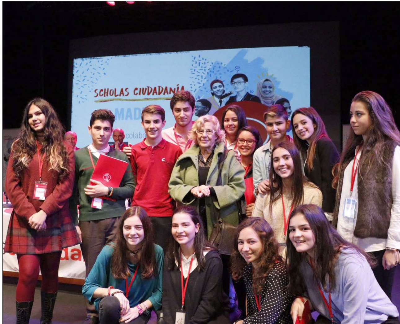
Manuela Carmena, alcaldesa de Madrid, junto con algunos de los estudiantes que participaron en Scholas Ciudadanía