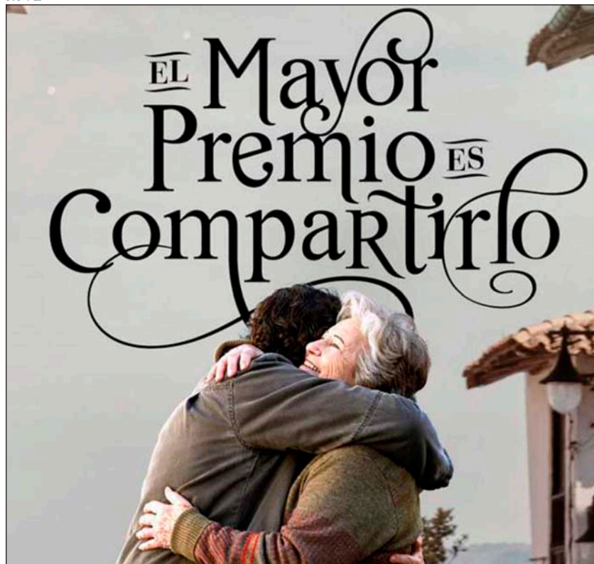
Cartel del anuncio de la Lotería de Navidad 2016

ria de un encuentro. De un grupo de personas que salen de sí hacia el otro; un encuentro no idealizado sino encarnado en abrazos concretos, que los hay, muchos y buenos. Es, además, una historia de un encuentro que termina en lo más alto. Como sería pecado laico y publicitario, no culmina en ningún campanario, pero bien está ese faro, conciencia moral, primer anuncio para tantas ocasiones en las que an-