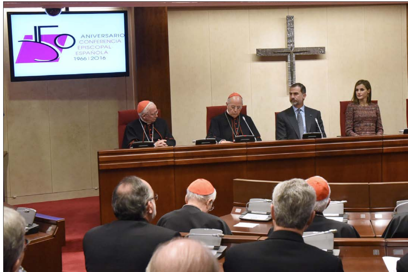
Felipe VI y Letizia visitaron por primera vez la sede de la Conferencia Episcopal Española