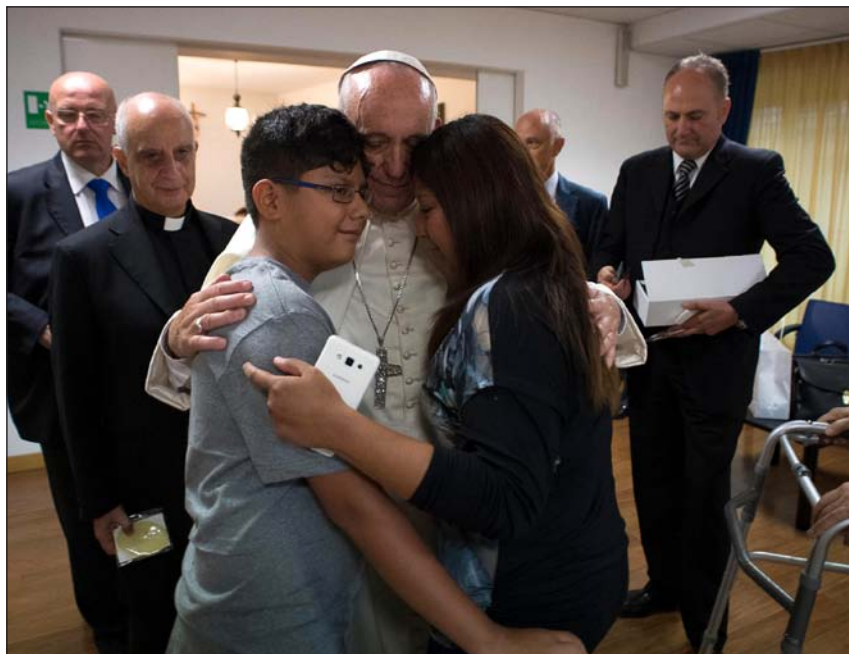
Dos viernes de la misericordia: con niños de Aldeas Infantiles, en octubre, y en el Centro Villa Speranza, para enfermos de cáncer en fase terminal, en septiembre

para que cada uno, sin excluir a nadie, sin importar la situación que viva, pueda sentirse acogido concretamente por Dios, participar activamente en la vida de la comunidad y ser admitido en ese Pueblo de Dios».