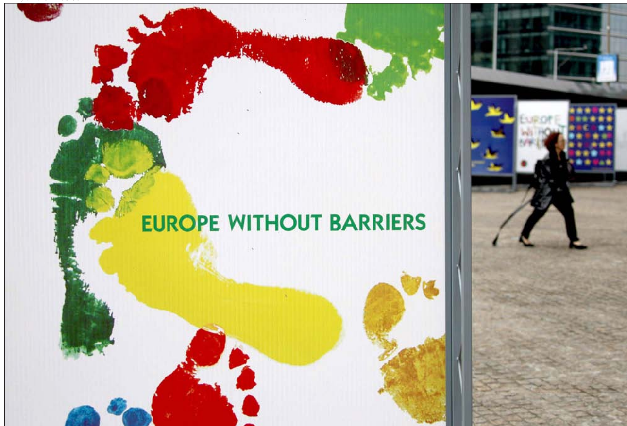
Una mujer pasa junto a un cartel que reza: Europa sin fronteras, frente a la Comisión Europea (CE), en Bruselas (Bélgica)

▼ Nosotros, cristianos, no tenemos miedo a entrar sin privilegios en el diálogo a campo abierto con los demás. Para nosotros esta es una ocasión extraordinaria de verificar la capacidad que tiene el acontecimiento cristiano para mantenerse en pie ante los nuevos desafíos