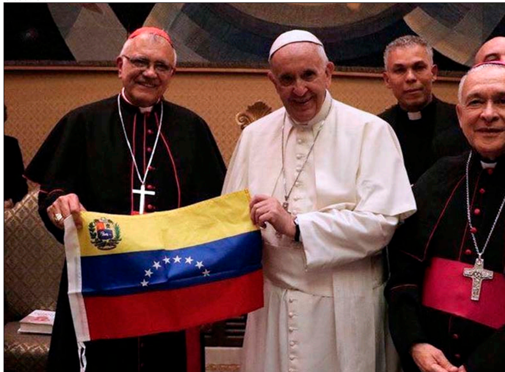
El Papa recibe en audiencia privada el domingo al cardenal Porras y a la delegación venezolana