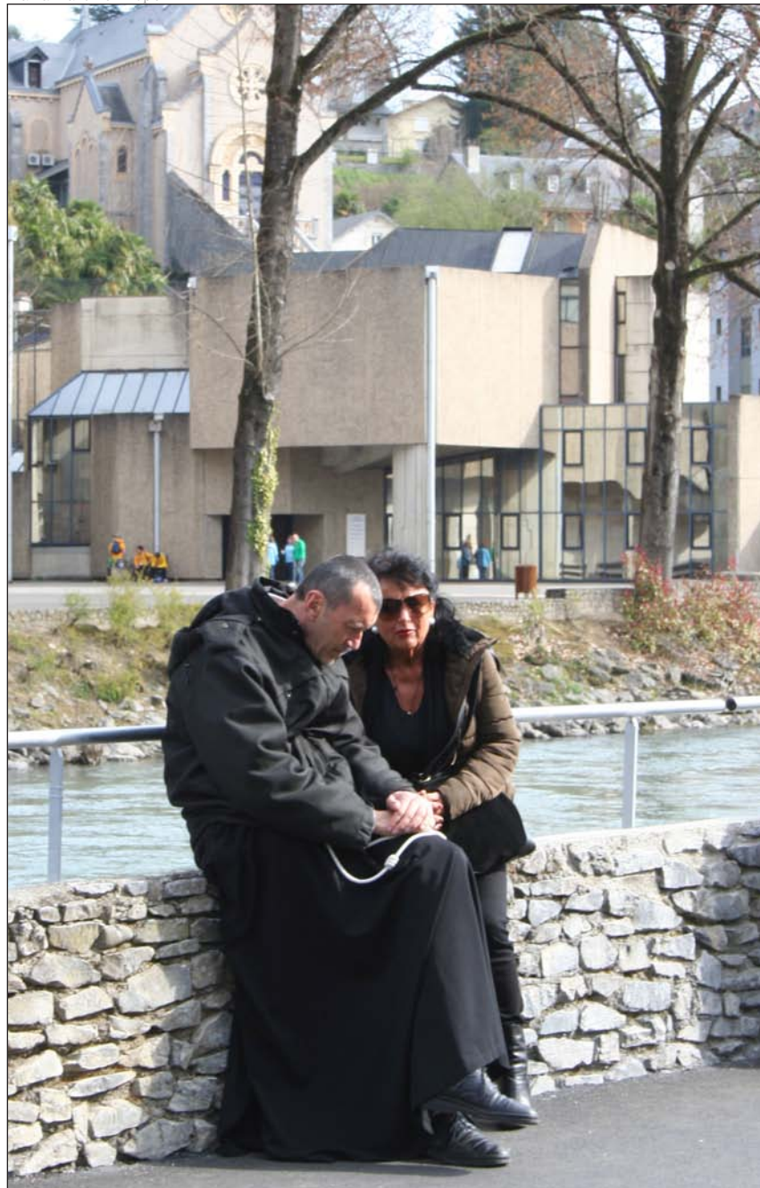
Una mujer se confiesa en el santuario de Lourdes