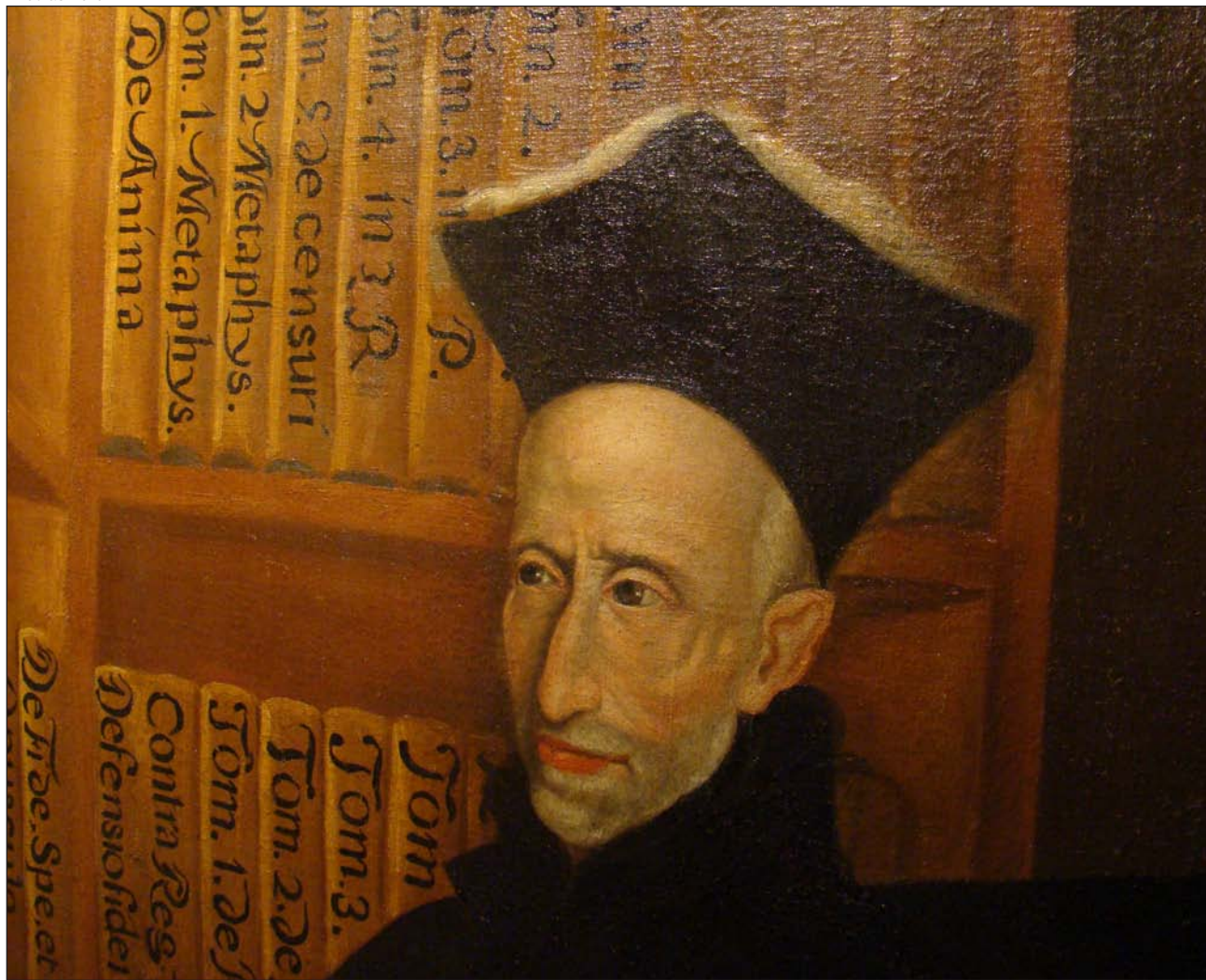
Francisco Suárez en un retrato del siglo XVII. Museo de la Universidad de Valladolid