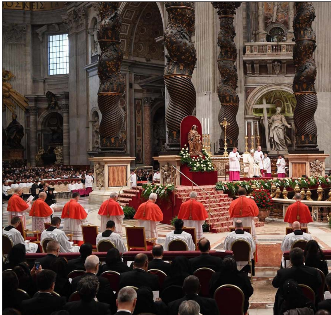
Un momento del consistorio de este sábado, en la basílica de San Pedro

na» o tener otras costumbres, idioma o religión. Frente a esto, el Evangelio nos dice que «en el corazón de Dios no hay enemigos, Dios tiene hijos». Nuestra «primera e instintiva reacción» es descalificar, maldecir o demonizar a quienes nos odian, pero Jesús nos