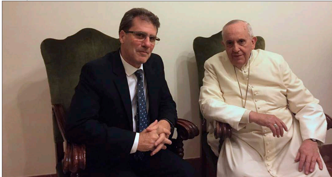
El Papa Francisco junto a su amigo Marcelo Figueroa, durante una audiencia privada en el Vaticano