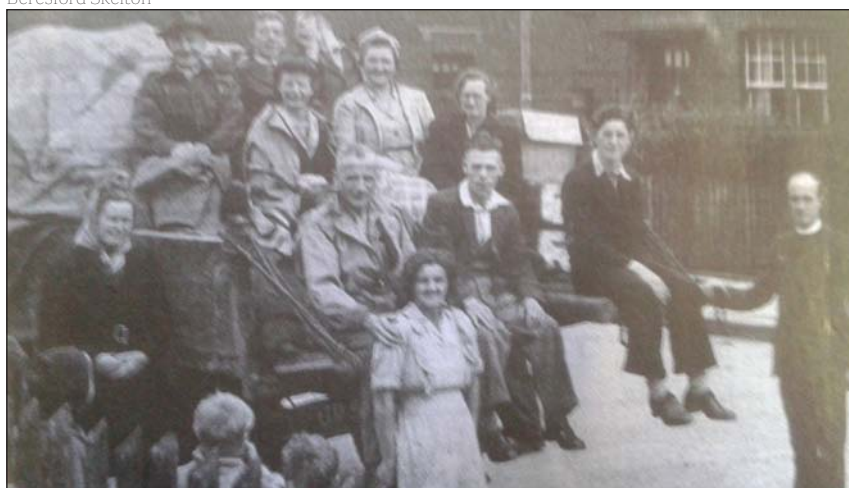
Un fundador de la compañía, a punto de salir a un campamento con su parroquia