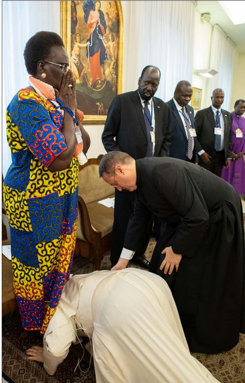
El gesto del Papa conmovió a la vicepresidenta de Sudán del Sur, Rebecca Nyandeng