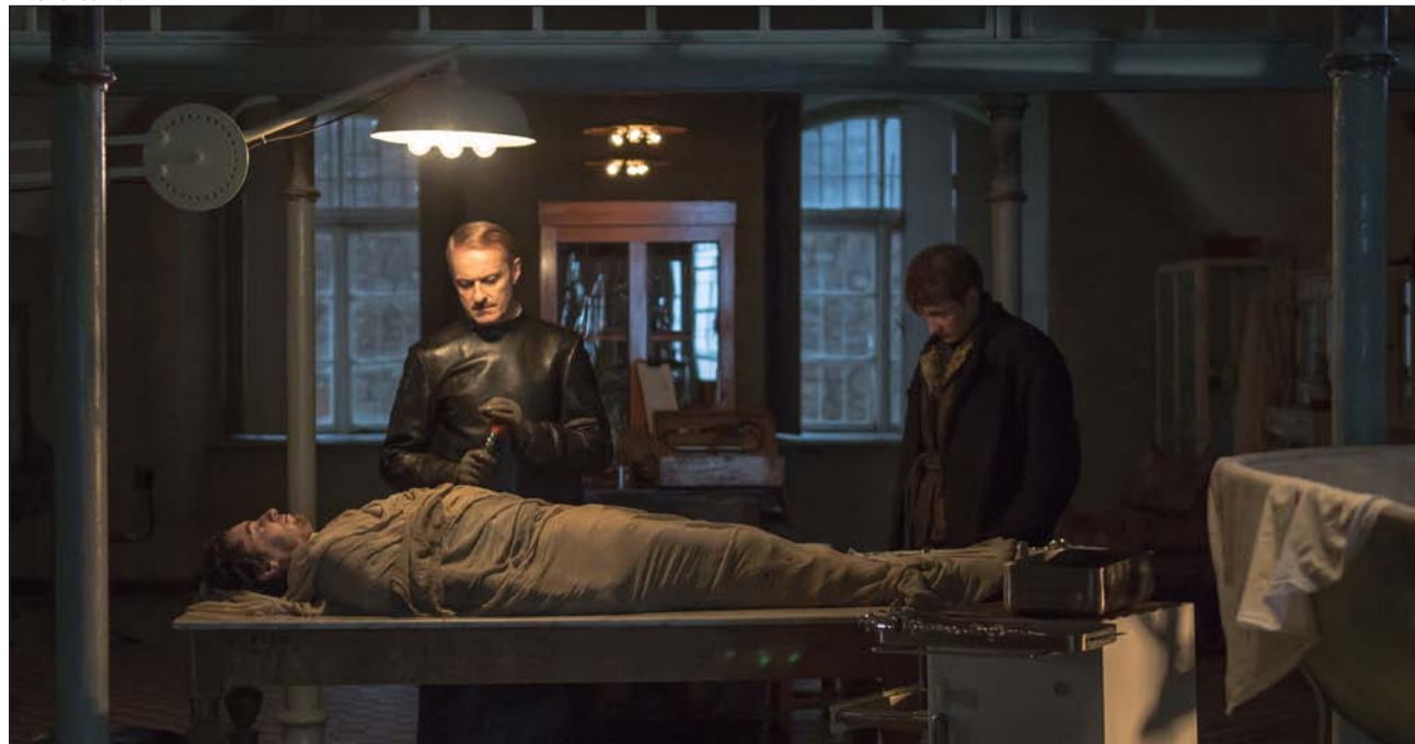
El médico alemán (interpretado por Jacek Poniedzialek), experimenta con un paciente las propiedades del éter

quier moral y de toda concepción religiosa del ser humano. El director polaco no solo pretende hacer un relato de cómo vive un individuo que no cree nada más que en lo que puede controlar, sino que ofrece una interpretación de la historia contemporánea, en la que hay un protagonista discreto, el mal, que hace del materialismo ateo su mejor aliado.