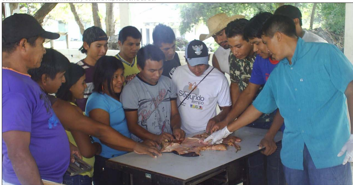
Centro Indígena de Formación y Cultura Raposa Serra do Sol

que el Gobierno brasileño hubiese reconocido esta tierra como una tierra indígena, de uso exclusivo de las comunidades, los grandes terratenientes que debían salir de allí respondieron violentamente y mandaron prender fuego de madrugada a todo el Centro de Formación de Surumu. No hubo daños personales, pero aún hoy los edificios presentan los impactos de aquel fuego criminal. Aquellos días, en medio de las brasas aún vivas, jóvenes alumnos y sus comunidades decidieron continuar allí, estudiando, a pesar de todo, como forma de resistencia y de firmeza, con una profundidad ética y espiritual impresionante.