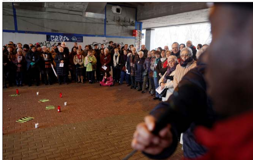
Un momento de la concentración en Aluche

todos los seres humanos, en la inquebrantable dignidad que corresponde a todos los hijos e hijas Dios, en su derecho a desplazarse para lograr sobrevivir y amenazador en los lugares de origen».