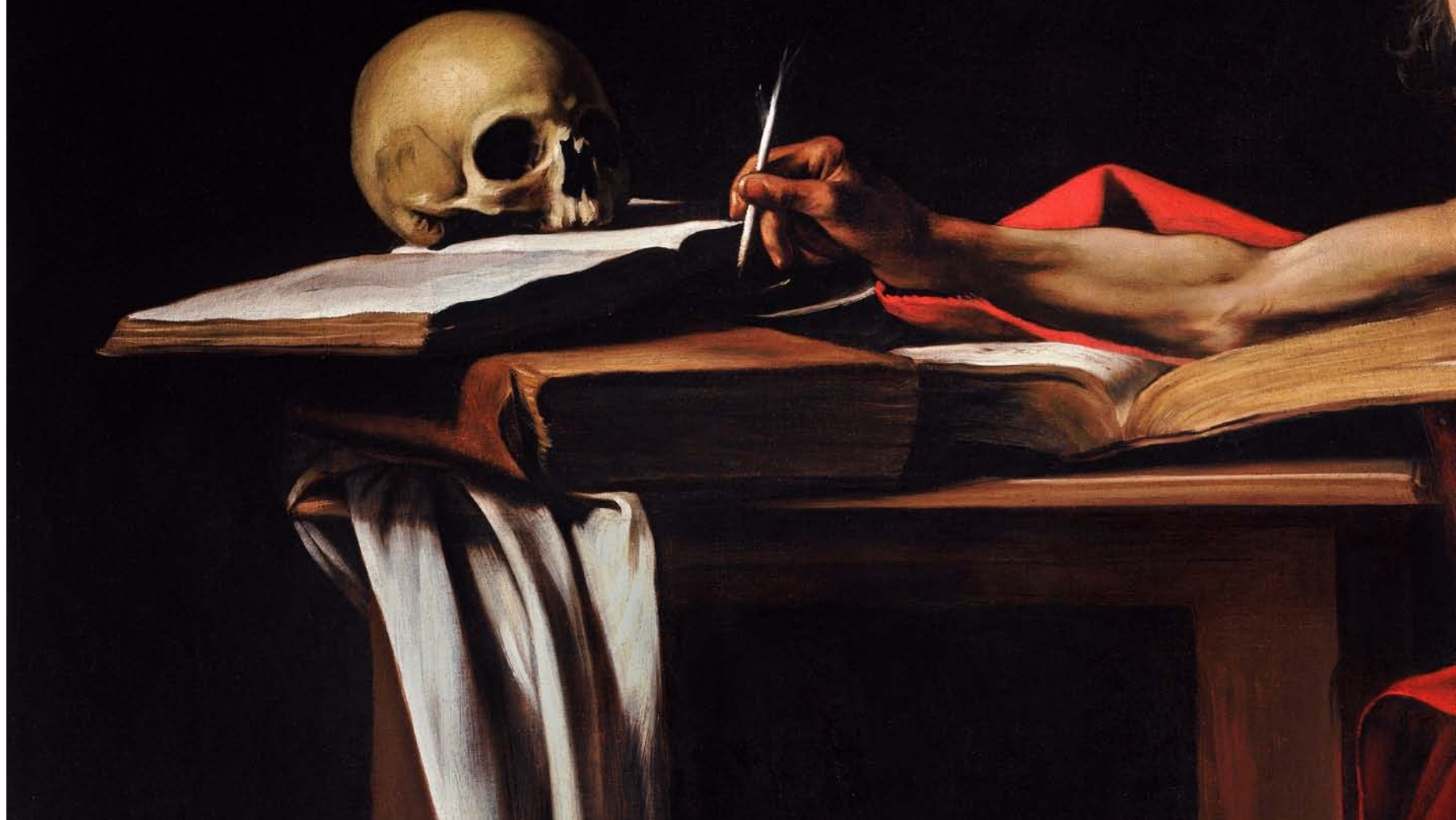
San Jerónimo en su estudio. Caravaggio. Galleria Borghese, Roma (Italia)

▼ Para hacer un homenaje a la Palabra de Dios, el Papa decidió decretar el tercer domingo del año como su día en la Iglesia. La primera celebración será el 26 de enero de 2020, año en el que se cumplen 1.600 años de la muerte de san Jerónimo, el primer traductor de la Biblia, que tuvo la intuición de trasladar su mensaje del latín, usado solo por una minoría erudita, al latín vulgar que se hablaba en las calles. Esta conmemoración coincide con el 50 aniversario de la fundación de la Federación Bíblica Católica