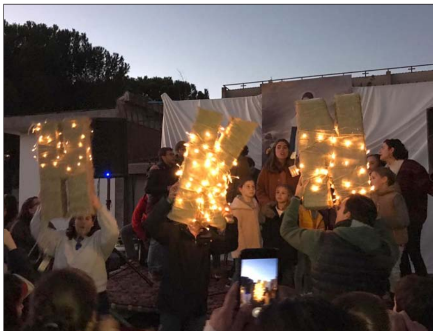
Una imagen del encuentro de las HAM y Hakuna

la asociación: revolcaderos quince-nales, en los que participan cerca de 600 personas, God break mensuales de retiro de una tarde, catequesis para gente que se quiere bautizar o recibir por primera vez la Eucaristía, Hemiciclos o encuentros abiertos en torno a un tema, o cursos prematrimoniales de periodicidad semanal para entre 50 y 100 parejas de novios.