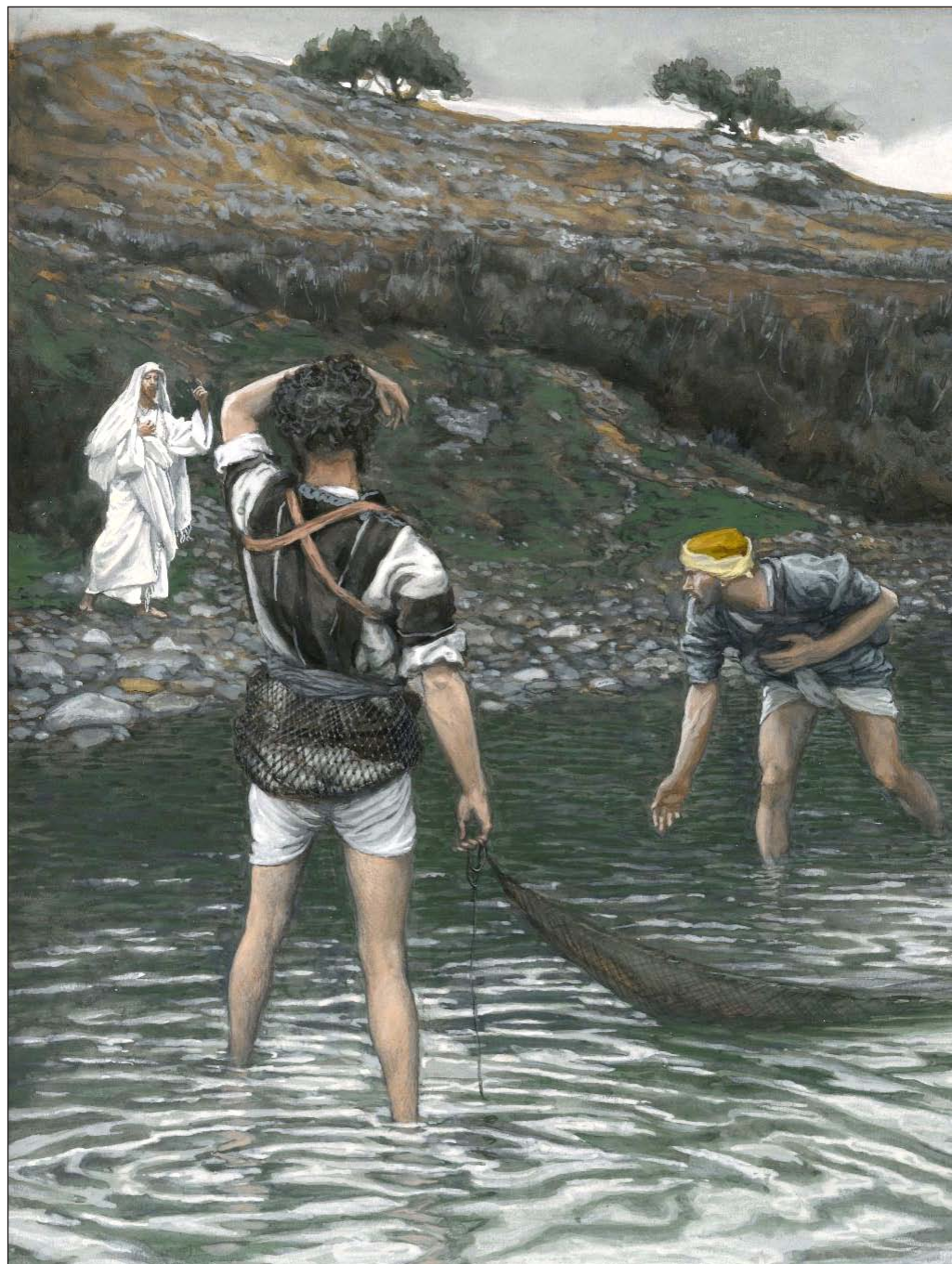
Vocación de san Pedro y san Andrés. James Tissot. Museo de Brooklyn, Nueva York

Desde el punto de vista geográfico, el texto comienza situando al Señor en Galilea; en concreto ahora se dirige a Cafarnaún y a un grupo de pueblos ubicados en la zona noroeste del lago de Tiberíades, «junto al mar (de Galilea)», como precisa Mateo. La misión desarrollada por Jesús en este lugar corresponde a una de las ideas clave del evangelista que lo narra: «para que se cumpliera lo dicho». La acción de Jesucristo ha de ser leída siempre como la realización de cuanto desde antiguo se había anunciado al pueblo de Dios. Por eso se cita aquí al profeta Isaías, íntimamente asociado a las promesas mesiánicas. Se trata precisamente de una cita de la primera lectura de este domingo. Aunque en este tercer domingo del tiempo ordinario se percibe con mayor claridad, la primera lectura suele ser una preparación a cuanto se escucha en el Evangelio, la palabra del mismo Señor. La zona de Galilea «de los gentiles» era llamada así debido a que estaba poblada por habitantes de raza, cultura y costumbres heterogéneas, y en gran mayoría paganos. Se conocía como una zona no solo alejada físicamente de Jerusalén, el centro religioso judío, sino también despreciada por ser una región desfavorecida y periférica. Así se entiende que Isaías dijera de sus habitantes que «habitaban en tinieblas y sombras de muerte». Frente a la oscuridad y la tristeza nos