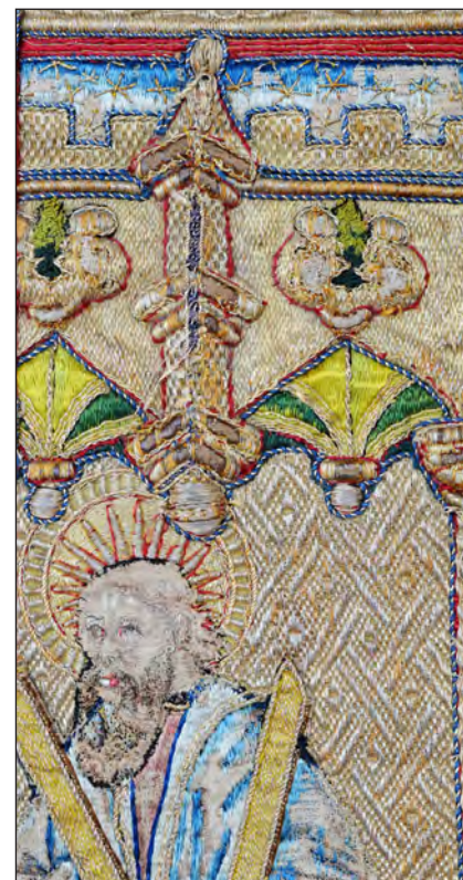
San Andrés bordado en una casulla