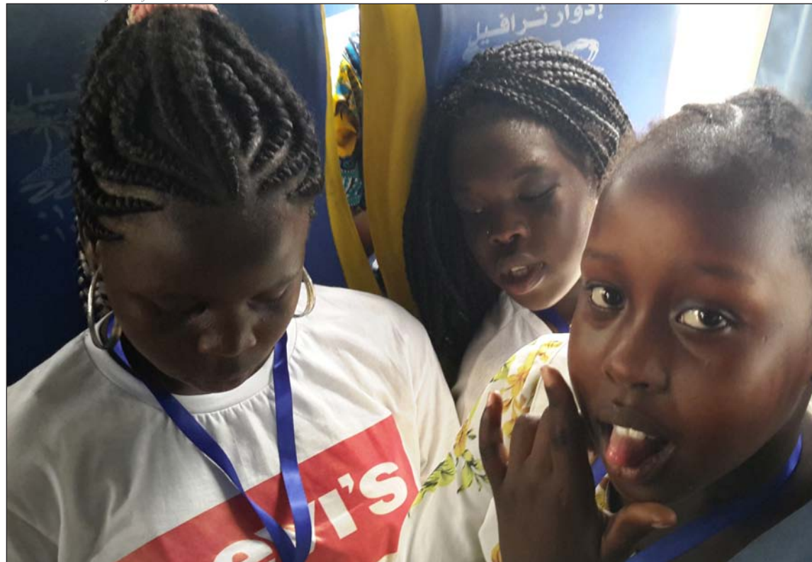
Niñas de Sudán del Sur durante una excursión organizada por la parroquia de Alejandría (Egipto)

▼ Gracias a la ayuda de OMP la parroquia del Sagrado Corazón de Alejandría (Egipto) da educación a casi 1.500 niños refugiados, sobre todo de Sudán del Sur. Este domingo se celebra la Jornada de Infancia Misionera con el lema Con Jesús a Egipto. ¡En marcha!