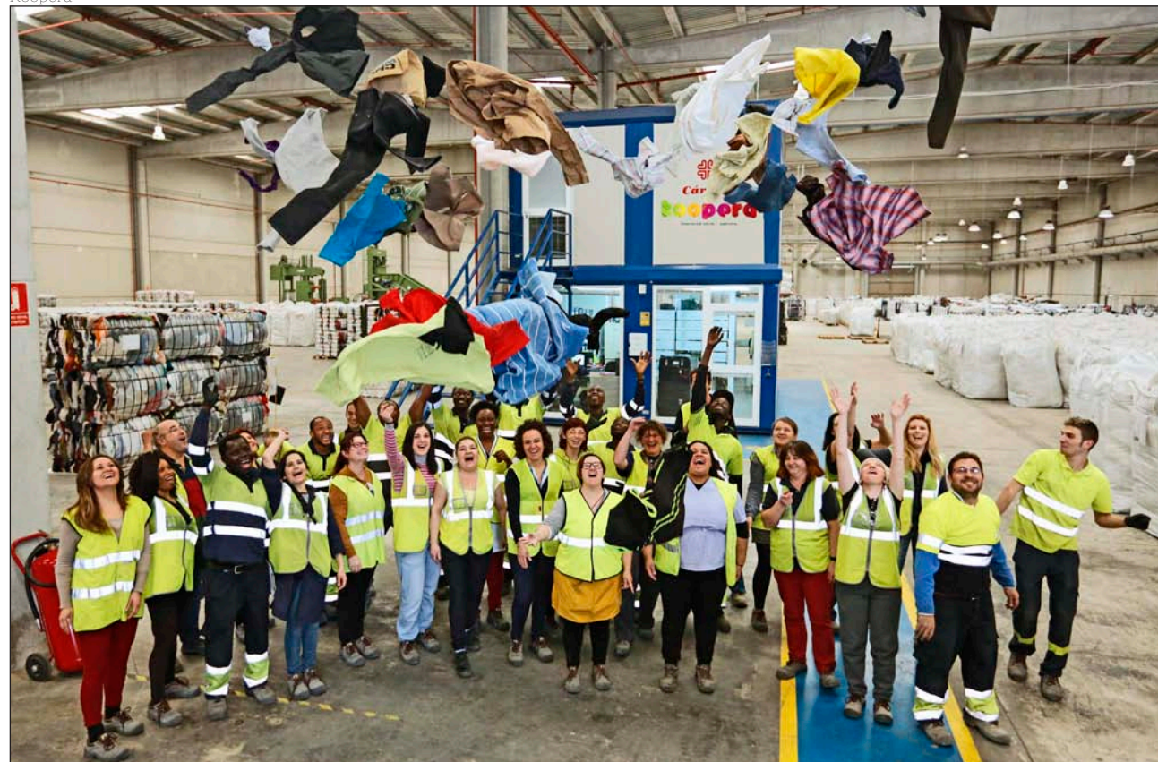
Trabajadores de la planta integral de Koopera, en Bilbao. Esta empresa de inserción de Cáritas recicla residuo textil