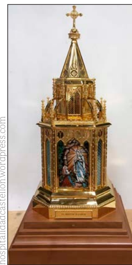
Reliquias de santa Bernardita

Las reliquias de los pastorcitos de Fátima no son las únicas que han recalado en nuestro país en los últimos meses. 2019 se cerró con la visita a España de los restos de santa Bernardita, que llegó tras más de dos años de peregrinación por Francia, Italia y Alemania. La vidente de Lourdes fue venerada en 196 puntos de toda la geografía española. Concretamente, visitó 49 diócesis, 45 catedrales, 42 conventos, 72 parroquias o santuarios, 23 hospitales o residencias, diez seminarios, una prisión, tres colegios. Cogieron cuatro ferris y recorrieron 17.570 kilómetros.