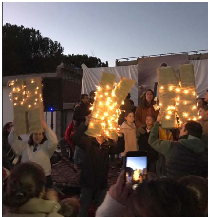
Una imagen del encuentro de las HAM y Hakuna