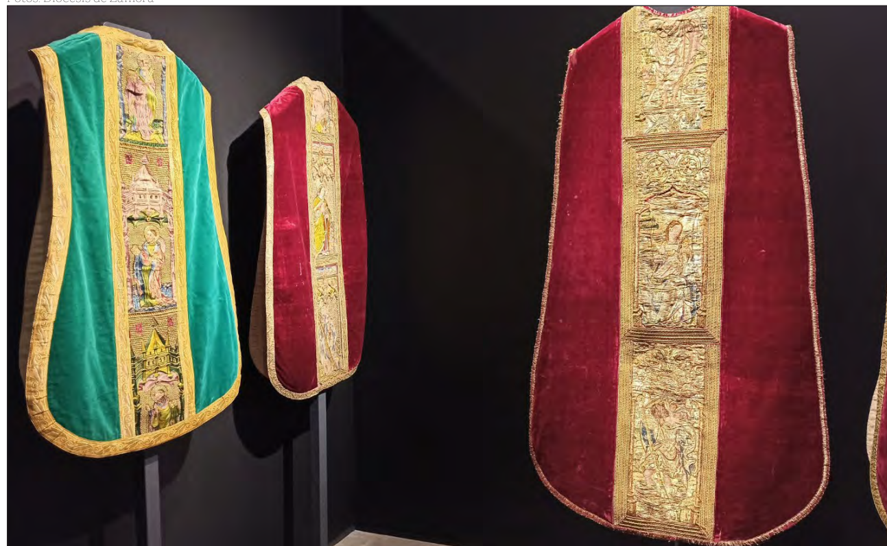
Casullas que forman parte de la exposición de bordados litúrgicos del Museo Diocesano de Zamora