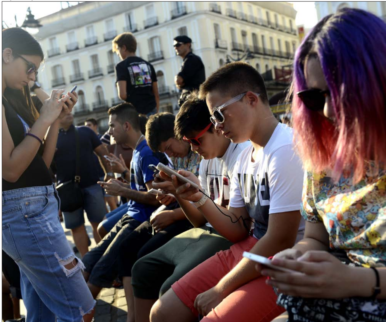
La tecnología sirve como escudo para relacionarse con los demás para los jóvenes más inseguros de sí mismos