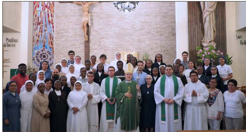
El cardenal Osoro, con los religiosos que preparan su profesión perpetua