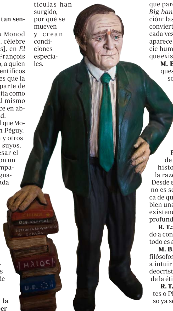
Figura de Ramón Tamames, regalo de la Sociedad de Pensamiento Lúdico

R. T.: La mecánica cuántica estudia las partículas subatómicas. El Big bang empieza con un movimiento de partículas subatómicas que dura millones de años, mientras se van formando los átomos, las estrellas, las galaxias... El universo todavía hoy está lleno de partículas subatómicas. Acabamos de ver la primera fotografía que se ha hecho de un agujero negro, a unos 55 millones de años luz de la tierra (en el centro de cada galaxia hay un agujero negro; también en la Vía Láctea. Todavía no lo hemos localizado, pero ya se intuye dónde está). Ahí aparecen fotones por todas partes. Y gravitones, neutrinos... Pero lo que no explica la física cuántica es por qué esas partículas han surgido, por qué se mueven y crean condiciones especiales.