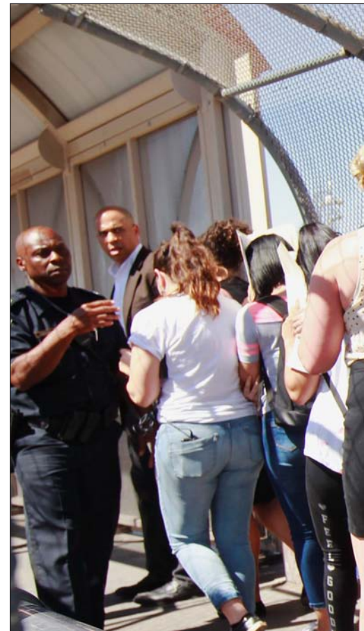
Un grupo de solicitantes de asilo cruza por el