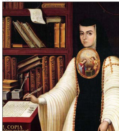
Sor Juana Inés de la Cruz

Su producción es escasa: tres autos y dos obras profanas (una en colaboración), trece loas y varios villancicos representables. Los empeños de una casa (1683), la obra americana más importante antes del siglo XX, es un texto de estirpe calderoniana donde una pareja de hermanos, doña Ana y don Pedro, se sienten atraídos por unos jóvenes, don Carlos y doña Leonor, que no solo no están