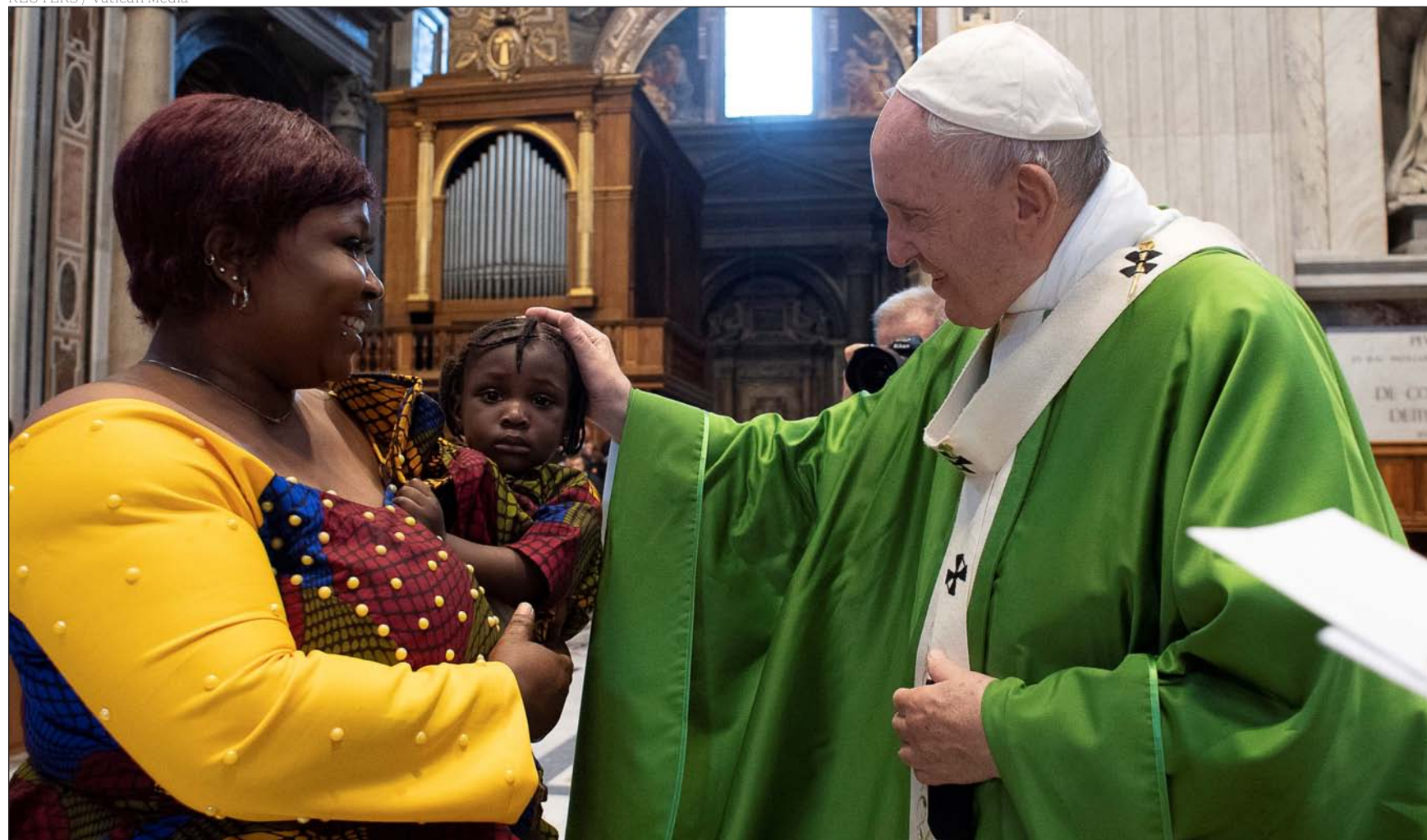
El Papa Francisco bendice a una madre con su bebé el pasado lunes, al finalizar la Eucaristía para los migrantes en la basílica de San Pedro