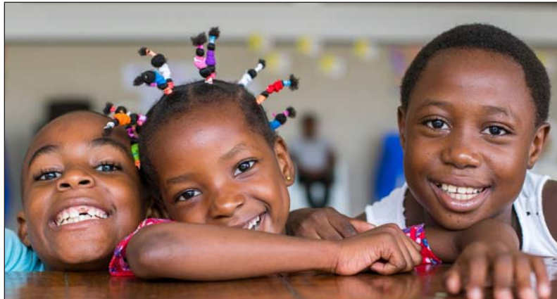
Una de las fotos expuestas en O_Lumen