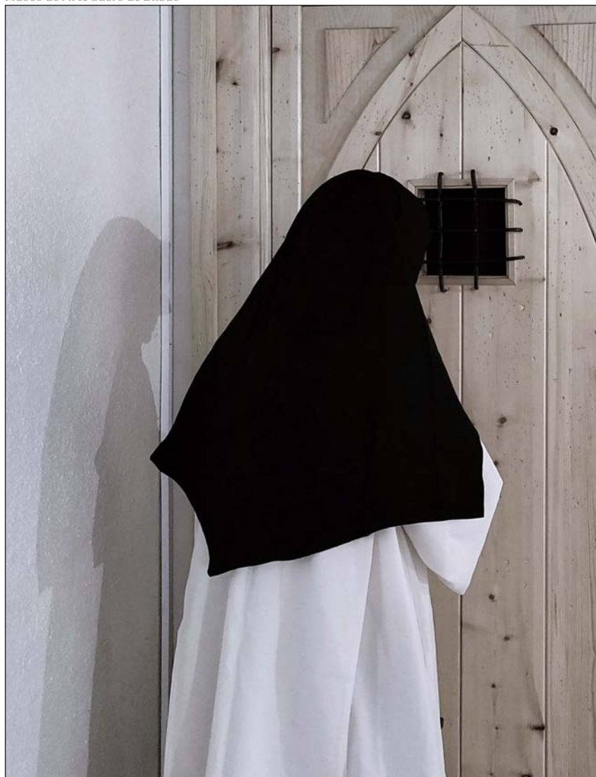
Los participantes jugarán de la mano de una monja o fraile que los guiará en la aventura de salvar el convento

que simulan la celda del abad, el escritorio y el laboratorio. De la mano del game master –un fraile [disfrazado] que los acompaña– irán buscando pistas a través de las diferentes obras que hay en el recinto para encontrar los