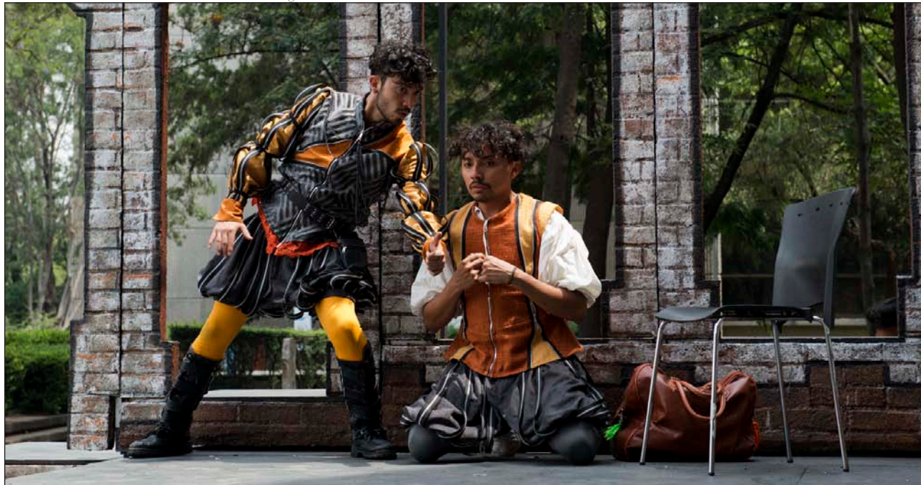
Un momento de la representación Los empeños de una casa

Festival Internacional de Teatro clásico de Almagro