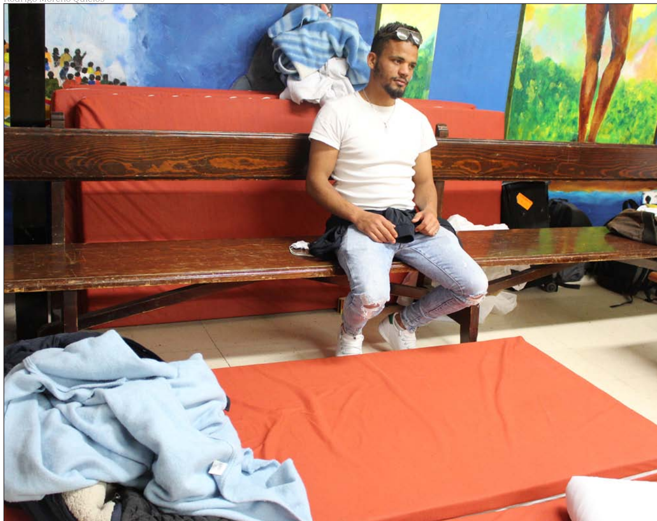
Un solicitante de protección internacional hace noche en el centro de pastoral San Carlos Borromeo