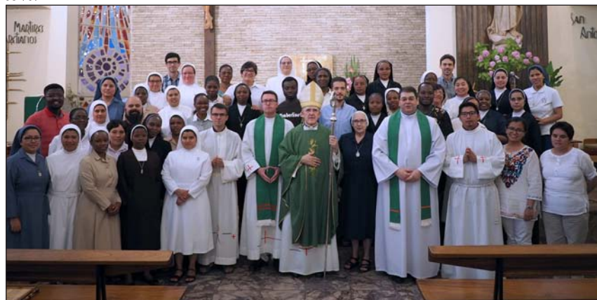
El cardenal Osoro, con los religiosos que preparan su profesión perpetua