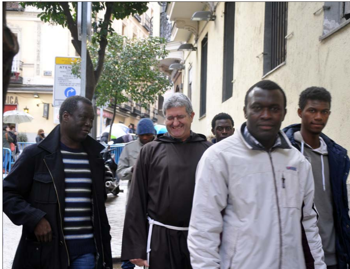
Jóvenes migrantes que viven en la casa de los frailes franciscanos capuchinos de Medinaceli, a su llegada a la basílica del Cristo de Medinaceli, en Madrid, el 2 de marzo de 2018

irrumpió hasta en situaciones de pecado: durante la migración forzada de los hijos de Jacob, José, vendido como esclavo, se convirtió eventualmente en el salvador de su familia (Gn 37,45).