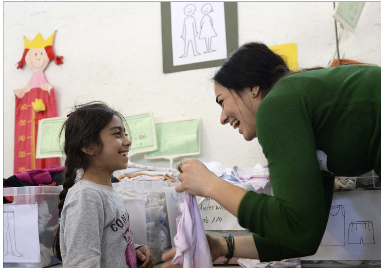
Una chica habla con una niña refugiada de Siria, en Bayernkaserne, ropero con donaciones, en Múnich (Alemania)

Nos encontramos con una página del Evangelio, de sobra conocida, en la que el Señor, una vez más, da un nuevo sentido a la cuestión que le plantea uno de sus interlocutores. La parábola del buen samaritano es propia de Lucas, ya que es el único evangelista que la recoge, y guarda un estrecho paralelismo al inicio con el encuentro entre el Señor y el joven rico. Sin rodeos, este maestro de la ley formula a Jesús la pregunta clave: «¿Qué tengo que hacer para heredar la vida eterna?». La