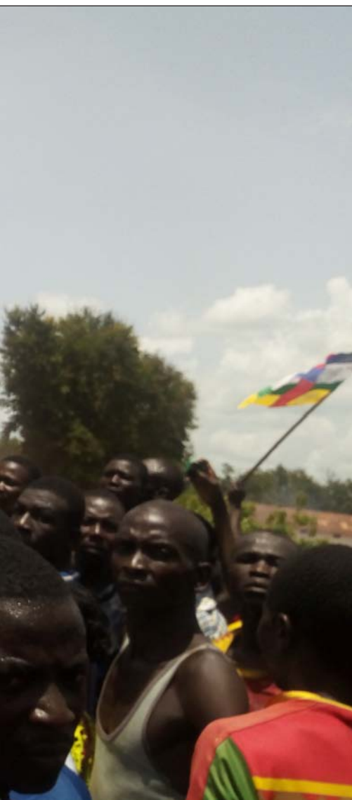
por documentar abusos en la extracción de oro

curso del río había sido devastado, escavado y abandonado y el agua, contaminada- comprendí que el problema era muy serio. Cada día, las empresas gastan entre 20.000 y 30.000 euros en maquinaria y carburante y deben de ganar millones. Están disfrutando de los recursos del país sin compensar a la población. Las autoridades están implicadas», apunta Gazzera a Alfa y Omega .