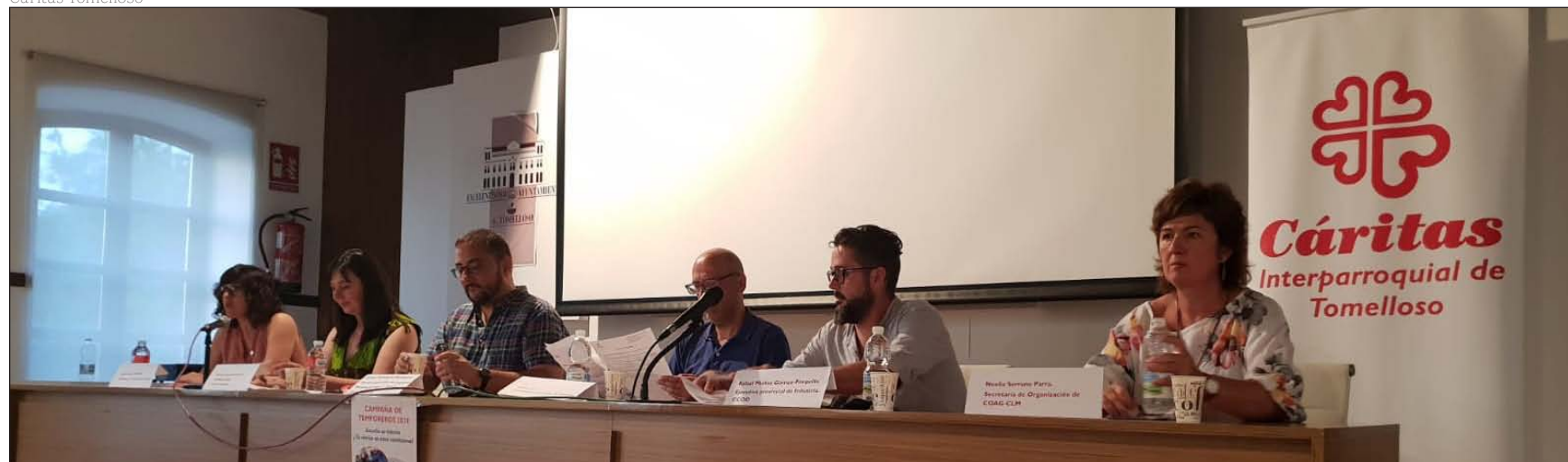
Representantes de Cáritas, el Ayuntamiento de Tomelloso, Comisiones Obreras y COAG Castilla-La Mancha en una mesa redonda sobre temporeros y vivienda