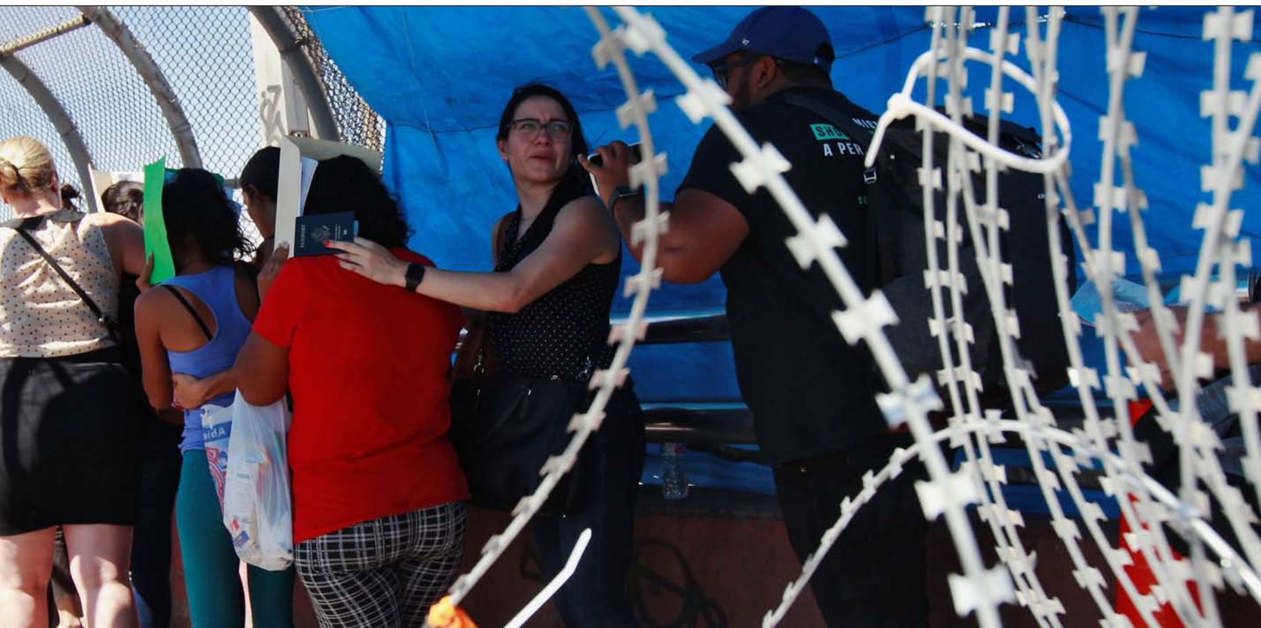
puente fronterizo desde la mexicana Juárez en dirección a El Paso, Texas (Estados Unidos) el pasado 3 de julio

plo, Ciudad Juárez ya tiene problemas para cuidar del ingente número de migrantes que esperan allí –en su mayoría familias jóvenes y madres con niños pequeños o embarazadas– sin dinero, sin ropa, sin permiso de trabajo... Además, han sido golpeados, les han robado, los han secuestrado. Incluso hemos escuchado que algunos han sido asesinados.