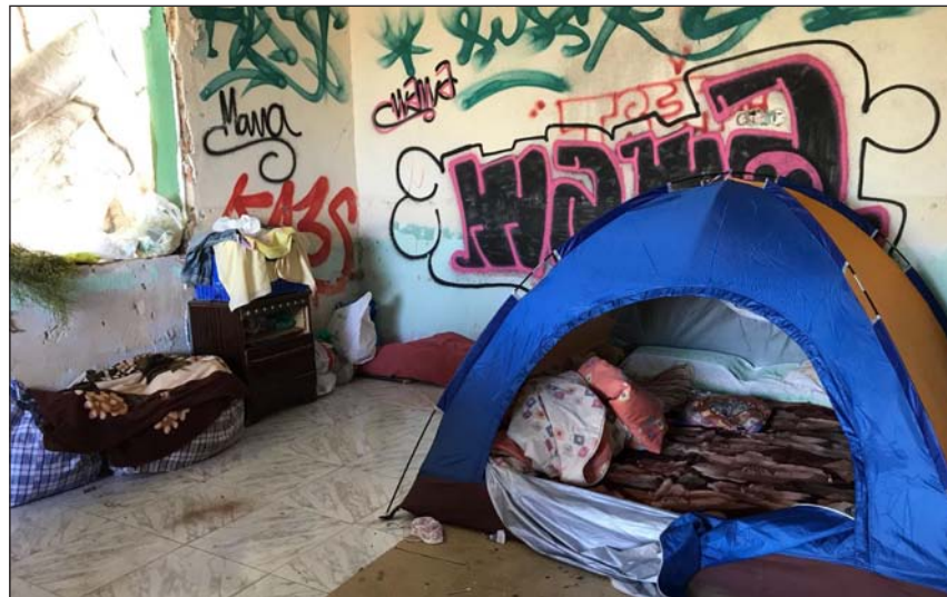
Uno de los asentamientos de temporeros en Argamasilla de Alba, el año pasado