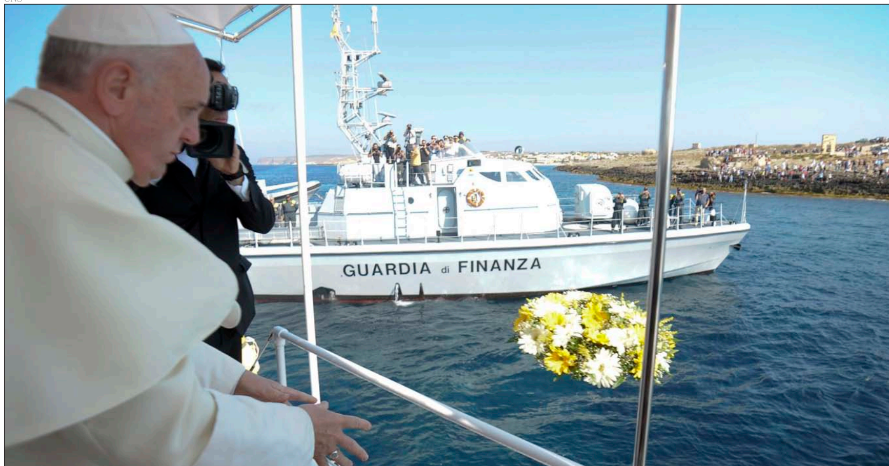
El Papa Francisco lanza una corona de flores al mar, en recuerdo de los fallecidos, durante su visita a Lampedusa en 2013

Carta semanal del cardenal arzobispo de Madrid