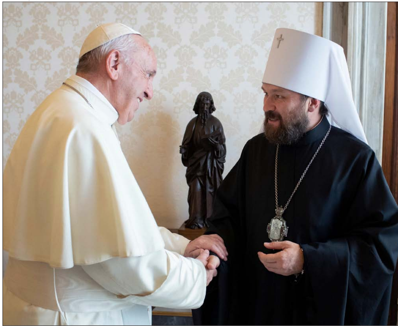
El Papa Francisco saluda al metropolitano Hilarión de Volokolamsk, durante una audiencia privada, el pasado 19 de octubre