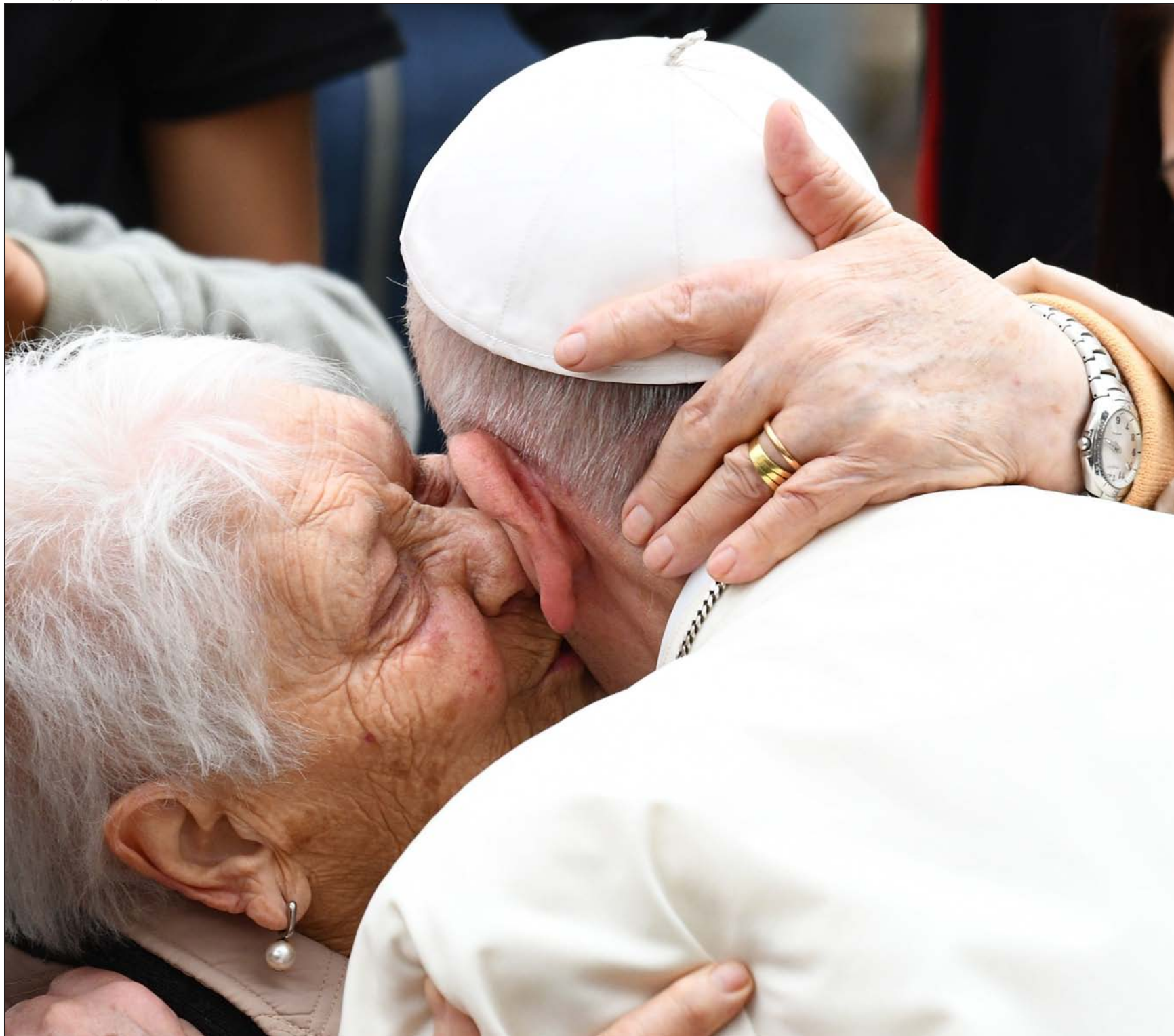
Una anciana besa al Papa Francisco durante su visita a la parroquia San Pablo de la Cruz, en el barrio romano de Corviale, en abril de 2018