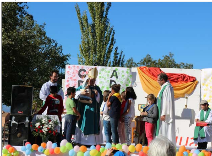
Un momento del Encuentro Diocesano de Niños de 2017

pal objetivo es que los niños de Madrid vean que existen otros como ellos que también quieren ser amigos de Jesús en la escuela de María», dicen desde la Deleju.