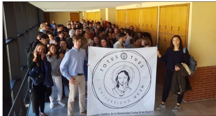
Concentración frente al aula en la que debía celebrarse el acto de inauguración