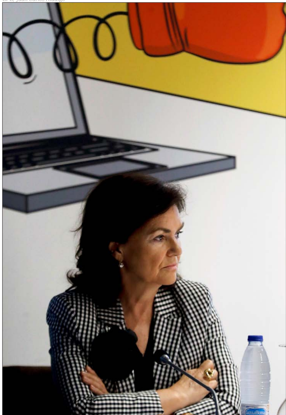
La vicepresidenta del Gobierno, Carmen Calvo

Constitución, como el resto del mismo ordenamiento».