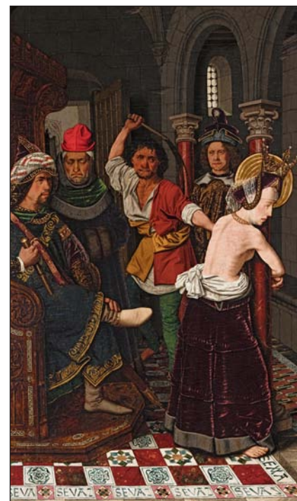
Flagelación de santa Engracia. Museo de Bellas Artes de Bilbao

En la segunda sala, el pintor que había representado al Bautista junto a un cordero con las patas hacia arriba (original símbolo del Calvario) sorprende de nuevo con representaciones de santos a veces poéticas e idealizadas (santa Catalina en una predela, con el lirio y el corazón, en el que chisporrotea una suerte de bengala), pero más a menudo cercanas, explícitas, que aproximan el testimonio de los santos al espectador. Como en la pequeña serie dedicada a santa Engracia, en la que se ve a la joven amarrada a la columna, martirizada en una Zaragoza que Bermejo habitó, y representó colmada de elementos de la cultura nazarí. O como en Santo obispo (¿san Benito de Nursia?), en la que un monje contempla la naturaleza ( ora ), otro cocina ( et labora ) y el protagonista parece redactar la célebre regla, sentado en su escritorio, impresionando al espectador «la calidad de