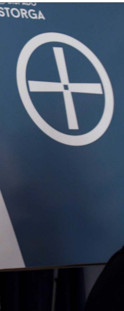
menores, el pasado 17 de septiembre

duras a esta cuestión: Ay de los que escandalicen a un menor... Este es el fundamento, y después, se incluirá todo lo relativo a la prevención, al acompañamiento a las víctimas... Tenemos [como referencia] los protocolos de otras conferencias y de diócesis como la mía.