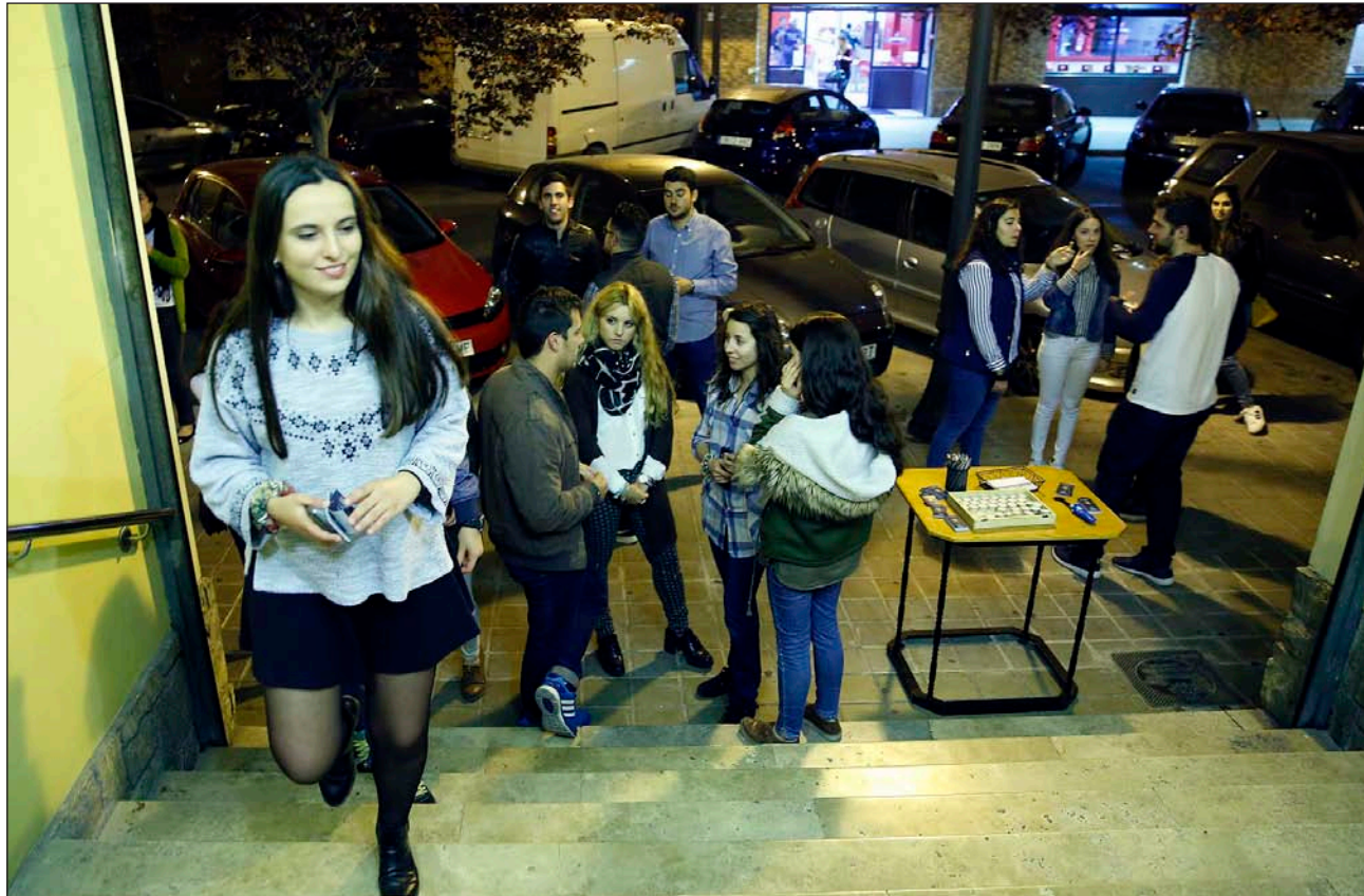
Un grupo de jóvenes durante una evangelización en Valencia

▼ En un mundo que vive en el desgarramiento de las divisiones y enfrentamientos, de las discordias y enemistades, se hace presente el Pueblo de Dios, que tiene el mandato de amar como el mismo Cristo lo hizo, hasta dar la vida por todos los hombres