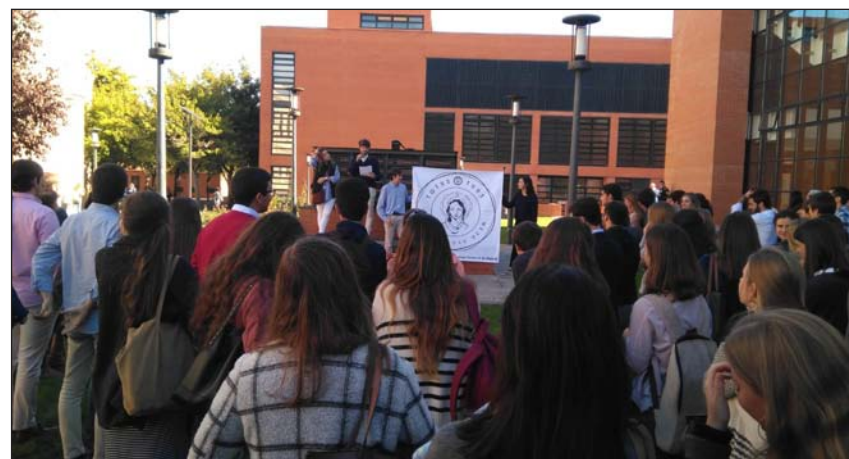
En los jardines de la Universidad Carlos III de Madrid leyendo un manifiesto