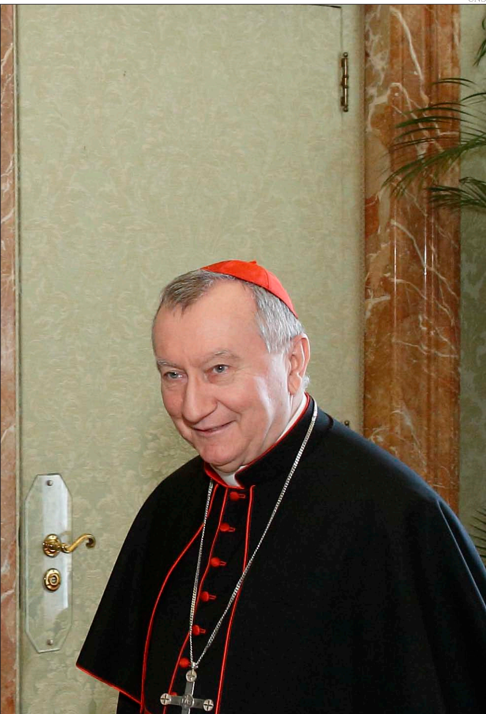
El secretario de Estado del Vaticano, Pietro Parolin

pasado mes de junio; y ahora, la reunión del próximo lunes, 29 de octubre, entre el secretario de Estado del Vaticano, Pietro Parolin, y la vicepresidenta del Gobierno, Carmen Calvo.