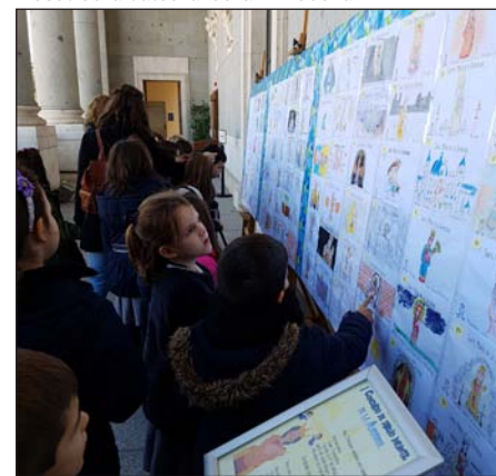
Unos niños durante su visita al museo