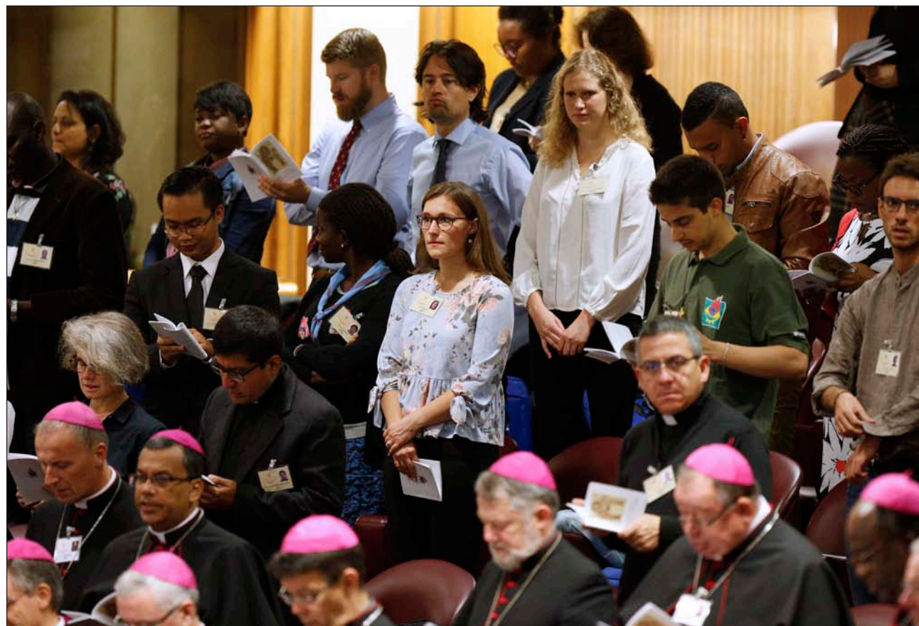
Obispos y jóvenes en el aula sinodal el pasado 18 de octubre

Estas tres categorías han sido el centro de los trabajos durante el Sínodo, que lleva por título Los jóvenes, la fe y el discernimiento vocacional . Los 267 padres sinodales y los 49 oyentes, entre ellos 34 jóvenes de diversas nacionalidades, alternaron sus intervenciones entre discursos ante el pleno y discusiones en los 14 círculos menores lingüísticos, donde se redactaron los modos, propuestas específicas que alimentarán el documento final.