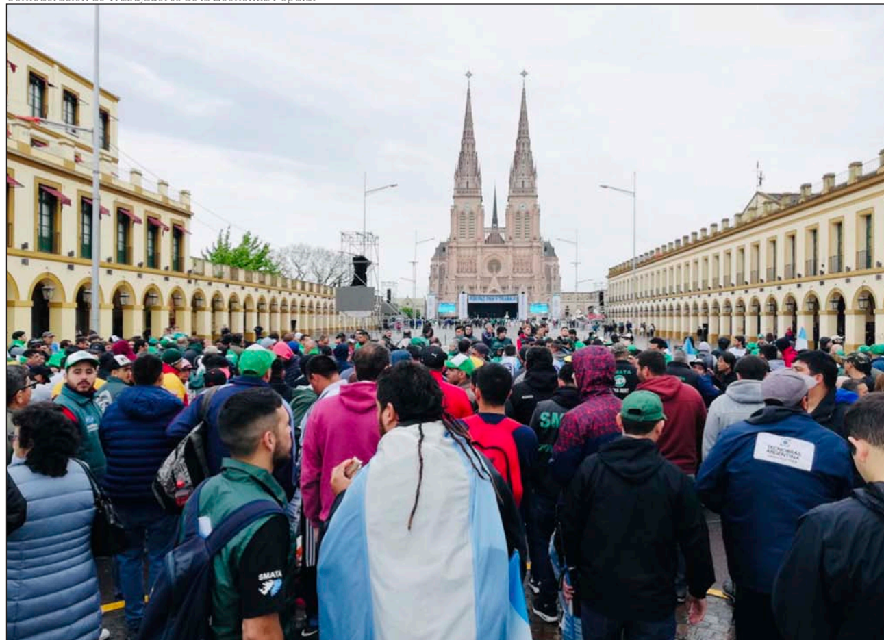
Encuentro Pan, paz y trabajo organizado por el Frente Sindical, en el exterior del santuario mariano de Luján

Confederación de Trabajadores de la Economía Popular