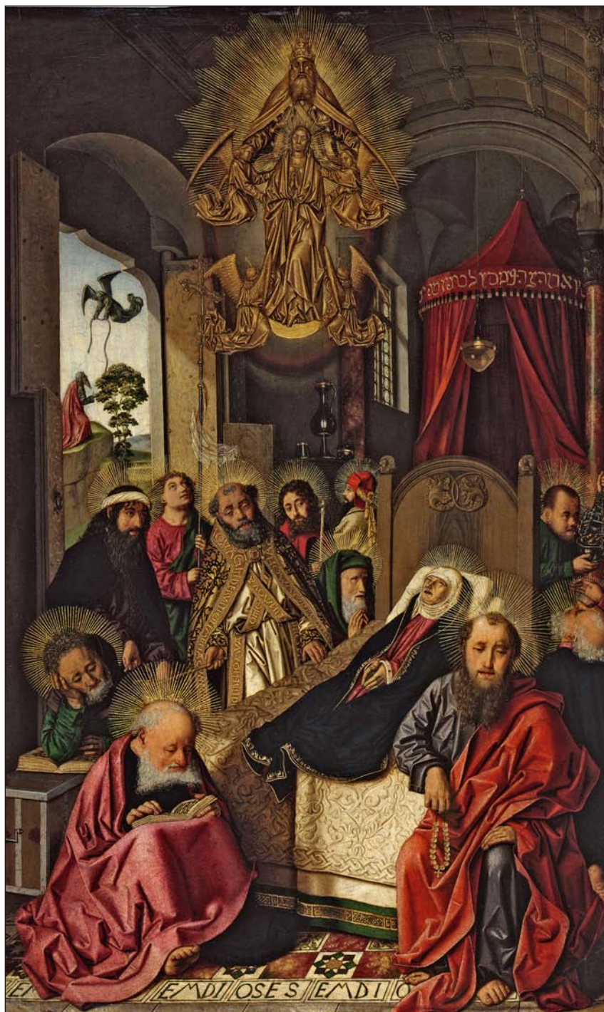
Muerte y Asunción de la Virgen. Staatliche Museen zu Berlin, Gemäldegalerie