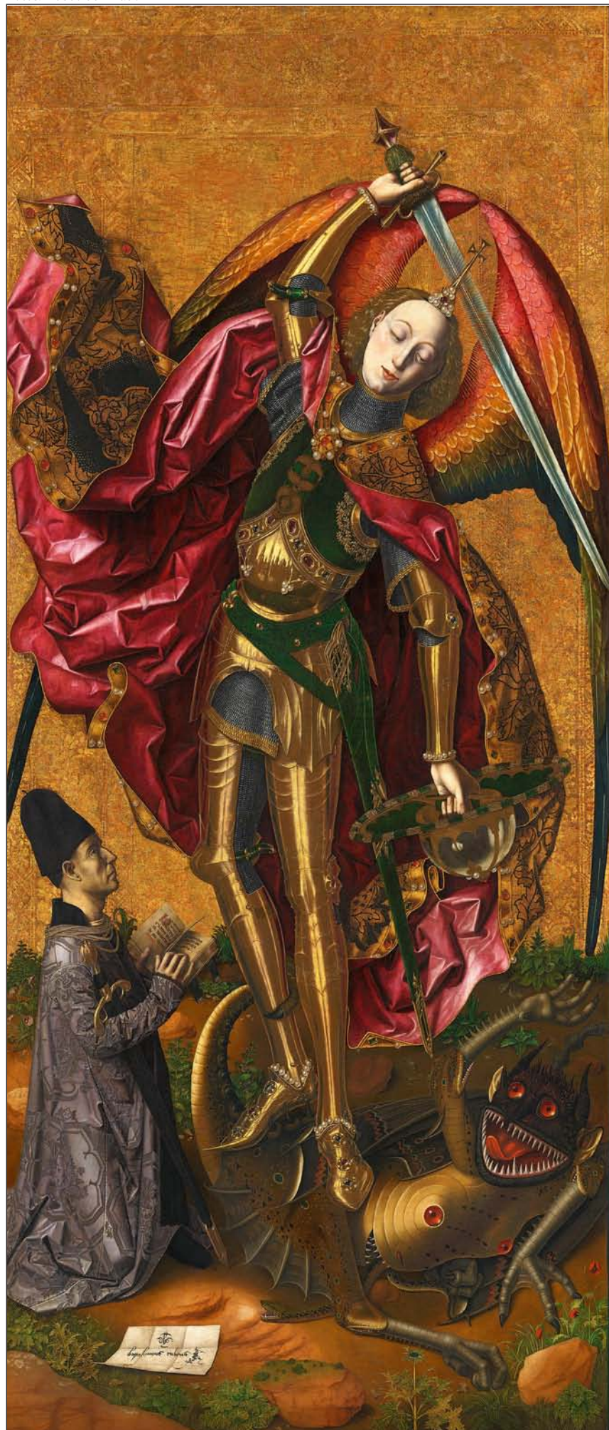
San Miguel triunfante sobre el demonio con Antoni Joan. National Gallery, Londres

▼ El Museo del Prado reúne por primera vez un monográfico la obra del artista Bartolomé de Cárdenas, alias el Bermejo, un maestro del tardomedievo peninsular, prácticamente un desconocido para el público general. Se podrá visitar en la pinacoteca madrileña hasta el 27 de enero