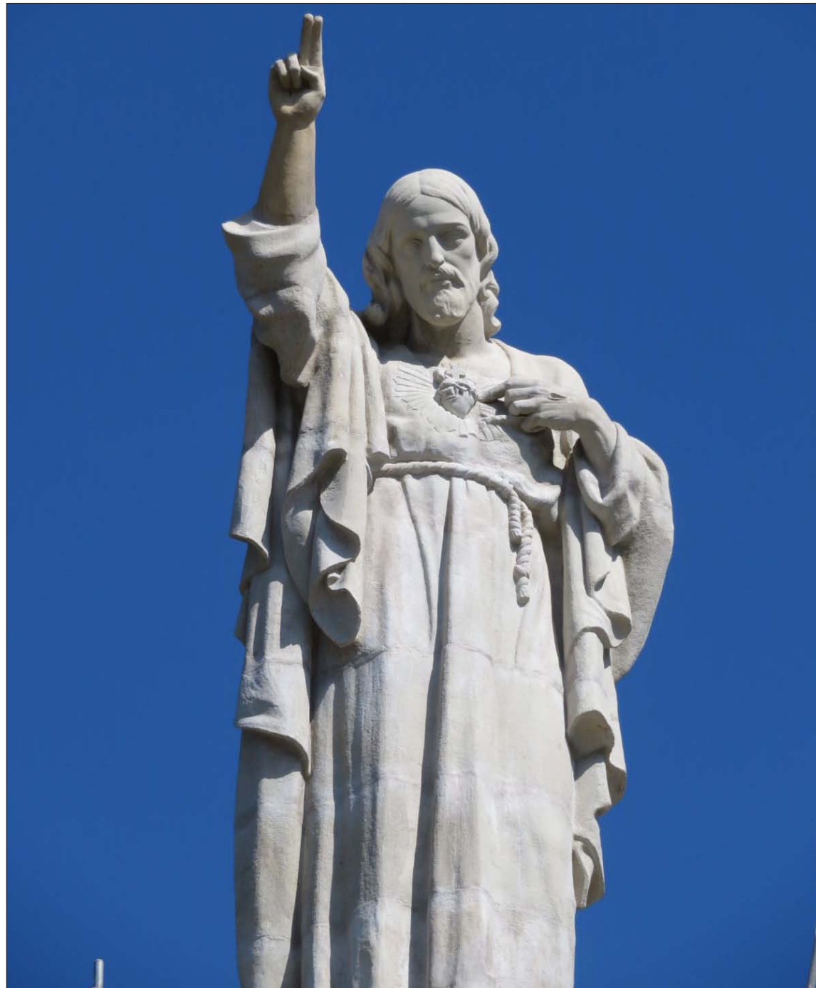
Monumento al Sagrado Corazón inaugurado el 24 de octubre de 1929 en Las Ermitas, Sierra Morena

« C or ad cor loquitur» («el corazón habla al corazón»). Esta frase de san Francisco de Sales que usó el beato John Henry Newman expresa de manera elocuente la esencia de la espiritualidad del Corazón de Cristo. Este curso celebraremos el centenario de la consagración de España al Sagrado Corazón, y en la diócesis de Córdoba el 90º aniversario. Para esta efeméride se ha pedido al Santo Padre un Año Jubilar, un año de gracia que nos ayude a todos a profundizar en el misterio del amor de Dios manifestado en el Corazón de su Hijo. Pero, ¿qué quiere decir para