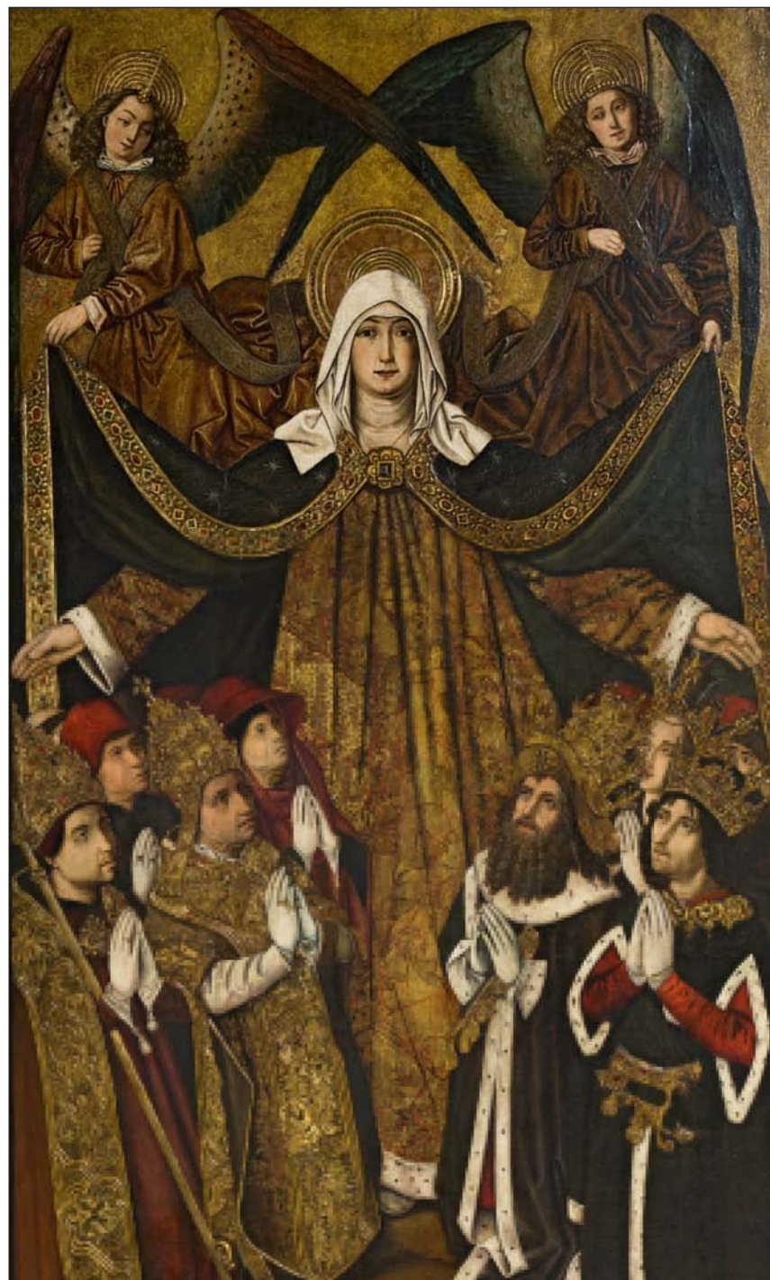
Virgen de la Misericordia. Grand Rapids Art Museum

las cosas», como escribió en 1926 el historiador valenciano Elías Tormo. La voluptuosidad de la capa pluvial, de los libros como telas, de las tentaciones del mundo que interpretaron los pintores de fines del siglo XV, como Bermejo. Tan influidos por los maestros italianos como por los flamencos.