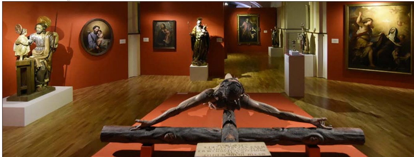
La muestra está perfectamente integrada en el templo