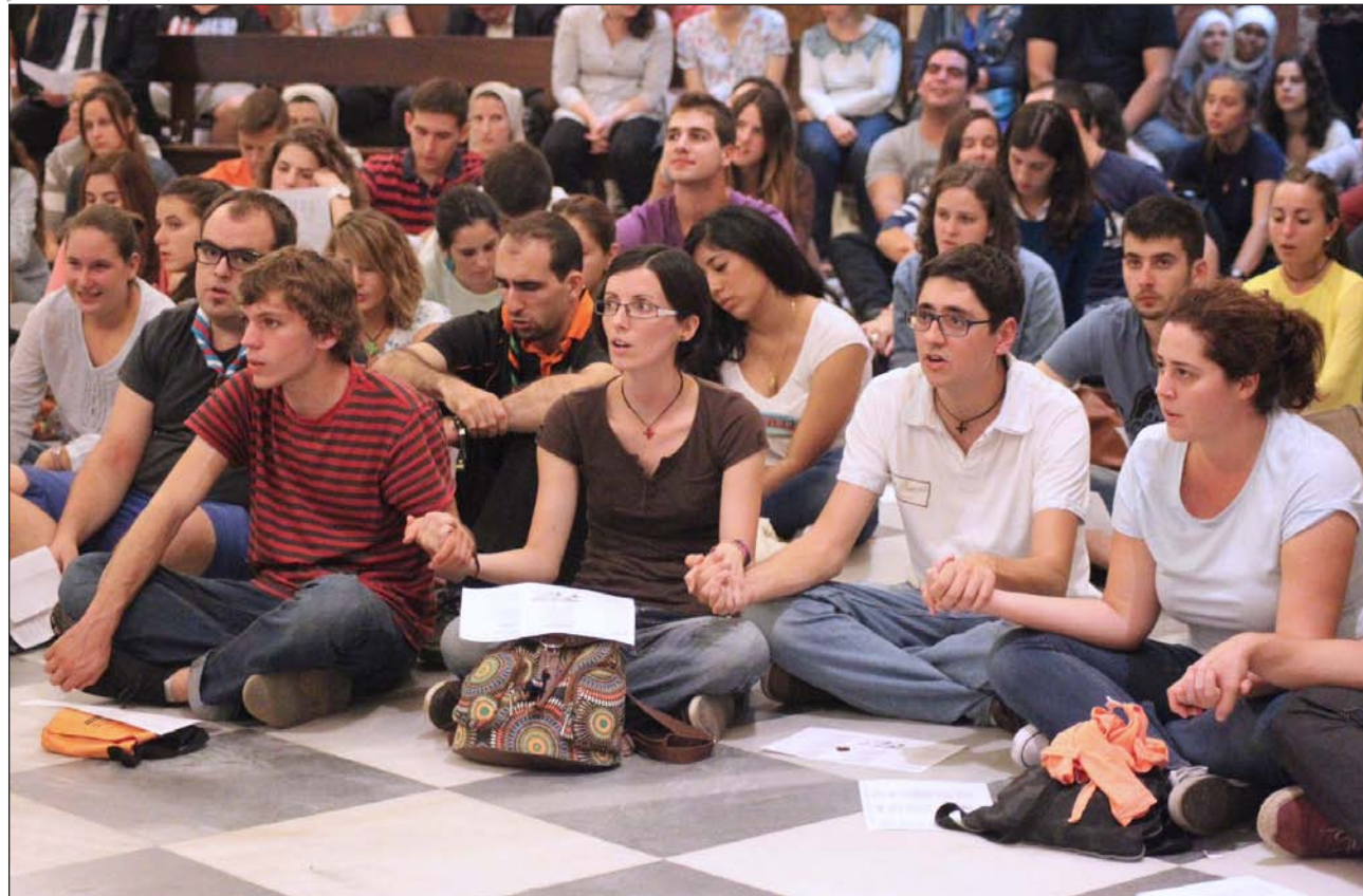
Unos jóvenes participan en una vigilia de oración, en la basílica de la Virgen de los Desamparados de Valencia

▼ El Papa Francisco nos está invitando a todos, y de una manera especial a los jóvenes, a «construir con otros un mundo más humano»