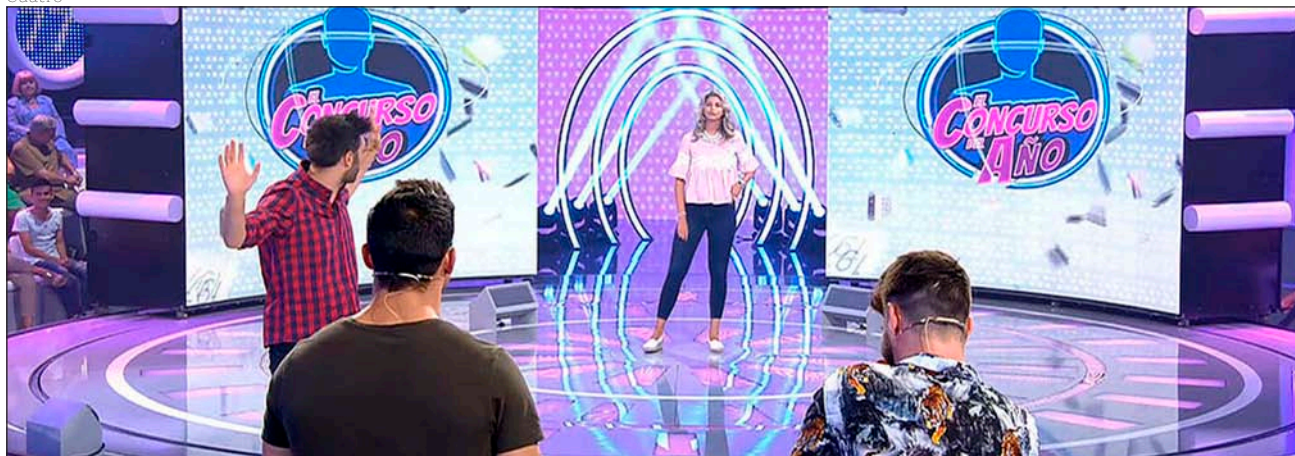
Un momento de El concurso del año , presentado por Dani Martínez