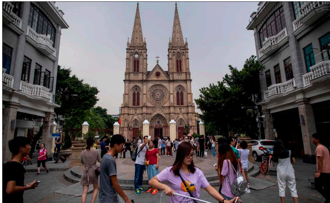
Turistas chinos antes la catedral del Sagrado Corazón de Jesús, en Guangzhou