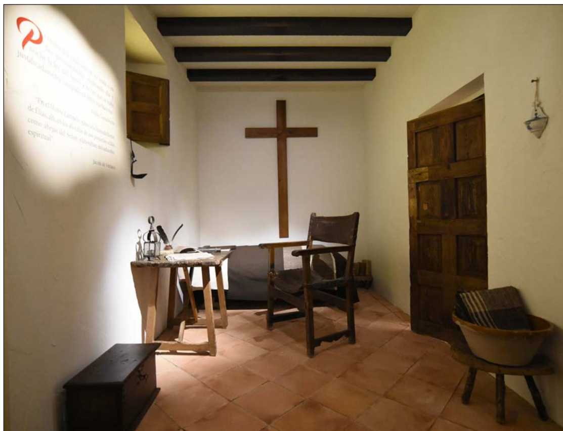
Recreación de la celda de san Juan de la Cruz. El sillón fue utilizado por él