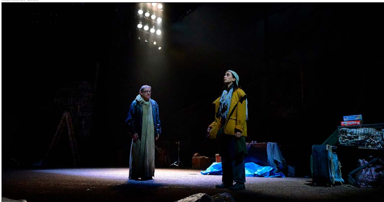
Dos refugiados conversan sobre su pasado y su futuro en el campo que los ha acogido