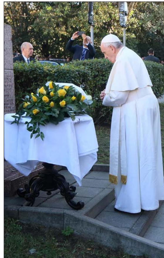
El Papa en el Monumento a las Víctimas del Gueto