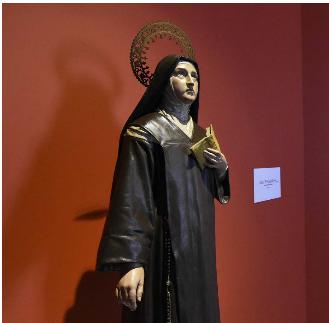
Escultura de santa Teresa de Jesús que abre la muestra en Alba de Tormes