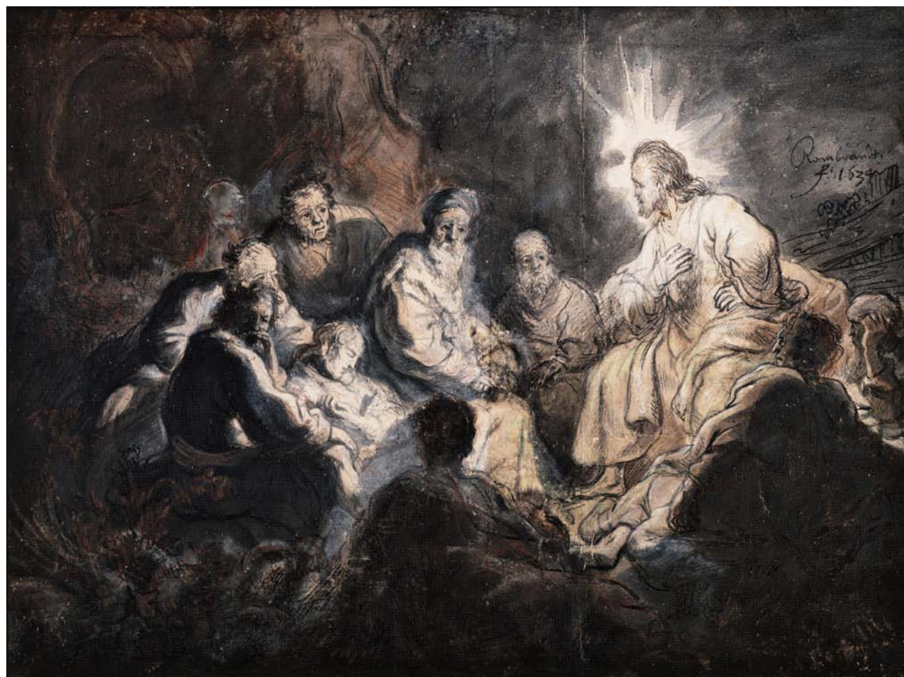
Jesús y sus discípulos. Rembrandt. Museo Teylers, Haarlem (Holanda)

Nos encontramos ante uno de esos episodios de la vida del Señor no dominado precisamente por la dulzura o la facilidad de sus expresiones. Más bien al contrario, Jesús se muestra bastante exigente con quienes quieren seguirlo, y pretende aclarar, en primer lugar, que Dios se sirve de muchos modos para realizar la salvación. En segundo lugar, censura con gran severidad a quienes escandalizan o a los que consideran el pecado como un mal menor