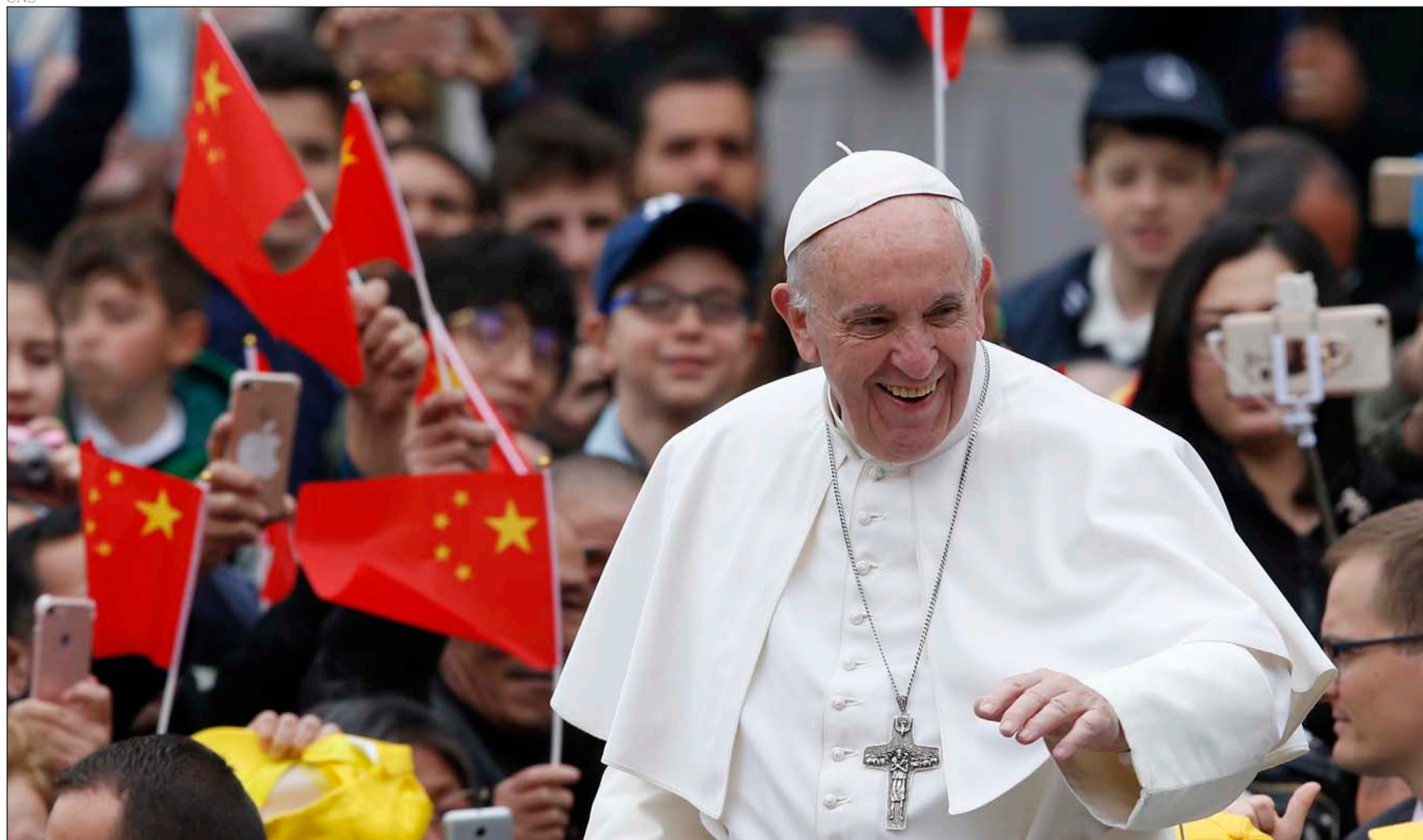
El Papa Francisco pasa junto a un grupo de peregrinos de China, a su llegada a la Plaza de San Pedro para presidir la audiencia general, el 22 de marzo de 2017