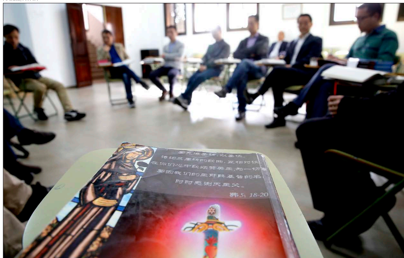
Reunión del grupo Casa de San José, comunidad china, en la parroquia de Santa Ana de Valencia