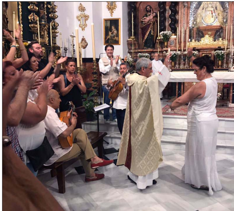
Un momento del Gicalí en una iglesia de Córdoba