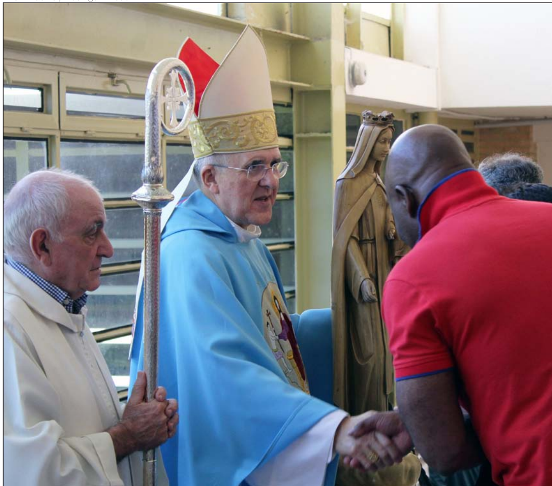
El cardenal osoro saluda a los internos en su visita a la cárcel de Soto del Real