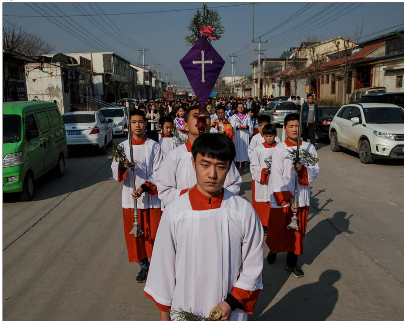
Procesión el Domingo de Ramos, en Youtong (China), en abril de 2018

analizando escrupulosamente caso por caso. De esa manera, inició un proceso de unidad de facto que llevaría –tarde o temprano– a la firma del acuerdo ahora suscrito.