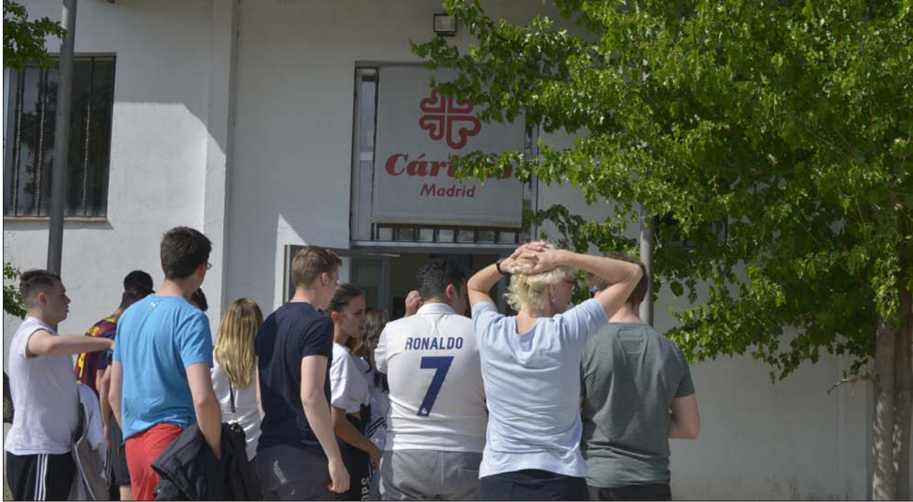
Un grupo de jóvenes a las puertas de un centro de Cáritas Madrid

▼ El avance de datos del VIII Informe Foessa revela que se han producido mejoras claras a nivel social que se sostienen en bases débiles y un empeoramiento preocupante de la población mas vulnerable