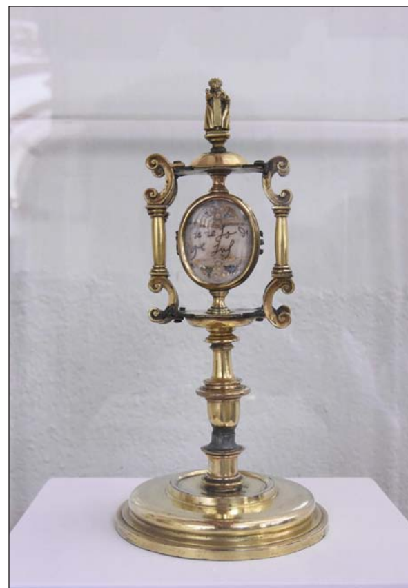
Reliquia de la firma de santa Teresa de Jesús