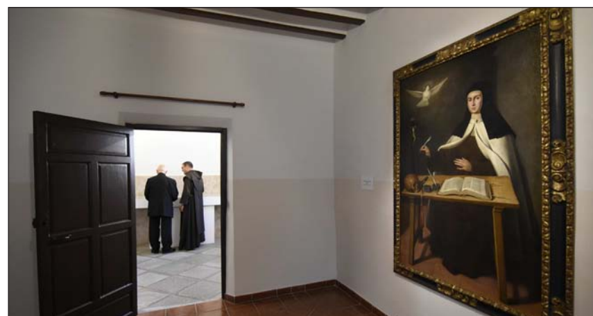
Santa Teresa escritora