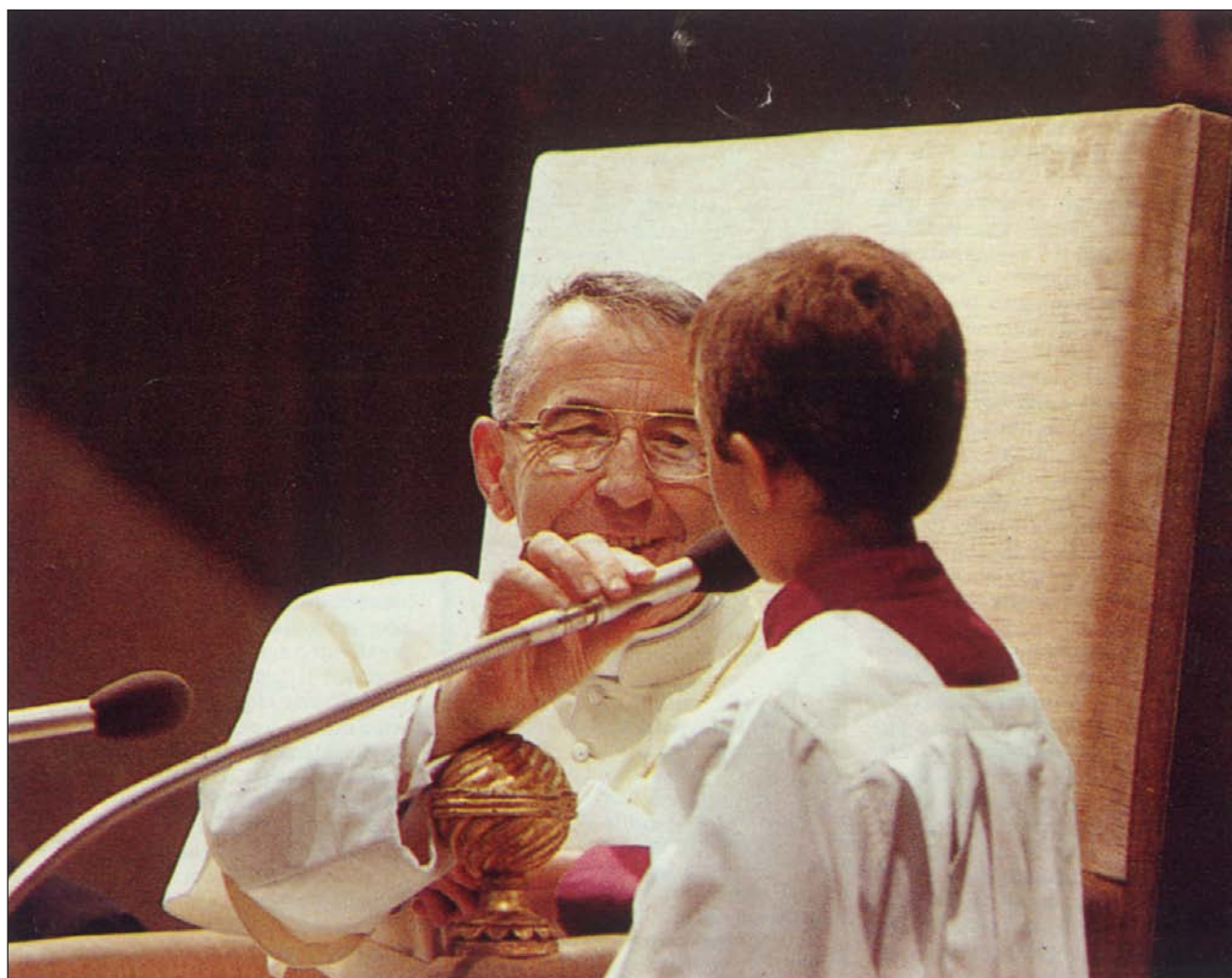
El Papa Juan Pablo I con un niño, durante una audiencia general, en el aula Pablo VI del Vaticano

▼ Querido Papa Luciani, ¿por qué no te nombran copatrono de los catequistas? Con san Pío X, tendríamos a dos excepcionales patriarcas de Venecia