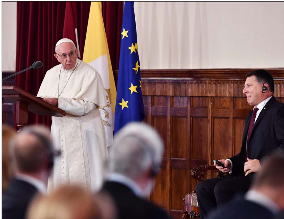
El Papa Francisco y el presidente de Letonia, Raimonds Vejonis, durante el encuentro con las autoridades