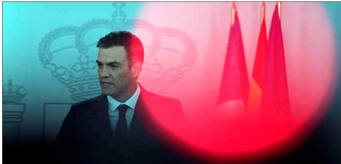
Pedro Sánchez en una comparecencia en La Moncloa