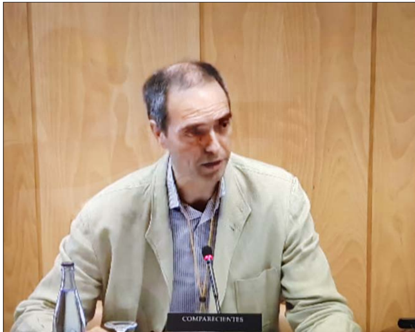
El presidente de ECM durante su comparecencia

señanza concertada, y defendió que la libertad de enseñanza es «consustancial a la dignidad de la persona, a la integridad del individuo, a su derecho a constituirse y a crecer como ciudadano libre». Además, añadió