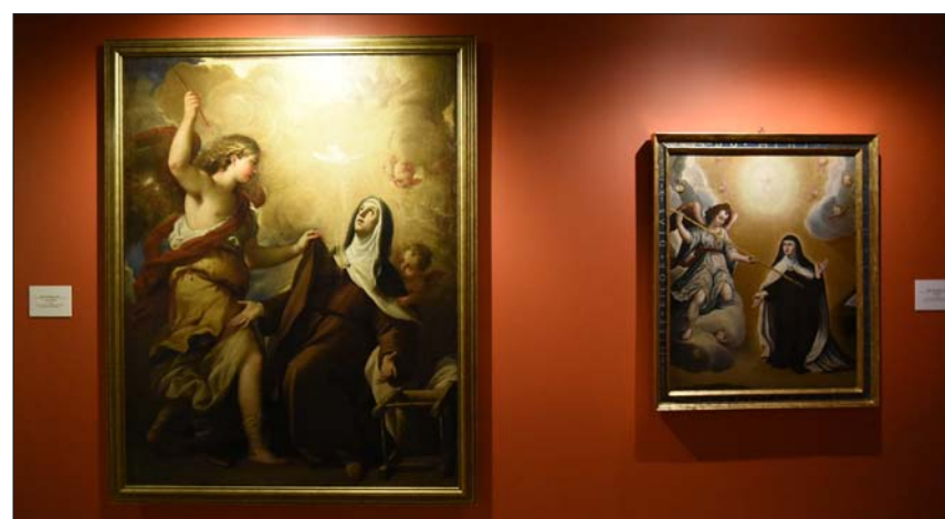
La Transverberación según Lucas Jordán y un anónimo