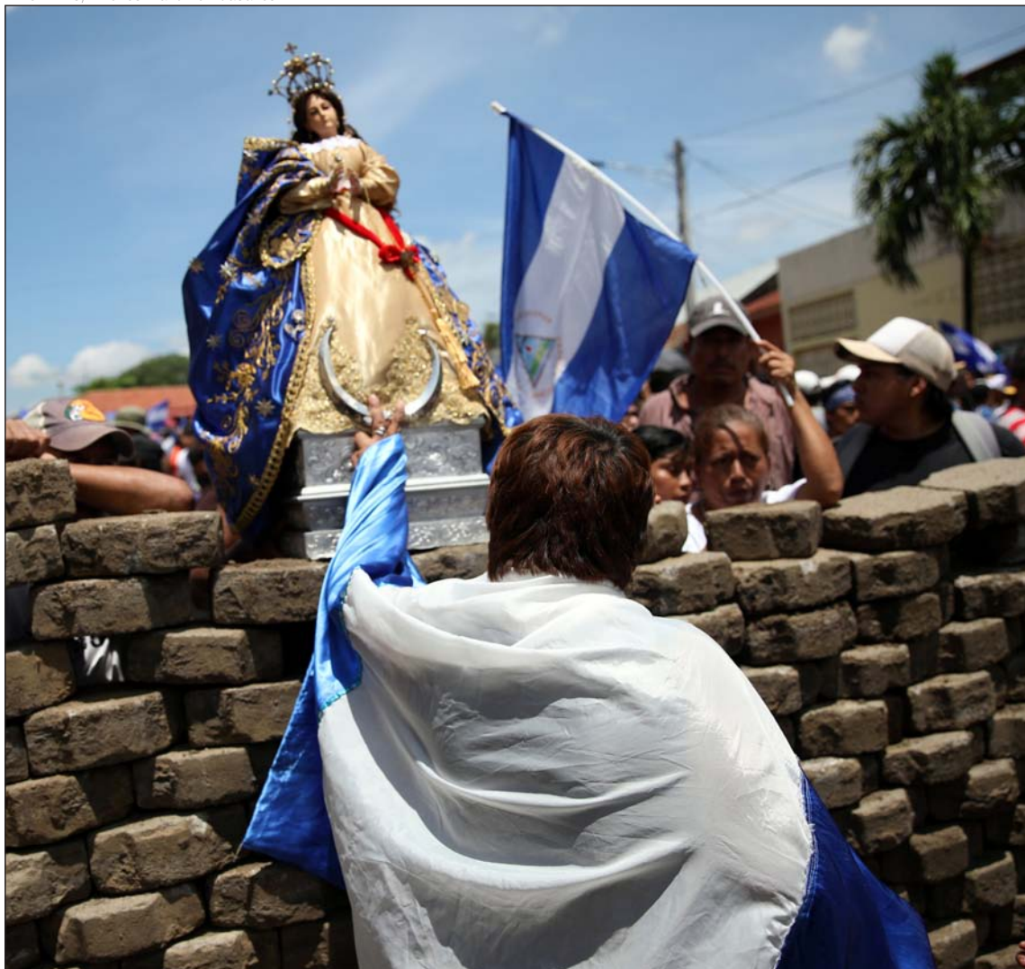
Una mujer con la imagen de la Virgen en una barricada de en Masaya, el pasado 21 de junio

continental, que están obstaculizando un apoyo más decidido de la comunidad internacional. Pero esto a los obispos se nos escapa, no logramos comprenderlo. Espero que de parte de gobiernos amigos de América y de Europa haya mucha mayor presión hacia el Gobierno nicaragüense para cesar la represión y encaminar al país a la democracia, y que haya mucho mayor apoyo a este pueblo, que está siendo atacado y masacrado.