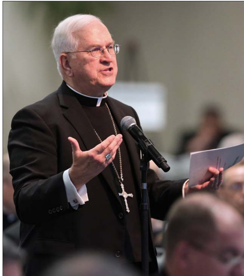
Monseñor Kurtz durante la Asamblea Plenaria de los obispos el 13 de junio