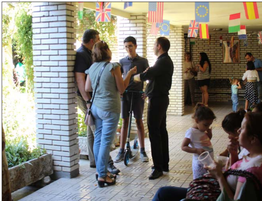
Mayores y pequeños comparten una fiesta en Nuestra Señora de la Peña

Parroquia Nuestra Señora de la Peña y San Felipe Neri