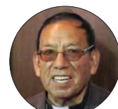
Toribio Ticona Porco, arzobispo emérito de Corocoro (Bolivia)