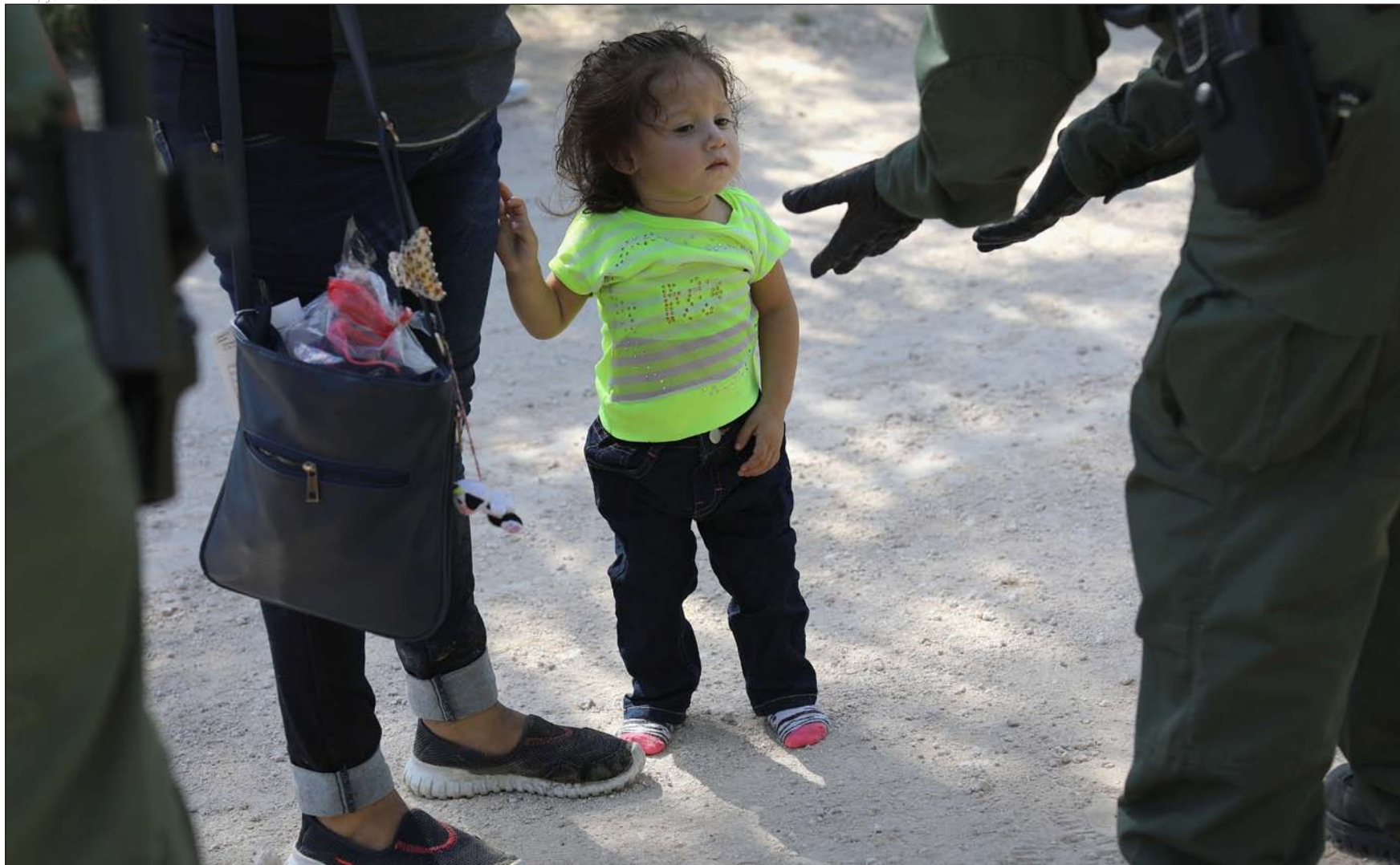
Una familia centroamericana es detenida el 12 de junio cerca de McAllen (Texas)