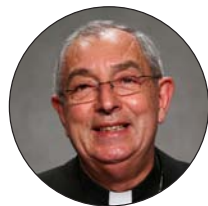
Angelo de Donatis, vicario general de Roma