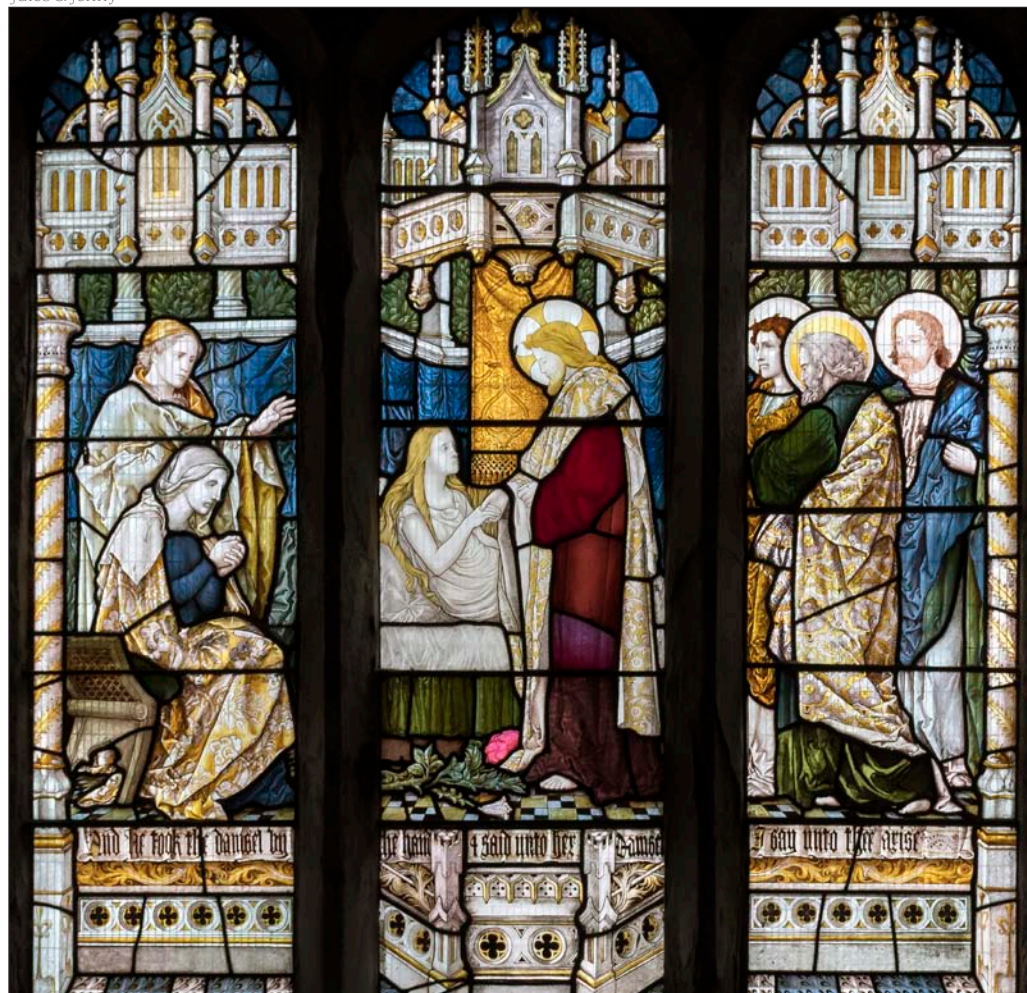
Resurrección de la hija de Jairo. Vidriera de la iglesia de San Andrés en Epworth, Inglaterra

Conforme va pasando por los distintos lugares de Galilea, Jesús aparece especialmente atento a las necesidades concretas de las personas que se