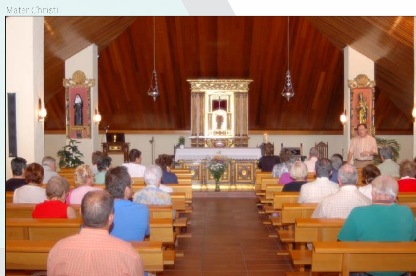
Ejercicios espirituales organizados por Mater Christi

Más información: diocesisgetafe.es o inscripciones@djuventudgetafe.es .