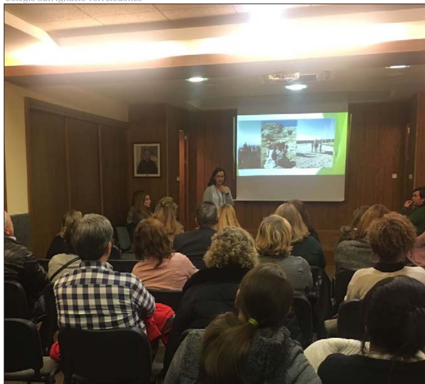
El grupo de padres GPS en San Ignacio