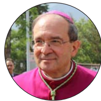
Giuseppe Petrocchi, arzobispo de L'Aquila (Italia)