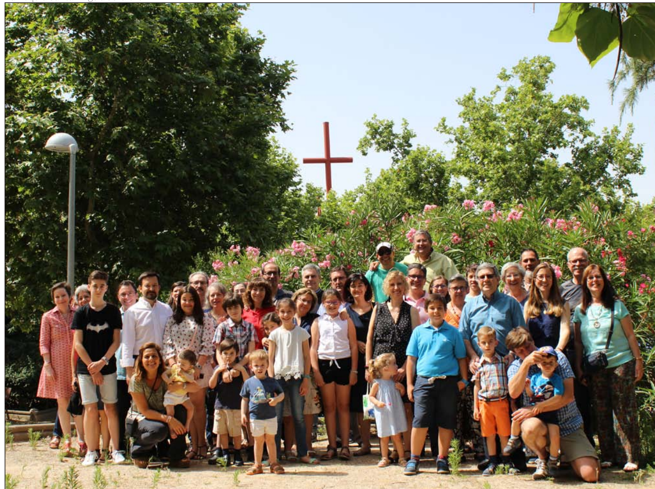
Las familias de Santa Ángela de la Cruz, a las afueras del templo