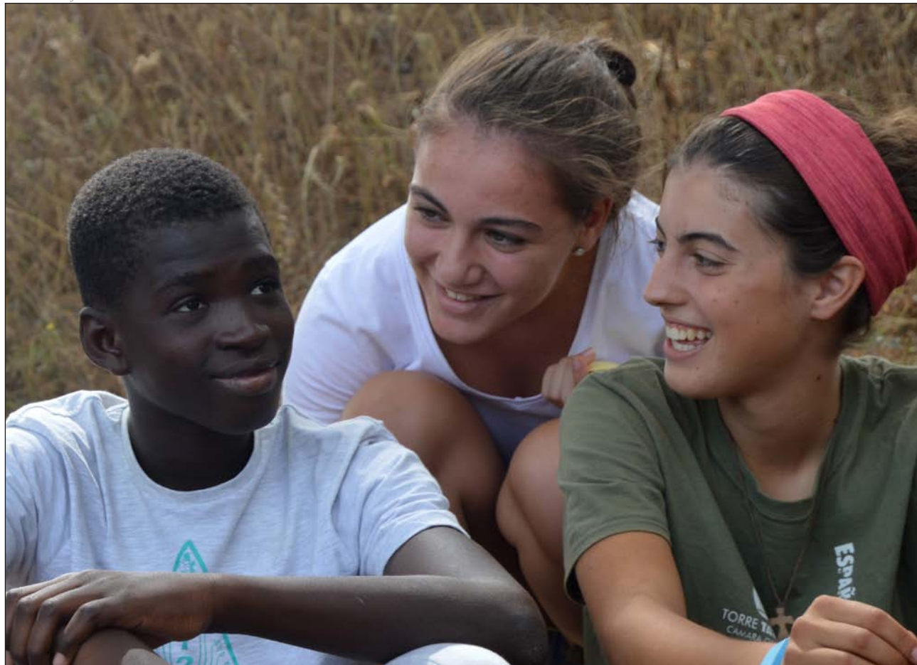
Campo de trabajo de verano con personas migrantes en Ceuta