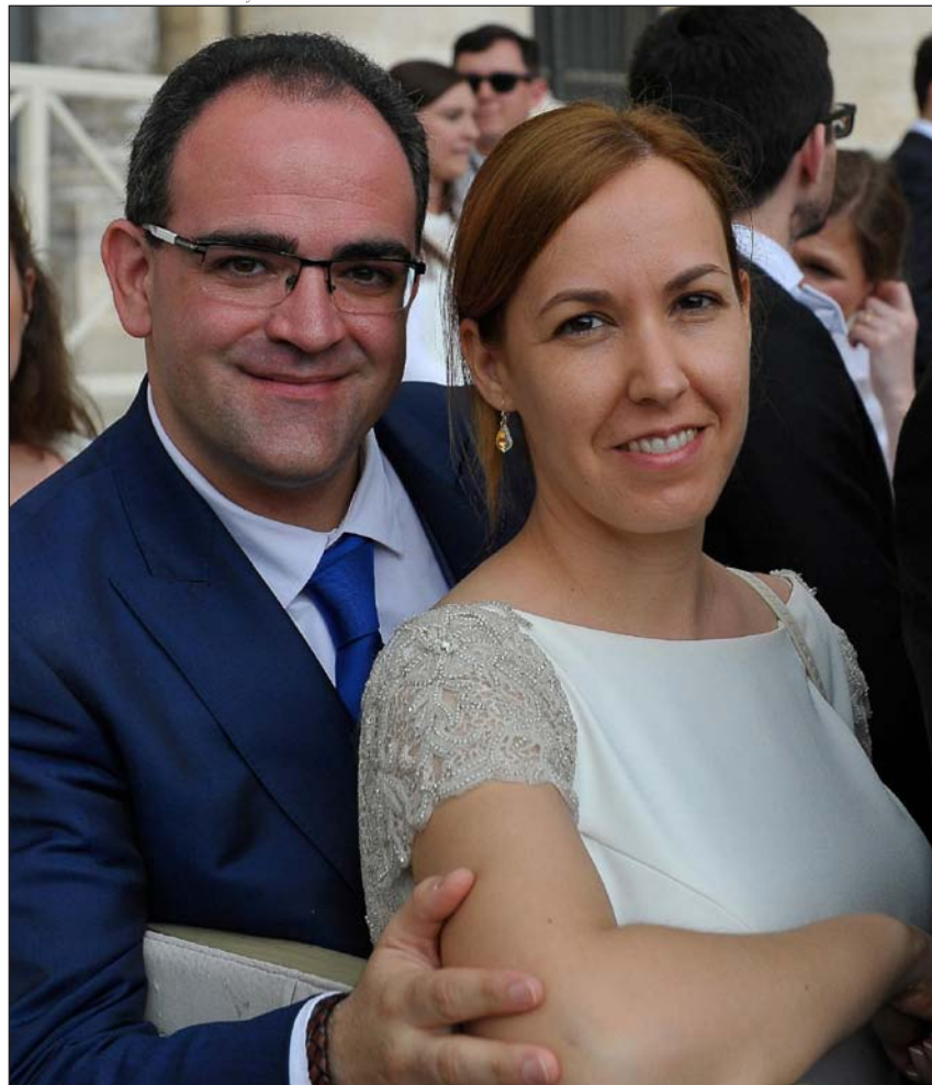
Arriba, en el Vaticano, donde Elena y Fernando pudieron saludar y conversar con el Papa Francisco. Abajo, baile durante la celebración del matrimonio