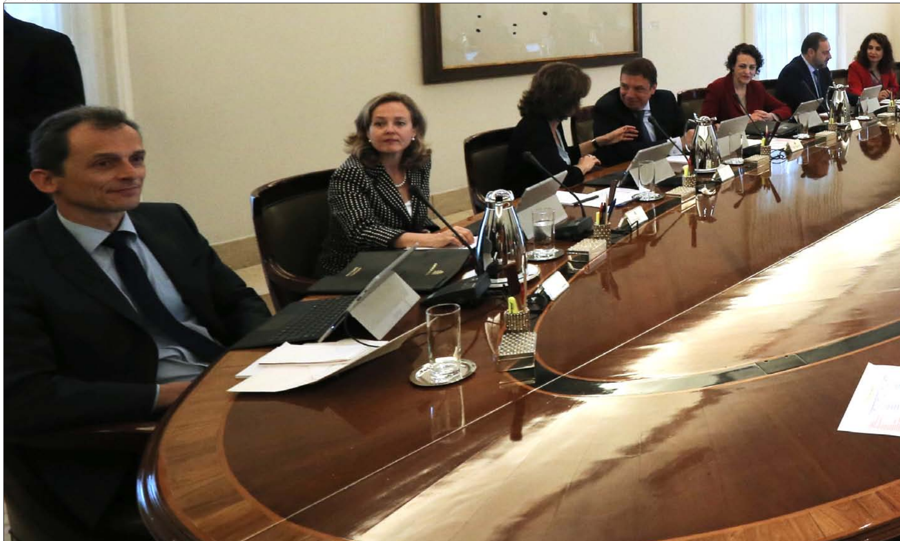
Foto de familia de la primera reunión del Consejo de Ministros que presidió Pedro Sánchez tras acceder a la jefatura del Gobierno

▼ Pedro Sánchez quiere que la eutanasia sea una realidad en España de aquí a dos años, lo que le queda de legislatura. Tiene la voluntad y los apoyos, los mismos que le auparon al Gobierno. El PP votará en contra, aunque el grado de oposición dependerá de quién sea su futuro líder, mientras el diputado de UPN, Carlos Salvador, promete dar la batalla. Dentro del PSOE, los Cristianos Socialistas, no ven «prioritaria» la eutanasia. Y los médicos la rechazan: «Nunca provocaremos intencionadamente la muerte de ningún paciente, ni siquiera en caso de petición expresa por parte de este»