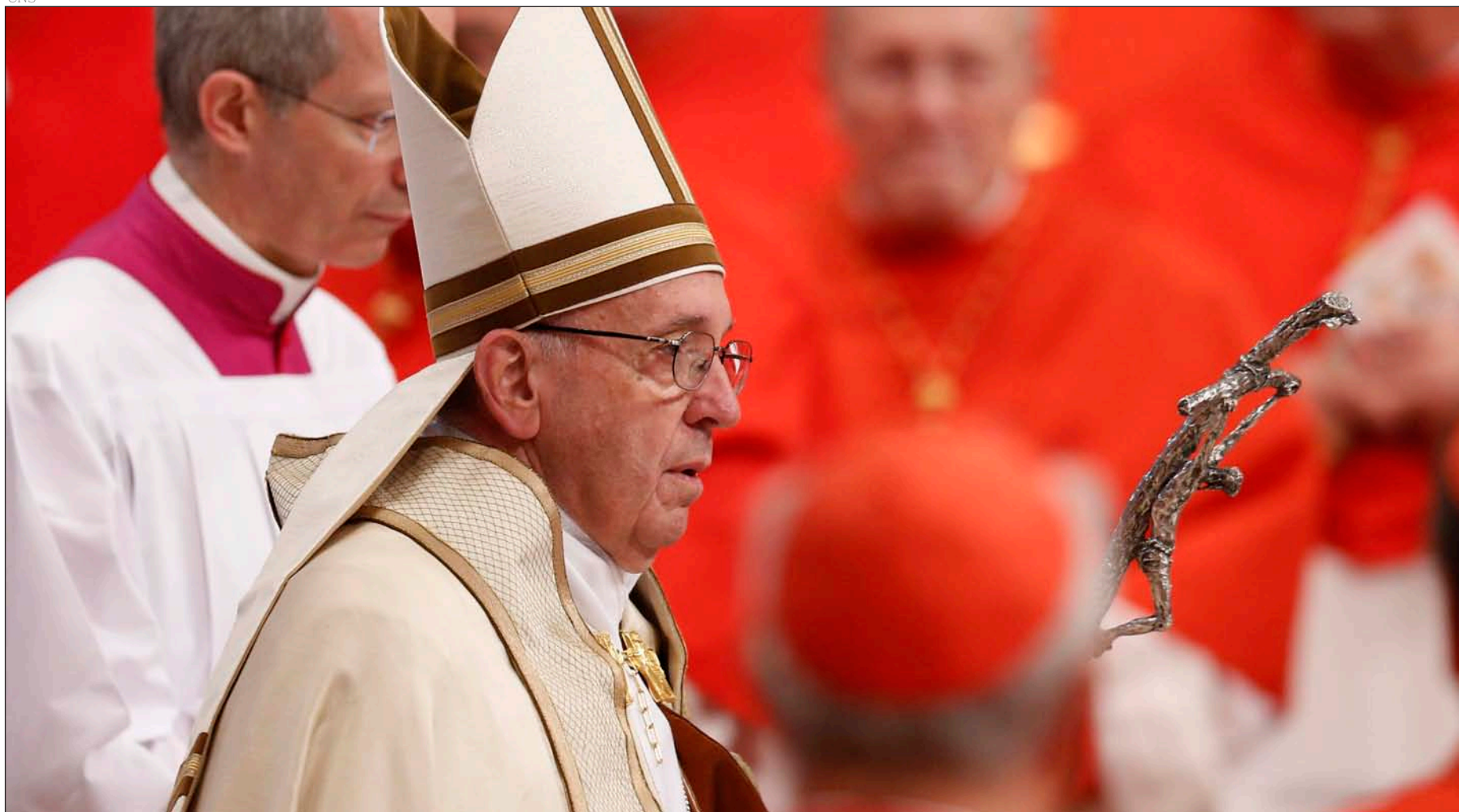
El Papa Francisco a su llegada a la basílica de San Pedro para presidir el consistorio, el 19 de noviembre de 2016