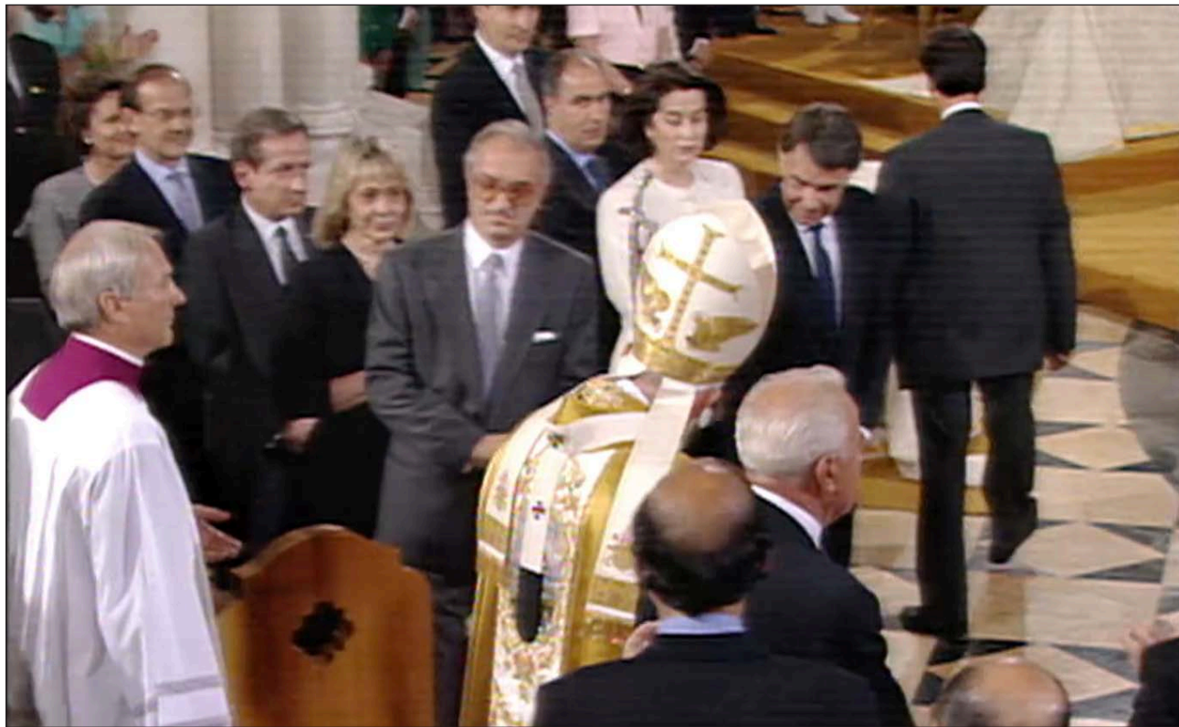
Felipe González saluda al Papa san Juan Pablo II a su llegada a la Misa de consagración de la catedral de la Almudena