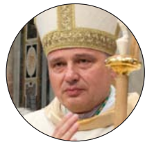
Konrad Krajewski, titular de la Limosnería Apostólica