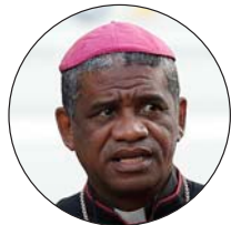
Desiré Tsarahazana, arzobispo de Toamasina (Magadascar)