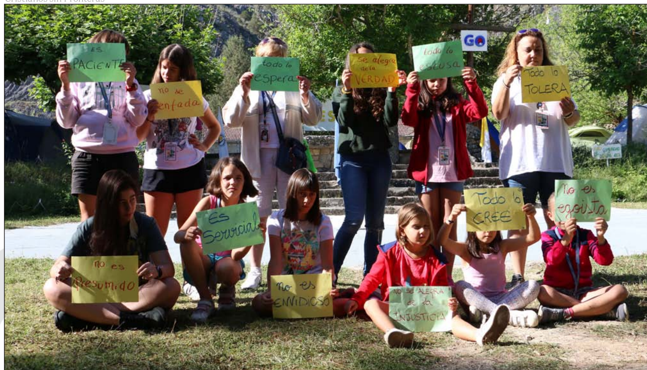
Oración en los Encuentros Misioneros Silos 2017