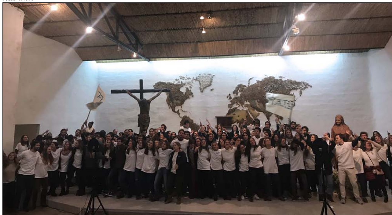
Foto final de un retiro de Effetá en una parroquia