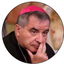
Giovanni A. Becciu, sustituto de la Secretaría de Estado del Vaticano