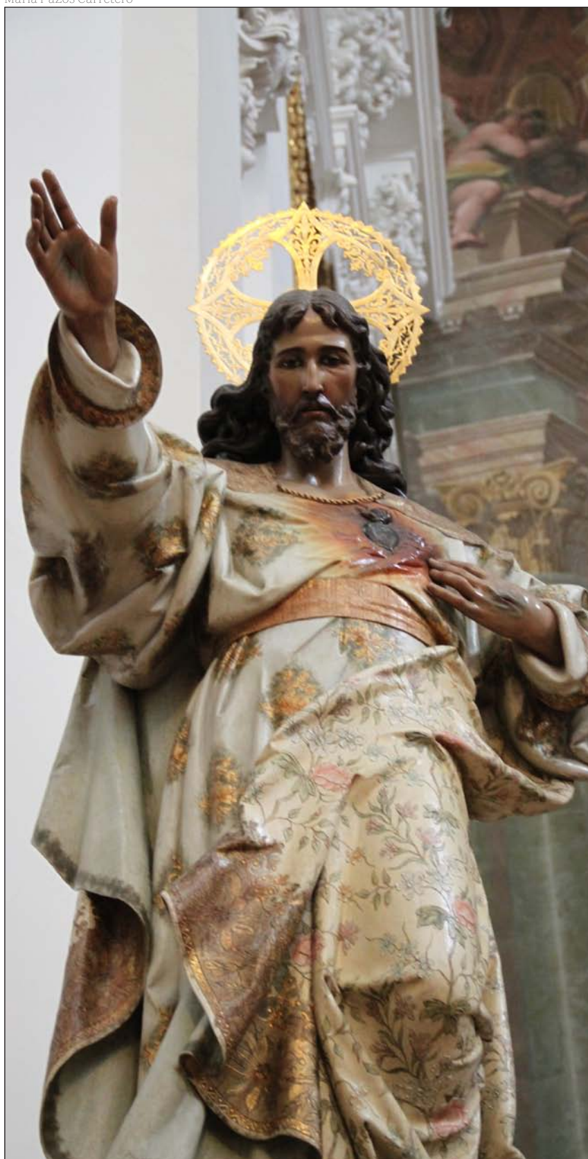
Corazón de Jesús. Santuario Diocesano de los Sagrados Corazones de Toledo

formaciones que ese amor hace en nuestras vidas y en la de los demás, y lo que hace ese amor manifestado a través de nosotros en los que nos rodean. Cuando dejamos que el amor de Dios modele nuestra vida, nos hace vivir una relación intensa con Él, nos hace mantener una comunión viva con Jesucristo, nos hace salir de nosotros mismos para estar siempre en el Señor; al tiempo que nos hace vivir una relación intensa con los demás. Porque, en la medida que nos hacemos más capaces de abandonarnos al amor salvífico y misericordioso de Dios, nos comprometemos más y más en su obra de salvación convirtiéndonos en sus instrumentos.