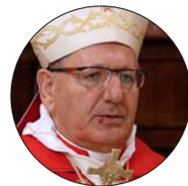
Louis Raphaël Sako, patriarca de Babilonia de los Caldeos