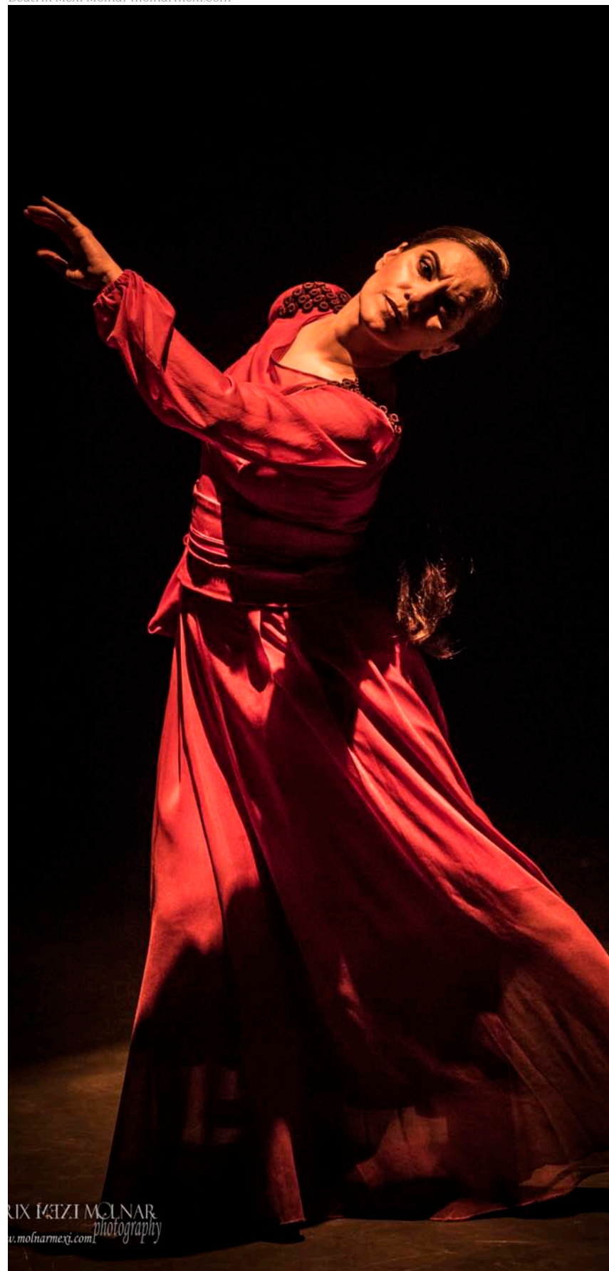
La bailaora y coreógrafa Rafaela Carrasco en Nacida sombra