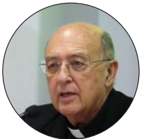
Pedro Barreto, arzobispo de Huancayo (Perú)