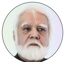
Joseph Coutts, arzobispo de Karachi, (Pakistán)