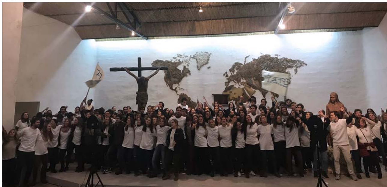
Foto final tras un retiro de Effetá