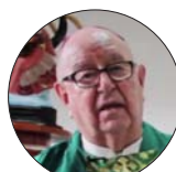
Sergio Obeso Rivera arzobispo emérito de Xalapa (México)