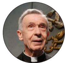
Luis Ladaria, prefecto de la Congregación para la Doctrina de la Fe