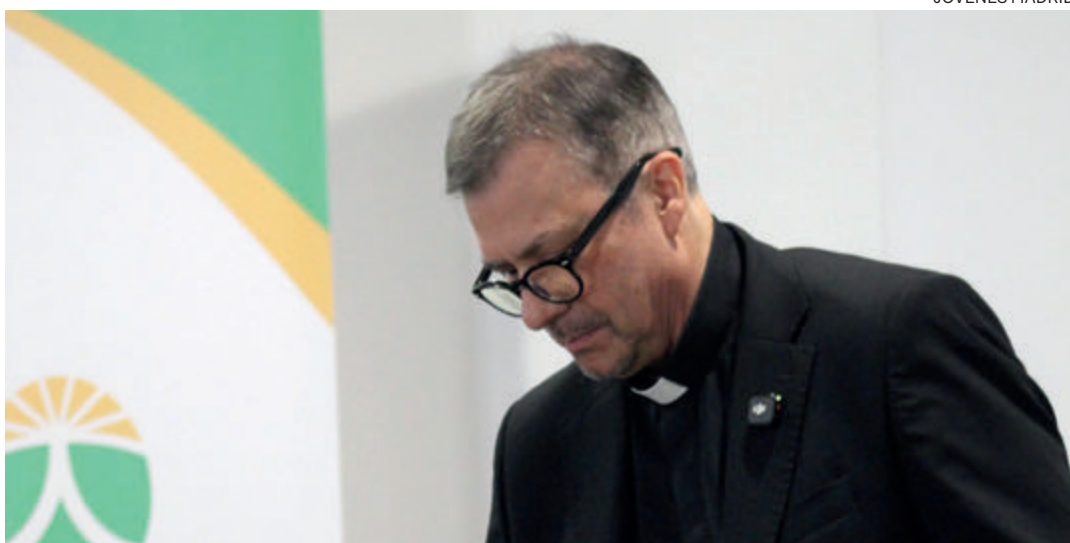
↑ El nuevo secretario desgranó la encíclica Magnífica humanitas en Generación Esperanza.