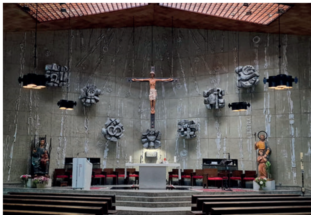
← El presbiterio recoge los símbolos de los siete sacramentos.

Para finalizar, Trujillo valora especialmente la sensibilidad de los parroquianos hacia las necesidades de la Iglesia, que se plasma en la generosa aportación que cada año Las Nieves destina a la diócesis y a otras parroquias a través del Fondo Común Interdiocesano, así como al seminario y a las campañas anuales de Manos Unidas o Cáritas, por ejemplo. «Creo mucho en aquello de los vasos comunicantes en el seno de la Iglesia —confiesa—, y por eso tratamos de sensibilizar a todos para que aquel que más tenga, también aporte más». ●