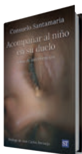
Acompañar al niño en su duelo Consuelo Santamaría Sal Terrae, 2026 208 págs. 16,50 €

acompañado a pequeños ante la muerte, incluso en casos de catástrofes. Ofrece aquí una guía de intervención adaptada por edades y con distintas tareas para ayudar a que la resiliencia se abra paso en medio del dolor. ●