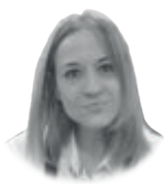
MAICARIVERA Crítica literaria