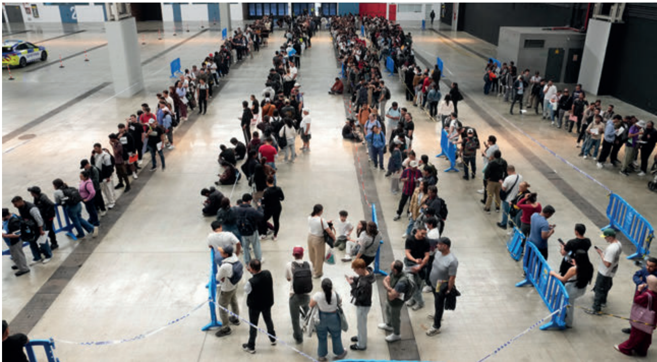
← Las previsiones del Gobierno se han duplicado. De 500.000 solicitudes a más de un millón.