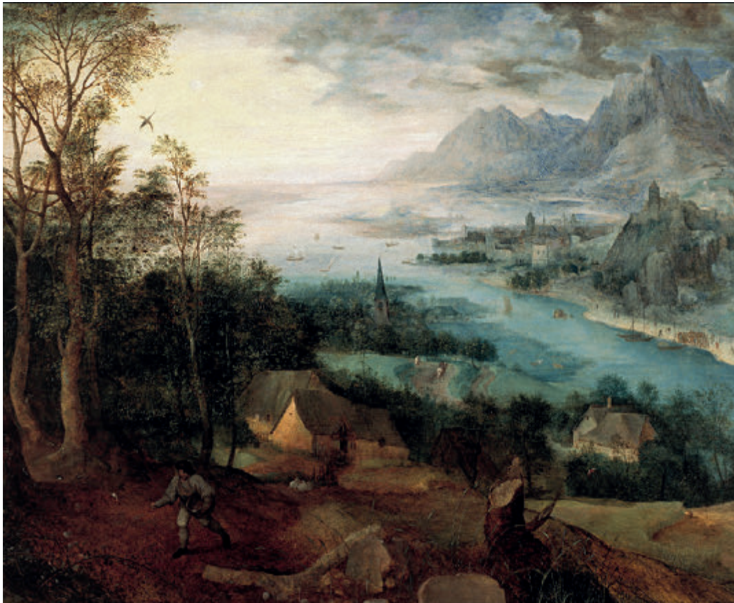
↑ Paisaje con la parábola del sembrador, de Bruegel el Viejo. Museo de Arte Timken de San Diego (EE. UU).