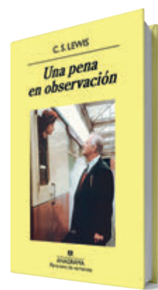
Una pena en observación C. S. Lewis Anagrama, 1994 104 páginas, 18,90 €

Hay que reimprimir, reeditar y releer a C. S. Lewis. Que no se pierda Una pena en observación . No te aflijas, nos dice en algún punto, como se afligen los que no tienen esperanza. La densidad intelectual está traspasada de una emoción que llega a todos. No leas autoayuda. Lee a C. S. Lewis. ●