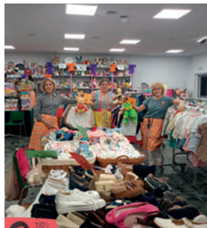
↑ El rastrillo es un motor de caridad.

Por este motivo, se confiesa dolido cuando a veces se minusvalora la dimensión sacramental de la vida cristiana que toda parroquia ha de cubrir: «Es hasta ofensivo escuchar que la parroquia es una especie de estación de servicios», asegura, para añadir que,