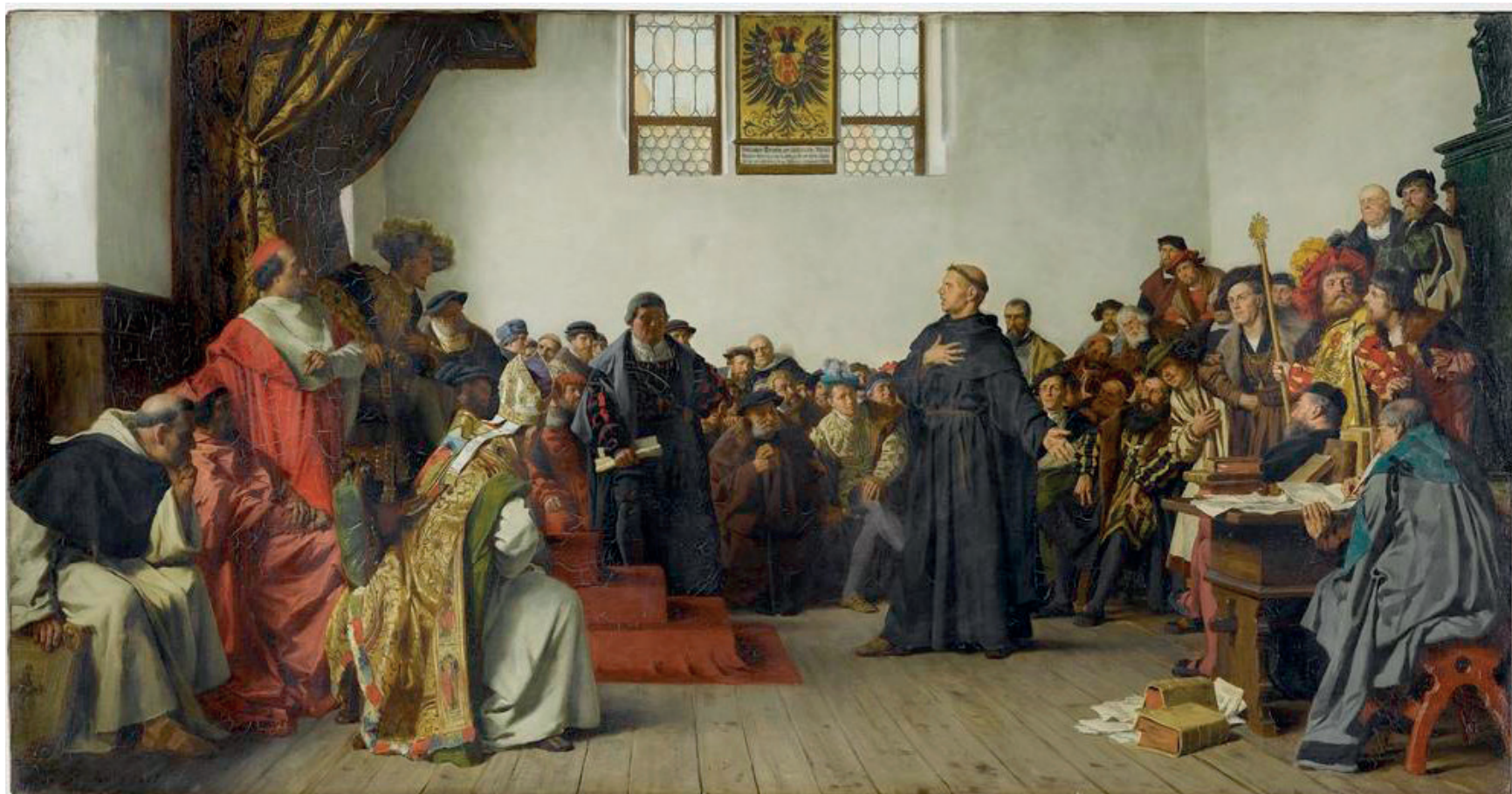
↑ Lutero ante la Dieta de Worms , de Anton von Werner.