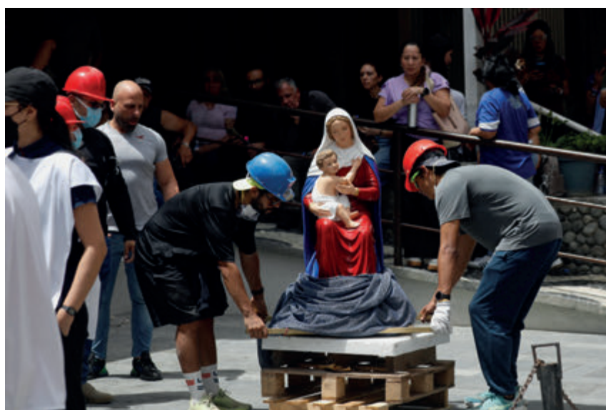
↑ Rescatistas colocan una Virgen con el Niño junto a un edificio en ruinas.

El terremoto de Venezuela devastó la capital y otras regiones, castigadas por la precariedad de sus infraestructuras desde hace décadas. «Es la hora de la solidaridad», clama el nuncio en el país