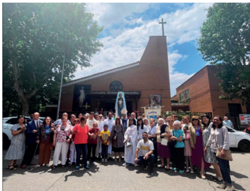
↑ Un grupo de fieles frente a la parroquia Virgen del Mar.