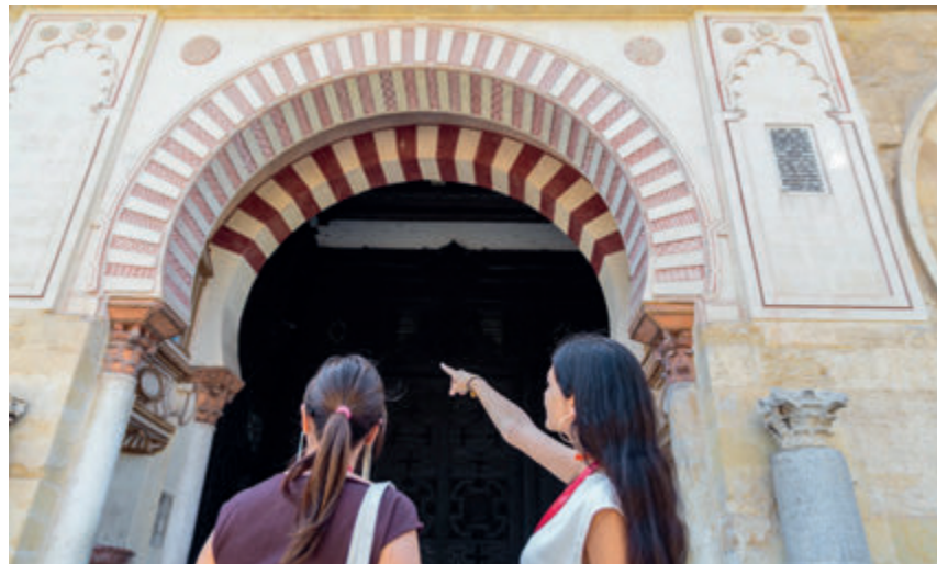
↑ Una voluntaria de NárteX explica la mezquita-catedral de Córdoba.