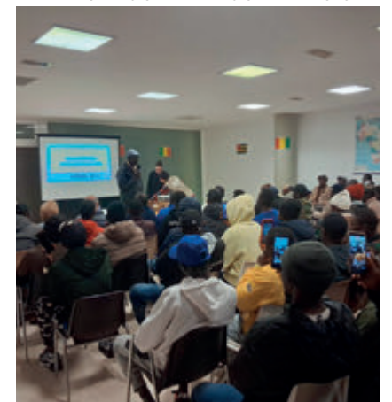
↑ Un taller con migrantes.