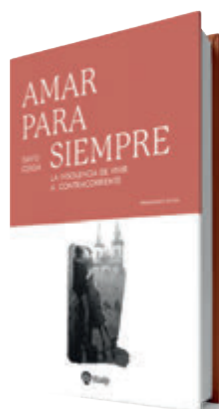
Amar para siempre. La insolencia de vivir a contracorriente David Cerdá Rialp, 2026 296 páginas, 19,90 €