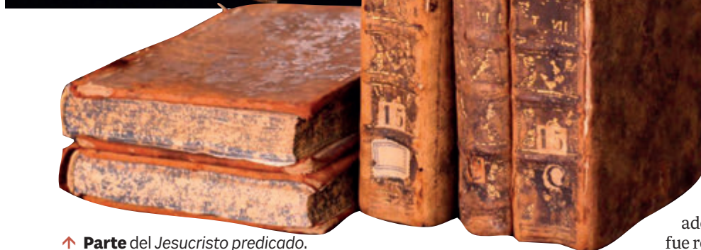
↑ Parte del Jesucristo predicado .

← Primera página del tomo recuperado, donde se lee el título completo de la obra.