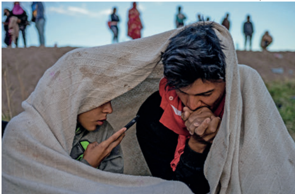
← El miedo a las organizaciones criminales es una constante en Ciudad Juárez. Aquí, venezolanos en 2024.