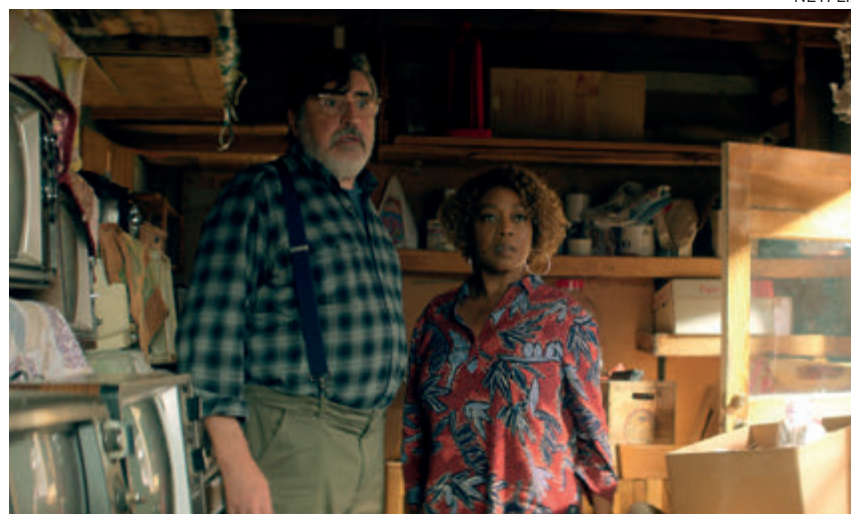
↑ Alfred Molina da vida a Sam y Alfre Woodard a Judy en esta serie.

Y, sin embargo, uno sospecha que existe un cierto derecho al entretenimiento.