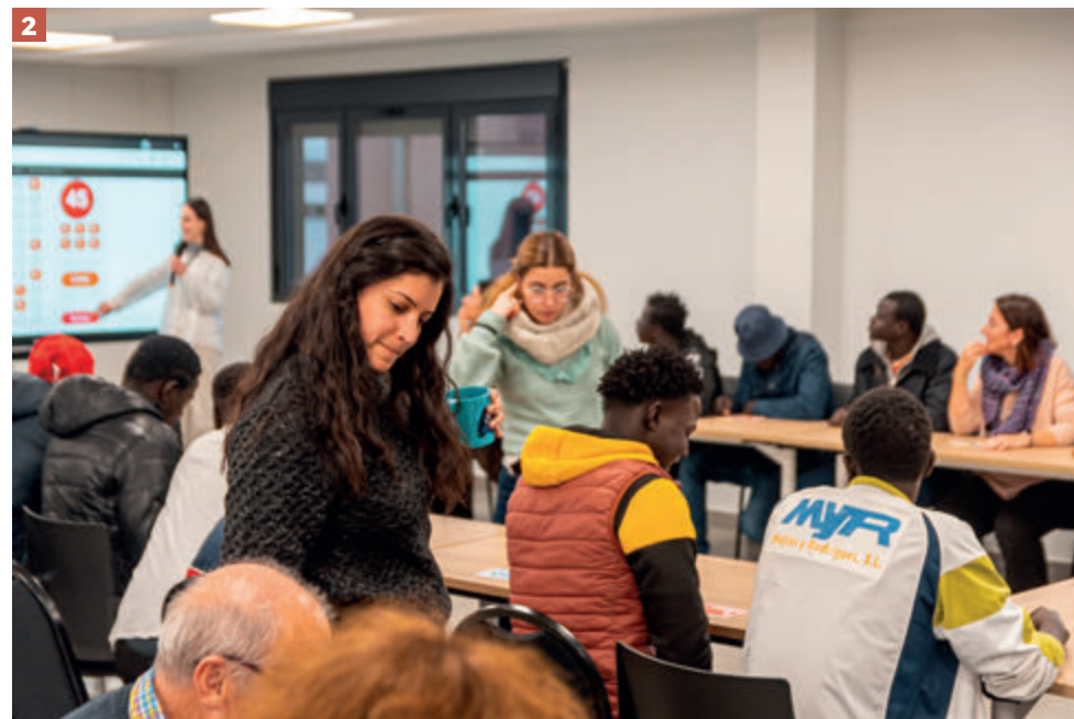
HERMANDAD HOSPITALARIA SAN JUAN DE DIOS