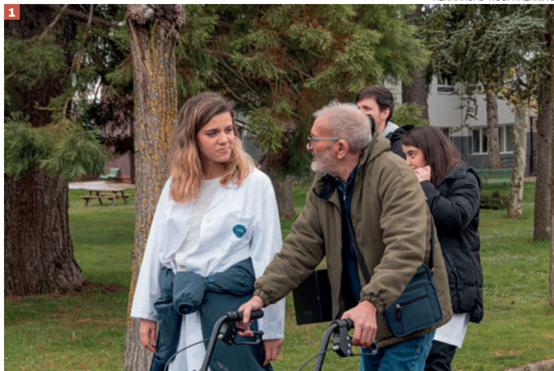
HERMANDAD HOSPITALARIA SAN JUAN DE DIOS