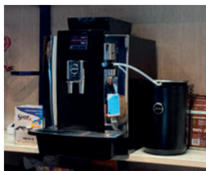
↑ El café de especialidad es el secreto.