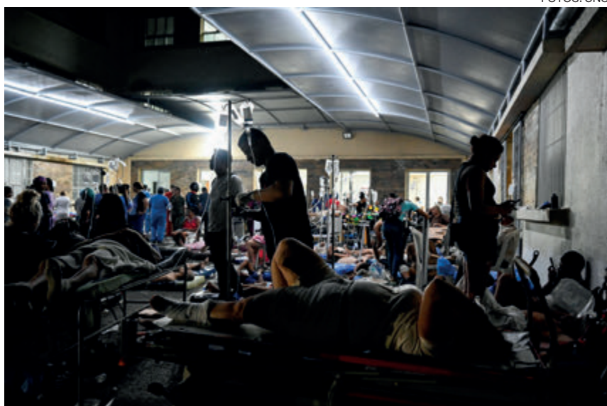
↑ Ya hay más de 5.000 heridos contabilizados tras el terremoto.