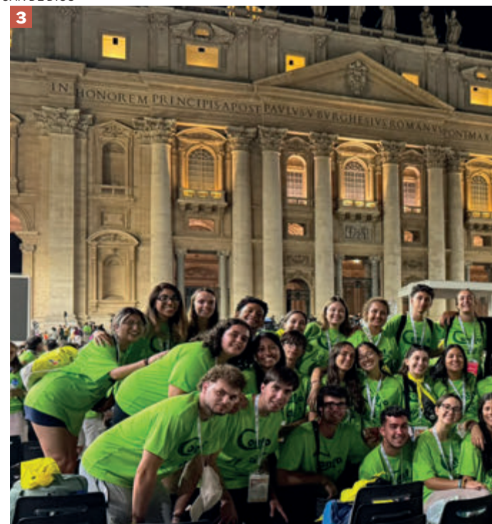
SAN MIGUEL ARCÁNGEL