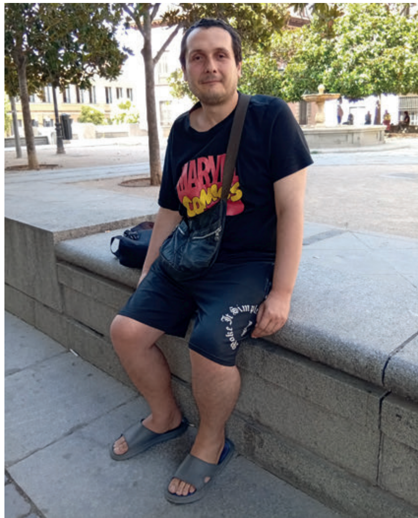
J. L. V. D.-M.

—Porque unas personas me prometieron un empleo. Era el año 2021 y después me di cuenta de que eran traficantes de seres humanos. Tuve que huir de ellos y traté de buscarme la vida. Aquí me surgieron graves problemas de salud. Tengo fibromialgia, que me afecta a todo el aparato musculoesquelético, con cansancio ex-