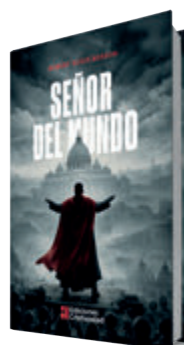
Señor del mundo Robert Hugh Benson Cristiandad, 2026 394 páginas, 20,90 €