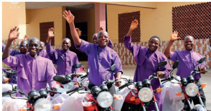
↑ Los catequistas de Nigeria evitarán secuestros gracias a las motos de ACN.

mis limitaciones. Con un corsé bajo el traje y un dolor acallado por la emoción, de la mano de mi mujer subí al escenario.