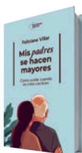
Mis padres se hacen mayores Feliciano Villar Plataforma, 2026 240 páginas, 17,90 €

proyecto con amigos, muchos empezaban a compartir vivencias. Recoge algunas en esta interesante guía para navegar no solo el cambio de roles sino las nuevas decisiones que implica y cómo abordarlas respetando su dignidad. ●