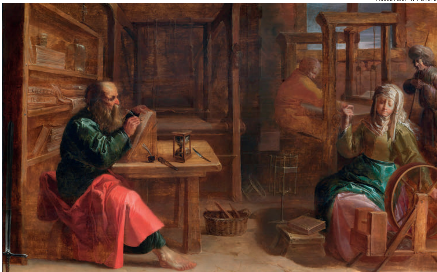
← San Pablo con Áquila y Priscila , del pintor flamenco Jan van de Venne.