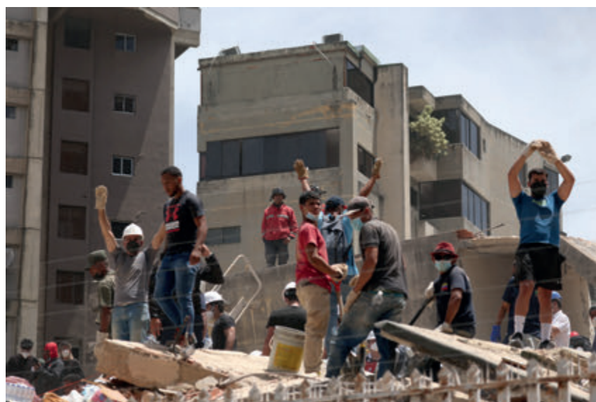
↑ Los venezolanos retiran los escombros con sus propias manos.

El terremoto de Venezuela devastó la capital y otras regiones, castigadas por la precariedad de sus infraestructuras desde hace décadas. «Es la hora de la solidaridad», clama el nuncio en el país