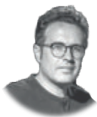
JESÚS MONTIEL Escritor