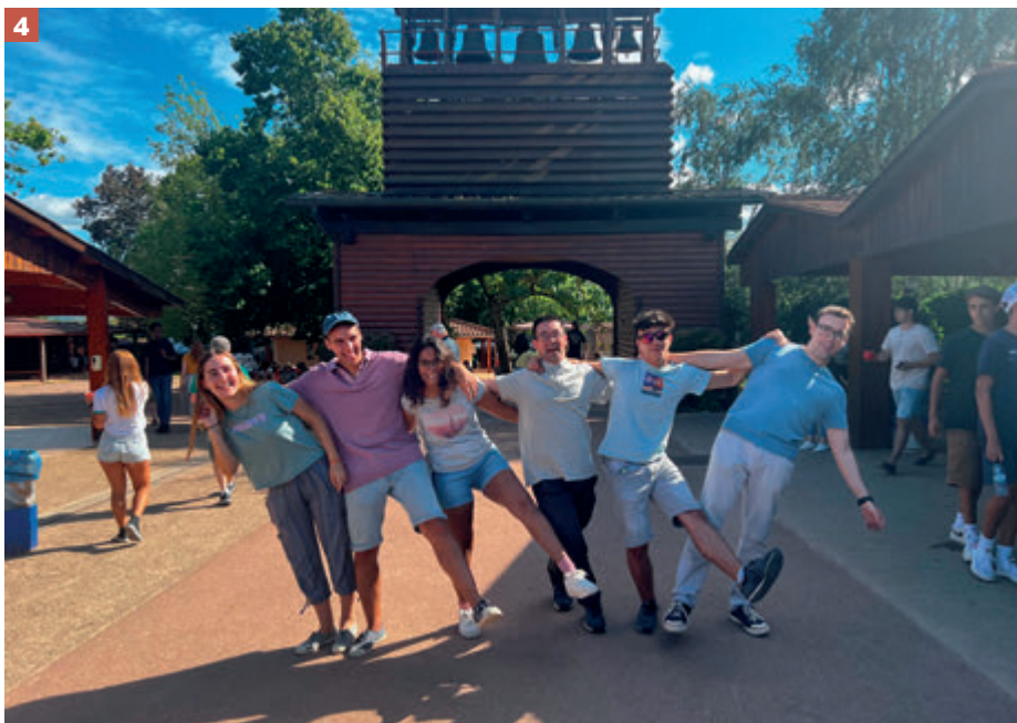
DELEGACIÓN DE JÓVENES

Según este organizador, «es muy importante buscar todo eso que nos une porque estamos muy acostumbrados a nuestra parroquia, colegio o movimiento. Pero conocer a gente distinta te hace tener un punto de vista diferente». Y matiza que «eso no significa que vayas a cambiar tus creencias, pero sí puedes aprender cosas de los demás que te sirven para entender mejor la realidad». ●