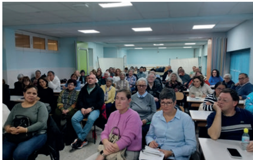
↑ Un momento de la última asamblea de la unidad pastoral del Gran San Blas.