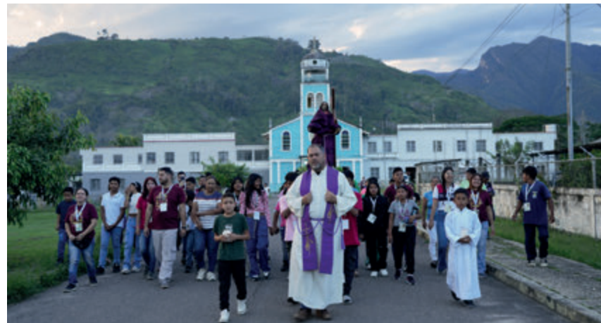
↑ Procesión del Cristo Nazareno con Los Ángeles del Tukuko de fondo.