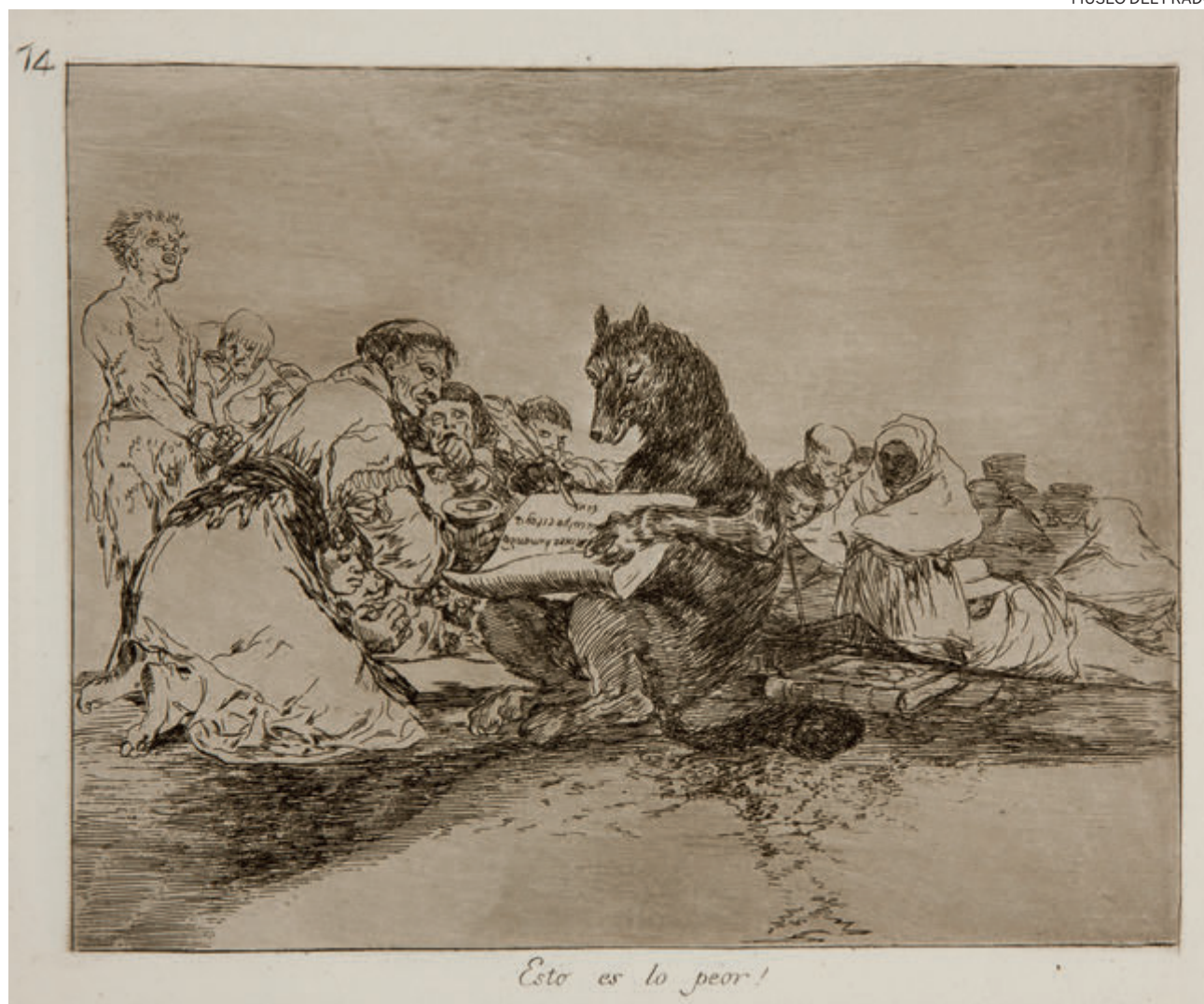
Esto es lo peor!