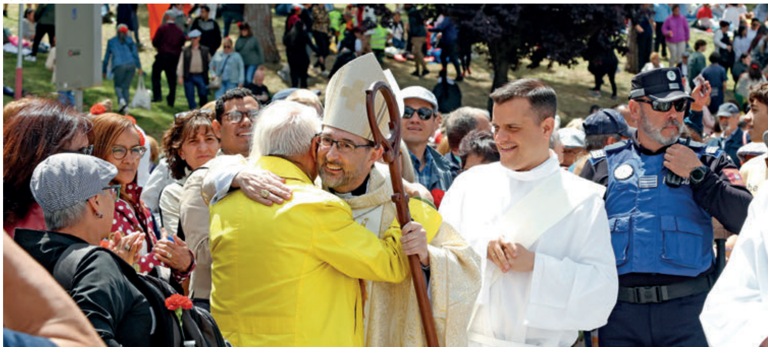
↑ Misa en la Pradera de San Isidro el 15 de mayo de 2024.

✔ Visita del patriarca Bartolomé el 15 de octubre de 2023.