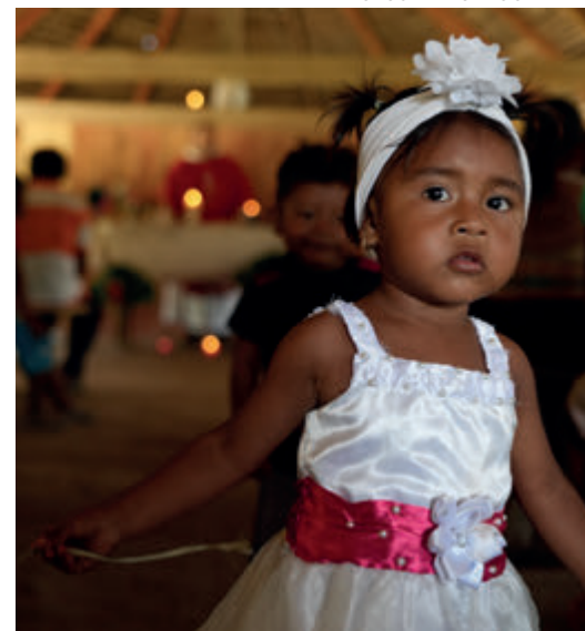
↑ Misa en una capilla-bohío en Peraya.