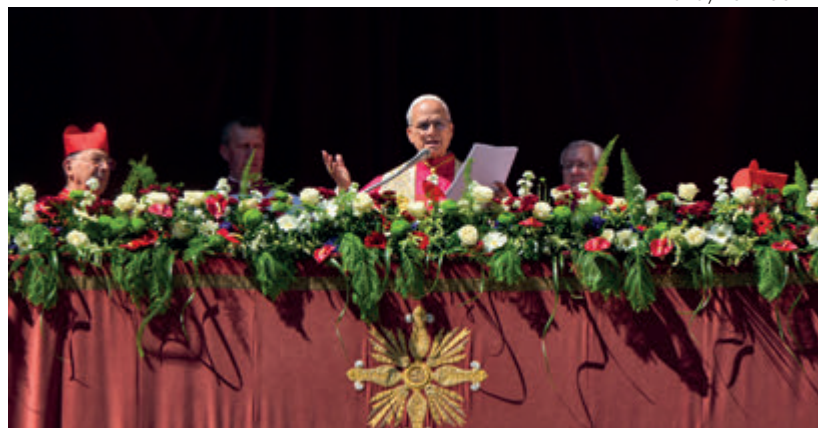
↑ El Papa León XIV durante la bendición urbi et orbi ante la plaza de San Pedro.