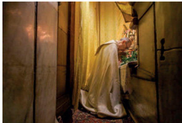
← El patriarca latino de Jerusalén, el cardenal Pizzaballa, reza en el Santo Sepulchro.