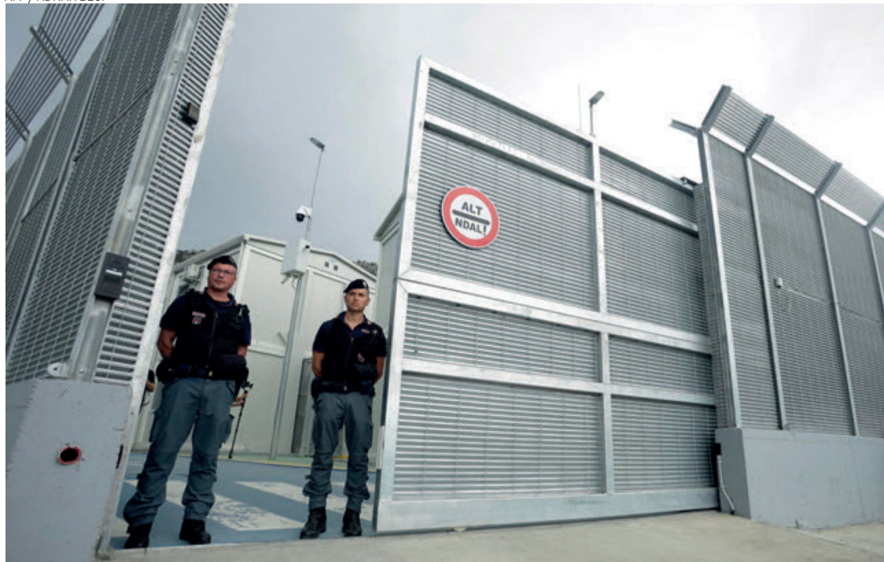
↑ Policías italianos a la entrada del centro de detención de migrantes en Shengjia (Albania) en octubre de 2024.