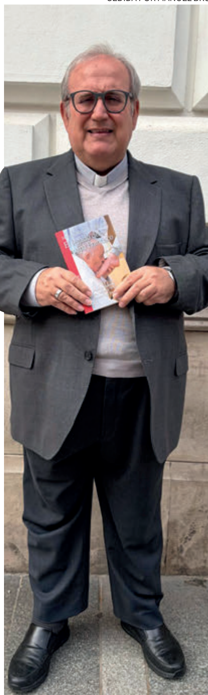
↑ Antes fue delegado de Catequesis.

y empobrecida a la persona descartada, abandonada, sola), y por otro lado sociológica (de la tensión opresor-oprimido a la relación dinámica entre integración y exclusión), como en la praxis (de la promoción superadora de la asistencia al cuidado y el acompañamiento que completa la promoción).