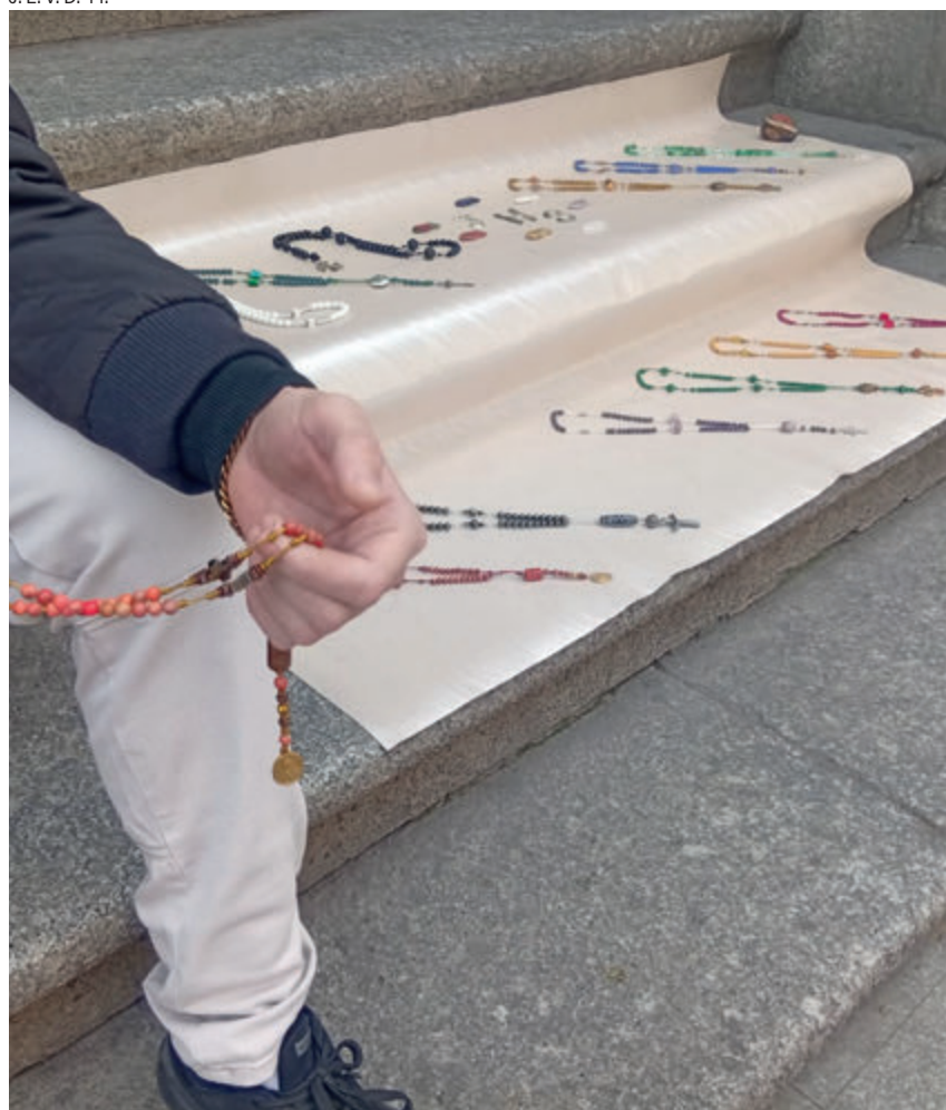
↑ Borja con uno de sus rosarios, delante de la colegiata de San Isidro.