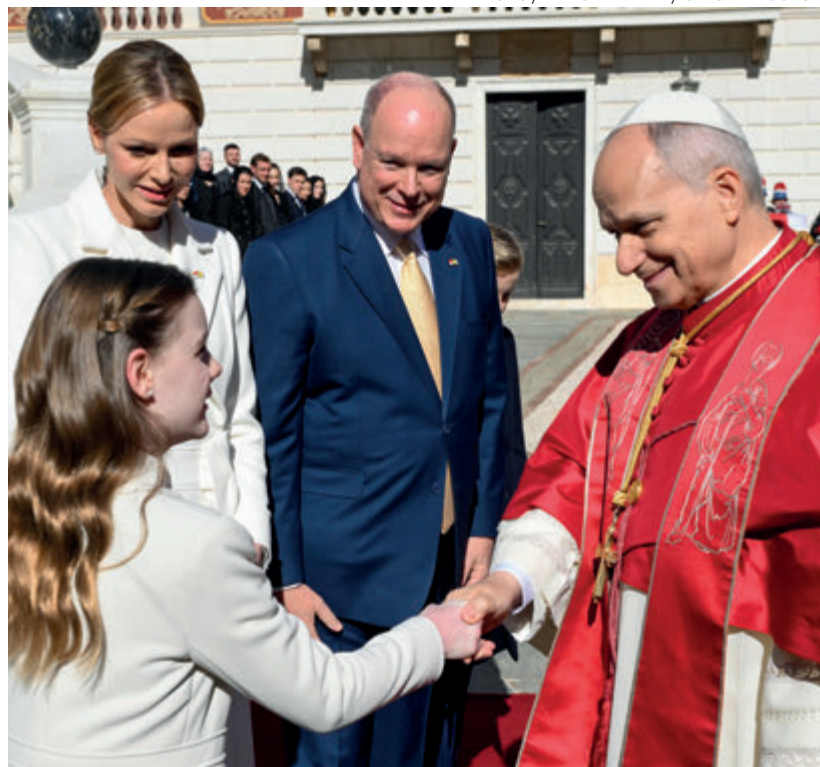
↑ Gabriela de Mónaco, única heredera al trono, le da la mano al Papa.

es un pueblo, pero «no como los demás». Su principio unificador no es una lengua, una cultura o una etnia, sino la fe en Cristo, y por eso en ella hay sitio para todos. Su vocación es extenderse a todo el mundo y en todos los tiempos, pero no mediante una conquista armada, como los imperios de este mundo, sino mediante el testimonio de la verdad y del amor que se ofrece a la libertad de todos. Este pueblo es «católico» porque acoge las riquezas y los recursos de las diversas culturas