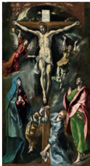
↑ La crucifixión (1597). El Greco.