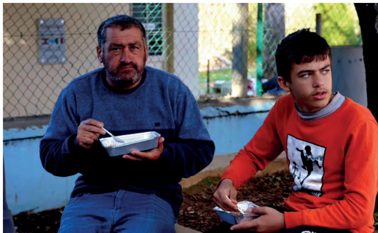
↑ Las familias abandonaron sus pueblos con lo puesto debido a los constantes bombardeos.

La responsable de Comunicación de Misiones Salesianas reconoce que el español promedio no piensa en el Líbano cuando habla de Oriente Medio pero «para eso estamos aquí, para dar a conocer situaciones no tan mediáticas como otras». Y para ofrecer a los jóvenes una educación que les sirva para construir un futuro libre de violencias. «Está en nuestro núcleo y es nuestra razón de ser, queremos apoyar a todos estos niños y niñas y que puedan ir a la escuela», concluye. ●