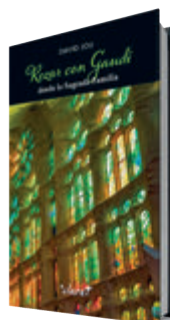
Rezar con Gaudí desde la Sagrada Familia

fachadas, torres y vidrieras, sugiere en cada página un poema que es una plegaria, acompañada de una foto de cada rincón del templo. «La basílica es, a través de sus símbolos y formas, una inmensa oración», escribe. ●