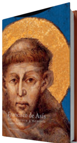
Francisco de Asís. Entre historia y memoria

Francisco no alentó una retirada del mundo. Al igual que las beguinas, que hicieron pie en el legado franciscano (qué placer intelectual y espiritual supone la lectura, por ejemplo, de la franciscana Ángela de Foligno), el santo de Asís reconoció la presencia divina en todo cuanto existe; eso significa ver a Dios en medio del desastre, en medio de la decrepitud, también en medio del gozo, pero verlo, en definitiva, en el mundo, no tras él o a expensas de él. Vauchez devuelve a Francisco esta dimensión concreta y radicalmente evangélica. Lo divino puede reconocerse en la materia misma del mundo. ●