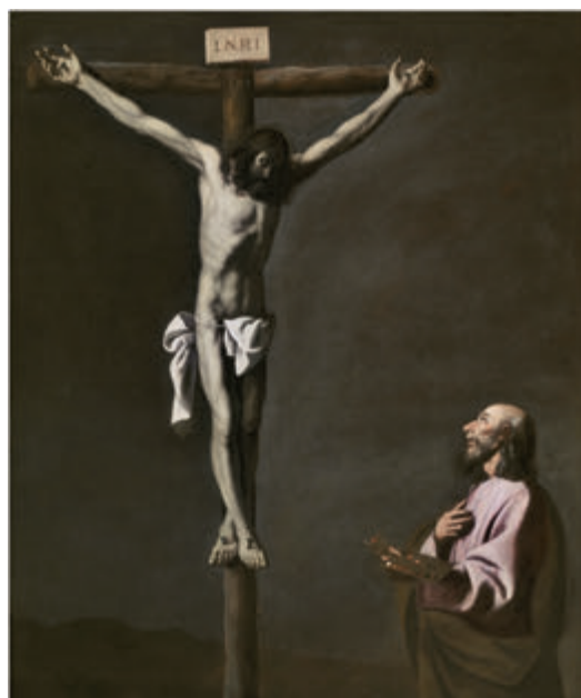
↑ Cristo crucificado con un pintor . Zurbarán.