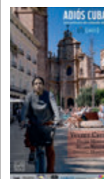
Adiós Cuba Dirección: Rolando Díaz País: España Año: 2025 Género: Drama Público: +16 años

Con muy poquito presupuesto, arropado por amigos y gracias a fortuitos hallazgos en el camino, el cineasta cubano logra el milagro —ese milagro colectivo— de engendrar su decimo-segundo filme. Seis impresionantes testimonios emocionan al narrar cómo dejaron la isla exponiéndose a grandes peligros, a través de aire, mar y tierra. Rolando Díaz homenajea especialmente a los llamados balseros cubanos aquellos migrantes irregulares que cruzan el estrecho de Florida hacia Estados Unidos en embarcaciones precarias, en viajes extremadamente peligrosos. Aunque las oleadas más importantes quedaron atrás, el fenómeno persiste. Por desgracia, sobran los motivos. ●