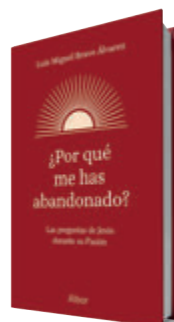
¿Por qué me has abandonado?