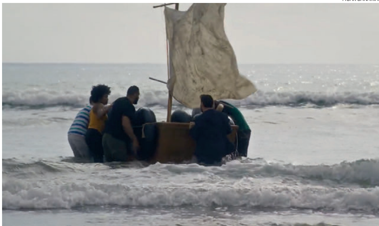
↑ La cinta homenajea especialmente a los balseros.