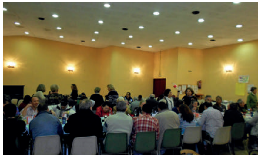
↑ Uno de los desayunos que ofrece la parroquia.

Como curiosidad, el templo está bajo la advocación de Nuestra Señora del Rosario de Filipinas porque los dominicos