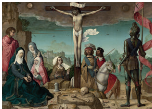
← La crucifixión (1509-1519). Juan de Flandes.