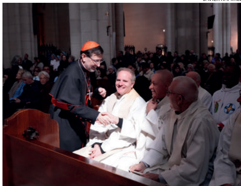
↑ A la Misa acudieron más de un millar de sacerdotes.

nes provocan todas esas situaciones, los victimarios». Y todo ello «en unión con Cristo, quien en la cruz hace carne el dolor de todas las víctimas», pero que luego resucita; un hecho que la archidiócesis celebrará el próximo sábado 4 de abril, a partir de las 22:00 horas, en la catedral de Santa María la Real de la Almudena. ●