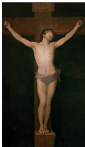
↑ Cristo crucificado (1780). Francisco de Goya y Lucientes.

Flandes, autor por excelencia del gótico hispanoflamenco, concibió La Crucifixión (1509-1519). Jesús, en el centro de la composición, con su padecimiento, con su humanidad desgarrada, nos recuerda aquel « consummatum est » (Jn 19,30). Nos emocionamos ante este Cristo que es sacerdote, víctima y altar. Así lo celebraremos el Jueves Santo, cuando rememoremos la institución la Eucaristía.