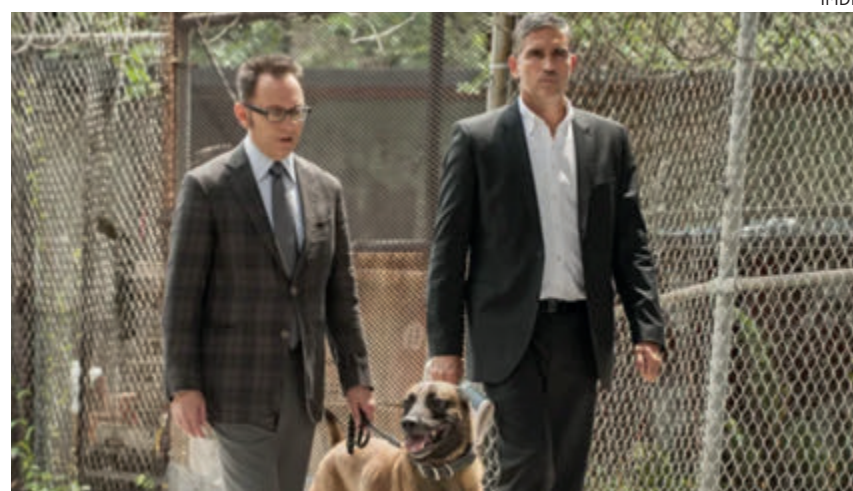
↑ Finch y Reese en el segundo episodio de la cuarta temporada.

Person of Interest , cuyas cinco temporadas tienen completas en Netflix, cuenta la historia de John Reese (Jim Caviezel), un exagente de la CIA hundido en la oscuridad de la soledad, y Harold Finch (Michael Emerson), un misterioso millonario que ha construido una máquina capaz de predecir crímenes antes de que ocurran. Juntos forman un equipo improbable que se dedica a salvar a personas cuya vida, para el mundo, parece