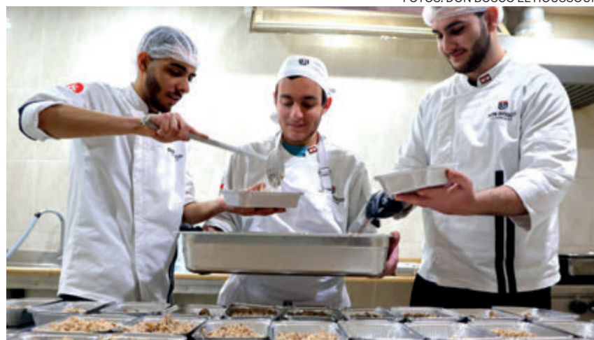
↑ Los estudiantes de Hostelería aprenden cocinando para los desplazados.

«Estamos ayudando desde una perspectiva cristiana, aunque no compartan nuestra visión sobre el Líbano»