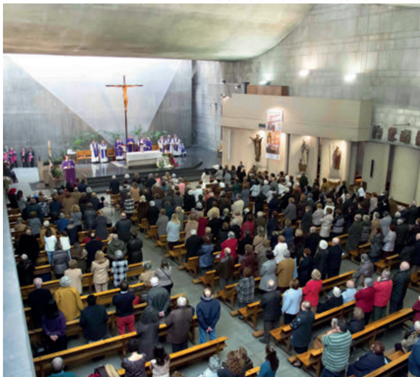
↑ Celebración en el templo.

FOTOS: NUESTRA SEÑORA DEL ROSARIO DE FILIPINAS