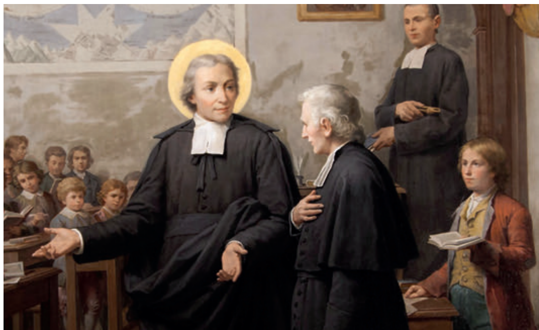
HERMANOS DE LA SALLE

Todo parecía claro: el muchacho quería ser cura y comenzó los estudios de Teología en 1669. Sin embargo, la muerte de su madre en 1671 y la de su padre en 1672 lo retrasaron todo. San Juan Bautista de La Salle, que era el primogénito, interrumpió sus estudios y se centró en gestionar los bienes de sus difuntos padres para sostener a sus seis hermanos. En vez de ver esto como un obstáculo para su vocación, Bravo matiza que «se dejó llevar por los compromisos y uno le llevaba al siguiente para hacer el plan de