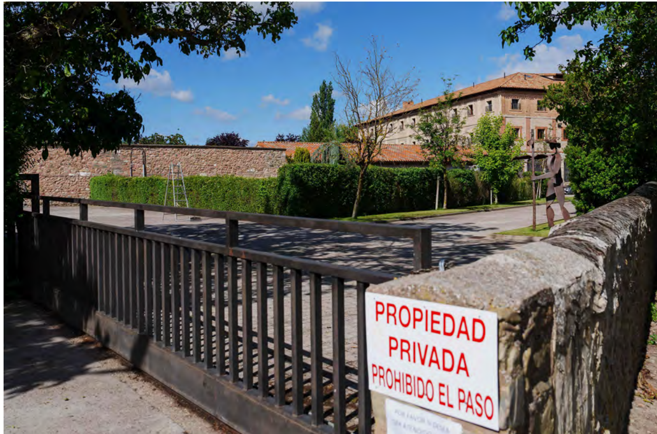
↑ Las exclarisas de Belorado carecen actualmente de título de propiedad sobre el inmueble.