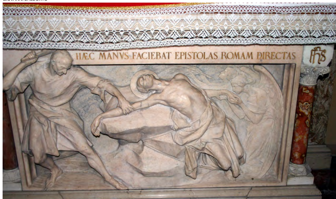
↑ Martirio de san Arialdo. Iglesia de San Calimero, Milán (Italia).