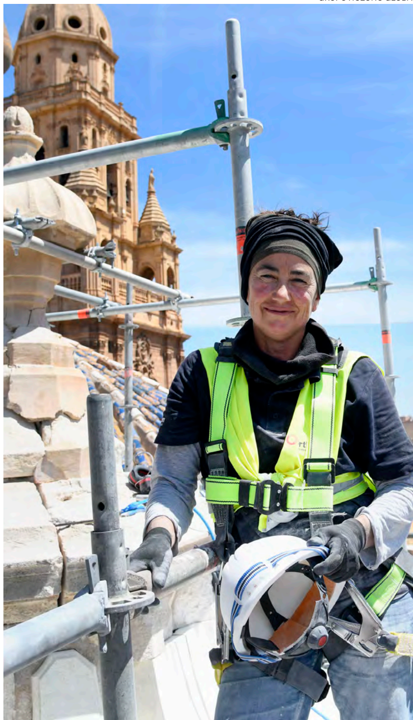
↑ La cantera subida al andamio en la catedral murciana.

—Hace unos años cayó una piedra de una cornisa. Se hizo un estudio para ver su estado general y se concluyó que había que intervenir porque había más