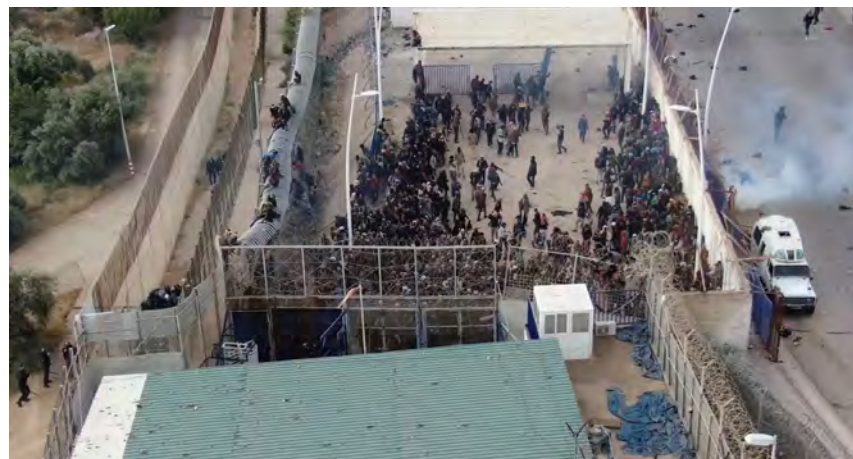
↑ Migrantes durante el asalto a la valla de Melilla el 24 de junio de 2022.

Tras semanas de hostigamiento por parte de las autoridades marroquíes, como demuestra una reciente investigación de Border Forensics y Centre Iridia, la mañana del 24 de junio casi 1.700 migrantes descendieron desde el monte Gurugú, donde estaban establecidos temporalmente, en dirección a Melilla con la intención de cruzar la frontera.