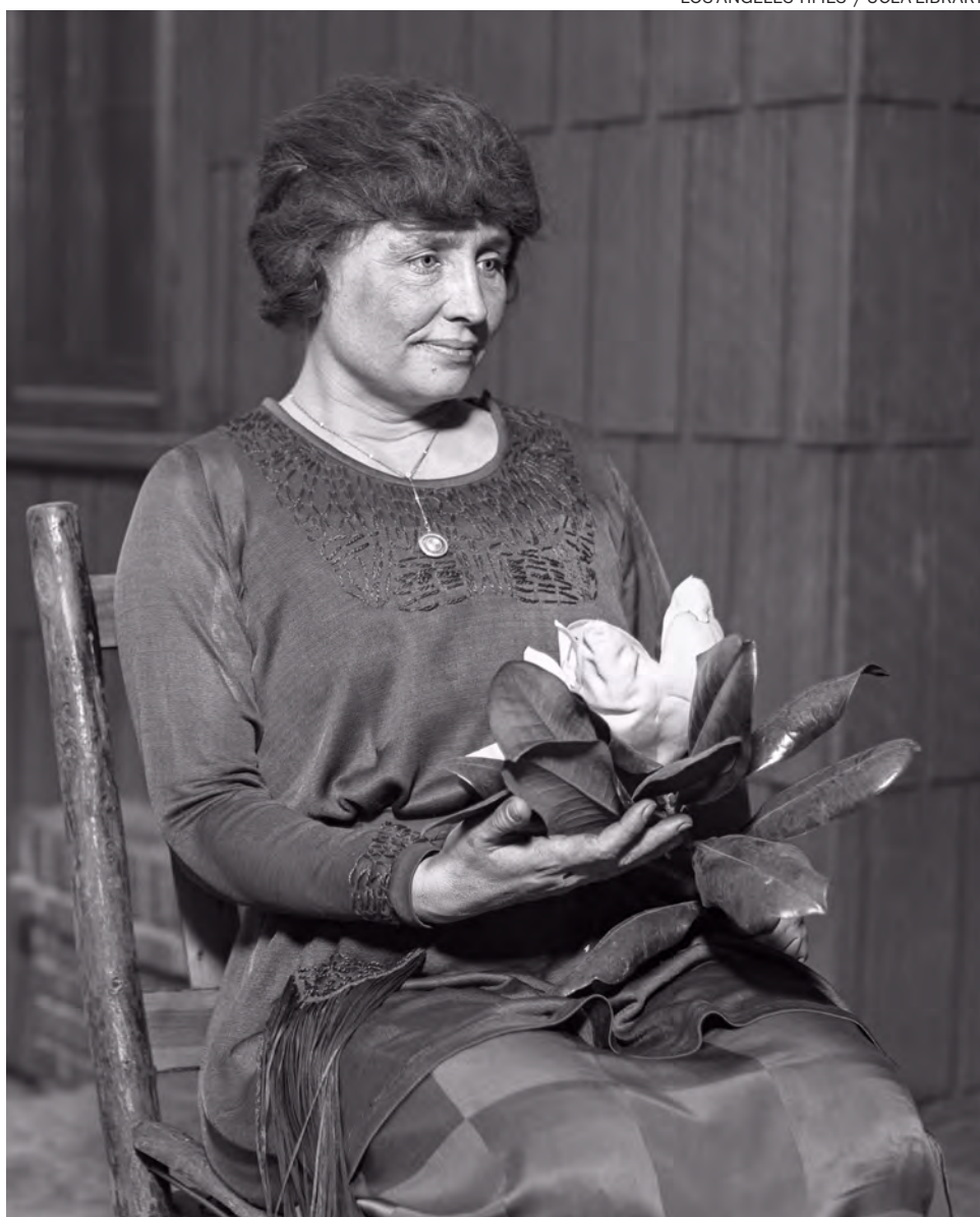
↑ Helen Keller llegó a dominar cinco idiomas a lo largo de su vida, además del braille.