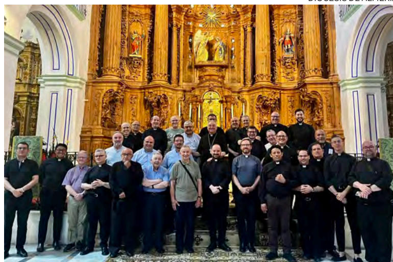
↑ Gómez Cantero en un encuentro con su clero la semana pasada.

El obispo de Almería, Antonio Gómez Cantero, ha contado en una carta a sus sacerdotes que ha puesto en marcha un plan de viabilidad para salvar la economía diocesana. En ella reconoce «una situación económica complicada» y que «las deudas nos atenazan». Explica también que «se ha negociado con nuestros acreedores y se han estudiado todas las tasaciones de nuestros bienes inmuebles para conseguir las mejores condiciones de venta». Aun así, próximamente «tendremos que tomar alguna decisión muy dolorosa», lamenta, para poder «continuar con nuestra misión evangelizadora, asistencial y promotora de los valores que Jesús nos mostró».