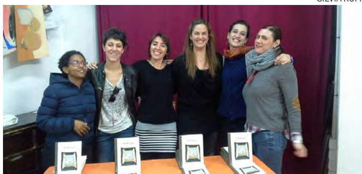
↑ El GIA Helen Keller en una presentación del libro.

Durante meses, Anne Sullivan estimuló a Helen a través del tacto, los olores y otras experiencias para que entendiera que las cosas a su alrede-