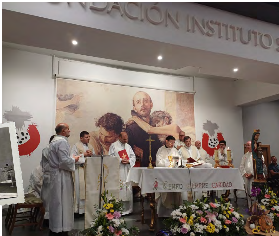
↑ El cardenal Cobo celebra la Eucaristía por los 125 años de la fundación.