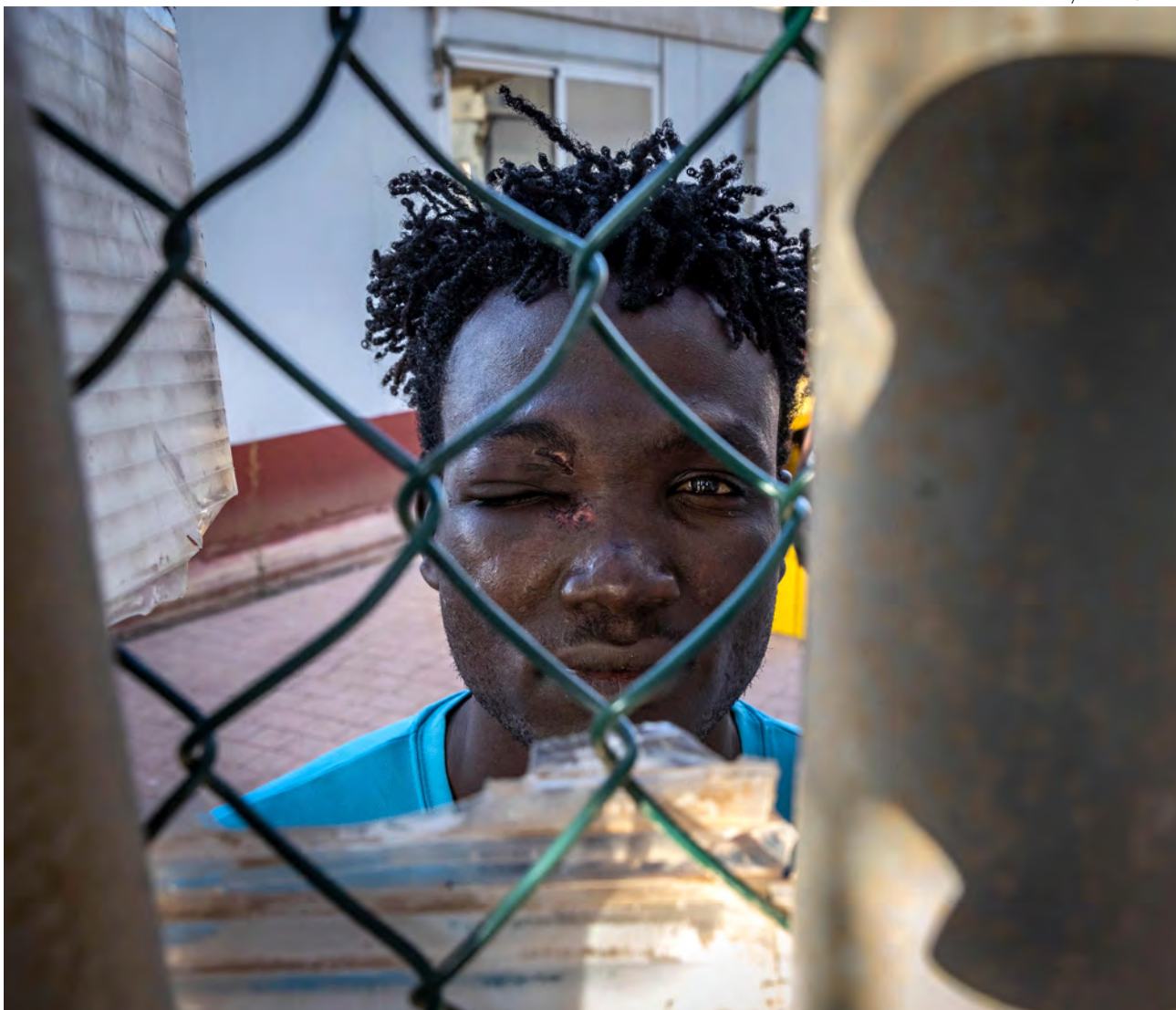
↑ Un inmigrante con una lesión ocular en el centro temporal para migrantes de Melilla tras la tragedia de 2022.