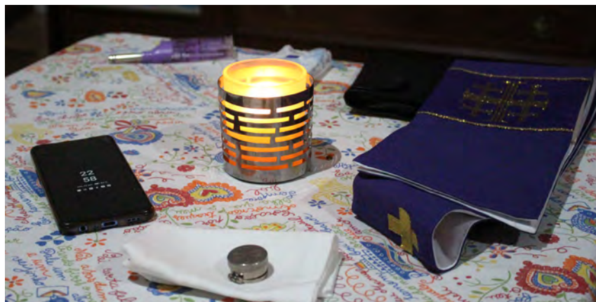
↑ Los sacerdotes de guardia mantienen los óleos a mano por si fuera necesario.

La luz de la vela ilumina de forma tenue el salón de la casa parroquial de San Hilario de Poitiers, una iglesia madrileña