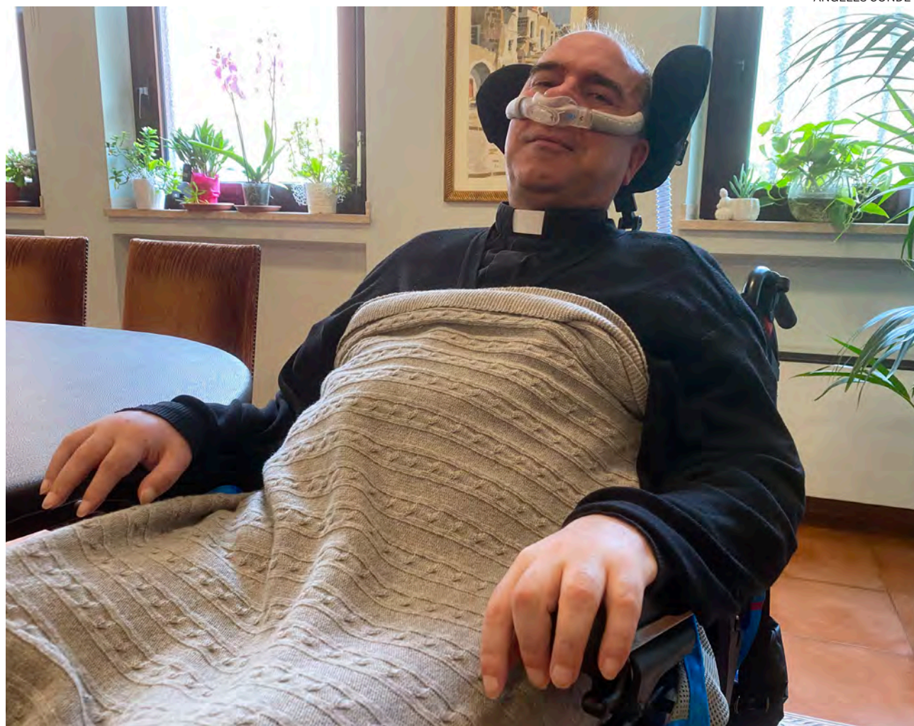
↑ El sacerdote español durante la entrevista para Alfa y Omega .