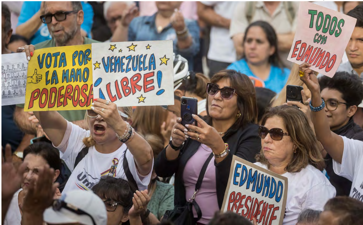
↑ Simpatizantes del bloque opositor en una manifestación en Caracas el 13 de junio.