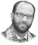
JUAN ORELLANA @joregut

Shayda (Zar Amir Ebrahimi) es una mujer iraní que vive en Australia. Acaba de llegar a una casa de acogida para mujeres maltratadas con hijos. Shayda vive con su hija Mona y quiere tramitar el divorcio de su marido Hossein (Osamah Sami), que la ha agredido y violado. Hossein ha conseguido que el juez le permita ver a su hija los sábados por la tarde sin supervisión. Esos encuentros semanales van a suponer un auténtico vía crucis para madre e hija.