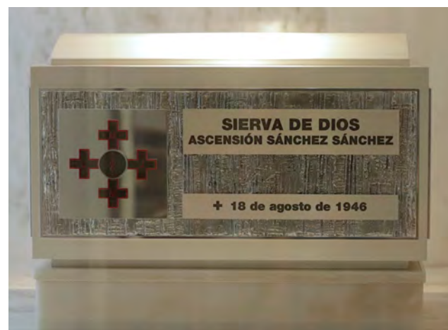
↑ La venerable falleció de fiebre tifoidea con 35 años.

Aunque empezaron en las cárceles, las 96 laicas de la Cruzada Evangélica que hoy se reparten por el mundo se dedican a «cualquier necesidad que surja dentro de la sociedad civil» y tienen un «cuarto voto de apostolado». Cuentan con «hospitales, centros de FP, residencias de mayores, mamás y niños, colegios y escuelas infantiles», y no solo en España, donde tienen 30 vocaciones, sino también en Bolivia, Perú, República Democrática del Congo y Zambia. ●