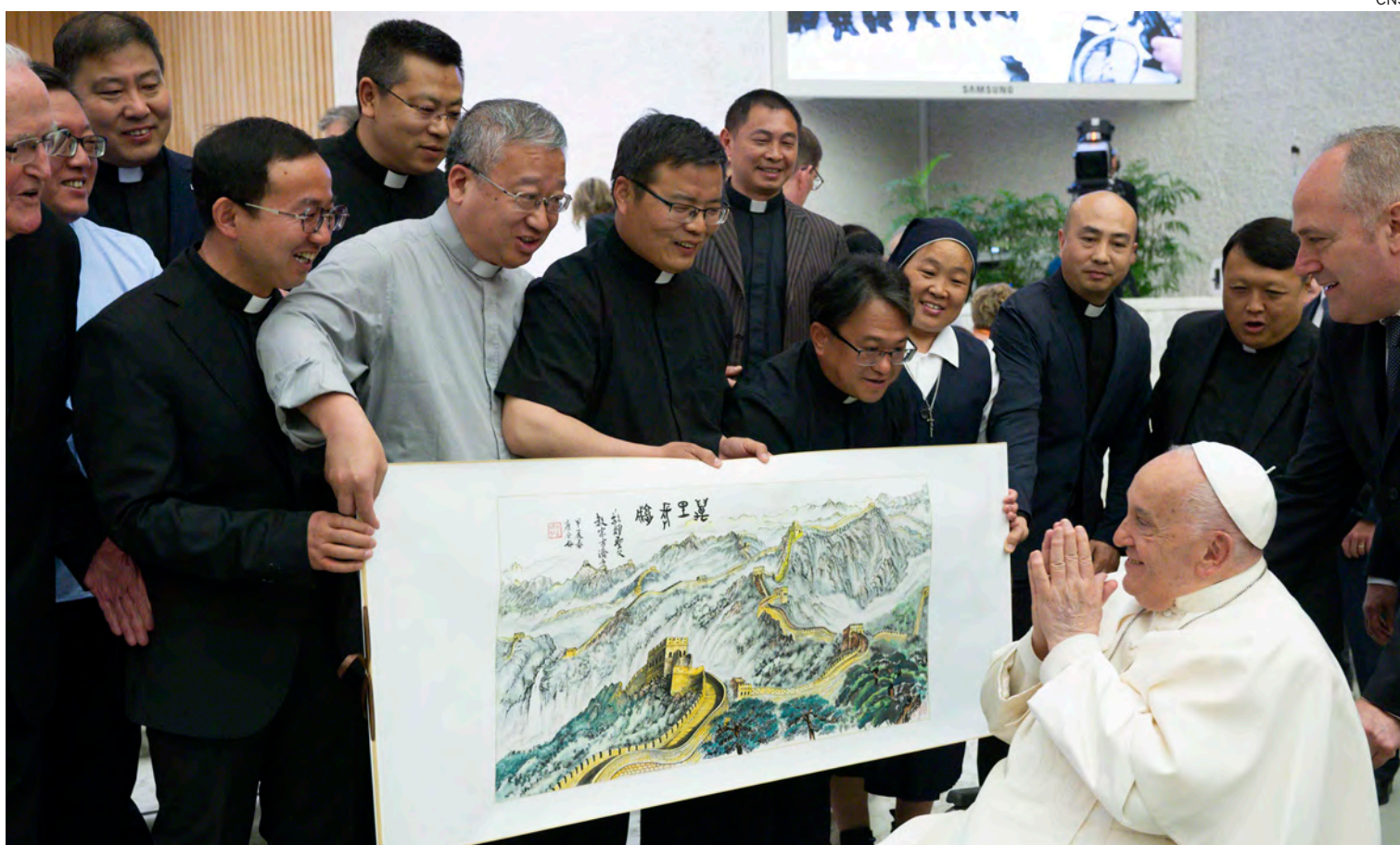
→ El Papa observa una pintura de la Gran Muralla China durante la audiencia general del pasado 1 de mayo.

Creo que el Papa tiene el convencimiento de que el cristianismo nunca ha desposeído a la sociedad china de su propia identidad, sino que siempre la ha enriquecido. Es por eso que no cesará en el empeño de hacer posible que la fe pueda ser predicada en libertad para bien de toda China. Recordemos que no es incompatible profesar la fe en el Resucitado y en su Iglesia y buscar el bien de la propia nación. ●