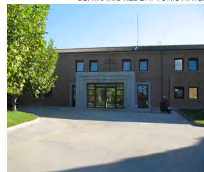
↑ Redemptoris Mater de Madrid.