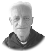
FRAY ÁNGEL MARTÍNEZ CUESTA, OAR Historiador de los agustinos recoletos

El deseo de predicar el Evangelio en China atraviesa la historia de los agustinos recoletos. Sus deseos comenzaron a cobrar cuerpo a principios del siglo XX. Pero no alcanzaron su objetivo hasta el año 1923, cuando la Santa Sede les encomendó un territorio de Henan Oriental y fijó su sede en Shangqiu. Tenía una superficie de 8.500 kilómetros cuadrados y su población superaba los dos millones. Los católicos apenas llegaban a 600.