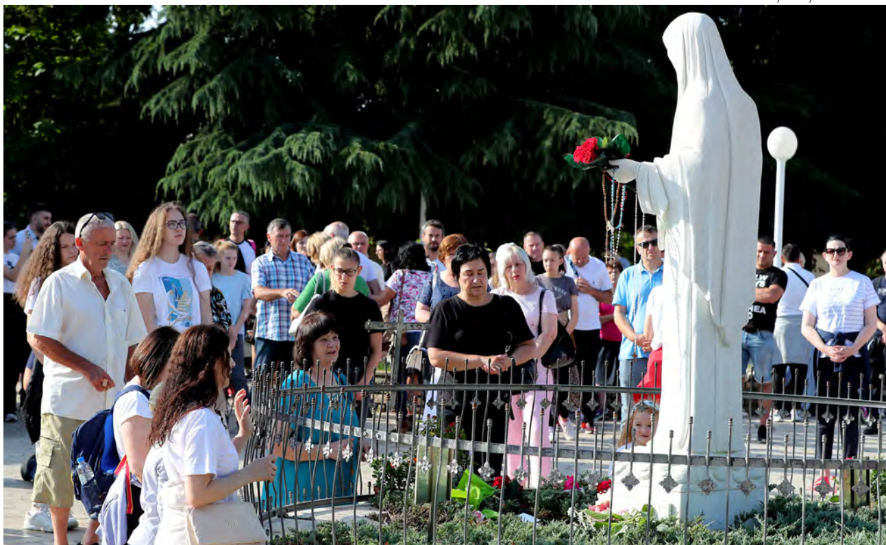
↑ Peregrinos rezan frente a la estatua de la Virgen en Medjugorje.