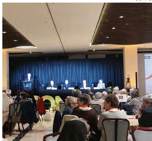
↑ Un momento de la apertura de la asamblea.

po», los superiores de congregaciones han elegido trabajar alrededor de unas mesas, en sintonía con la fórmula elegida para el último Sínodo de los Obispos. Así han abordado los tres temas más reclamados por los religiosos españoles para su encuentro anual: la relación con el mundo de hoy, las experiencias intercongregacionales y la colaboración entre realidades de vida consagrada para la atención de los religiosos mayores.