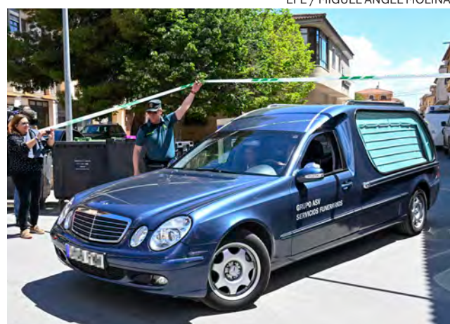
↑ La Guardia Civil en el lugar de los hechos.