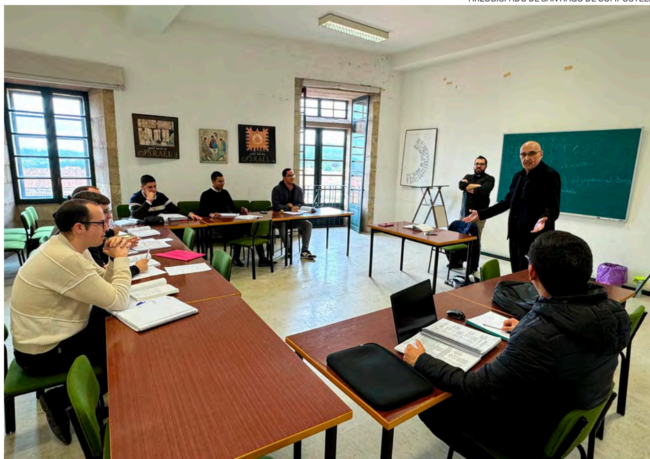
↑ El nuevo rector del seminario interdiocesano en una clase a alumnos de varias diócesis gallegas.