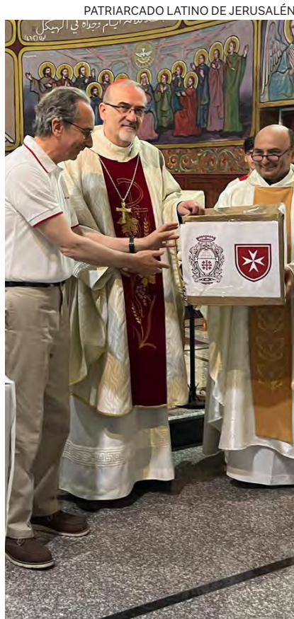
↑ Pizzaballa (centro) en Gaza.

En el norte de la Franja de Gaza, tras casi siete meses de asedio, las familias sacian el hambre con cualquier hierba o semilla comestible que encuentran por el suelo, a menudo con incrustaciones de terreno o restos de plásticos. «La ayuda humanitaria es inexistente. Muchos de los paquetes que lanzan los aviones militares estadounidenses acaban destrozados por el impacto, dispersos por el campo o en manos de los contrabandistas que los revenden a precios