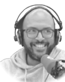
JAVIER GARCÍA AREVALILLO

Richard Gadd podría haber sido un aspirante más a los escenarios británicos del humor satírico, ácido, y tantas veces nada cómico. Pero algo pasó en su vida y hoy es el protagonista de una de las series más vistas del momento en medio mundo. Mi reno de peluche le ha lanzado al estrellato, no tanto por ser su protagonista, sino porque cuenta su propia