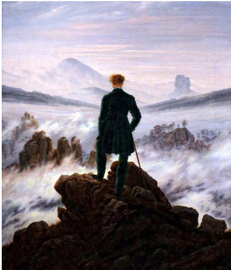
↑ Caminante sobre mar de nubes , de C. D. Friedrich. Kunsthalle (Hamburgo).