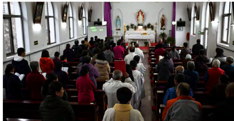
↑ Eucaristía en Pekín.