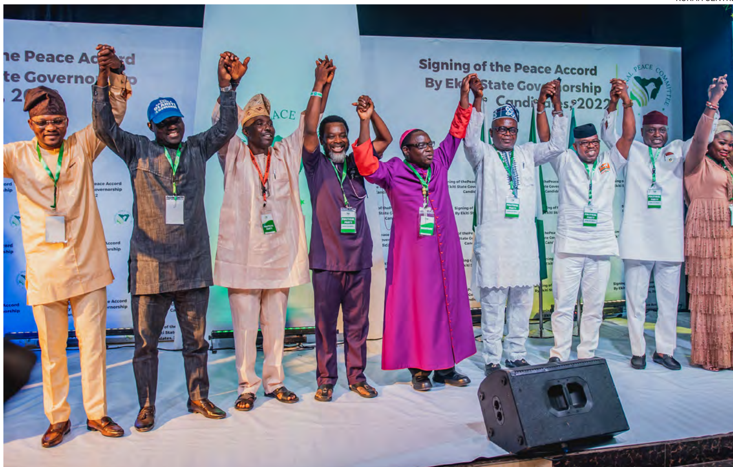
↑ Kukah (centro) durante un acto para celebrar la firma de un acuerdo de paz entre los candidatos a las elecciones a gobernador de Ekiti, en 2022.

Nacido en una familia pobre de Kaduna en 1952, Kukah pronto destacó con sus artículos en prensa. Formado en cuestiones políticas en Reino Unido y la Universidad de Harvard, fue vicesecretario general de la Conferencia Episcopal Nigeriana. Ha participado en comisiones para resolver conflictos ambientales, investigar violaciones de derechos o reformar la ley electoral.