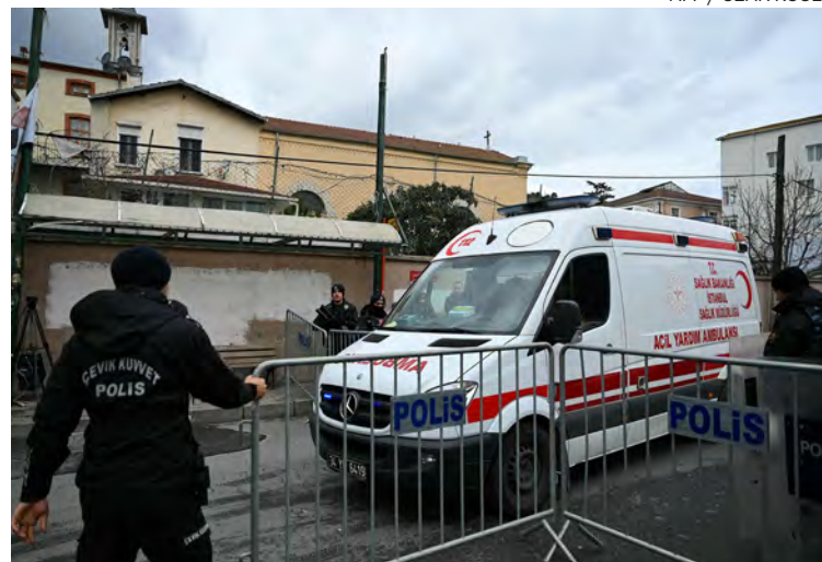
↑ Una ambulancia abandona el perímetro de la iglesia tras el ataque.