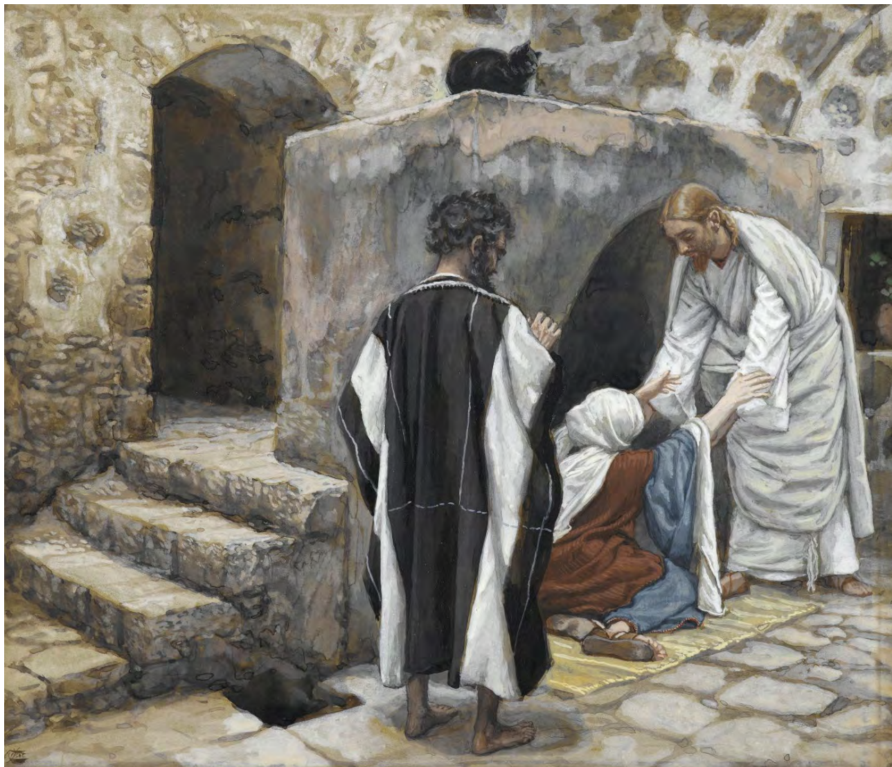
← Curación de la suegra de Pedro de James Tissot. Museo de Brooklyn, Nueva York (Estados Unidos).

chos demonios; y como los demonios lo conocían, no les permitía hablar. Se levantó de madrugada, cuando todavía estaba muy oscuro, se marchó a un lugar solitario y allí se puso a orar. Simón y sus compañeros fueron en su busca y, al encontrarlo, le dijeron: «Todo el mundo te busca». Él les responde: «Vámonos a otra parte, a las aldeas cercanas, para predicar también allí; que para eso he salido». Así recorrió toda Galilea, predicando en sus sinagogas y expulsando los demonios.