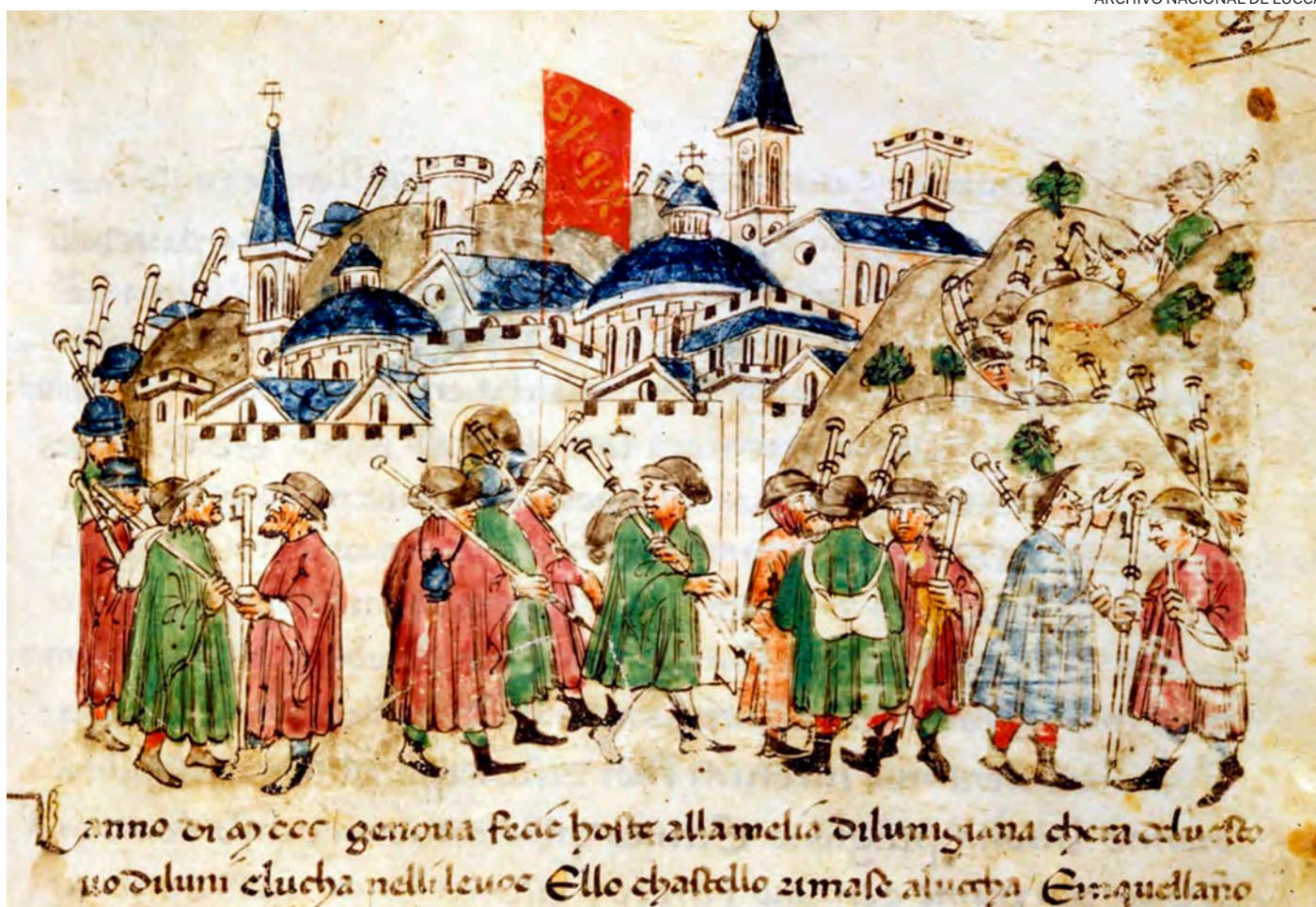
↑ Peregrinos de viaje llegan a Roma. Siglo XIV. Crónicas Sercambi. Archivo Nacional de Lucca (Italia).

Colocación de la primera piedra de la iglesia y hospital de Nostra Dona de Montserrat