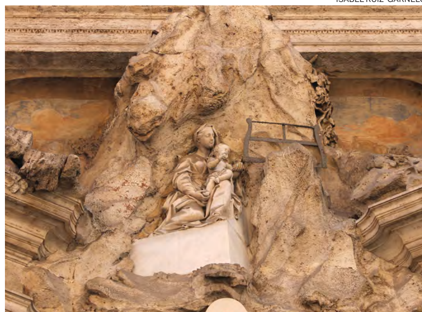
↑ Escultura de la Virgen de Montserrat que ilustra la devoción de la cofradía.