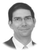
ISIDRO CATELA @isidrocateila

Enhebrar letras, casar números y sacarle brillo a la televisión pública. Ya anunciamos que con el año nuevo, TVE traía nuevas cifras y letras que echarnos a la pantalla. Los mayores recordarán con nostalgia aquel programa que se emitió entre 1991 y 1996, conducido por Elisenda Roca y que luego se reprodujo en algunas cadenas autonómicas. Había lápiz y papel donde ahora hay