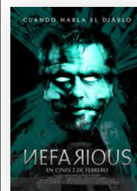
Nefarious Directores: Chuck Konzelman y Cary Solomon País: Estados Unidos Año: 2023 Género: Terror Público: +16 años

En definitiva, estamos ante una película muy sugerente, pero que el católico debe asumir con una mirada crítica y muy reflexiva. De hecho, da la impresión de que lo que encarna Martin está más alejado de Dios que el propio Nefarious . Pero saquen sus propias conclusiones. ●