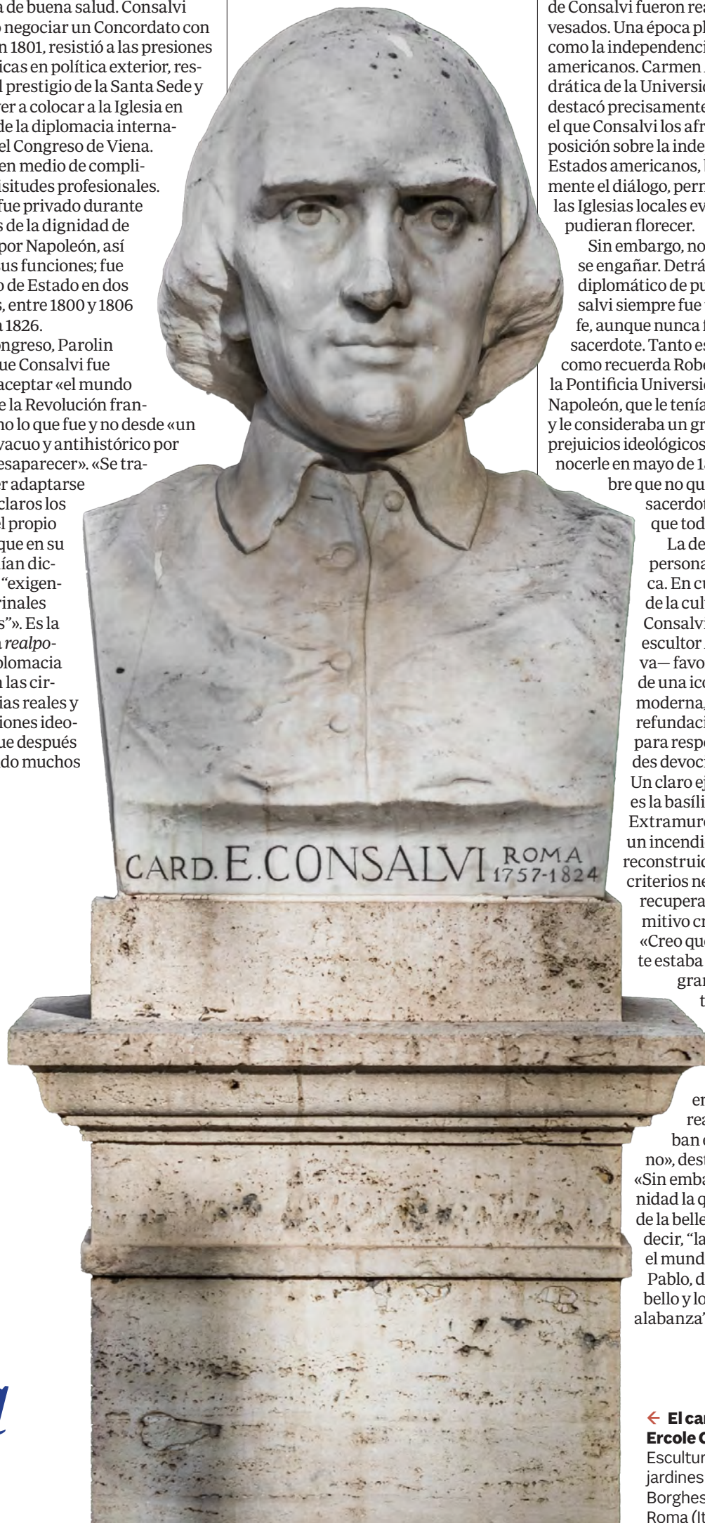
← El cardenal Ercole Consalvi. Escultura en los jardines de Villa Borghese, en Roma (Italia).